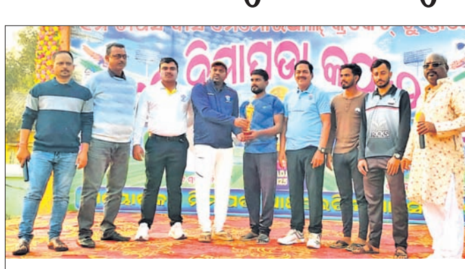
ଅତିଥିମାନେ ମ୍ୟାଚ୍ ଅଫ୍ ଦ ମ୍ୟାଚ୍ ଖେଳାଳିଙ୍କୁ ଟ୍ରଫି ପ୍ରଦାନ କରୁଛନ୍ତି।