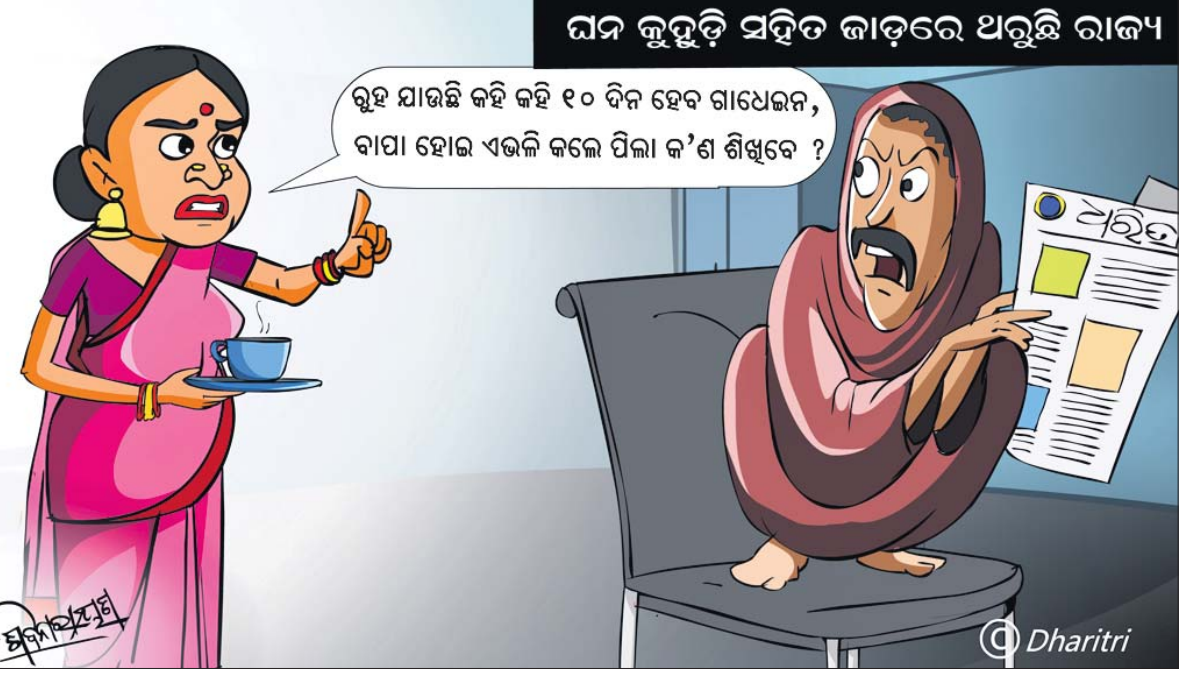
ଘନ କୁହୁଡ଼ି ସହିତ ଜାଡ଼ରେ ଥରୁଛି ରାଜ୍ୟ