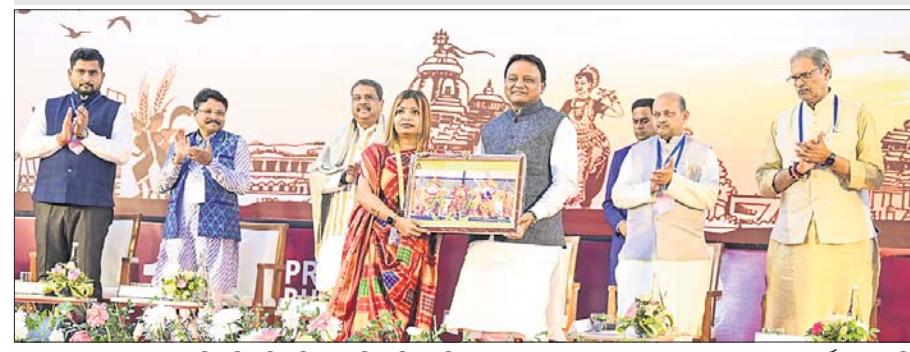
ଭଂଲଞ୍ଜରେ ଶ୍ରୀକରନାଥ ମନ୍ଦିର ତିଆରି କରିଥିବା ଓଡ଼ିଆ ଓଡ଼ିଆ ଭାଜଂସଂସ୍କୃତ ପୁଞ୍ଜ୍ୟମନ୍ତ୍ରୀ ମୋହନ ଚରଣ ମାଝୀ ସମ୍ବନ୍ଧିତ କରୁଛନ୍ତି।

ହୋଇପାରିଛନ୍ତି। ଆମ ସଂସ୍କୃତି ଓ ପରମ୍ପରା ପ୍ରଚାର ପ୍ରସାର କରୁଛନ୍ତି। ବିଦେଶରେ ରହି ମଧ୍ୟ ଓଡ଼ିଶାର ବିକାଶ ଓ ଅର୍ଥନୀତିରୁ ସୁରକ୍ଷା ଦେବା ବଦଳରେ ଚାଲି ଦେବା ପଦ୍ଧତିକୁ ଆପଣାଇବା ପାଇଁ ଧର୍ମେନ୍ଦ୍ର ଆଜି ଓଡ଼ିଶାରେ ପ୍ରବାସୀ ଭାରତୀୟ ଦିବସ ଆୟୋଜନ ଆନୁଷ୍ଠାନିକ ଭାବେ ନୂଆ ଓଡ଼ିଶା, ସମୃଦ୍ଧ ଓଡ଼ିଶା ଗଠନ ପାଇଁ ସଂକଳ୍ପର ଅବସର ଆଣିଦେଇଛନ୍ତି। ଏହି ସମ୍ମିଳନୀ ମାଧ୍ୟମରେ ଓଡ଼ିଶାର ବିକାଶ ପାଇଁ ଉପକ୍ରମ ଲଞ୍ଜିତ୍ ସହ ତୃତୀୟ ଲଞ୍ଜିତ୍ ଭାବେ ପ୍ରବାସୀ ଲଞ୍ଜିତ୍ ଯୋଡ଼ି ହୋଇଛି ବୋଲି ପୁଞ୍ଜ୍ୟମନ୍ତ୍ରୀ କହିଛନ୍ତି। କାର୍ଯ୍ୟକ୍ରମରେ ଯୋଗ ଦେଇ କିମ୍ପାମନ୍ତ୍ରୀ ଧର୍ମେନ୍ଦ୍ର ପ୍ରଧାନ କହିଛନ୍ତି, ଆମ ଦେଶର ସବୁଠାରୁ ବଡ଼ ସମ୍ପତ୍ତି ହେଉଛି ଆମ ବୈଦିକ ମାନବ ସମ୍ପଦ।