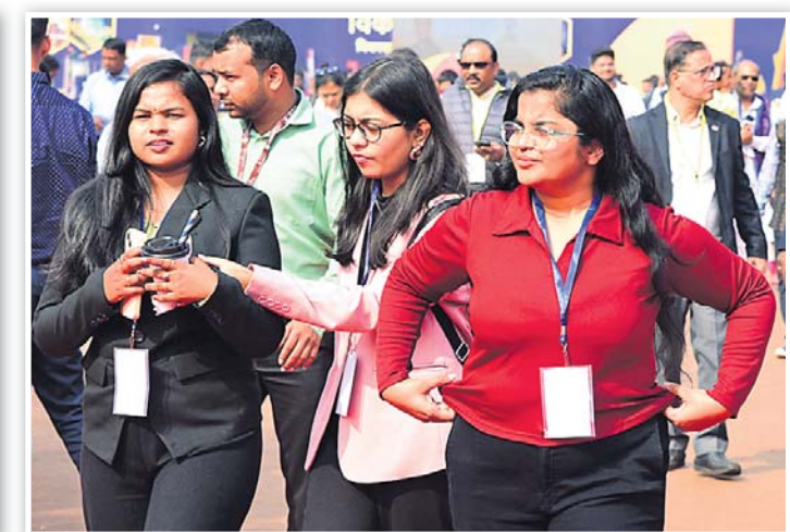
ସବୁର ବାବଦ ଅଭୟ ସପୋରିଙ୍କ ବିଶେଷ କାର୍ଯ୍ୟକ୍ରମ।