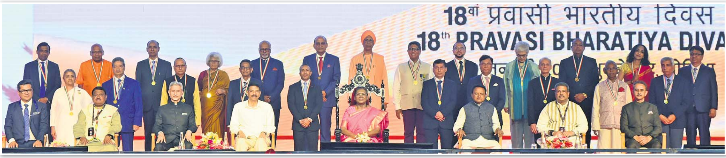
ପ୍ରବାସୀ ଭାରତୀୟ ଦିବସ ଉଦ୍‌ଘାଟନା ଅବସରରେ ପ୍ରବାସୀ ସମ୍ମାନରେ ସମ୍ବିଚ୍ଚିତ ବ୍ୟକ୍ତିଗଣଙ୍କ ସହ ରାଷ୍ଟ୍ରପତି ଡ୍ରୌପଦୀ ମୁର୍ମୁ, ରାଜ୍ୟପାଳ ହରିବାବୁ କନ୍ନମପତି, ମୁଖ୍ୟମନ୍ତ୍ରୀ ମୋହନ ଚରଣ ମାଝୀ, କେନ୍ଦ୍ରମନ୍ତ୍ରୀ ଏସ୍. ଜୟଶଙ୍କର, ଜୁଏଲ୍ ଓରାମ ଓ ଧର୍ମେନ୍ଦ୍ର ପ୍ରଧାନ ଏବଂ ଅନ୍ୟ ଅତିଥିଗଣ।

ଭୁବନେଶ୍ୱର ଜନତା ମଇଦାନଠାରେ ଆରମ୍ଭ ହୋଇଥିବା ଅଷ୍ଟାଦଶ ପ୍ରବାସୀ ଭାରତୀୟ ସମ୍ମେଳନର ଶୁକ୍ରବାର ଥିଲା ଉଦ୍‌ଘାଟନା ଦିବସ। ରାଷ୍ଟ୍ରପତି ଡ୍ରୌପଦୀ ମୁର୍ମୁ ଉଦ୍‌ଘାଟନା ସମାରୋହର ମୁଖ୍ୟ ଅତିଥି ସାଜିଥିଲେ। ଏହି ଅବସରରେ ଭୁବନେଶ୍ୱର ସମେତ ରାଜ୍ୟର ବିଭିନ୍ନ ସ୍ଥାନରେ ଅନେକ ଆକର୍ଷଣୀୟ କାର୍ଯ୍ୟକ୍ରମର ଆୟୋଜନ କରାଯାଇଛି। ଏଥିସହ ପ୍ରବାସୀମାନେ ଓଡ଼ିଶାର ଐତିହ୍ୟ, କଳା ସଂସ୍କୃତିର ଝଲକ ଦେଖିବାକୁ ପାଇଛନ୍ତି।