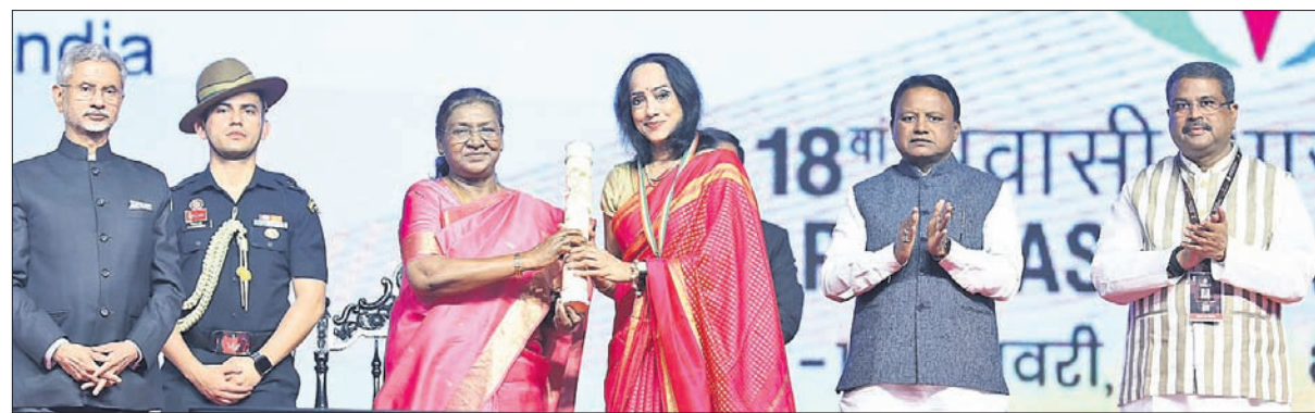
ଜଣେ ପ୍ରବାସୀ ଭାରତୀୟଙ୍କୁ ସମ୍ମାନିତ କରୁଥିବା ରାଷ୍ଟ୍ରପତି ଡ୍ରୌପଦୀ ମୁର୍ମୁ, ନିକଟରେ ଅଛନ୍ତି ମୁଖ୍ୟମନ୍ତ୍ରୀ ମୋହନ ଚରଣ ମାଝୀ, ବହିର୍ବ୍ୟାପାର ମନ୍ତ୍ରୀ ଏସ୍. ଜୟଶଙ୍କର, କେନ୍ଦ୍ର ଶିକ୍ଷାମନ୍ତ୍ରୀ ଧର୍ମେନ୍ଦ୍ର ପ୍ରଧାନ।

ଭୁବନେଶ୍ୱରରେ ୩ ଦିନ ଧରି ଚାଲିଥିବା ପ୍ରବାସୀ ଭାରତୀୟ ସମ୍ମିଳନୀ ଶୁକ୍ରବାର ଉଦ୍‌ଘାଟିତ ହୋଇଛି। ଶେଷ ଦିନରେ ରାଷ୍ଟ୍ରପତି ଡ୍ରୌପଦୀ ମୁର୍ମୁ ପ୍ରବାସୀମାନଙ୍କୁ ସମ୍ବୋଧିତ କରି କହିଛନ୍ତି, ୨୦୪୭ରେ ଭାରତକୁ ବିକଶିତ କରିବା ଲକ୍ଷ୍ୟ ରହିଥିବାରୁ ସେମାନେ ଏହି ବିକାଶଧାରାରେ ସହଯୋଗୀ ପାଲଟନ୍ତୁ। ବହିର୍ବ୍ୟାପାର ମନ୍ତ୍ରୀ ଶାନ୍ତନୁ ଚାଟ୍ଟୋପାଧ୍ୟାୟ ଓ ରାଜ୍ୟ ସରକାରଙ୍କ ମିଳିତ ଆନୁକୁଲ୍ୟରେ ଅନୁଷ୍ଠିତ ଭବ୍ୟ ସମାରୋହରେ ୨୭ ପ୍ରବାସୀଙ୍କୁ ସମ୍ମାନିତ କରାଯାଇଛି। ଏହି ଅବସରରେ ମୁଖ୍ୟମନ୍ତ୍ରୀ ମୋହନ ଚରଣ ମାଝୀ ୭୦ ଦେଶରୁ ଆସିଥିବା ପ୍ରବାସୀ ଭାରତୀୟଙ୍କୁ ଧନ୍ୟବାଦ ଦେବା ସହ ସମ୍ମିଳନୀ ଆୟୋଜନ ଦ୍ୱାରା ଓଡ଼ିଆ ଅସ୍ପିରା ଉଚ୍ଚତର ହୋଇପାରିଥିବା କହିଛନ୍ତି।