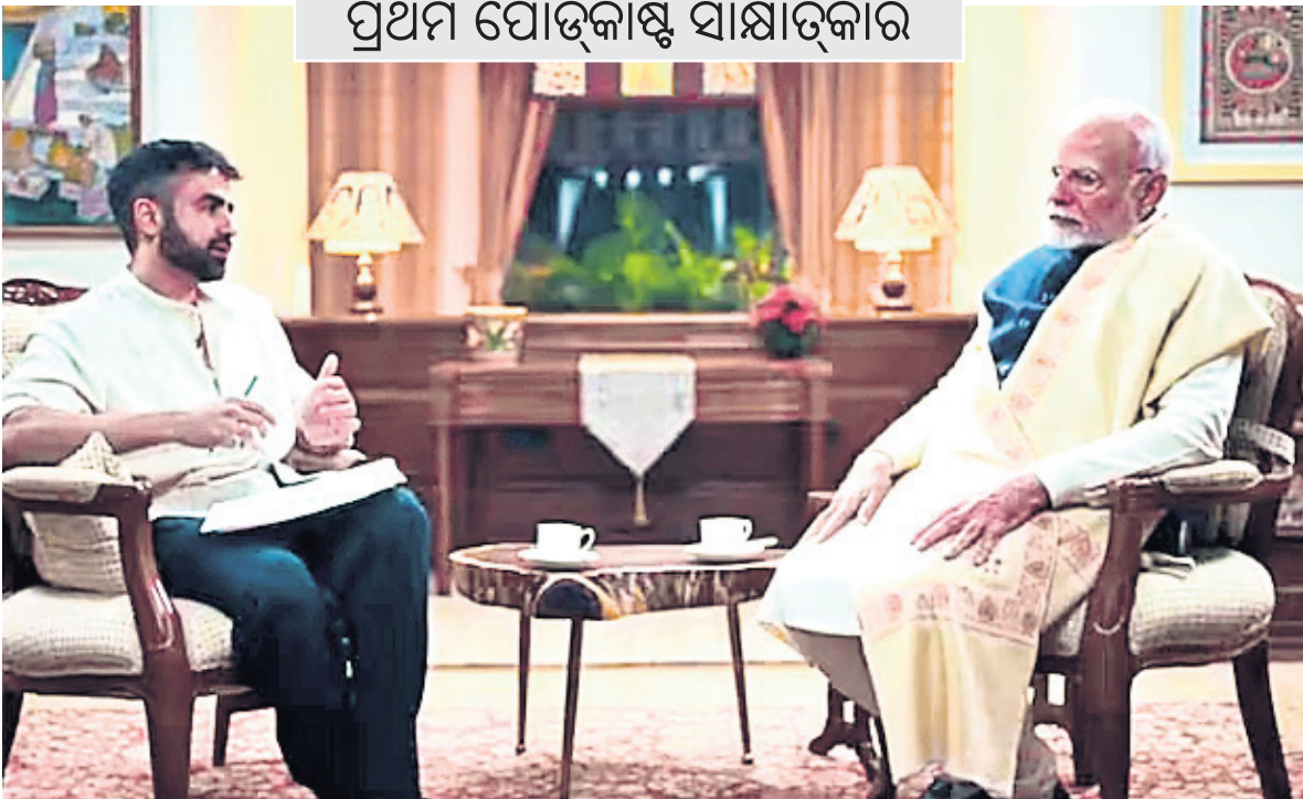
ପ୍ରଧାନମନ୍ତ୍ରୀ ନରେନ୍ଦ୍ର ମୋଦିଙ୍କ ଏକ ସାକ୍ଷାତକାର ନେଉଛନ୍ତି ଜିରୋଧା ସହପ୍ରତିଷ୍ଠାତା ନିଖୁଲ କାମାଥ।

ନୂଆଦିଲ୍ଲୀ, ୧୦।୧ ପ୍ରଧାନମନ୍ତ୍ରୀ ନରେନ୍ଦ୍ର ମୋଦି ପ୍ରଥମ ଥର ପାଇଁ ପୋଡ଼କାଷ୍ଠ କରିଆରେ ନିଜ ଜୀବନୀ ଓ ରାଜନୀତି ସମ୍ପର୍କରେ କେତେକ ଗୁରୁତ୍ୱପୂର୍ଣ୍ଣ ସୂଚନା ଦେଇଛନ୍ତି। ଜିରୋଧା ସହପ୍ରତିଷ୍ଠାତା ନିଖୁଲ କାମାଥଙ୍କ ପୋଡ଼କାଷ୍ଠ ସିରିଜ୍ 'ପିପୁଲ୍ ବାଏ ଡିଲୁଟିଏଟ୍'ରେ ଜଣେ ଅତିଥି ଭାବେ ଉପସ୍ଥିତ ହୋଇ ମୋଦି ତାଙ୍କ ଜୀବନୀ, ଶିକ୍ଷା, ରାଜନୈତିକ ପ୍ରତିବନ୍ଧିତା, ମୁଖ୍ୟମନ୍ତ୍ରୀତ୍ୱ ସମୟ, ଭାରତର ବୈଷୟିକ ଅଗ୍ରଗତି, ସାମାଜିକ ଗଣମାଧ୍ୟମ, ରାଜନୀତି ଏବଂ ଔଦ୍ୟୋଗୀକରଣ ସହ ସେଗୁଡ଼ିକର ସାଦୃଶ୍ୟ ଆଦି ବିଭିନ୍ନ ପ୍ରସଙ୍ଗରେ ୨ ଘଣ୍ଟା ଧରି ଆଲୋଚନା କରିଥିଲେ। ବ୍ୟକ୍ତିଗତ ଅଭିଳାଷ ରୁହେଁ, ଜନସେବାକୁ ମିଶନ ଭାବେ ଗ୍ରହଣ କରିଥିବା ଲୋକେ ରାଜନୀତିରେ ଯୋଗଦେବା ଗୁରୁତ୍ୱପୂର୍ଣ୍ଣ। ରାଜନୀତିରେ ସଫଳତା ପାଇଁ ଲୋକଙ୍କ ସହ ସାମ୍ବନ୍ଧିତ ରହିବା ଓ ତ୍ୟାଗ କରୁଣା ବୋଲି ପ୍ରଧାନମନ୍ତ୍ରୀ କହିଛନ୍ତି। ଗୁଜରାଟ ମୁଖ୍ୟମନ୍ତ୍ରୀ ଥିବାବେଳେ ନିଜର ଏକ ପୁରୁଣା ବସ୍ତ୍ରବ୍ୟୟ ସମ୍ପର୍କରେ ମୋଦି କହିଛନ୍ତି, ମୁଁ ଜଣେ ମଣିଷ, ଭଗବାନ ନୁହେଁ।