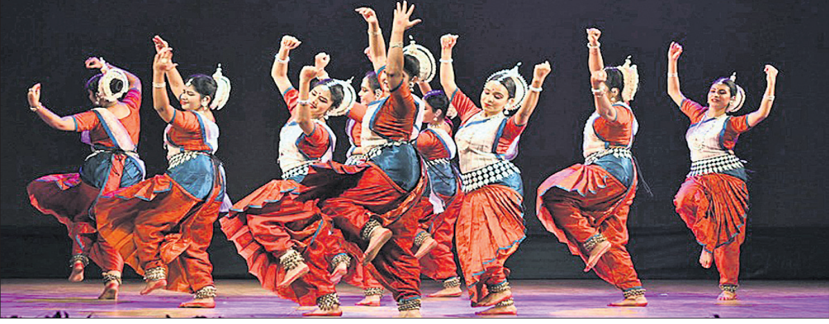
ଭୁବନେଶ୍ୱର ରମାନ୍ତନପଣରେ ଚାଲିଥିବା ଅନ୍ତର୍ଜାତୀୟ ଓଡ଼ିଶୀ ନୃତ୍ୟ ଉତ୍ସବର ଶୁକ୍ରବାର ଚତୁର୍ଥ ସନ୍ଧ୍ୟାରେ ଶିଳ୍ପୀମାନେ ନୃତ୍ୟ ପରିବେଷଣ କରୁଛନ୍ତି।