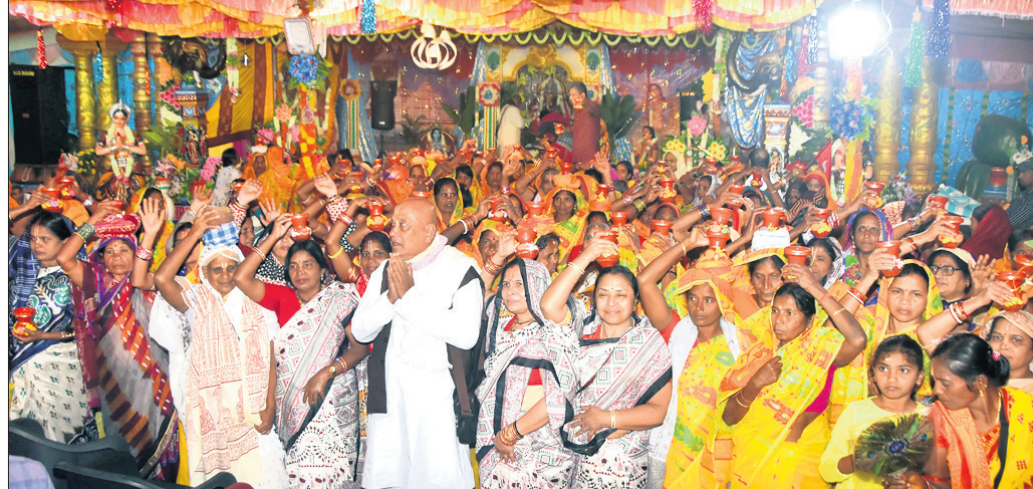
ପୁରୀ ଗୌର ବିହାରର ବୈଷ୍ଣବ ଭକ୍ତମାନେ ଶୁକ୍ରବାର ଅନୁତ ମହୋତ୍ସବ ପାଇଁ କଳ୍ପ ସାଗ୍ରରେ ବାହାରିଛନ୍ତି ।