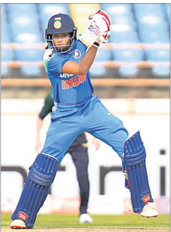
ଫ୍ଲୋୟର ଅଫ୍ ଦି ମ୍ୟାଚ ପ୍ରତିକା ରାଫୁଲ୍।

୪ ରନରୁ ହରାଇ ୨୪୧ ରନ ସଂଗ୍ରହ କରି ନେଇଥିଲା। କ୍ୟାପ୍ଟନ ଶ୍ରେଷ୍ଠ ଲନିସ ପାଇଁ ପ୍ରତିକା ଫ୍ଲୋୟର ଅଫ୍ ଦି ମ୍ୟାଚ ବିବେଚିତ ହୋଇଥିଲେ। ଏହି ବିଜୟ ଫଳରେ ଭାରତ ୩ ମ୍ୟାଚ ବିଶିଷ୍ଟ ସିରିଜରେ ୧-୦ରେ ଅଗ୍ରଣୀଭାବେ ରହିଛି। ଚତୁର୍ଥ ଅର୍ଦ୍ଧରେ ୪ ବ୍ୟାଟର ଫେଲ୍ ମାରିଥିଲେ ମଧ୍ୟ ଲିଫ୍ଟିସଙ୍କ ଦୃଢ଼ ବ୍ୟାଟିଂ ଯୋଗୁ ଆୟର୍ଲାଣ୍ଡ ଏକ ସମ୍ମାନଜନକ ସ୍କୋର କରିବାକୁ ସକ୍ଷମ ହୋଇଥିଲା। ଲିଫ୍ଟିସ ନିଜ ୯୨ ରନ ଲନିସ ମଧ୍ୟରେ ୧୫ ଚୋକା ମାରିଥିଲେ। ଲୋୟର ଅର୍ଦ୍ଧରେ ଲିଆ ପଲ୍