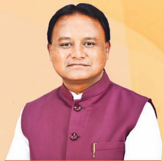
ଶ୍ରୀ ମୋହନ ଚରଣ ମାଝୀ ମୁଖ୍ୟମନ୍ତ୍ରୀ, ଓଡ଼ିଶା