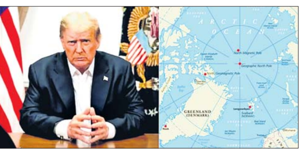
ଟ୍ରମ୍ପ ଗ୍ରୀନଲାଣ୍ଡକୁ କିଣିବା ପାଇଁ ଇଚ୍ଛା ଜାହିର କରିବା ପରେ ଡେନମାର୍କ ପ୍ରଧାନମନ୍ତ୍ରୀ ମେଟ୍ସେ ଫ୍ରେଡ୍ରିକ୍ସେନ୍ ଟ୍ରମ୍ପଙ୍କୁ ସମାଲୋଚନା କରିଥିଲେ।

ଓଶିଂଟନ, ୧୨୧୧ ଆମେରିକାର ନିର୍ବାଚିତ ରାଷ୍ଟ୍ରପତି ଡୋନାଲ୍ଡ ଟ୍ରମ୍ପ ପୁଣିଥରେ ଡେନମାର୍କର ସ୍ୱୟଂଶାସିତ ଅଞ୍ଚଳ ଏବଂ ବିଶ୍ୱର ସବୁଠୁ ବଡ଼ ଦ୍ୱୀପ ଗ୍ରୀନଲାଣ୍ଡକୁ କିଣିବାକୁ ଇଚ୍ଛା କରୁଛନ୍ତି। ୨୦୧୯ରେ ମଧ୍ୟ ସେ ତାଙ୍କ ପ୍ରଥମ କାର୍ଯ୍ୟକାଳ ସମୟରେ ଏହି ପ୍ରସଙ୍ଗ ଉପରେ ବିଚାର କରିଥିଲେ। ତେବେ ସେତେବେଳେ ସେ ଏନେଇ କୌଣସି ପଦକ୍ଷେପ ନେଇ ନ ଥିଲେ। ଆସନ୍ତା ୨୦ରେ ଆମେରିକା ରାଷ୍ଟ୍ରପତି ଭାବେ ଶପଥ ନେବାକୁ ଥିବା