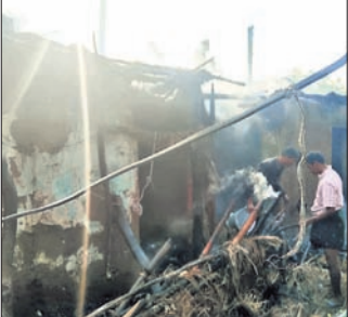
ଆସବାବପତ୍ର ସହିତ ଧାନ, ଚାଉଳ ସହଯୋଗରେ ତୁରନ୍ତ ନିଆଁକୁ ଆୟତ୍ତ କରାଯାଇଥିବାବୁ ପାଖରେ ଥିବା ଅନ୍ୟ ଖବରପାଳ ଅନୁଗୋଳ ଅଗ୍ନିଶମ ବିଭାଗ ପହଞ୍ଚି ନିଆଁକୁ ସମ୍ପୂର୍ଣ୍ଣ ଲିଭାଇଥିଲା। ଏହି ଘଟଣାରେ ୩ ପରିବାରର ସମସ୍ତ

ବରଷା, ୧୨।୧ (ପୁଣିତ ସାହୁ) ଅନୁଗୋଳ ବ୍ଲକ୍ ନନ୍ଦପୁର ପଞ୍ଚାୟତ ମାଧ୍ୟମିକ ମହାରଣା ସାହିରେ ନିଆଁ ଲାଗି ୩ ବର୍ଷରା ଜଳିଯାଇଛି। ରବିବାର ସକାଳ ୭ଟାରେ ମାକ୍‌ଷ୍ଟ ମହାରଣାଙ୍କ ଚାଳ ଛପର ଘରେ ହଠାତ୍ ନିଆଁ ଲାଗି ଯାଇଥିଲା। ଚାହୁଁ ଚାହୁଁ ନିଆଁ ପଡ଼ୋଶୀ ରକ୍ତ ମହାରଣା ଓ ବାମୋଦର ମହାରଣାଙ୍କ ଘରକୁ ବ୍ୟାପୀ ଯାଇଥିଲା। ଗାଁ ଲୋକଙ୍କ ସହଯୋଗରେ ତୁରନ୍ତ ନିଆଁକୁ ଆୟତ୍ତ କରାଯାଇଥିବାବୁ ପାଖରେ ଥିବା ଅନ୍ୟ ଖବରପାଳ ଅନୁଗୋଳ ଅଗ୍ନିଶମ ବିଭାଗ ପହଞ୍ଚି ନିଆଁକୁ ସମ୍ପୂର୍ଣ୍ଣ ଲିଭାଇଥିଲା। ଏହି ଘଟଣାରେ ୩ ପରିବାରର ସମସ୍ତ