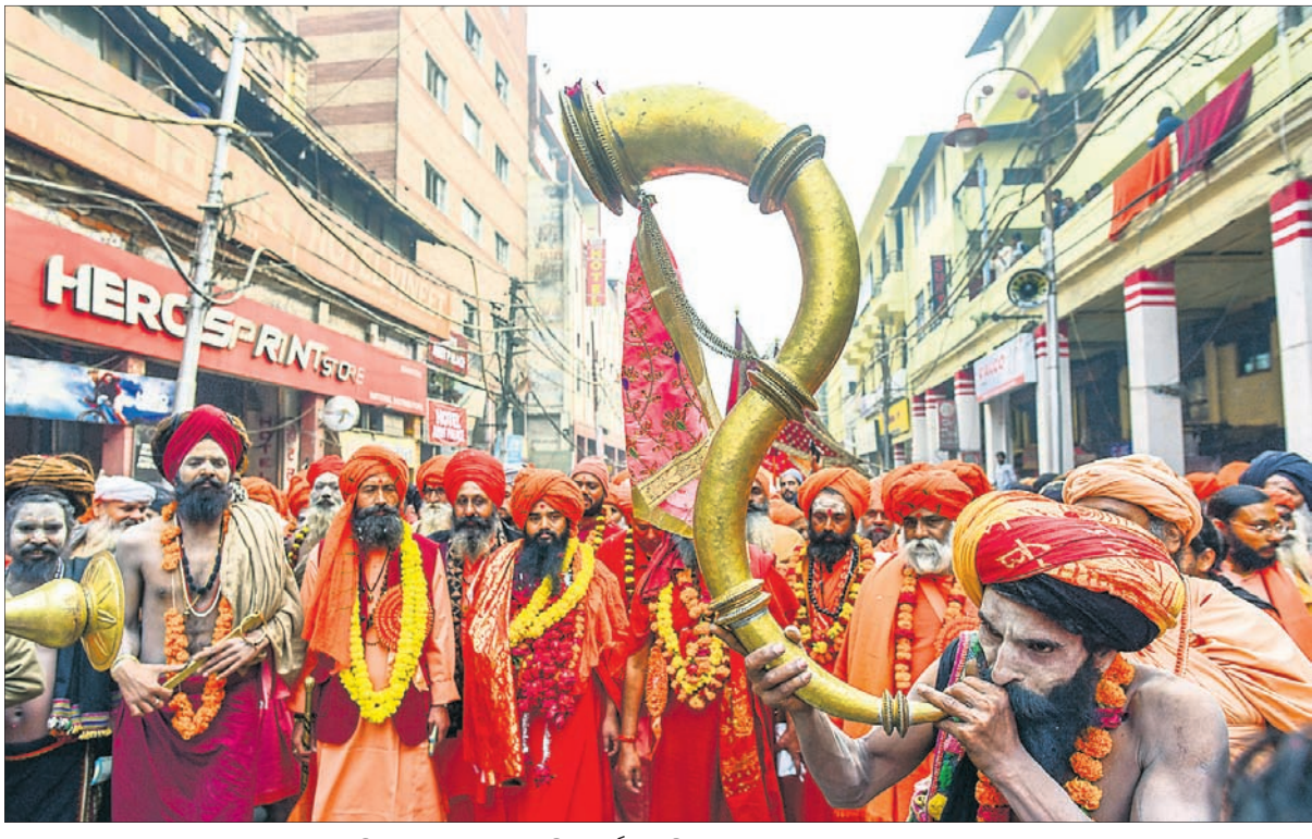
ମହାଧର୍ମ ମେଳାର ଆନୁଷ୍ଠାନିକ ଶୁଭାରମ୍ଭ ଅବ୍ୟବହିତ ପୂର୍ବରୁ ରବିବାର ପ୍ରୟାଗରାଜରେ ସାଧୁସଂଘଙ୍କ ସଙ୍ଗେ ଶୋଭାଯାତ୍ରା।

କେନ୍ଦ୍ରାପଡ଼ା ଜିଲ୍ଲା ଗହୀରମଥା ସାମୁଦ୍ରିକ ଅଭୟାରଣ୍ୟ ଅଞ୍ଚଳରେ ଦିନକୁ ଦିନ ବାହ୍ୟ ମହାଧର୍ମର ବୃଦ୍ଧି ଚାହୁଁଛନ୍ତି। କଟକରୁ ଆସିଥିବା ବାହ୍ୟ ଗ୍ରାମୀଣ ଲୋକଙ୍କ ସହଯୋଗରେ ବାହ୍ୟ ଗ୍ରାମୀଣ ମାଲିକମାନେ ବେଧବେଦ ଉପକୃତ୍ୟ ମାଡ଼ିଆସି ବେଆଇନ ଭାବେ ମାଛ ଧରୁଛନ୍ତି। ଉପକୃତ୍ୟ ଧରିବାକୁ ଗାଳିଥିବାବେଳେ ବନ ବିଭାଗ ଟିମ୍ ସେମାନଙ୍କୁ କାର୍ଯ୍ୟ କରିବାକୁ ଦେଖି କରିଥିଲେ ମଧ୍ୟ ଏକ ପ୍ରକାର ବିଫଳ ହୋଇଛି। ମହାଧର୍ମର ସଂରକ୍ଷଣ ଆକ୍ରମଣ କରିବା ସହ ବିଭାଗୀୟ କର୍ମଚାରୀଙ୍କ କବଳରୁ ମହାଧର୍ମର ଉପାସନା ସମ୍ପାଦନା ହୋଇଛି। ଫଳରେ ଜିଲ୍ଲାର ଚଳପ୍ରଭା ନେଇ ପୁଣି ପ୍ରଶ୍ନ ଉଠିଛି। ମହାଧର୍ମର ଉପାସନା ସମ୍ପାଦନା ହୋଇଛି। ଫଳରେ ଜିଲ୍ଲାର ଚଳପ୍ରଭା ନେଇ ପୁଣି ପ୍ରଶ୍ନ ଉଠିଛି। କେନ୍ଦ୍ରାପଡ଼ା ଜିଲ୍ଲା ମହାଧର୍ମର ଉପାସନା ସମ୍ପାଦନା ହୋଇଛି। ଫଳରେ ଜିଲ୍ଲାର ଚଳପ୍ରଭା ନେଇ ପୁଣି ପ୍ରଶ୍ନ ଉଠିଛି। କେନ୍ଦ୍ରାପଡ଼ା ଜିଲ୍ଲା ମହାଧର୍ମର ଉପାସନା ସମ୍ପାଦନା ହୋଇଛି। ଫଳରେ ଜିଲ୍ଲାର ଚଳପ୍ରଭା ନେଇ ପୁଣି ପ୍ରଶ୍ନ ଉଠିଛି।