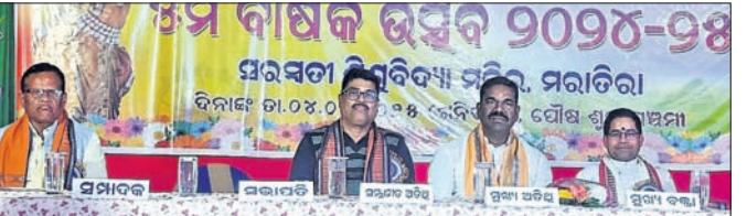
ପ୍ରମୁଖ ସମ୍ପାଦକଙ୍କ ସମ୍ମାନ ଉତ୍ସବରେ ଉଦ୍ଘାଟନା ହେଉଛି।

ଛେଡ଼ିପଦା, ୧୨।୧ (ଅଜିତ ଧଳ) ବର୍ଷା ଋତୁରୁ ମାଟିରୁ ଉତ୍ତୁନି କରିବା ପାଇଁ ଧାନ ଉତ୍ତୁନି ଯାଏନା ଧାନ ଉତ୍ତୁନି ନାହିଁ। ଗତ ୧୦ ତାରିଖରେ ଏହି ଧାନ ମଣ୍ଡଳ ଉଦ୍ଘାଟନ ହୋଇଥିଲା। ସେହିଦିନ ମଣ୍ଡଳ ୯ ଜଣ ଚାଷୀ ପ୍ରାୟ ୪୧୦ କୁଇଣ୍ଟାଲ ଧାନ ଆଣିଥିଲେ। ମାନ ପରୀକ୍ଷା ପରେ ଏଥିରୁ ମାନ ନ ଥିବା ୭ ମାଲିକଙ୍କୁ ଧାନ ଉତ୍ତୁନି ପ୍ରାଧିକୃତ ୨ ମାଲିକଙ୍କୁ କୃଷକମାନେ ସମିତିକୁ ଡାକିବା ପରେ ଆଲୋଚନା ହୋଇଥିଲା। କିନ୍ତୁ ଉଭୟ ପକ୍ଷ ଜିଦରେ ଅଟକି ଥିବାରୁ ଧାନ