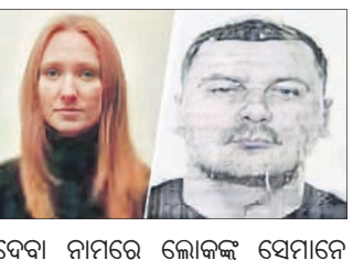
ଦେବା ନାମରେ ଲୋକଙ୍କୁ ସେମାନେ ଠକିଥିଲେ।

ମୁସଲରେ ବହୁକୋଟି ଟିପ୍‌ଫଣ୍ଡ ଦୁର୍ନୀତି ଘଟଣାର ମାଷ୍ଟରମାଇଣ୍ଡ ମଧ୍ୟରେ ୨ ଲକ୍ଷ ଯୁକ୍ତେନୀୟ ରହିଥିବା ତଦନ୍ତରୁ ଜଣାପଡ଼ିଛି। ଟିପ୍‌ଫଣ୍ଡ ସଂସ୍ଥାରେ ଟିପ୍‌ଫଣ୍ଡ ଉପରେ ଅଧିକ ସୁଧ ମିଳିବାର ପ୍ରତିଶ୍ରୁତି ଦେଇ ସେମାନେ ମୁସଲର ଅନେକ ଶହ ଲୋକଙ୍କଠାରୁ ୨୨ କୋଟି ଟିପ୍‌ଫଣ୍ଡ ଗ୍ରହଣ କରିଥିଲେ। ଟିପ୍‌ଫଣ୍ଡର ଟିପ୍‌ଫଣ୍ଡ ଉପରେ ଅଧିକ ସୁଧ ମିଳିବାର ପ୍ରତିଶ୍ରୁତି ଦେଇ ସେମାନେ ମୁସଲର ଅନେକ ଶହ ଲୋକଙ୍କଠାରୁ ୨୨ କୋଟି ଟିପ୍‌ଫଣ୍ଡ ଗ୍ରହଣ କରିଥିଲେ। ଟିପ୍‌ଫଣ୍ଡର ଟିପ୍‌ଫଣ୍ଡ ଉପରେ ଅଧିକ ସୁଧ ମିଳିବାର ପ୍ରତିଶ୍ରୁତି ଦେଇ ସେମାନେ ମୁସଲର ଅନେକ ଶହ ଲୋକଙ୍କଠାରୁ ୨୨ କୋଟି ଟିପ୍‌ଫଣ୍ଡ ଗ୍ରହଣ କରିଥିଲେ। ଟିପ୍‌ଫଣ୍ଡର ଟିପ୍‌ଫଣ୍ଡ ଉପରେ ଅଧିକ ସୁଧ ମିଳିବାର ପ୍ରତିଶ୍ରୁତି ଦେଇ ସେମାନେ ମୁସଲର ଅନେକ ଶହ ଲୋକଙ୍କଠାରୁ ୨୨ କୋଟି ଟିପ୍‌ଫଣ୍ଡ ଗ୍ରହଣ କରିଥିଲେ।