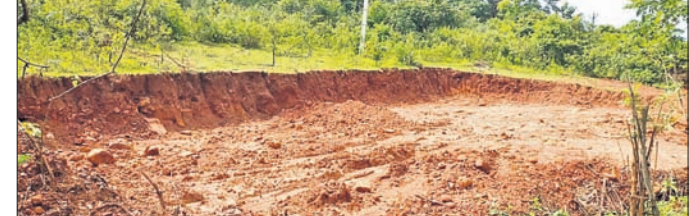
ଅଞ୍ଚଳରେ ଏବେ ବହୁ ରାସ୍ତା ନିର୍ମାଣ ହେଉଥିବାବେଳେ ୫୫ ନମ୍ବର ଜାତୀୟ ରାଜପଥ ସମ୍ପ୍ରଦାରଣ ମଧ୍ୟ ହେଉଛି। ତେଣୁ ମୋରମ ଆବଶ୍ୟକତା ଅଧିକ ଥିବାରୁ ବିନା ଅନୁମତିରେ ପାହାଡ଼ କାଟି ମୋରମ ଚୋରା ଚାଲାଣ କରାଯାଉଛି। କେତେକ ଠିକା ସଂସ୍ଥାର କର୍ମଚାରୀ ବିକଳିତ ରାତିରେ ରାଜ୍ୟ ବିଭାଗର କେତେଜଣ କର୍ମଚାରୀଙ୍କୁ ଜଣାଇବା ପାଇଁ ଦାବି କରାଯାଇଛି। ଏ ସମ୍ପର୍କରେ ରାଜ୍ୟ ବିଭାଗର କେତେଜଣ କର୍ମଚାରୀଙ୍କୁ ଜଣାଇବା ପାଇଁ ଦାବି କରାଯାଇଛି।

ବରଷା, ୧୨।୧ (ପରିକ୍ଷିତ ସାହୁ) ଅନୁଗୋଳ ଜିଲା କିଶୋରନଗର ବ୍ଲକ୍ ହସ୍ତପା ରେଞ୍ଜି ଅଧୀନରେ ଥିବା କଦଳୀପୁଣ୍ଡା, କାମୁନାଳା ଆଦି ଅଞ୍ଚଳର ପାହାଡ଼ଗୁଡ଼ିକୁ ରାତିରେ ବେଆଇନ ଭାବେ କାଟି ମୋରମ ଚୋରା ଚାଲାଣ କରାଯାଉଛି। ଛେଡ଼ିପଦା ବ୍ଲକ୍ ଅଞ୍ଚଳରେ ହେଉଥିବା ଏକ ପ୍ରକଳ୍ପ ପାଇଁ ୩ ଦିନ ମଧ୍ୟରେ ୨ଟି ପାହାଡ଼ କାଟି ୫ ଶହ ଟ୍ରାକ୍ ମୋରମ ଚୋରା ଚାଲାଣ ହୋଇଥିବା କାମୁନାଳା ଅଞ୍ଚଳବାସୀ ବକ୍ଷା ରାଜ୍ୟ କାର୍ଯ୍ୟାଳୟରେ ଅଭିଯୋଗ କରିଛନ୍ତି। ହେଲେ ରାଜ୍ୟ ବିଭାଗ ପକ୍ଷରୁ କୌଣସି ପଦକ୍ଷେପ ନିଆଯାଇ ନ ଥିବାରୁ ଅଞ୍ଚଳବାସୀ ଅନୁଗୋଳ ଜିଲାପାଳଙ୍କୁ ଅଭିଯୋଗପତ୍ର ମାଧ୍ୟମରେ ଅବଗତ କରାଇଛନ୍ତି। ଏହାର ଏକ ନକଲ ରାଜ୍ୟ ମନ୍ତ୍ରାଳୟ ପ୍ରଦାନ କରିଛନ୍ତି। ଅଞ୍ଚଳବାସୀ ଅଭିଯୋଗ କରିଛନ୍ତି, କିଶୋରନଗର ଓ ଛେଡ଼ିପଦା ବ୍ଲକ୍