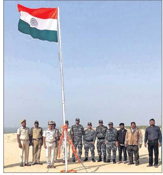
କନିକାବାଲି ଦ୍ୱୀପରେ ଜାତୀୟ ପତାକା ଉତ୍ତୋଳନ କରାଯାଇଛି।

ରାଜବାଲି, ୧୨୧୧ (ଅଶୋକ ପ୍ରସାଦ) ଭଦ୍ରକ ଜିଲ୍ଲାର ଧାମରା ପୁରାଣରେ ଅବହେଳିତ ହୋଇପଡ଼ିଥିବା କନିକାବାଲି ଦ୍ୱୀପରେ ଶନିବାର ଜାତୀୟ ପତାକା ଉତ୍ତୋଳନ ହୋଇଛି। କେନ୍ଦ୍ର ଓ ରାଜ୍ୟ ସରକାରଙ୍କ ମିଳିତ ପ୍ରୟାସରେ ଗଣତନ୍ତ୍ର ଦିବସର ଅବ୍ୟବହୃତ ପୂର୍ବରୁ ଭାରତୀୟ ନେତ୍ର, ରାଜ୍ୟ ସରକାରଙ୍କ ମେରାଜନ ପୋଲିସ ଓ ମଧ୍ୟ ବିଭାଗର ସାଗରମିତ୍ରଙ୍କ ସହଯୋଗରେ ଏଠାରେ ପତାକା ଉତ୍ତୋଳନ କରାଯାଇଛି। ଧାମରା ପୁରାଣ ନିକଟରେ ବଙ୍ଗୋପସାଗର ମଧ୍ୟରେ ଏହିପରି କେତେକ ଦ୍ୱୀପ ତଥା ସ୍ଥାନୀୟ ଭାଷାରେ ଚକ୍ରା ଅବହେଳିତ ଅବସ୍ଥାରେ ଥିବାର ଖବର କେନ୍ଦ୍ର ଗୃହ ବିଭାଗ ପାଖରେ ପହଞ୍ଚିଛି। ଗୃହ ବିଭାଗ ନିର୍ଦ୍ଦେଶରେ ଉପକୂଳ ଅଞ୍ଚଳରେ ଥିବା ସମସ୍ତ ଦ୍ୱୀପକୁ ଏହି ଅଧିକାରୀମାନେ ଯାଇ ତଥ୍ୟ ସଂଗ୍ରହ କରିବା ସହ ସରକାରଙ୍କୁ ଅବଗତ କରାଇବେ। ଏହି ସମସ୍ତ ଦ୍ୱୀପକୁ ସରକାର ନିଜ ହେପାଜତକୁ ଆଣିବା ସହ ଆଗାମୀ ଦିନରେ କିପରି ଏହି ଦ୍ୱୀପକୁ ଲୋକାଭିଯୁକ୍ତ ହୋଇପାରିବ ସେନେଇ କେନ୍ଦ୍ର ସରକାର ବହୁ ଯୋଜନା ହାତକୁ ନେଉଛନ୍ତି। ଏହାକୁ ଦୃଷ୍ଟିରେ ରଖି ଭାରତୀୟ ନେତ୍ର କେତେକ ଅଧିକାରୀ ଧାମରା ମେରାଜନ ଧାନାଧିକାରୀଙ୍କ ସହ ଯୋଗାଯୋଗ କରି ଏକ ଛିଦ୍ର ବୋର୍ଡରେ ଆସି ଏଠାରେ ପହଞ୍ଚିଥିଲେ। ପ୍ରଧାନମନ୍ତ୍ରୀ ଓ ପୂର୍ଣ୍ଣମନ୍ତ୍ରୀଙ୍କ ପଠାବଳିରେ ଥିବା ସାଧନବୋର୍ଡ ଲଗାଇବା