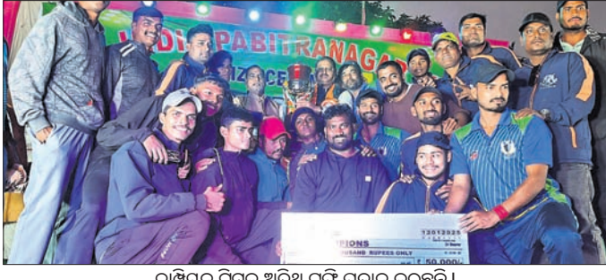
ଚାମ୍ପିୟନ ଚିମ୍ପୁ ଅତିଥି ରୂପେ ପ୍ରଦାନ କରୁଛନ୍ତି।

ପରିତ୍ରନଗର, ୧୨।୧ (ନିରୋଜ ପ୍ରଧାନ) କଳିଙ୍ଗ ଚଳଚ୍ଚିତ୍ର ନଗର ମିଳିତ ସ୍ୱାଭିଯୋଗରେ ଆୟୋଜିତ ସର୍ବଭାରତୀୟ ପରିତ୍ରନଗର କର୍ମ କ୍ରମେ ଚୁନିତ ଚାମ୍ପିୟନ ଉଦ୍ଘାଟିତ ହୋଇଯାଇଛି। ଏଥିରେ ତାଳଚେରର ଯୁବକମାନେ ଚାମ୍ପିୟନ ହୋଇଥିବା ବେଳେ ବାଙ୍ଗାଲୋର ଚିମ୍ପୁ ଚାମ୍ପିୟନ ହୋଇଥିବା ବେଳେ ବାଙ୍ଗାଲୋର ଚିମ୍ପୁ ପ୍ରଥମ ସ୍ଥାନରେ ଚିମ୍ପୁ ଚାମ୍ପିୟନ ହୋଇଥିବା ବେଳେ ତାଳଚେର ଚିମ୍ପୁ ଆବଶ୍ୟକ ରତ୍ନ