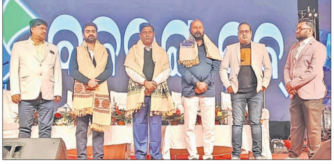
ବକରଙ୍ଗ କୁବର ଆଶ୍ୱେୟ-୨୦୨୫ ଉଦ୍‌ଯାପନ ମଞ୍ଚରେ ଅତିଥିମାନେ।

ଆଶ୍ୱେୟ-୨୦୨୫ ଉଦ୍‌ଯାପିତ ଡେକାନାଲ, ୧୨।୧ (ଉତ୍ତମ ନାୟାର)