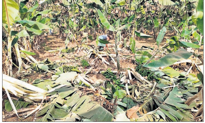
ହାତୀପଲ ନଷ୍ଟ କରିଥିବା କଦଳୀ ଫସଲ।