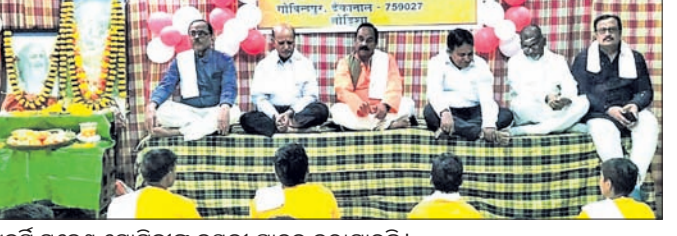
ମହର୍ଷି ମହେଶ ଯୋଗିଜୀଙ୍କ ଜୟନ୍ତୀ ପାଳନ କରାଯାଇଛି।

ଡେକାନାଲ, ୧୨।୧ (ଉତ୍ତମ ନାୟାର) ଡେକାନାଲ ଗୋବିନ୍ଦପୁରସ୍ଥିତ ମହର୍ଷି ବେଦ ବିଜ୍ଞାନ ବିଦ୍ୟାଳୟ ପ୍ରାଙ୍ଗଣରେ ପରମପୂଜ୍ୟ ମହର୍ଷି ମହେଶ ଯୋଗିଜୀଙ୍କ ଜୟନ୍ତୀ ପାଳିତ ହୋଇଯାଇଛି। ମାନ୍ୟଗଣ୍ୟ ବ୍ୟକ୍ତି, ବିଦ୍ୟାଳୟର ପୁରାତନ ଛାତ୍ରକୁଳ ଏବଂ ଅଧ୍ୟକ୍ଷମଣ୍ଡଳ ଛାତ୍ର ଓ କର୍ମଚାରୀମାନେ ଏହି ଜୟନ୍ତୀ ପାଳନ କରିଛନ୍ତି। ସକାଳେ ଗୁରୁ ପୂଜନ ସହ ଯୋଗାସନ, ଭାବନିତ ଧ୍ୟାନ, ସିଦ୍ଧି ଓ ରତ୍ନାଭିଷେକ କାର୍ଯ୍ୟକ୍ରମ ସମ୍ପନ୍ନ କରାଯାଇଥିଲା। ବିଦ୍ୟାଳୟ ପ୍ରଭାତୀ ବ୍ରଜ