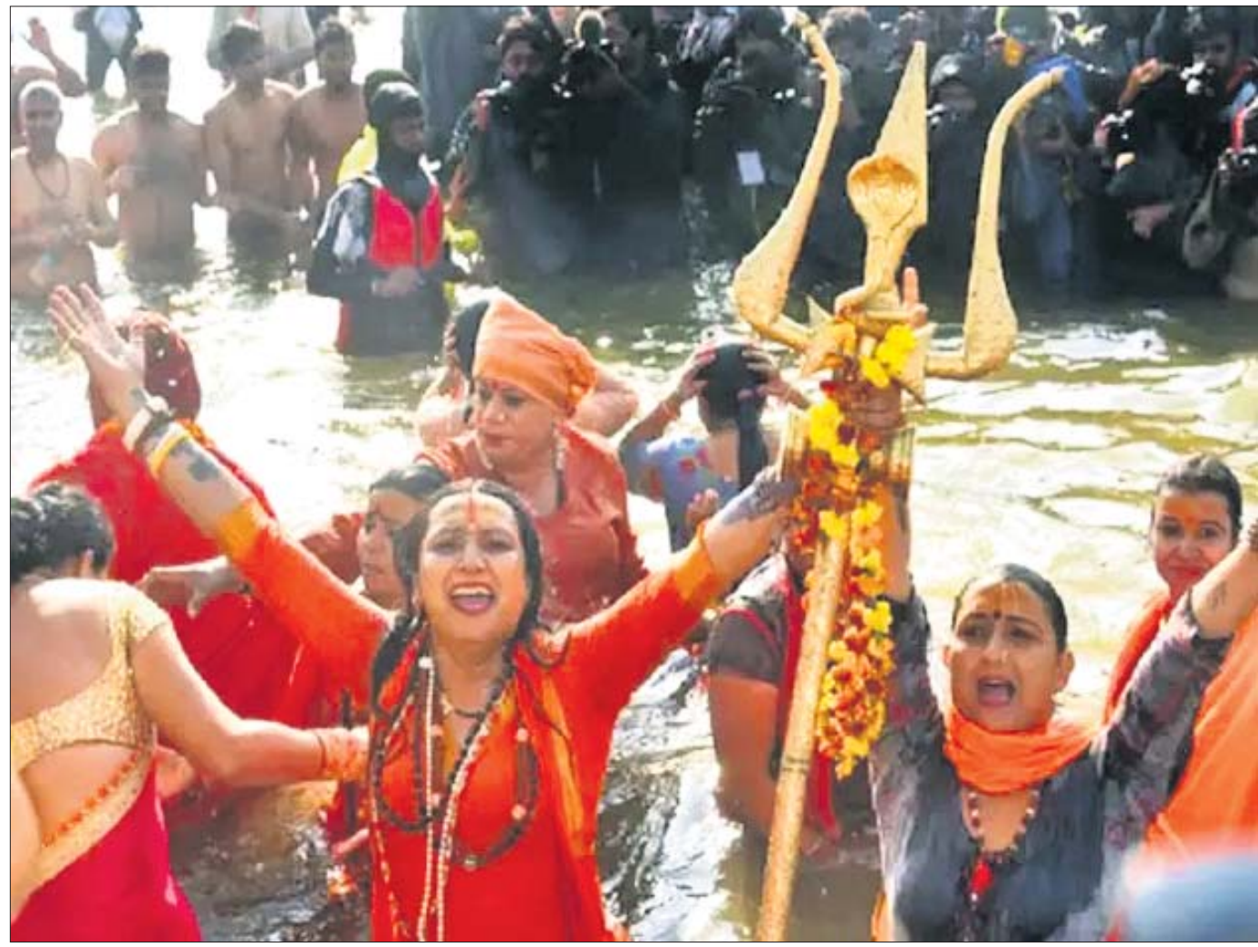
ପୌଷ ପୂର୍ଣ୍ଣିମା ଅବସରରେ ଶ୍ରୀକାଳୀନ ଯୋଗବାର ପ୍ରୟାଗରାଜସ୍ଥିତ ଗଙ୍ଗା, ଯମୁନା ଓ ପୁରାଣବର୍ଣ୍ଣିତ ସରସ୍ୱତୀ ନଦୀର ସଙ୍ଗମସ୍ଥଳରେ ବୁଡ଼ ପକାଇଛନ୍ତି।