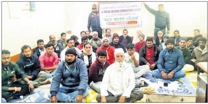
ପ୍ରସ୍ତୁତି ଦେ଼଼କରେ କାର୍ଯ୍ୟକ୍ରମ ଆୟୋଜନ ନେଇ ଆଲୋଚନା କରାଯାଇଛି।