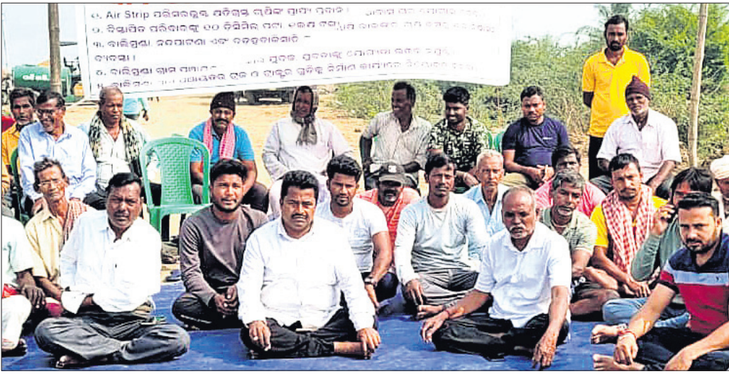
ଶ୍ରମିକ ସଙ୍ଗଠନର କର୍ମକର୍ତ୍ତା ଧାରଣାରେ ବସିଛନ୍ତି।