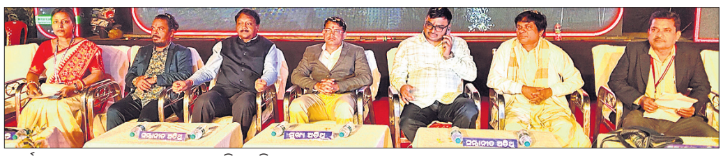
ସୁବର୍ଣ୍ଣ ଜୟନ୍ତୀ ଉତ୍ସାହୀନା ଉତ୍ସବରେ ଉପସ୍ଥିତ ଅତିଥି।