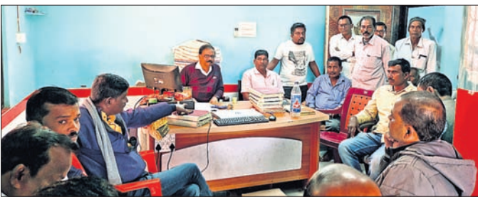
ସମିତିରେ ମିଲର ଓ ଚାଷୀଙ୍କ ମଧ୍ୟରେ ଆଲୋଚନା ଚାଲିଛି।

ପୂର୍ବବର୍ଷ ଭଳି ଧାନ ନେବାକୁ ସମିତିରେ ଡେ଼଼କ ବସିଥିଲା। ଦୀର୍ଘ ସମୟ ପର୍ଯ୍ୟନ୍ତ ଧାନ କର୍ନି ଛବିକୁ ନେଇ ଆଲୋଚନା ହୋଇଥିଲା। ଚାଷୀଙ୍କ ପକ୍ଷରୁ ମିଲର ବେଳେ ଅନ୍ୟାନ୍ୟ ମାନରେ ଅଳ୍ପ ମାତ୍ରାରେ ବ୍ୟତିକ୍ରମ ଦେଖାଯାଇଥିଲା। ଯାହାକୁ ନେଇ ଉପସ୍ଥିତ ବହୁ ଚାଷୀ, ପରିଷଦର ସଦସ୍ୟ ଏବଂ ମିଲ କର୍ମଚାରୀଙ୍କ ଭିତରେ ଏକ ଆପୋଷ ସମାଧାନ କରାଯାଇ