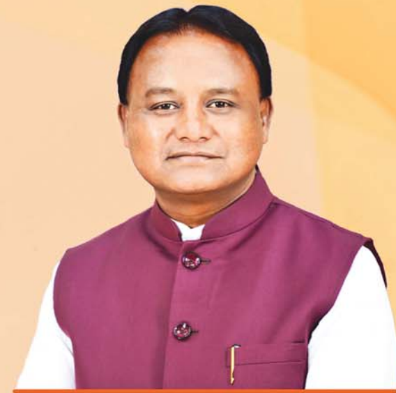
ଶ୍ରୀ ମୋହନ ଚରଣ ମାଝୀ ମୁଖ୍ୟମନ୍ତ୍ରୀ, ଓଡ଼ିଶା