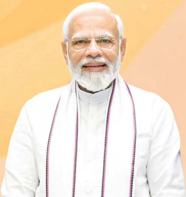
ଶ୍ରୀ ନରେନ୍ଦ୍ର ମୋଦୀ ପ୍ରଧାନମନ୍ତ୍ରୀ