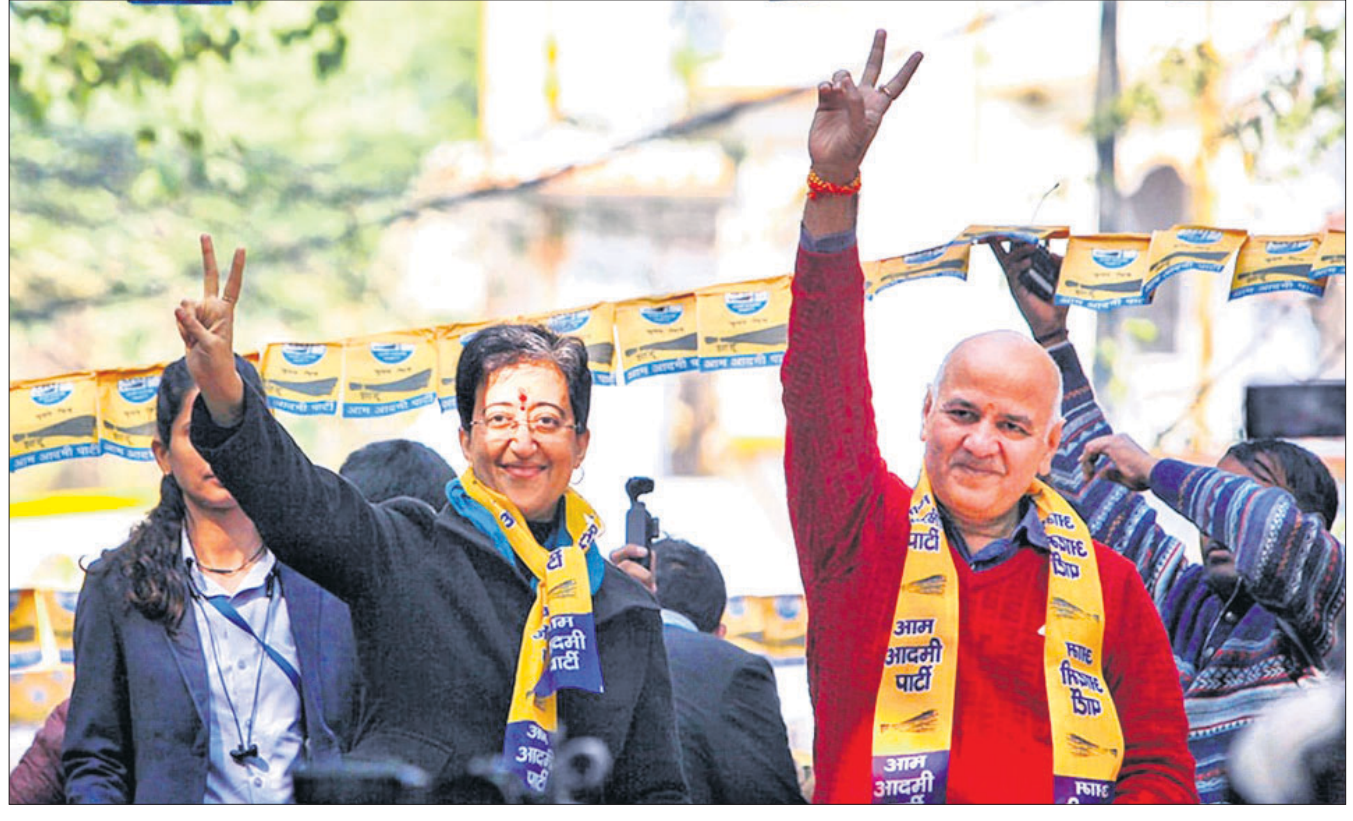
ଆପ୍ ନେତା ମନୀଷ ସିଂହପାଣିଆଳ ସହ ବିଜ୍ଞା ପୁଖ୍ୟମନ୍ତ୍ରୀ ଆଦିଶା ଏକ ରାଲିରେ ସୋମବାର ନାମାମକ ପତ୍ର ଦାଖଲ କରିବାକୁ ଯାଉଛନ୍ତି ।