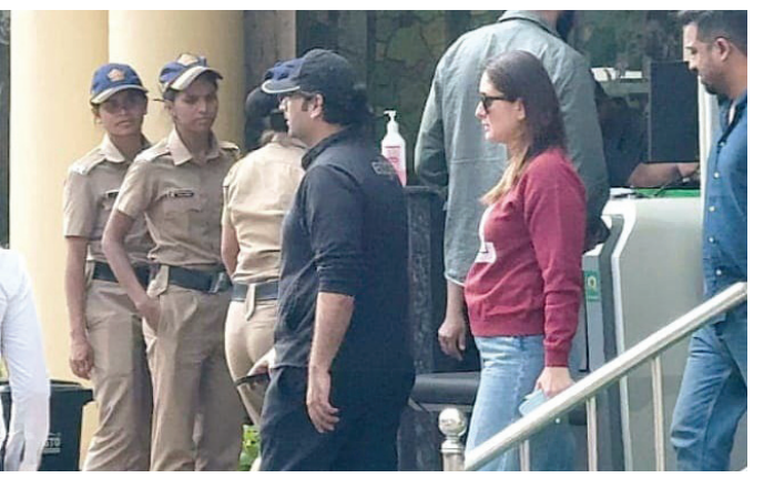
ମୁମ୍ବାଇର ଲାଲବାଟୀ ହସ୍ପିଟାଲରେ ଅଭିନେତାଙ୍କୁ ଭେଟିବା କପୁର। ପ୍ରତି ଏଭଳି ବିପଦ ସୃଷ୍ଟି ହେବା ଅତ୍ୟନ୍ତ ଲଜ୍ଜାଜନକ ବିଷୟ।

ବଲିଉଡ୍ ଅଭିନେତା ସିଏପ୍ ଅଲ୍ଲା ଖାନ୍ଙ୍କୁ ଚାକ୍ ଘରେ ପଶି ଆକ୍ରମଣ କରିଥିବା ପରେ ରାଜନୀତି ଟେଲିଭାରେ ଲାଗିଛି।