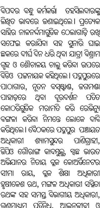
ବିପଦର ବନ୍ଧୁ କର୍ମକର୍ତ୍ତା ତହସିଲଦାରଙ୍କୁ ଲିଖିତ ଭାବରେ ଜଣାଇଥିଲେ।