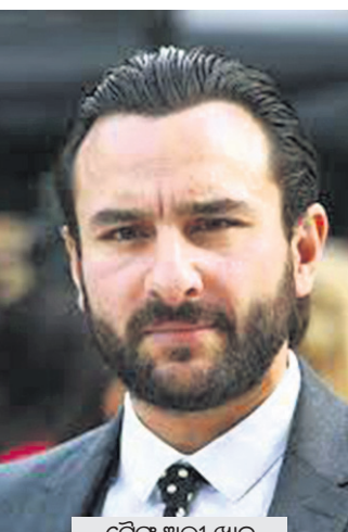
ସୈଫ୍ ଅଲୀ ଖାନ୍

ପୁରୀରେ ଅଭିଯୁକ୍ତଙ୍କୁ ଚିହ୍ନଟ କରାଯିବା ପରେ ତାଙ୍କୁ ଫଟୋ କାରି କରାଯାଇଛି। ସୈଫ୍‌ଙ୍କୁ ପରିବାର ଏହାକୁ ଡକାଯିତ ଉଦ୍ଦେଶ୍ୟରେ ଆକ୍ରମଣ ବୋଲି କହୁଥିବାବେଳେ ଏହାର ବିଭିନ୍ନ ଦିଗ ଓ କାରଣକୁ ନେଇ ଚର୍ଚ୍ଚା ହେଉଛି। ଅଭିନେତାଙ୍କୁ ଛୁରାମାଡ଼ ହେବାର ୪୫ ମିନିଟ୍ ପୂର୍ବରୁ ଅର୍ଥାତ୍ ରାତି ପ୍ରାୟ ୧୨ଟା ୩୦ରେ କରନା ଏକ ପାର୍ଟିରେ ଯୋଗଦେଇ ଘରକୁ ଫେରିଥିଲେ। ଉକ୍ତ ପାର୍ଟିରେ କାହା ସହ ମୁଣ୍ଡତକ କିମ୍ବା ବିବାଦ ହୋଇଥିଲେ ତାହା ମଧ୍ୟ ଆକ୍ରମଣର ଏକ ସମ୍ଭାବ୍ୟ କାରଣ ହୋଇଥିବାବେଳେ ବୋଲି କୁହାଯାଇଛି। ହିନ୍ଦୀ ଫିଲ୍ମ ଜଗତର ଜଣାଶୁଣା ବ୍ୟକ୍ତିତ୍ୱ ସୈଫ୍ ଅଲୀ ଖାନ୍, ତାଙ୍କ ସ୍ତ୍ରୀ ଅଭିନେତ୍ରୀ କରନା କପୁର ଖାନ୍ ଏବଂ ସେମାନଙ୍କ ପୁଅ ଇମ୍ରାନ୍‌ହିଁ ଓ ଡେବୁର ବାନ୍ତା ଷ୍ଟେସ୍‌ସିଟି ୧୨