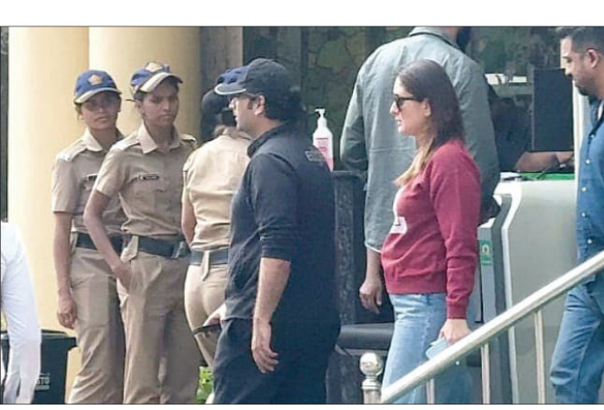
ମୁମ୍ବାଇର ଲାଲବାଟୀ ହସ୍ପିଟାଲରେ ଅଭିନେତା କିରୀ କପୁର ଖାନ୍। ପ୍ରତି ଏଭଳି ବିପଦ ସୃଷ୍ଟି ହେବା ଅତ୍ୟନ୍ତ ଲଜ୍ଜାଜନକ ବିଷୟ। ପୂର୍ବରୁ ମୁମ୍ବାଇରେ ବାବା ସିଦ୍ଧିଙ୍କୁ ହତ୍ୟା, ସଲମାନ୍ ଖାନ୍ଙ୍କୁ ଧମକ ଭଳି ଅନେକ ଘଟଣା ଘଟିଥିବାବେଳେ ସମ୍ୟ ଆକ୍ରମଣ ମୁମ୍ବାଇ ପୋଲିସ୍ ଓ ଗୃହମନ୍ତ୍ରାଳୟ ପରିବାପଣୀ

ମୁମ୍ବାଇ, ୧୬୧୧ ବଲିଉଡ୍ ଅଭିନେତା ସିଏଫ୍ ଅଲ୍ ଖାନ୍ଙ୍କୁ ଚାକ୍ ଘରେ ପଶି ଆକ୍ରମଣ କରାଯିବା ପରେ ରାଜନୀତି ତେଜିବାରେ ଲାଗିଛି। ବିରୋଧୀ ମହାଦିଗାଣ ଆସାଡ଼ି (ଏମ୍ଡିଏ) ଶାସକ ମହାସ୍ତ୍ରୀ ଗାନ୍ଧିଜୀଙ୍କୁ ଆଇନଶୁଣା ଛାଡ଼ି ନେଇ ମହାରାଷ୍ଟ୍ର ମୁଖ୍ୟମନ୍ତ୍ରୀ ଦେବେନ୍ଦ୍ର ଫଡ଼ନବିସ୍ଙ୍କୁ କାଠଗଡ଼ାରେ ଛିଡ଼ା କରାଇଛି। ଏନ୍ସିପି-ଏସ୍ପି ମୁଖ୍ୟ ଶରଦ୍ ପାଠ୍ଟର କହିଛନ୍ତି, ମହାରାଷ୍ଟ୍ରରେ ଆଇନଶୁଣା କିପରି ବିପର୍ଯ୍ୟୟ ହୋଇଯାଇଛି, ତାହା ମୁମ୍ବାଇରେ ଅଭିନେତା ସିଏଫ୍ ଉପରେ ଆକ୍ରମଣରୁ ସ୍ପଷ୍ଟ ଜାଣି ହେଉଛି। ଶିବସେନା ସୁପ୍ରିମ୍ ଏମ୍ ପି ପ୍ରିୟଙ୍କା ଚଉର୍ବେଦୀ କହିଛନ୍ତି, ମୁମ୍ବାଇରେ ଆଉ ଜଣେ ହାଲପ୍ରେପାଇଜ୍ ବ୍ୟକ୍ତିଙ୍କ ଜୀବନ