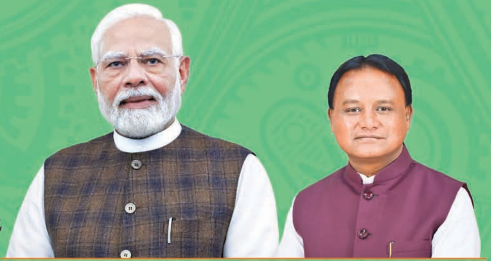
Shri Narendra Modi Prime Minister