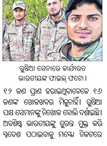
ରୁକ୍ଷିଆ ସେନାରେ କାର୍ଯ୍ୟରେ ଭାରତୀୟ ସୂଚନା ସାଧନା ସମ୍ପର୍କରେ

ରୁକ୍ଷିଆ ସେନାରେ ନିୟୋଜିତ ଆଇ.ଏସ୍.ଏସ୍.ଏସ୍.ର ସଦସ୍ୟମାନଙ୍କୁ ବିରୋଧରେ ମୁକ୍ତ ଲଢ଼ାଉଥିବା ବେଳେ ୧୨ ଜଣ ଭାରତୀୟଙ୍କ ମୃତ୍ୟୁ ଘଟିଗଲା।