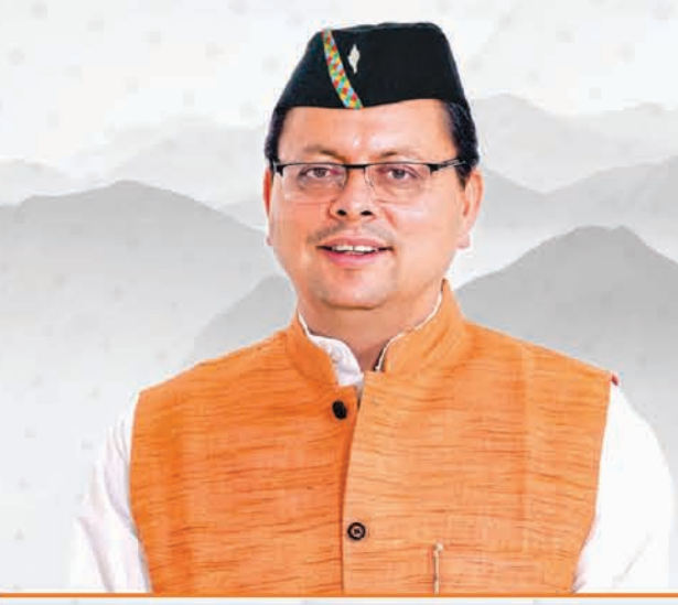
Pushkar Singh Dhami Chief Minister, Uttarakhand