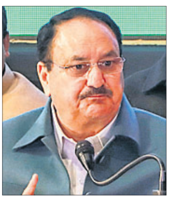
ଭାଜପାର ସଂକଳ୍ପପତ୍ର ଦିଲ୍ଲୀ ପ୍ରଗତିର ଏକ ନୁହଁନ୍ତୁ: ଜେ.ପି. ନନ୍ଦା

୧୯୯୮ରେ ପୁଣ୍ୟା ସ୍ୱରାଜ ଦିଲ୍ଲୀରେ ଶେଷ ଥର ୫୨ ଦିନ ପାଇଁ ଭାଜପାକୁ ମୁଖ୍ୟମନ୍ତ୍ରୀ ହୋଇଥିଲେ।