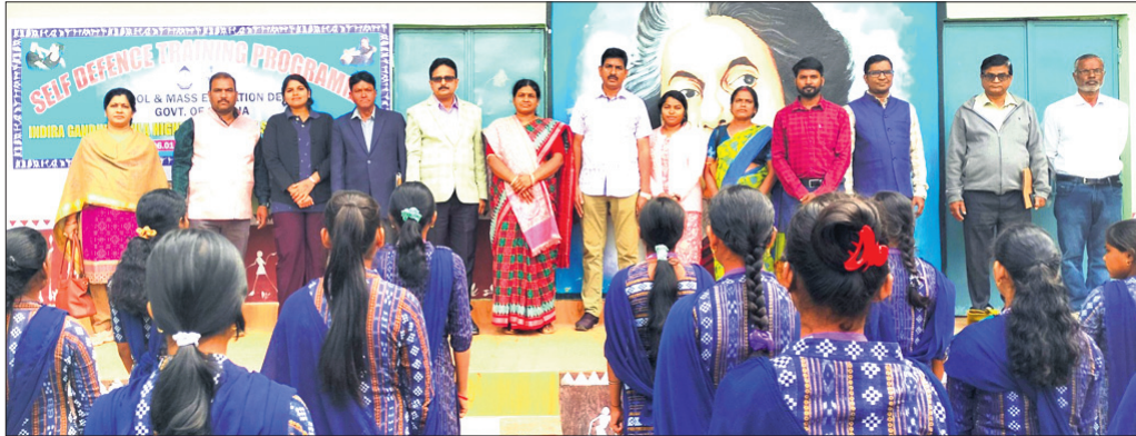
ଶିବିରରେ ଛାତ୍ରୀମାନେ ପ୍ରଶିକ୍ଷଣ ନେଉଛନ୍ତି।