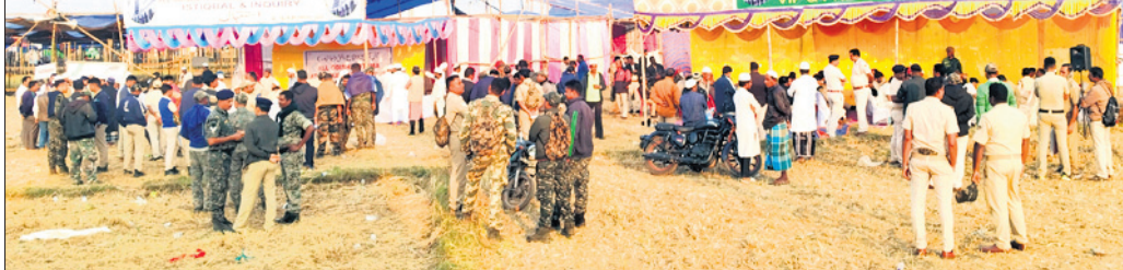
ରାଜ୍ୟସ୍ତରୀୟ ଇଚ୍ଚତମା ପାଇଁ ପୋଲିସ ପକ୍ଷରୁ ପ୍ରସ୍ତୁତି ସମାପ୍ତ କରାଯାଇଛି।

ଶେଷ ହେବ ବୋଲି କମିଟି ସଂଯୋଜକ ମହମ୍ମଦ ମୋକିମ ଓ ଅପସର ଅଲୀ ପ୍ରକାଶ କହିଛନ୍ତି।