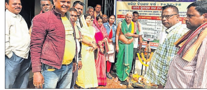
ଧାନମଣ୍ଡିକୁ ଅତିଥିମାନେ ଉଦ୍‌ଘାଟନ କରୁଛନ୍ତି।

ଇକ ଡାକ୍ତରୀକା ରେଳ ଲେଭଲ ଡ୍ରାଫ୍ଟିଂ ରାସ୍ତାଟି ସହରର ମୁଖ୍ୟରାସ୍ତା ହୋଇଥିବାରୁ ସହରବାସୀ ଯାତାୟାତରେ ବହୁ ଅସୁବିଧା ସମ୍ମୁଖୀନ ହେଉଛନ୍ତି।