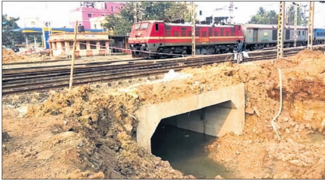
ରେଳଠାରେ ଗଳିପୋଲ ନିର୍ମାଣରେ ବିଳମ୍ବ ହେଉଛି।

ନିର୍ମାଣ କାର୍ଯ୍ୟ ଆରମ୍ଭ ହୋଇଥିଲା। ନିକଟ ଗଳିପୋଲ ନିର୍ମାଣ ୬ ମାସ ବିଳମ୍ବ ହୋଇଥିଲେ ମଧ୍ୟ ଅଧିକ ଅଧିକ କାର୍ଯ୍ୟ ଅବଶ୍ୟକ ହେବ ବୋଲି ରେଳମନ୍ତ୍ରୀ ଅଶ୍ୱିନୀ ଦେବଦାସ କହିଛନ୍ତି।