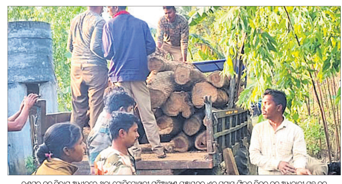
ରଣପୁର ବନ ବିଭାଗ ଅଧୀନରେ ଥିବା ବୋଡ଼ିପୋଖରୀ ମଠିଆଖଣ୍ଡ ପଞ୍ଚାୟତର ଏକ ପରାସ ଫିଲ୍ଡ୍ କ୍ରିଡ଼କୁ ବନ ଅଧିକାରୀ ସହ ବନ କର୍ମଚାରୀମାନେ ଶୁକ୍ରବାର ୩୫ ଟି ଲକ୍ଷ ଶାଗୁଆନ କାଠ ତୋରାରେ ମାଟିଆ ରଖିଥିବାବେଳେ ଚଢ଼ାଇ କରି ଧରିଛନ୍ତି। ସେଗୁଡ଼ିକୁ ସେଠାରୁ କଟକ କରି ବନ ବିଭାଗ ଆଣିଛି।

ସାମାଜିକ ବ୍ୟବସ୍ଥା ଯେଉଁଠି ଅଚଳିଯାଏ, ସେଇଠି ନାରୀ ହିଁ ପ୍ରଥମେ ଆଲୋଚନାର ଶରଣ ହୁଏ। ଅପବାଦର ସମ୍ମୁଖରେ ଚାଲୁ ବଦଳିତ କରିବାକୁ ସାହାଯ୍ୟ କେବଳ ସମାଜ କାର୍ଯ୍ୟକର୍ତ୍ତା ନିଜ ନିଜର ପୁଅବା, ଯେମିତି କି ପରିବାର, ଆତ୍ମୀୟ ସ୍ୱଜନମାନଙ୍କ କଠୋର ଆପତ୍ତିରେ ସେ ବାରମ୍ବାର ଝୁଟି ଯାଆନ୍ତି। ଅଥଚ ଝୁଟିପଡ଼ି ପୁଣି ଚାଲିବାର ସାମର୍ଥ୍ୟ, ସାହସ, ସଂକଳ୍ପ କେବଳ ନାରୀ ପାଖରେ ଥାଏ। ଯାହାକି ନାଟକରେ ବେଶ୍‌ବାଦୁ ମିଳିଥିଲା।