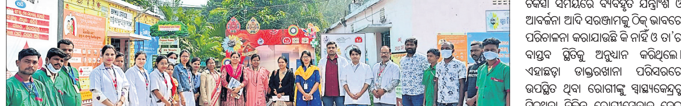
ମଧୁବନ ଗୋଷ୍ଠୀ ସ୍ୱାସ୍ଥ୍ୟକେନ୍ଦ୍ରକୁ ଆସିଥିବା କାନ୍ୟାକଳ୍ପ ଚମ୍ପ ସାଗର କରାଯାଇଛି।

ରଘୁନାଥପୁର ବ୍ଲକ ଅନ୍ତର୍ଗତ ମଧୁବନ ଗୋଷ୍ଠୀ ସ୍ୱାସ୍ଥ୍ୟକେନ୍ଦ୍ରକୁ ରାଜ୍ୟ କାନ୍ୟାକଳ୍ପ ସ୍ୱାସ୍ଥ୍ୟ ପରିବର୍ତ୍ତକ ଚମ୍ପ ପରିବର୍ତ୍ତନ କରିଛି।