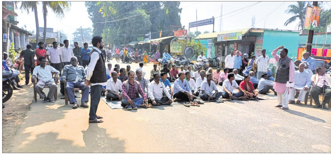
ଚାଷୀମାନେ ରଣପୁର-ଚନ୍ଦ୍ରପୁର ରାସ୍ତା ଅବରୋଧ କରିଛନ୍ତି।

ଭୁଇଁସାହିରେ ଗାଡ଼ି ମଟର ଦୀର୍ଘ ସମୟ ଅଟକି ରହିଥିଲା। ଯାନବାହାନ ଚଳାଚଳ ବନ୍ଦ ରହିଥିବାରୁ ସାଧାରଣ ଲୋକମାନେ ନାହିଁ ନ ଥିବା ଅସୁବିଧାର ସମ୍ମୁଖୀନ ହୋଇଥିଲେ।