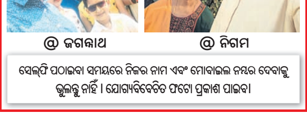
ସେଲଫି ପଠାଇବା ସମୟରେ ନିଜର ନାମ ଏବଂ ମୋବାଇଲ ନମ୍ବର ଦେବାକୁ ଭୁଲନ୍ତୁ ନାହିଁ। ଯୋଗାଯୋଗ ପୂର୍ଣ୍ଣ ପ୍ରକାଶ ପାଇବ।