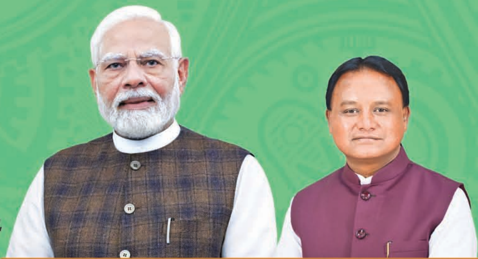
Shri Narendra Modi Prime Minister