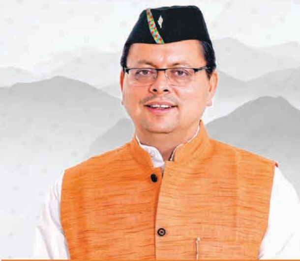
Pushkar Singh Dhami Chief Minister, Uttarakhand