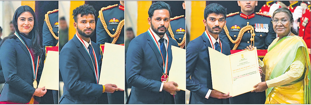
ରାଷ୍ଟ୍ରପତି ଭବନରେ ଶୁକ୍ରବାର ରାଷ୍ଟ୍ରପତି ଡ୍ରୌପଦୀ ମୁର୍ମୁଙ୍କଠାରୁ ମେଜର ଧ୍ୟାନ ଚାନ୍ଦ ଖେଳରତ୍ନ ପୁରସ୍କାର ଗ୍ରହଣ ଅବସରରେ ମନୁ ଭାକର, ପ୍ରବୀଣ କୁମାର, ହରମନପ୍ରୀତ ସିଂ ଓ ଡି. ଗୁଜରାଣୀ