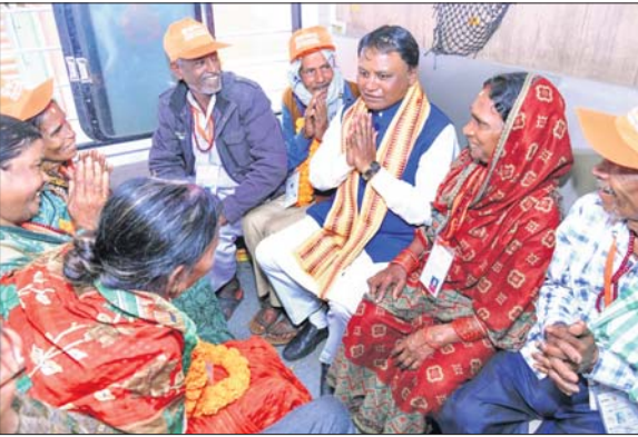
ଭୁବନେଶ୍ୱର ରେଳ ଷ୍ଟେଶନରେ ଚାର୍ଯ୍ୟଯାତ୍ରା ଟ୍ରେନ୍ ମଧ୍ୟରେ ବରିଷ୍ଠ ନାଗରିକଙ୍କ ସହ ମୁଖ୍ୟମନ୍ତ୍ରୀ ମୋହନ ଚରଣ ମାଝା ଭାବ ବିନିମୟ କରୁଛନ୍ତି।

ବରିଷ୍ଠ ନାଗରିକ ଚାର୍ଯ୍ୟଯାତ୍ରା ଯୋଜନାର ଶୁଭାରମ୍ଭ