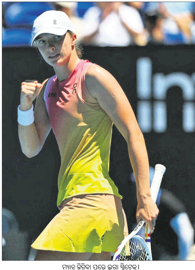
ମ୍ୟାଚ୍ ଚିତ୍ରା ପରେ ଜଗା ସ୍ପିନେକ୍।