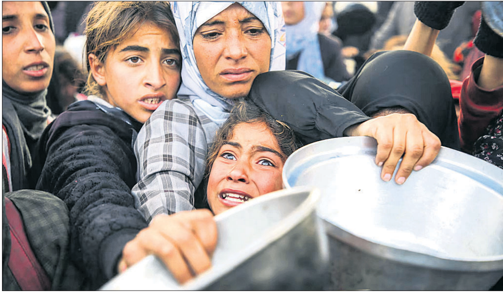
ମୁକ୍ତବିରତିର ଦିନକ ପୂର୍ବରୁ ଗାଜା ନିକଟରେ ଥିବା ଶାନ୍ତି ସହରର ଶୁକ୍ଳ ଯତ୍ରାରେ ପାଲେଷ୍ଟିନୀୟମାନେ ଏକ ଦାବତ୍ୟ ରୋଷଣାକାରୁ ଖାଦ୍ୟ ସଂଗ୍ରହ କରୁଛନ୍ତି।