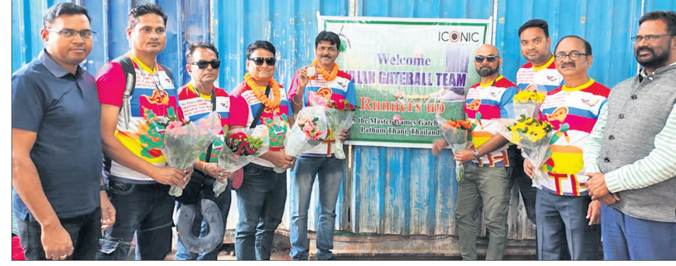
କର୍ମଚାରୀଙ୍କ ସହ ଭାରତୀୟ ଗେଟ୍ ବଲ୍ ଦଳର ଖେଳାଳି।

ଭୁବନେଶ୍ୱର, ୧୮୧ (ବିଜୟ ରଣା) ଚଳିତ ମାସ ୧୪ରୁ ୧୭ତାରିଖ ପର୍ଯ୍ୟନ୍ତ ଆୟୋଜିତ ପ୍ରଥମ ଆସିଆନ ଗେଟ୍ ବଲ୍ ଟୁରଣ୍ଟରେ ଭାରତୀୟ ଗେଟ୍ ବଲ୍ ଦଳ ଦୁଇଟି ବର୍ଗରେ ଭାଗ ନେଇଥିଲା। ୨୦୧୯ରେ ସେ ଚମ୍ପିୟନ ହୋଇଥିଲେ। ଟାକାଲେ କ୍ଲବ୍ ଖେଳାଳିରେ ଅଂଶଗ୍ରହଣ କରିବେ ସେ ପ୍ରଥମ ଭାରତୀୟ। ଡାକାରା ୪୭ତମ ସଂସ୍କରଣ ସାଉଥ ଆରବ ଶୁବେଚ୍ଚାଠାରେ ଶେଷ ହୋଇଥିଲା। ପୁଣିଭାରତୀୟ ଟାକାଲେ ଫାଇନାଲ ଷ୍ଟେଜ୍‌ରେ ଭିତରେ ପେନାଲ୍ଟି ସହ ୫ମ ସ୍ଥାନ ଅଧିକାର କରିଥିଲେ। ପୂର୍ବରୁ ଷ୍ଟେଜ୍-୨ରେ ସେ ସପ୍ତମ ହୋଇଥିଲେ। ଷ୍ଟେଜ୍ ୮, ୯ ଓ ୧୧ରେ ସେ ଚମ୍ପି ୧୧ ପିନିଶରଙ୍କ ମଧ୍ୟରେ ସ୍ଥାନ ପାଇଥିଲେ।