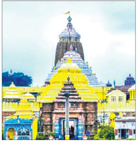
ନିଜ ଇନ୍‌ସ୍ଟାଗ୍ରାମ୍ ଏବଂ ଫେସ୍‌ବୁକ୍‌ରେ ଶ୍ରୀମନ୍ଦିର ଭିତର ଓ ଗର୍ଭଗୃହର ଫଟୋ ଅପଲୋଡ୍ କରିଥିବା ଜଣାପଡ଼ିଛି। ଭାଇରାଲ ଭିଡିଓରେ ରତ୍ନସିଂହାସନରେ ଶ୍ରୀବିଗ୍ରହକୁ