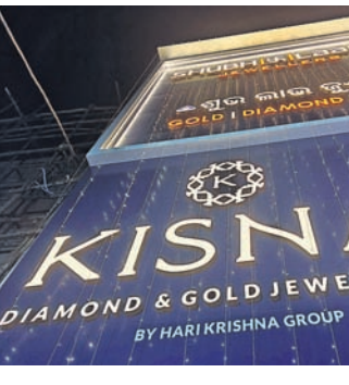
ଭୁବନେଶ୍ୱର, ୧୯୧ (ଅଭୟ ଦାଶ)

କିସ୍ନା ଜୁଏଲାରୀର ଲକ୍ଷି ତ୍ୱରେ ଆକର୍ଷଣୀୟ ପୁରସ୍କାର