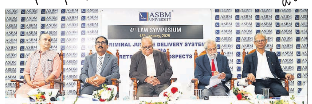
ଭୁବନେଶ୍ୱର, ୧୯୧