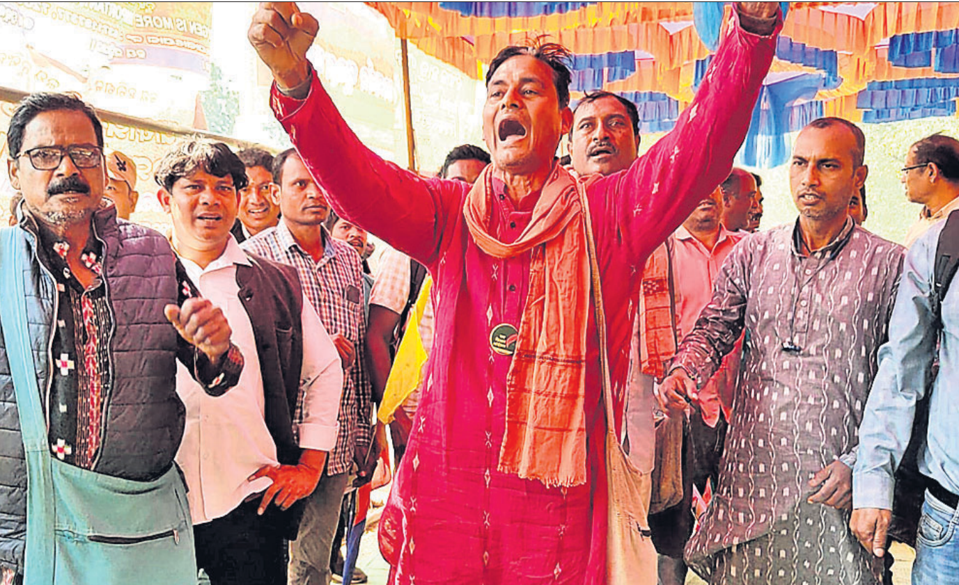
ବିଜେଡି ନେତ୍ରୀନେତାଙ୍କୁ ପଶ୍ଚିମ ଓଡ଼ିଶା ମହାସମାବେଶରେ ଆନ୍ଦୋଳନକାରୀମାନେ ରବିବାର ବିରୋଧ କରିଛନ୍ତି ।