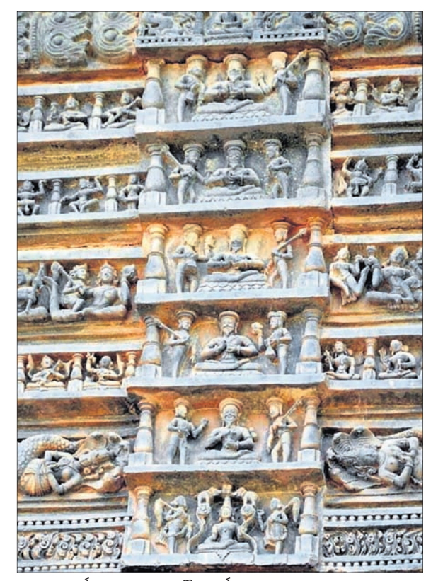
କୋଣାର୍କଠାରେ ପାଣ୍ଡୁପତ ଶୈବାଚାର୍ଯ୍ୟ ରୁରୁ ଶ୍ରୀନକୁଳାଶଙ୍କ ବାରବନ୍ଧର ସୁନାକାର୍ଯ୍ୟ।

■ ରୂପାସଗଡ଼ ଦଳବେହେରା ଦେଇଥିଲେ ଚନ୍ଦନକାଠର ପାଠୁକା ■ ଗଙ୍ଗବଂଶର ରାଜକାୟ ଚିହ୍ନ ରହିଥିଲା ଖଣ୍ଡାରେ