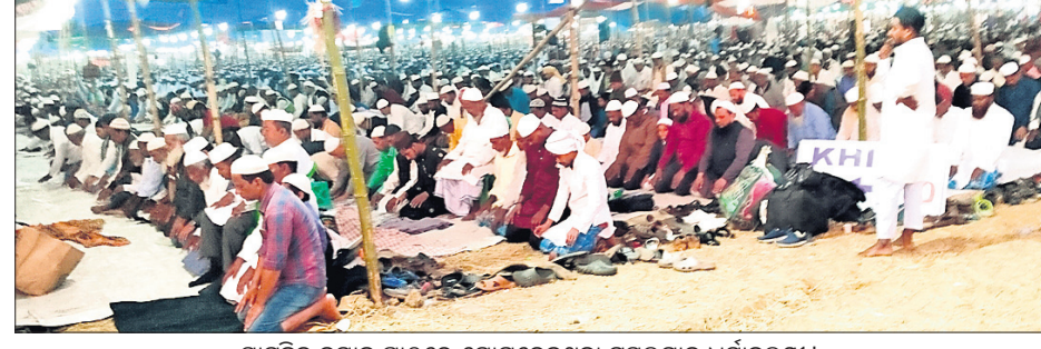
ସାମୂହିକ ନମାଜ ପାଠରେ ଯୋଗଦେଇଥିବା ମୁସଲମାନ ଧର୍ମାବଲମ୍ବୀ।