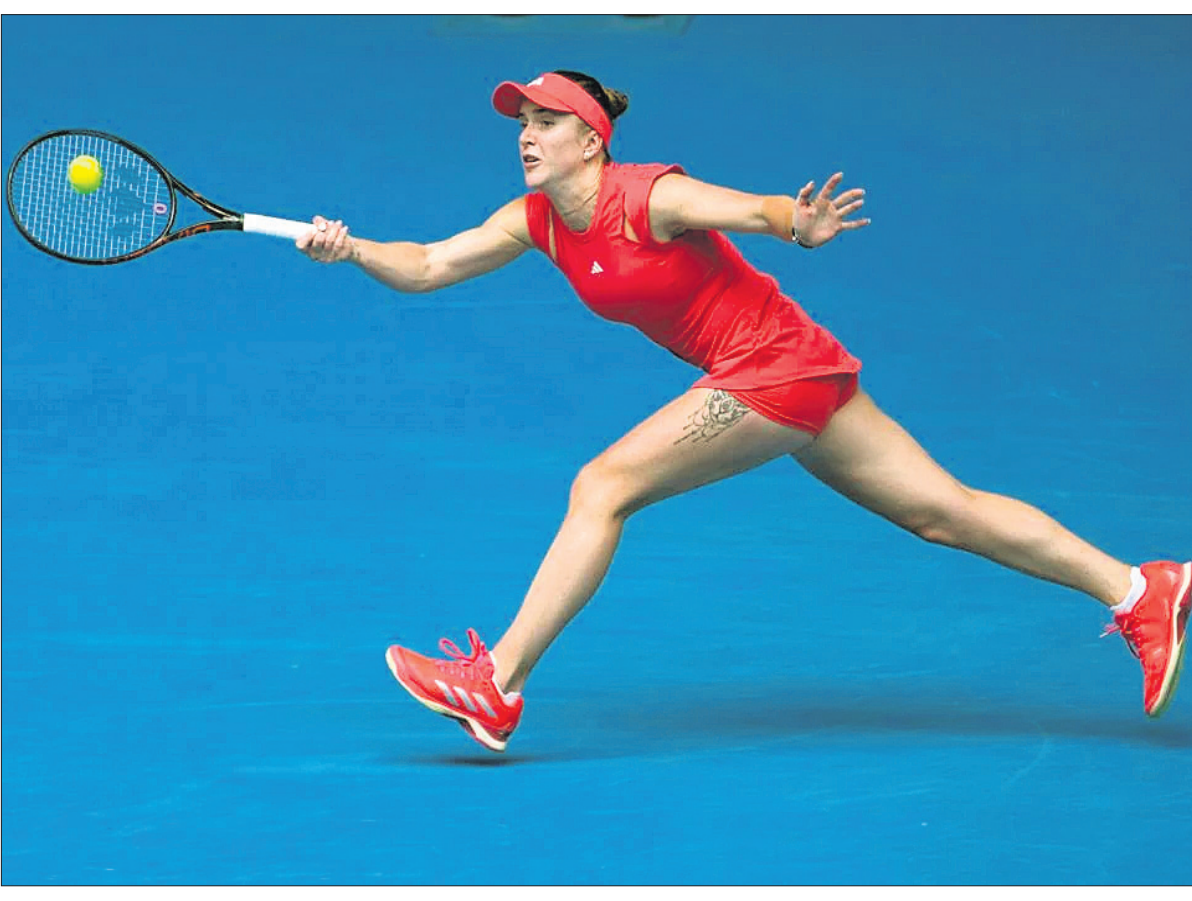
ଅଷ୍ଟ୍ରେଲିଆର ଓପନ ଗ୍ରାଣ୍ଡସ୍ଲାମ୍ ଚେନିସ ମହିଳା ସିଙ୍ଗଲ୍‌ରେ ଯୋଗଦାନ ରିଟର୍ଣ୍ଣ ଶର୍ଟ ଖେଳୁଛନ୍ତି ଏଲିନା ସ୍ୱିଡୋଲିନା।