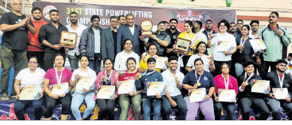
ରାଜ୍ୟ ଶକ୍ତି ଉତ୍ତୋଳନ ପ୍ରତିଯୋଗିତାରେ କୁଡ଼ା ପ୍ରତିଯୋଗୀମାନେ ଅତିଥିକ ଗହଣରେ।

ପଦକ ପାଇ ପଛକୁ ପଛ ରହିଛନ୍ତି। ନବରଙ୍ଗପୁରକୁ ୨ଟି ଏବଂ ନୟାଗଡ଼, ଯାଜପୁର, ସୋନପୁର, ବାଲେଶ୍ୱର ଓ ଗଞ୍ଜାମକୁ ଗୋଟିଏ ଲେଖାଏ ପଦକ ମିଳିଛି। ଆସନ୍ତା ଫେବୃଆରୀ ୧୯ରୁ ୨୩ ପର୍ଯ୍ୟନ୍ତ ପଞ୍ଜାବର ଫରଫୁରାଠାରେ ହେବାକୁଥିବା ସିନିୟର ଜାତୀୟ ପ୍ରତିଯୋଗିତାରେ ଓଡ଼ିଶାର କୁଡ଼ା ପ୍ରତିଯୋଗୀମାନେ ଅତିଥିକ ଗହଣରେ।