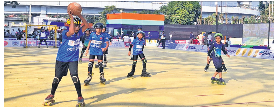
ମ୍ୟାଚ ଅବସରରେ ଓଡ଼ିଶା ଦଳର ଖେଳାଳିମାନେ।