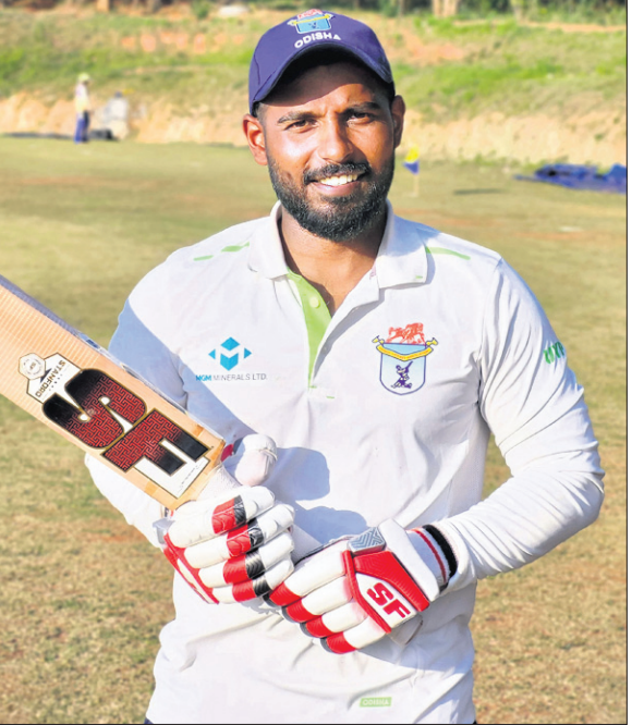
ଅଧିନାୟକ ସହିତ ପକ୍ଷନାୟକ।