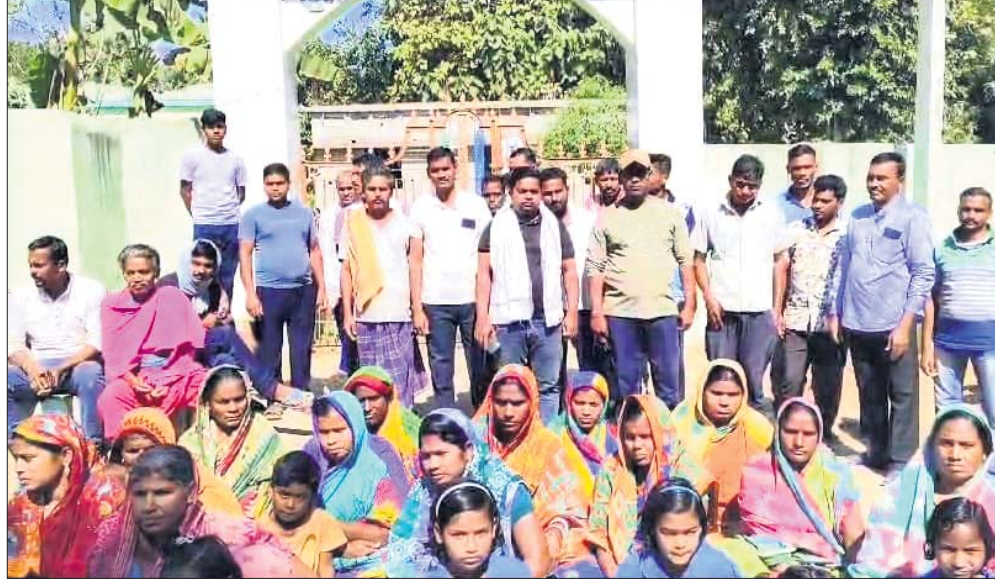
ବିଦ୍ୟାଳୟ ସମ୍ମୁଖ ଗେଟରେ ତାଲା ପକାଇ ଧାରଣା ଦିଆଯାଇଛି।