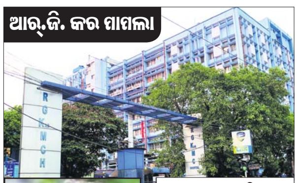
ଆର୍କି କର ମାପିଲା