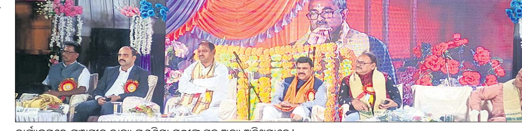
କାର୍ଯ୍ୟକ୍ରମରେ ମଞ୍ଚାସୀନ ରାଜ୍ୟ ଗଣଶିକ୍ଷା ମନ୍ତ୍ରୀଙ୍କ ସହ ଅନ୍ୟ ଅତିଥିମାନେ।