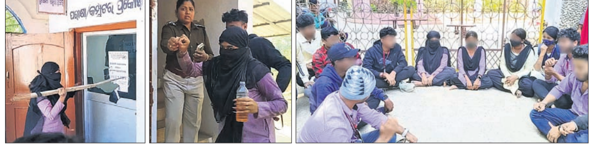
କଲେଜ ପରିସରରେ ଭଙ୍ଗାଠୁଜ, ପାଢ଼ିତାଙ୍କ ଆତ୍ମାହୁତି ଉଦ୍ଧାର ଓ ଛାତ୍ରାଛାତ୍ରୀଙ୍କ ଆନ୍ଦୋଳନ।