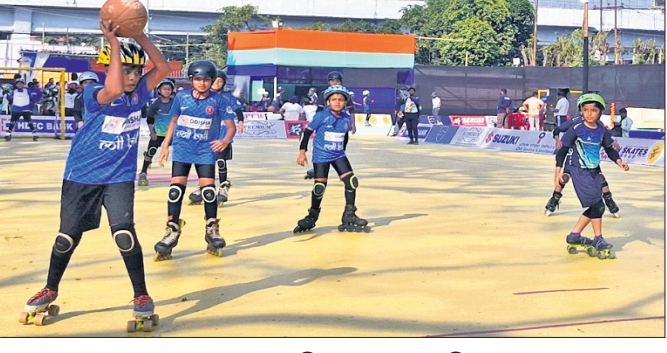
ମ୍ୟାଚ ଅବସରରେ ଓଡ଼ିଶା ଦଳର ଖେଳାଳିମାନେ।

ଭୁବନେଶ୍ୱର, ୨୦୧୧ (ତପନ ସାହି) ଚୁଆହାଟାଠାରେ ଚାଲିଥିବା ଜାତୀୟ ୧୧ ବର୍ଷରୁ କମ୍ ରୋଲ୍ ବଲ୍ ଚାମ୍ପିୟନସ୍‌ସ୍‌ କ୍ୱାର୍ଟର ଫାଇନାଲରେ ଓଡ଼ିଶା ବାଳିକା ଓ ବାଳକ ଦଳ ପ୍ରବେଶ କରିଛି। ବାଳିକା ବର୍ଗରେ ଓଡ଼ିଶା ଆରୁଣ୍ଡସ୍‌ସ୍‌ (ରୋଲ୍‌ର ଷ୍ଟୋର୍ ଆଣ୍ଡ ସୋସିଆଲ ଏକାଡେମୀ-ପୁଣେ)କୁ ୩-୦ରେ ହରାଇ ଥିବାବେଳେ କର୍ନାଟକ ସହିତ ୧-୧ ଗୋଲରେ ମ୍ୟାଚ ଡ୍ର ରଖିଥିଲା। ୧ରେ ବିହାରକୁ ୨-୦ ଓ ତେଲଙ୍ଗାନାକୁ ୬-୧ ଗୋଲରେ ହରାଇଥିଲା। ବାଳିକା ବର୍ଗରେ ଓଡ଼ିଶା ୪-୨ ଗୋଲରେ କର୍ନାଟକକୁ, ୪-୦ରେ