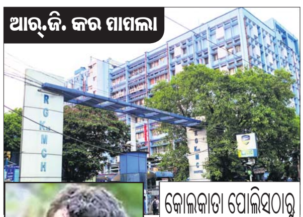
ଆର୍କି କର ମାପିଲା