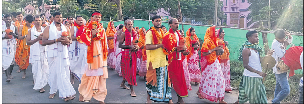
ପାଣିକୋଇଲି, ୨୦୧୧ (ବିକାଶ ମଲିକ)

କୋରେଇ ବ୍ଲକ ଅନ୍ତର୍ଗତ ପଥରପଦା ପଞ୍ଚାୟତ ଓଡ଼ିଆ ଗ୍ରାମରେ ଶ୍ରୀଶ୍ରୀ ଗୋପୀନାଥ ଜୀଉ ମନ୍ଦିର ପ୍ରତିଷ୍ଠା ଉତ୍ସବ ଅନୁଷ୍ଠିତ ହୋଇଯାଇଛି। ଏହି ଅବସରରେ ପୂର୍ଣ୍ଣଚୋୟା କବିତା ନବୀନ ଲିଙ୍ଗେଶ୍ୱର ସାହୁଙ୍କୁ ଦେବ ଯାତ୍ରା ବାହାରି ଗ୍ରାମରେ ପହଞ୍ଚିଥିଲା। ଶତାଧିକ ମହିଳା ଏହି କଳସ