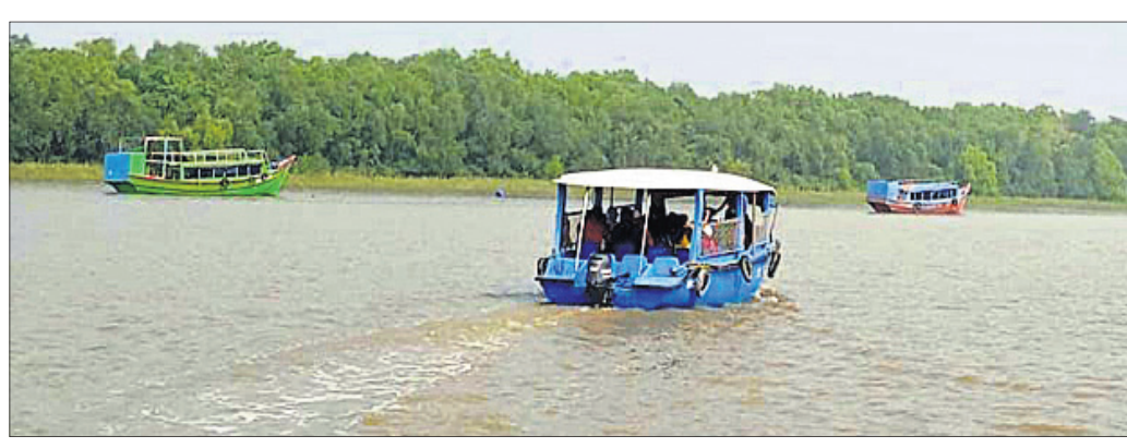
ଭିତରକନିକାରେ ଇକୋ ରିଜର୍ଭକୁ ଆସିଥିବା ପର୍ଯ୍ୟଟକମାନଙ୍କୁ ବୋଟରେ ବୁଲାଇ ଦିଆଯାଇଛି।

ବିଶ୍ୱ ପ୍ରସିଦ୍ଧ ଭିତରକନିକା ପରିଭ୍ରମଣ ପାଇଁ ବନବିଭାଗ ପକ୍ଷରୁ ଏବେ ପର୍ଯ୍ୟଟ ବନ୍ଦ ରଖାଯାଇଛି। ଚଳିତମାସ ୧୪ରୁ ୨୨ ତାରିଖ ପର୍ଯ୍ୟନ୍ତ ବେଶ ବିବେଶନ ପର୍ଯ୍ୟଟକମାନଙ୍କୁ ଭିତରକନିକା ପ୍ରବେଶକୁ ବାରଣ କରାଯାଇଛି। ଏହି ସମୟଯାମା ମଧ୍ୟରେ ଭିତରକନିକାକୁ ଆସିଥିବା ବିଦେଶୀଗତ ପକ୍ଷୀ ଏବଂ ଜାତୀୟ ଉଦ୍ୟାନର ପ୍ରାଣୀଜୀବୀ ନାଳରେ ବ୍ୟବସାୟ କରୁଥିବା ବନ୍ଧୁକ କୁମ୍ଭୀରକ ଗଣନା କାର୍ଯ୍ୟ କରାଯିବା ପାଇଁ ଏହି ନିଷେଧାଜ୍ଞା ଜାରି କରାଯାଇଛି। କିନ୍ତୁ ପେଣ୍ଟ ବୋଲାର୍ଡ୍‌ରେ ଚାଲିଥିବା ଇକୋ