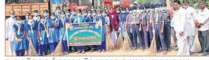
ସ୍ୱଚ୍ଛତା ଅଭିଯାନ କାର୍ଯ୍ୟକ୍ରମରେ ସାମିଲ ହୋଇଥିବା ଛାତ୍ରାଛାତ୍ରୀ ଏବଂ ଅନ୍ୟମାନେ।