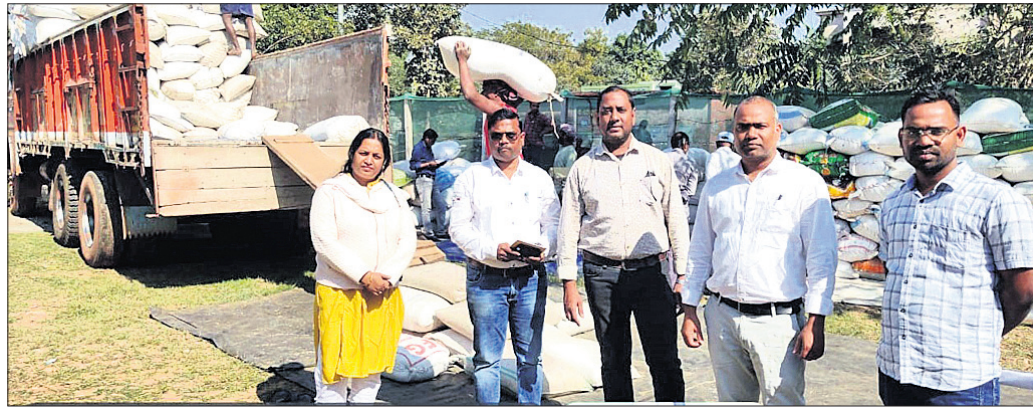
ଚୋରମୁହାଁ ମଣ୍ଡିରେ ଧାନ କିଣାକୁ ଅଧିକାରୀମାନେ ଯାଞ୍ଚ କରୁଛନ୍ତି।