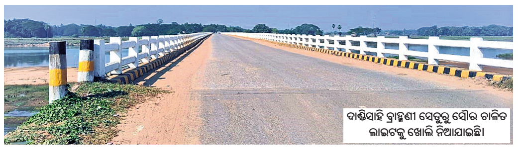
ବାଣିସ୍ୟାସି ବ୍ରାହ୍ମଣୀ ସେତୁରୁ ସୌର ଚାଳିତ ଲାଇଟ୍‌କୁ ଖୋଲି ନିଆଯାଇଛି।