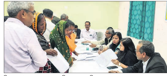
ନିଲାମାଳ ଓ ଅନ୍ୟ ଅଧିକାରୀ ଅଭିଯୋଗ ଶୁଣୁଛନ୍ତି।