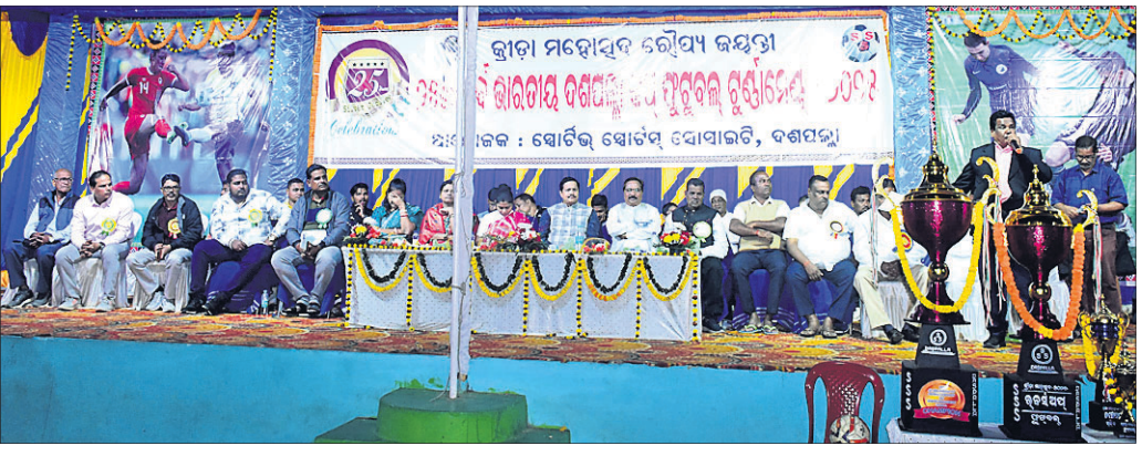
ଉଦ୍‌ଯାପନା ଉତ୍ସବରେ ମଞ୍ଚାଧାର ଅତିଥି ।