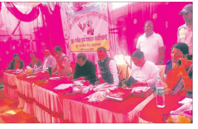
ପ୍ରଶାସନିକ ଅଧିକାରୀମାନେ ଲୋକଙ୍କ ଅଭିଯୋଗ ଶୁଣୁଛନ୍ତି।