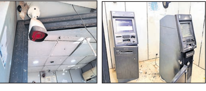
ଆଳି, ୨୦୧୧ (ବନମାଳା ସେନାପତି)

ଏକ ଫୁଟ ବାହାରକୁ ଆଣିଥିଲେ। ଏହି ସମୟରେ ଷ୍ଟେଟ ବ୍ୟାଙ୍କ ପକ୍ଷରୁ ଏଟିଏମ୍ ହୋଇଥିବା ଘର ମାଲିକଙ୍କୁ ଫୋନକରି ହୋଇଥିବା ଘର ମାଲିକଙ୍କୁ ଫୋନକରି ପରେ ସେ ଆନାକୁ ଜଣାଇଥିଲେ। ଏହାସହ ଏଟିଏମ୍ ଥିବା ଘର ଉପରେ ରହୁଥିବା ଲୋକଙ୍କୁ ଜଣାଇଥିଲେ। ଉପର ଘର ରହୁଥିବା ଲୋକଙ୍କୁ ବାହାର ପଟରୁ ଦୁର୍ଭୁତମାନେ ଡାକି ପକାଇଦେଇଥିଲେ। ଦୁର୍ଭୁତମାନେ ଏଟିଏମ୍ ଲୁଟରେ ବିଫଳ ହେବା ପରେ ଭିତରେ ବ୍ୟାପକ ଭଙ୍ଗାଠୁଣା କରିଥିଲେ। ପୋଲିସ୍ ଏଟିଏମ୍ ନିକଟରେ ଏକ ହସ୍ତୀ ଦୁର୍ଭୁତମାନେ ଆସିଥିବା ବେଳେ ପତ୍ରପୁର ଏଟିଏମ୍ ନିକଟରେ ଭାରତୀୟ ଷ୍ଟେଟ ବ୍ୟାଙ୍କ ଏଟିଏମ୍‌ରେ କେତେଜଣ ଦୁର୍ଭୁତ ଲୁଟ କରିବା ପାଇଁ ଯୋଗାଯୋଗ କରିଥିଲେ। ପୋଲିସ୍ ଏହି ନିମନ୍ତେ ପଶିଥିଲେ। ଦୁର୍ଭୁତମାନେ ଏକ ଟ୍ରକ୍ ଏଟିଏମ୍ ଲୁଟ ଘଟଣାରେ ସାମିଲଥିବା ନେଇ ଲୁଟ ପାଇଁ ଆସିଥିଲେ। ଦୁର୍ଭୁତମାନେ ଏଟିଏମ୍ ଭିତରେ ପଶି ମେଶିନରୁ ଟଙ୍କା ଲୁଟ ନିମନ୍ତେ ପ୍ରୟାସ କରିଥିଲେ। ଲୁଟପାଟ ସମୟରେ ଏଟିଏମ୍ ବାହାରରେ ଓ ଭିତରେ ଥିବା ସିସି କ୍ୟାମେରାରେ ନାଲିରଙ୍ଗର ଷ୍ଟ୍ରେ ମାରି ଦେଇଥିଲେ। ପ୍ରାୟ ୪୫୦ ଜଣ ଦୁର୍ଭୁତ ଏଟିଏମ୍ ଲୁଟ ଦୁର୍ଭୁତଙ୍କୁ ଧରିବା ନିମନ୍ତେ ତନାୟନା ଆରମ୍ଭ କରିଛନ୍ତି। ପୁରୀଯୋଗ୍ୟ, ୨୦୨୧ ଫେବୃଆରୀ ୨ ତାରିଖରେ ଏଟିଏମ୍ ଡ଼ି ଦୁର୍ଭୁତମାନେ ପ୍ରାୟ ୨୩ ଲକ୍ଷ ଟଙ୍କା ଲୁଟି ନେଇଥିବା ବେଳେ ପତ୍ରପୁର ଏଟିଏମ୍ ଡ଼ି ୧୨ ଲକ୍ଷ ଟଙ୍କା ଲୁଟି ନେଇଥିଲେ। ଏହି ଘଟଣାକୁ ୪ ବର୍ଷ ବିଚିତ୍ରକୁ ବସିଥିବା ବେଳେ ପୋଲିସ୍ ଦୁର୍ଭୁତଙ୍କ ଚେରପାଉନାହିଁ। ଗୋଟିଏ ଏଟିଏମ୍ ମେଶିନକୁ ନେଇଥିବାକୁ ଉଦ୍ୟମକରି ବସିଥିବା ସ୍ଥାନରୁ ପ୍ରାୟ