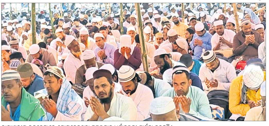
ରାଜ୍ୟସ୍ତରୀୟ ଇଜଡେମାରେ ଯୋଗଦେଇଥିବା ମୁସଲମାନ ଧର୍ମାବଲମ୍ବୀ ପ୍ରାର୍ଥନା କରୁଛନ୍ତି।