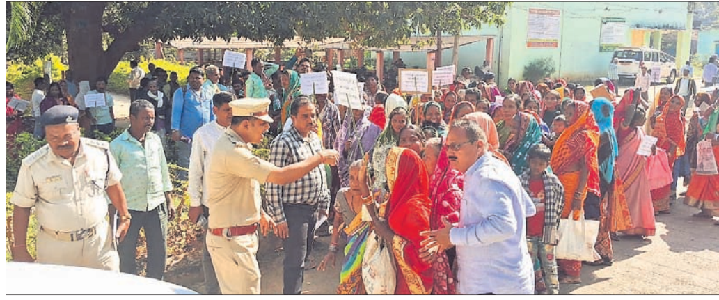
ବୁକ୍ ଘେରାଇ କରିଥିବା ଆଦିବାସୀ ।

ନୟାଗଡ଼/ରମେଶ୍ୱର, ୨୦୧୧ (ଲୋକନାଥ ମିଶ୍ର/ପ୍ରକାଶ କିଶୋର ଦାଶ)