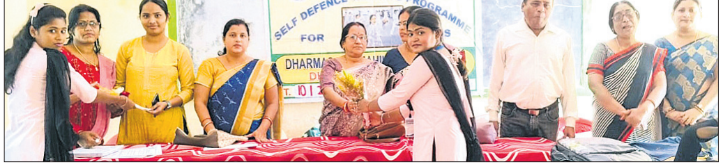
ଆତ୍ମରକ୍ଷା ପ୍ରଶିକ୍ଷଣ ନେଇଥିବା ଛାତ୍ରୀଙ୍କୁ ଅଧ୍ୟକ୍ଷା ପ୍ରମାଣପତ୍ର ପ୍ରଦାନ କରୁଛନ୍ତି।