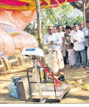
ଅତିଥିମାନେ ଧାନମଣ୍ଡିକୁ ଉଦ୍‌ଘାଟନ କରୁଛନ୍ତି ।

ମିଳିକ ଓ ସ୍ଥାନୀୟ ଅଞ୍ଚଳର ଗଣମାନଙ୍କ ଉପସ୍ଥିତିରେ ପୂର୍ଣ୍ଣାଙ୍ଗଣ କରାଯାଇଥିଲା । ଚଳିତବର୍ଷ ଶିଖରପୁର ସେବା ସମବାୟ ସମିତି ଅଧୀନରେ ୩୫୮ ଜଣ ଚାଷୀ ଧାନ ବିକ୍ରୀ କରିବା ନିମନ୍ତେ ନାମ ପଞ୍ଜୀକରଣ କରିଥିବା ବେଳେ ଜୟ ବଜରଜି ରାଜସ୍ୱ ମିଲର ସେଠାରୁ ଧାନ ସଂଗ୍ରହ ପାଇଁ ଜିଲ୍ଲା ପ୍ରଶାସନ ପକ୍ଷରୁ ନିର୍ଦ୍ଦେଶ ରହିଥିବା ସମ୍ପର୍କରେ ସମିତିର ସମ୍ପାଦକ କହିଛନ୍ତି ।