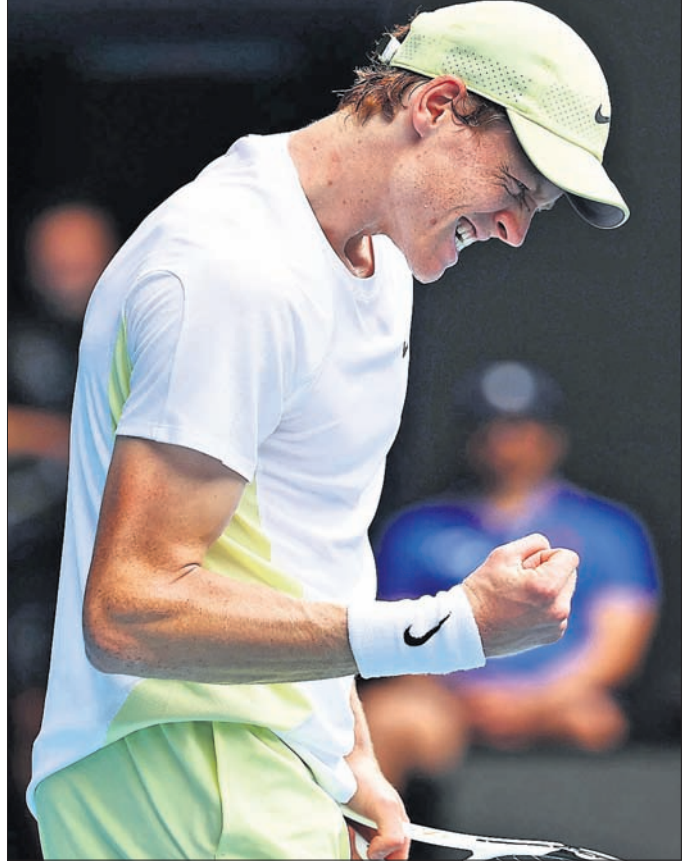
କ୍ୱାର୍ଟର ଫାଇନାଲ ଜିତିବାପରେ ଜାନିକ ସିନରଙ୍କ ପ୍ରତିକ୍ରିୟା।

ମେଲବୋର୍ଣ୍ଣ, ୨୨।୧ ଟପ୍ ସିଡ୍ ଜାନିକ ସିନର ଓ ୨୧ତମ ସିଡ୍ ବେନ୍ ଶେଲଟନ ଅଷ୍ଟ୍ରେଲିଆନ ଓପନ ଗ୍ରାଣ୍ଡସ୍ଲାମ ଚେମ୍ପିୟନ ପୁରୁଷ ସିଙ୍ଗଲ୍ ସେମିଫାଇନାଲରେ ପ୍ରବେଶ କରିଛନ୍ତି। ଚୁପାବାର ଅନୁଷ୍ଠିତ କ୍ୱାର୍ଟର ଫାଇନାଲରେ ଇଟାଲୀର ସିନର ଅଷ୍ଟ୍ରେଲିଆର ଆଲେକ୍ସ ଡି ମିନାଭରଙ୍କୁ