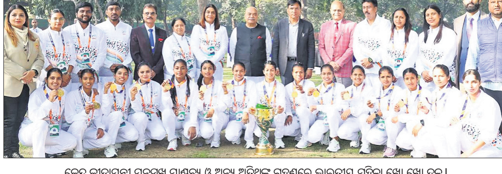
କେନ୍ଦ୍ର କ୍ରୀଡ଼ାମନ୍ତ୍ରୀ ନୀଳପୁଞ୍ଜ ମାଣ୍ଡବ୍ୟ ଓ ଅନ୍ୟ ଅତିଥିକ ରହଣରେ ଭାରତୀୟ ମହିଳା ଖୋ ଖୋ ଦଳ।

ଭୁଆଦିଲ୍ଲା, ୨୨।୧ ସର୍ବପ୍ରଥମ ଖୋ ଖୋ ବିଶ୍ୱକପ୍‌ରେ ଚାମ୍ପିୟନ ହୋଇ ଭାରତୀୟ ମହିଳା ଓ ପୁରୁଷ ଦଳ ଇତିହାସ ରଚିଛି। ଫଳରେ ଦୁଇ ଦଳକୁ ଏବେ ଅଭିନନ୍ଦନର ସୁଅ ଛୁଟିଛି। ଏହି କ୍ରମରେ କେନ୍ଦ୍ର କ୍ରୀଡ଼ାମନ୍ତ୍ରୀ