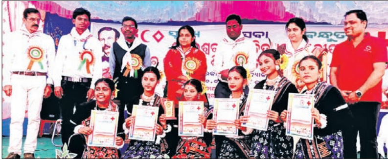
ଅତିଥିଙ୍କ ଗହଣରେ କୃତୀ ପ୍ରତିଯୋଗୀ ।