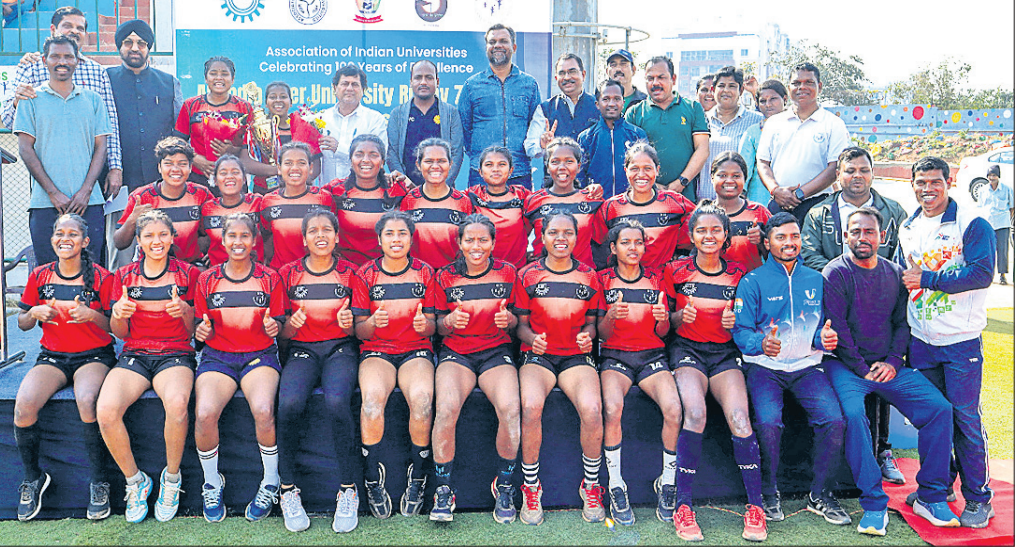
ସର୍ବ ଭାରତୀୟ ଆନ୍ଧ୍ର ବିଶ୍ୱବିଦ୍ୟାଳୟ ମହିଳା ରଗ୍‌ବୀ ୧୫ ସର୍ବ ବର୍ଗରେ ଚାମ୍ପିୟନ କିଙ୍ଗ୍ ଦଳ।