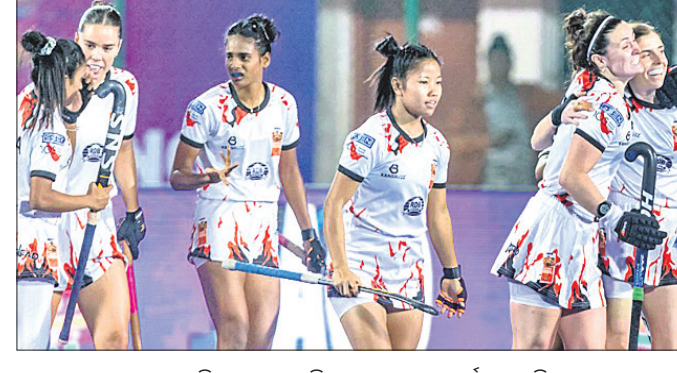
ମ୍ୟାଚ ବିଜୟରେ ଉଲ୍ଲାସିତ ବେଙ୍ଗଲ ଟାଇଗର୍ସ ଖେଳାଳି।

ସଂକ୍ଷିପ୍ତ ସ୍କୋର ଇଂଲଣ୍ଡ ୨୦ ଓଭରରେ ୧୩୨/୫ (ଜୋସ ବଟଲର-୬୮, ବରୁଣ ଚକ୍ରବର୍ତ୍ତୀ-୩/୨୩, ଅର୍ଶଦୀପ ସିଂ-୨/୧୭, ହାର୍ଦ୍ଦିକ ପାଣ୍ଡା-୨/୪୨, ଅକ୍ଷୟ ପଟେଲ-୨/୨୨)।