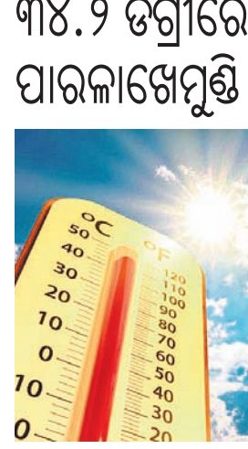
ଭୁବନେଶ୍ୱର, ୨୩।୧ (ଅନୁରାଧା ମହାରଣା)

ରାଜ୍ୟରେ ତାପମାତ୍ରା ବୃଦ୍ଧି ପାଇବାରେ ଲାଗିଛି । ଇଟିମଧ୍ୟରେ ଦିନ ତାପମାତ୍ରା ୩୫ ଡିଗ୍ରୀ ପାଖାପାଖି ବୃଦ୍ଧିଲାଗି । ରାତିରେ କୁହୁଡ଼ି ସାଧାରଣ ଜୀବନଯାତ୍ରାକୁ ପ୍ରଭାବିତ କରୁଥିବାବେଳେ ଦିନରେ ଚାଲି ଚାଲି ଖରା ଅନୁଭୂତ ହେଉଛି । ଗୁରୁବାର ବାଲେଶ୍ୱର, ଭଦ୍ରକ, କଟକ, ଜଗତସିଂହପୁର ଓ କେନ୍ଦ୍ରାପଡ଼ା ଆଦି ଜିଲ୍ଲାରେ ଘନ କୁହୁଡ଼ି ଦେଖିବାକୁ ମିଳିଥିବାବେଳେ ପାରଳାଖେମୁଣ୍ଡିରେ ସର୍ବାଧିକ ତାପମାତ୍ରା ୩୪.୨ ଡିଗ୍ରୀ ଓ ପୁଲିବାଣୀରେ ରାଜ୍ୟର ସର୍ବନିମ୍ନ ତାପମାତ୍ରା ୧୦ ଡିଗ୍ରୀ ରେକର୍ଡ କରାଯାଇଛି । ଉତ୍ତର ଉପକୂଳବର୍ତ୍ତୀ ଜିଲ୍ଲାଗୁଡ଼ିକର କିଛି ସ୍ଥାନରେ ଏବଂ ଉପକୂଳ ଓ ଦକ୍ଷିଣ ଆଭ୍ୟନ୍ତରୀଣ ଓଡ଼ିଶାରେ ଦୃଷ୍ଟାନ୍ତମୂଳକ ଭାବେ ରାତି ତାପମାତ୍ରା ବୃଦ୍ଧି ପାଇଛି । ଆସନ୍ତା ୩ଦିନରେ ତାପମାତ୍ରା ଆହୁରି ୨ରୁ ୪ ଡିଗ୍ରୀ ବଢ଼ିବା ନେଇ ଆଞ୍ଚଳିକ ପାଣିପାଗ ବିଜ୍ଞାନ କେନ୍ଦ୍ର ପକ୍ଷରୁ ପୂର୍ବାନୁମାନ କରାଯାଇଛି । ଶୁକ୍ରବାର ଜଗତସିଂହପୁର, କେନ୍ଦ୍ରାପଡ଼ା, ଭଦ୍ରକ, ବାଲେଶ୍ୱର, ଖୋର୍ଦ୍ଧା ଓ କଟକ ଜିଲ୍ଲାରେ ଘନ କୁହୁଡ଼ି ସମ୍ଭାବନା ରହିଥିବାରୁ ସମ୍ପୂର୍ଣ୍ଣ ଜିଲ୍ଲାଗୁଡ଼ିକୁ ଯେତେଲୋ ଫ୍ଲୋଡ଼ିଂ କାରି କରିଛି ପାଣିପାଗ କେନ୍ଦ୍ର ।