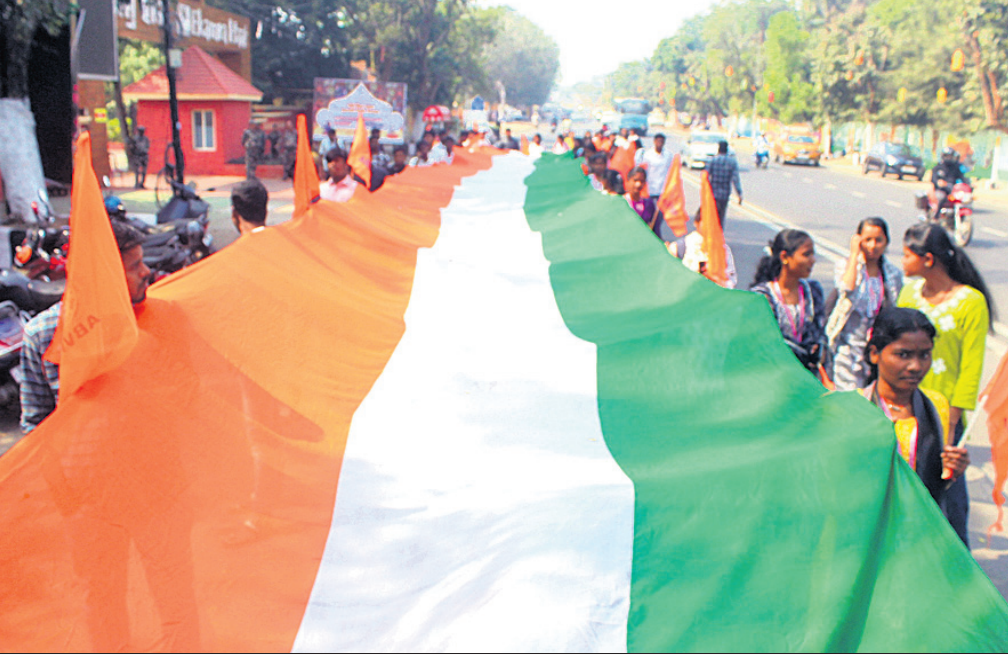
ଏକଜିପି ପକ୍ଷରୁ ଭାମ ମନ୍ଦିର ନିକଟରୁ ଲୋକମାନଙ୍କ ଦ୍ୱାରା ଅଭିମୁଖେ ବାହାରିଥିବା ମୁକ୍ତ ଉଦ୍‌ଘୋଷ ତ୍ରିରଙ୍ଗା ଶୋଭାଯାତ୍ରା।