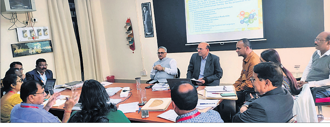
କର୍ମଶାଳାରେ ଏକଦି-୨୦୨୦ ସଂକ୍ରାନ୍ତରେ ବିଭିନ୍ନ ଗୁପ୍ତ ଆଲୋଚନା କରୁଛନ୍ତି।

ଭୁବନେଶ୍ୱର, ୨୩୧୧ (ପୁଷ୍ପିତା ସାହୁ) ରାଜ୍ୟରେ ଅଧିକ ପାଠ୍ୟକ୍ରମ ରହୁଥିବାରୁ ଛାତ୍ରାଛାତ୍ରୀଙ୍କ ମନରେ ଥିବା ଭୟ କାତୀୟ ଶିକ୍ଷା ନୀତି-୨୦୨୦ ଲାଗୁ ପରେ ଦୂର ହେବ। ସେମାନେ ପାଠକୁ ଯେପରି ସରଳ ଭାବେ ବୁଝିପାରିବେ ଓ ପଢ଼ିପାରିବେ ସେଥିପାଇଁ ସରକାର ଧ୍ୟାନ ଦେଇଛନ୍ତି। ତେଣୁ ଏହି ନୂଆ ଶିକ୍ଷା ନୀତି ଲାଗୁ ହେବା ପରେ ରାଜ୍ୟରେ ବ୍ରହ୍ମାଣ୍ଡର ଦ୍ୱାର କମିବ ବୋଲି ଆଶା କରାଯାଇଛି। ଏଥିସହ ଶିକ୍ଷକଙ୍କ ଶିକ୍ଷାଦାନ