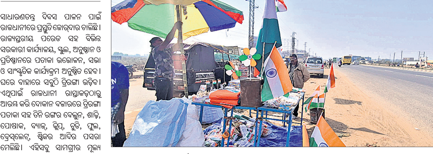
ଭୁବନେଶ୍ୱର, ୨୩।୧ (ସୌମ୍ୟରଞ୍ଜନ ରାଉତ)

ସାଧାରଣତନ୍ତ୍ର ଦିବସ ପାଳନ ପାଇଁ ରାଜଧାନୀରେ ପ୍ରସ୍ତୁତିକୋରଣ ଚାଲିଛି। ରାଜ୍ୟସ୍ତରୀୟ ପରେତ ସହ ବିଭିନ୍ନ ସରକାରୀ କାର୍ଯ୍ୟାଳୟ, ସ୍କୁଲ, ଅନୁଷ୍ଠାନ ଓ ପ୍ରତିଷ୍ଠାନରେ ପତାକା ଉତ୍ତୋଳନ, ସଭା ଓ ସାଂସ୍କୃତିକ କାର୍ଯ୍ୟକ୍ରମ ଅନୁଷ୍ଠିତ ହେବା ଘରେ ବାହାରେ ସବୁଠି ତ୍ରିରଙ୍ଗା ଉଡ଼ିବ।