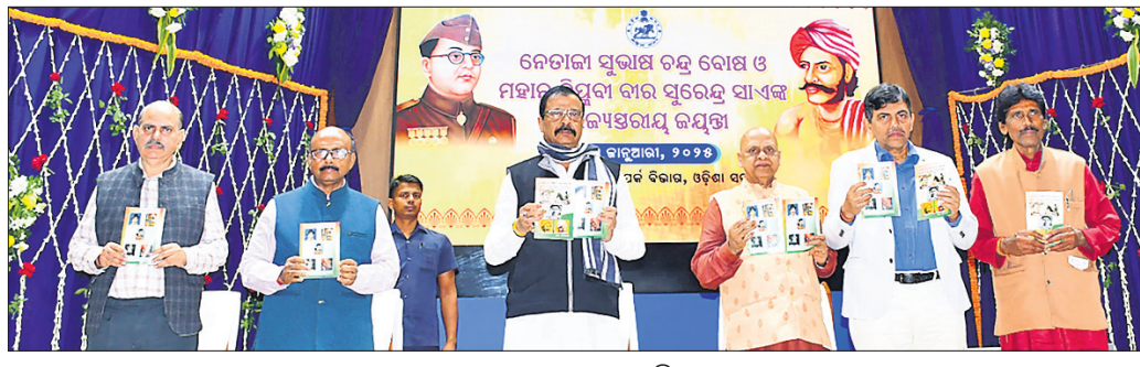
ରାଜ୍ୟସ୍ତରୀୟ ଜୟନ୍ତୀ ଉତ୍ସବରେ ରାଜ୍ୟ ମନ୍ତ୍ରୀ ସୁରେଶ୍ ପୂଜାରୀଙ୍କ ସହ ଅନ୍ୟ ଅତିଥିମାନେ।