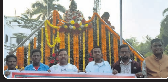
କଟକ ଓଡ଼ିଆ ବକାରିସ୍ଥିତ ନେତାଜୀ ସଂଗ୍ରହାଳୟଠାରେ ଥିବା ତାଙ୍କ ପ୍ରତିମୂର୍ତ୍ତିରେ ସମ୍ପାଦକ ପ୍ରତ୍ୟକ୍ଷ ସଂଘ ପକ୍ଷରୁ ଶ୍ରଦ୍ଧାଞ୍ଜଳି ଅର୍ପଣ ।

ଦିବ୍ୟାଙ୍ଗ ମୃତ୍ୟୁ ଘଟଣା, ତଦନ୍ତ ପାଇଁ ଆନାଧିକାରୀଙ୍କୁ ଦାବିପତ୍ର ମଲ୍ଲିକ-କଟକପୁର, ୨୩।୧ (ମାନସ ସାମଲ)