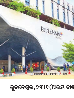
ଭୁବନେଶ୍ୱର, ୨୩୧୧ (ଅଭୟ ଦାଶ)

ନେକ୍ସଟ ଏସ୍ପ୍ଲାନେଡ଼ ମଳରେ 'ରିପବ୍ଲିକ୍ ଡେ' ସେଲ୍ ସମ୍ପର୍କରେ ଗୁରୁବାର ଘୋଷଣା କରାଯାଇଛି। ଏହି ସେଲ୍ ୨୦୨୪ ଜାନୁଆରୀ ୨୪ ରୁ ୨୬ ପର୍ଯ୍ୟନ୍ତ ଚାଲିବ ବୋଲି ନେକ୍ସଟ ଏସ୍ପ୍ଲାନେଡ଼ ବିସ୍ତୃତଭାବେ ସୂଚନା ଦିଆଯାଇଛି। ଭୁବନେଶ୍ୱରର ସବୁଠାରୁ ପସନ୍ଦର ଶିପି' ଡେ' ସେଲ୍ ସମ୍ପର୍କରେ ଘୋଷଣାକରି ଆମେ ବେଶ୍ ଖୁସି ଅନୁଭବ କରୁଛୁ। ଏହି ଅବସରରେ ଗ୍ରାହକମାନେ ନିଜ ପସନ୍ଦର ବ୍ରାଣ୍ଡ ଉପରେ ସର୍ବୋତ୍ତମ ରିହାତି ପାଇପାରିବେ ଏବଂ ପ୍ଲୁଟ୍ ୫୦% ସହ ଏହା ସହରର ସମଗ୍ର ପାଇଁ ଚୁଡ଼ାନ୍ତ ଶିପି' ସୁଯୋଗ ପାଇପାରିବେ। ସେହିଭଳି ଏହି ସେଲ୍ରେ ଶୀର୍ଷ ଅନ୍ତର୍ଜାତୀୟ ଏବଂ ଭାରତୀୟ ବ୍ରାଣ୍ଡଗୁଡ଼ିକ ଅଂଶଗ୍ରହଣ କରୁଥିବାରୁ ପ୍ୟାସନ, ସେଲ୍, ଗୋଡା ଏବଂ ଏଫ୍ ଆଣ୍ଡ ବି ଉତ୍ପାଦରେ ୧୦୦ରୁ ଅଧିକ ବ୍ରାଣ୍ଡ ଉପରେ ଅତୁଳନୀୟ ଡିଲ୍ ଉପଲବ୍ଧ ହେଉଛି, ଯାହା ସମଗ୍ର ପାଇଁ କିଛିନା କିଛି ସୁନିଶ୍ଚିତ କରିବ।