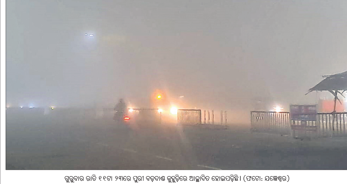
ଗୁରୁବାର ରାତି ୧୧ଟା ୨୩ରେ ପୁରୀ ବଡ଼ବାଣ୍ଟ କୁଡ଼ୁଡ଼ିରେ ଆଲ୍ଲାଦିତ ହୋଇପଡ଼ିଛି।

ରାଜ୍ୟରେ ବିଭିନ୍ନ ଆଞ୍ଚଳିକ ଭାଷାର ବ୍ୟବହାର ହେଉଥିବାରୁ ନୂଆ ପାଠ୍ୟକ୍ରମରେ ସେହି ଭାଷାଗୁଡ଼ିକୁ ଗୁରୁତ୍ୱ ଦିଆଯିବ। ରାଜ୍ୟରେ କାତୀୟ ଶିକ୍ଷା ନୀତି ୨୦୨୦ର କାର୍ଯ୍ୟକାରୀତା ନେଇ ଭୁବନେଶ୍ୱରସ୍ଥିତ ଆଞ୍ଚଳିକ ଶିକ୍ଷା ପ୍ରତିଷ୍ଠାନରେ ଚାଲିଥିବା ଚିନ୍ତିନା କର୍ମଶାଳାର ଗୁରୁବାର ଶେଷ ଦିନରେ ଏସବୁ ଉପରେ ଦୃଷ୍ଟି ଗୁପ୍ତ ବିସ୍ତୃତ ଆଲୋଚନା କରିଛନ୍ତି। ପ୍ରାରମ୍ଭିକ ପର୍ଯ୍ୟାୟ, ମଧ୍ୟ ଏବଂ ମାଧ୍ୟମିକ ପର୍ଯ୍ୟାୟ, ମାଧ୍ୟମିକ ପର୍ଯ୍ୟାୟ-୨ ଭିତ୍ତିରେ ଛାତ୍ରାଛାତ୍ରୀଙ୍କ ପାଠ୍ୟକ୍ରମ ଉପରେ ଧ୍ୟାନ ଦିଆଯାଇଥିଲା। ବିଦ୍ୟାଳୟ ପରିଚାଳନା ଓ ବିଦ୍ୟାଳୟସ୍ତରୀୟ କିପରି ଛାତ୍ରାଛାତ୍ରୀ ଐତିହ୍ୟ ସମ୍ପର୍କରେ ଜାଣିପାରିବେ ସେନେଇ ଆଲୋଚନା ହୋଇଥିଲା। ସେହିପରି ଶିଶୁବାଚିକା ପରିଚାଳନା ଓ ଶିକ୍ଷକଙ୍କ ଦକ୍ଷତା ବୃଦ୍ଧି, ଉଚ୍ଚ ମାଧ୍ୟମିକ ଶିକ୍ଷାନୁଷ୍ଠାନଗୁଡ଼ିକର ଭିତ୍ତିଭୂମି ବିକାଶ, ସୂଚନା ଏବଂ ଯୋଗାଯୋଗ ପ୍ରଯୁକ୍ତିବିଦ୍ୟା ଏବଂ ଇଣ୍ଟରନେଟ ସଂଯୋଗକରଣ ସମ୍ପର୍କରେ ପ୍ରୋଜେକ୍ଟେଶନ ମାଧ୍ୟମରେ ଆଲୋଚନା କରାଯାଇଥିଲା। ପ୍ରଶାସନିକ ଅଧିକାରୀଙ୍କ ବିବିଧତା କାର୍ଯ୍ୟକ୍ରମରେ ନୂତନ ଶିକ୍ଷକପ୍ରଣାଳୀ ବିଷୟରେ ଶିକ୍ଷକଙ୍କୁ ସଚେତନ କରିବା ନେଇ ଗୁପ୍ତଚିକିତ୍ସା ନିଜ ମତ ପ୍ରକାଶ କରିଛନ୍ତି।