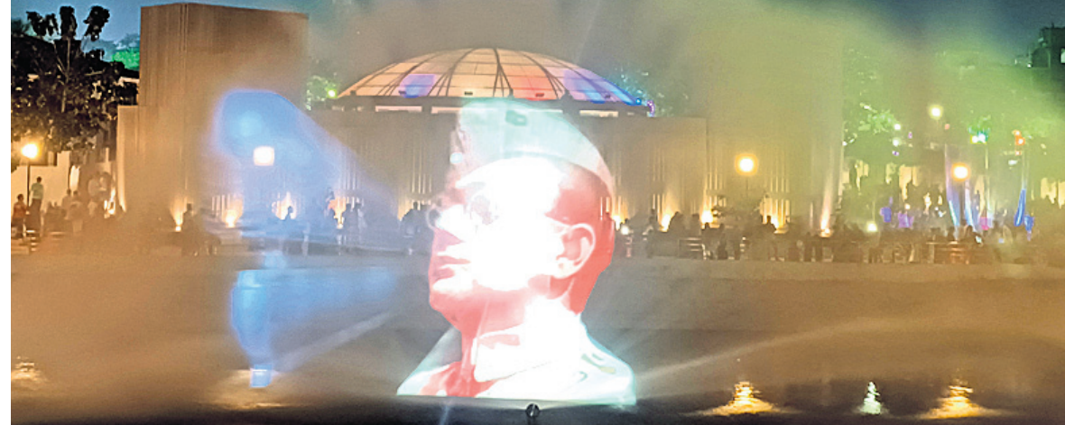
ନେତାଜୀ ଜୟନ୍ତୀ ଅବସରରେ କଟକ ଓଡ଼ିଆ ବକାରିସ୍ଥିତ ନେତାଜୀ ବ୍ୟାଖ୍ୟାନ କେନ୍ଦ୍ର ପରିସରରେ ରୁରୁବାର ଅନୁଷ୍ଠିତ କଲେଜ ସୋ ।