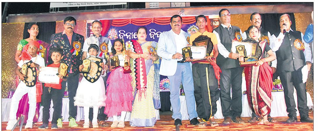
ପୁରୀ ମଧୁବନସ୍ଥିତ ବିନାୟକ ବିଦ୍ୟାଳୟରେ ଚତୁର୍ଦ୍ଦଶମ ବାର୍ଷିକ ଉତ୍ସବରେ କୃତୀ ଛାତ୍ରାଛାତ୍ରୀ ଓ ପ୍ରତିଯୋଗୀଙ୍କୁ ଅତିଥି ପୁରସ୍କାର ପ୍ରଦାନ କରୁଛନ୍ତି ।