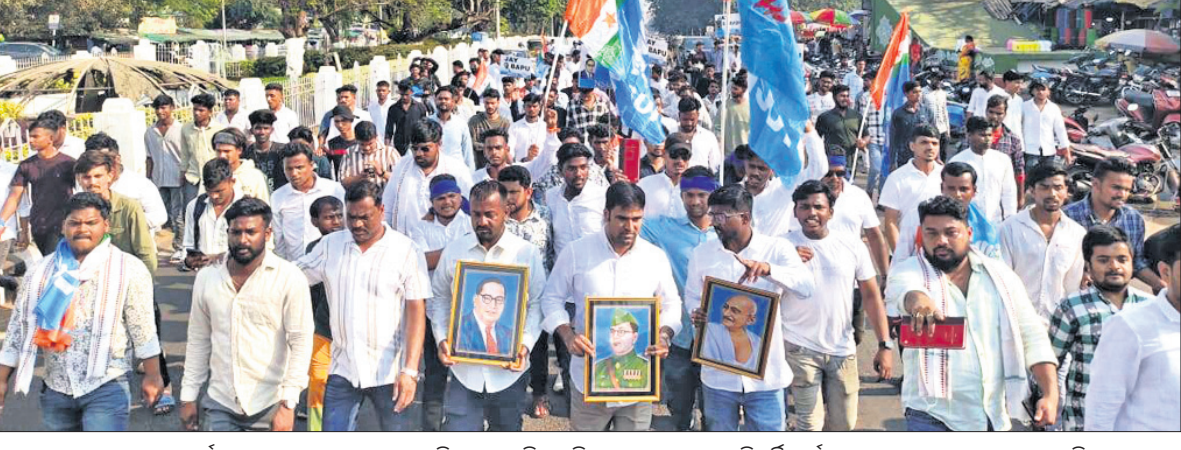
ଛାତ୍ର କଂଗ୍ରେସ କର୍ମୀମାନେ ଗୁରୁବାର ମାଷ୍ଟର କ୍ୟାମ୍ପିନଠାକୁ ଏକ ଛକସ୍ଥିତ ଆନ୍ଦୋଳନ ପ୍ରତିମୂର୍ତ୍ତି ପର୍ଯ୍ୟଟ ଏକ ଶୋଭାଯାତ୍ରାରେ ଯାଉଛନ୍ତି।