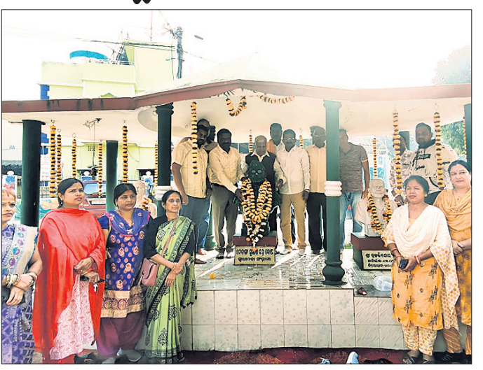
ଭୁବନେଶ୍ୱର, ୨୩।୧ (ବନ୍ଦନା ସେଠୀ)

ନେତାଜୀ ମୁକ୍ତ ସଂଘର ୫୭ତମ ବାର୍ଷିକ ଉତ୍ସବ ଓ ୧୨୮ତମ ନେତାଜୀ ଜୟନ୍ତୀ ସଂଘ ପରିସରରେ ଅନୁଷ୍ଠିତ ହୋଇଯାଇଛି। ପତାକା ଉତ୍ତୋଳନ ପରେ ଅତିଥିମାନେ ସ୍ୱାଧୀନତା ସଂଗ୍ରାମରେ ନେତାଜୀଙ୍କ ଅବଦାନର ସ୍ମୃତିଚାରଣ କରିଥିଲେ।