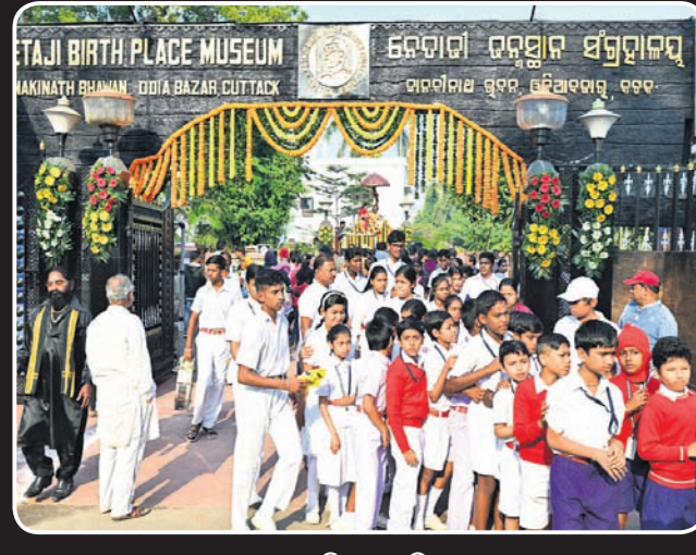
ନେତାଜୀ ଜନ୍ମସ୍ଥାନ ସଂଗ୍ରହାଳୟ ବୁଲିବାକୁ ଆସିଥିବା ଛାତ୍ରାଛାତ୍ରୀ ଓ ଅନ୍ୟମାନେ ।