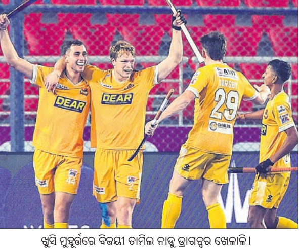
ଶୁଭ୍ ପୁହୁର୍ରେ ବିଜୟୀ ତାମିଲ ନାଡୁ ଡ୍ରାଗନ୍ସର ଖେଳାଳି।

ଭୁବନେଶ୍ୱର, ୨୩।୧ (ବିଜୟ ରଣା) ରାଉରକେଲାସ୍ଥିତ ଦିର୍ଦ୍ଧା ପୁଣ୍ଡା ଷ୍ଟାଡ଼ିୟମରେ ଗୁରୁବାର ଖେଳାଯାଇଥିବା ପୁରୁଷ ହକି ଇଣ୍ଡିଆ ଲିଗ୍ (ଏନ୍.ଆଇ.ଏଲ୍)ର ଏକ ମ୍ୟାଚରେ ତାମିଲ ନାଡୁ ଡ୍ରାଗନ୍ସ ୪-୩ ଶୁଭ୍ ଆଉଟରେ ହାଇଡ୍ରାବାଦକୁ ପରାସ୍ତ କରିଛି। ତାମିଲନାଡୁ ଡ୍ରାଗନ୍ସ ଗର୍ଭି ଦଳକୁ ନେଇ ଷ୍ଟାଡ଼ିୟମ ଗର୍ଭି ମ୍ୟାଚରୁ ୧୭ ପଏଣ୍ଟ ସହ ପ୍ରଥମ ସ୍ଥାନ ଅଧିକାର କରି ନେଇଛି। ଅନ୍ୟପକ୍ଷରେ ଚୁଡ୍ଡା ଦଳ ସମାନ ସଂଖ୍ୟକ ମ୍ୟାଚରୁ ୧୪ ପଏଣ୍ଟ ସହ