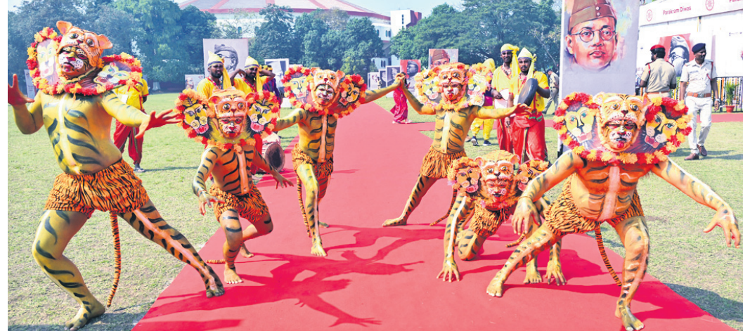
କଟକ ସତ୍ୟକ୍ରମ ଷ୍ଟୁଡିଓମରେ ରୁରୁବାର ପରାକ୍ରମ ଦିବସ ପାଳନ ଅବସରରେ ପରିବେଷିତ ବାନ୍ଧ ନୃତ୍ୟ ।