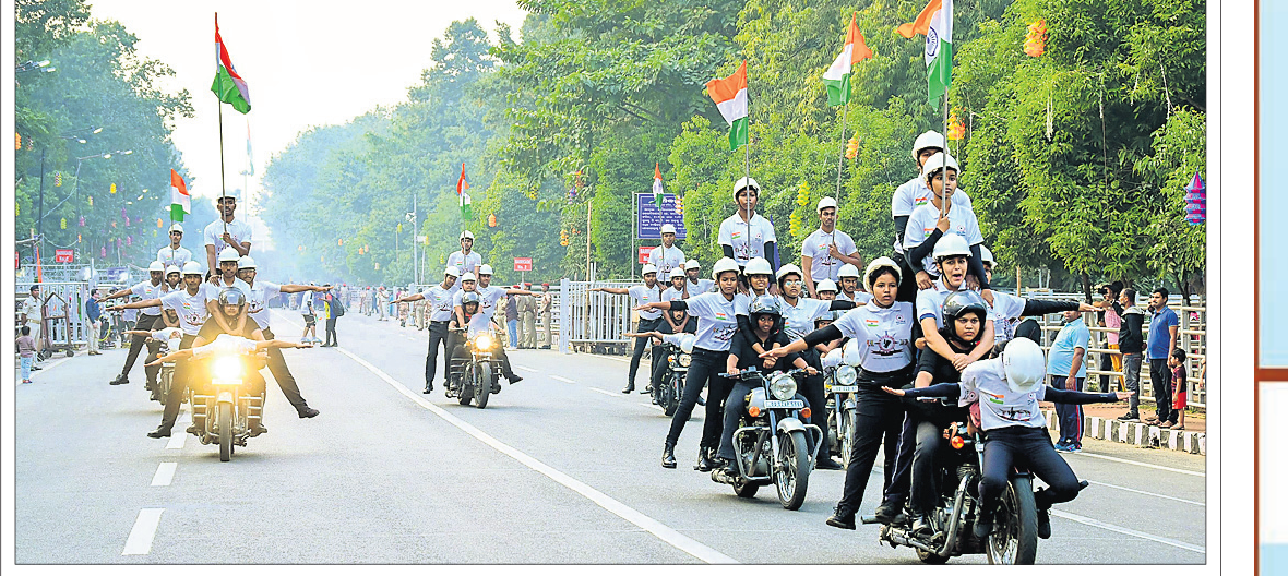
ରାଜ୍ୟସ୍ତରୀୟ ସାଧାରଣତନ୍ତ୍ର ଦିବସ ପାଇଁ ଭୁବନେଶ୍ୱର ଗାନ୍ଧୀ ମାର୍ଗରେ ଚାଲିଥିବା ଅଭ୍ୟାସ ପରେ ଡେୟାର ଡେଭିଲ୍ ଶୋ' ।