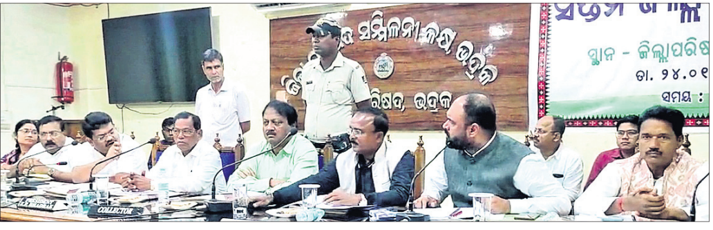
ଜିଲା ପରିଷଦ ବୈଠକରେ ବିଧାୟକମାନଙ୍କ ମଧ୍ୟରେ ଯୁକ୍ତିତର୍କ ଚାଲିଛି।