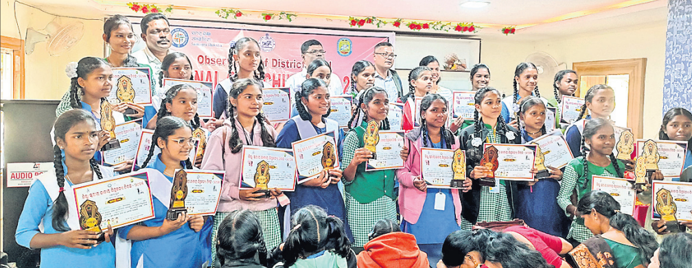
ଅତିଥିଙ୍କ ସହ ପ୍ରମାଣପତ୍ର ପାଇଥିବା ଛାତ୍ରୀ ।