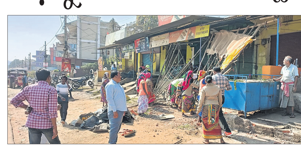
ଯୌର ପ୍ରଶାସନ ପକ୍ଷରୁ ଜବରଦଖଲ ଉଦ୍ଧେଦ କରାଯାଇଛି ।

ସୁନାବେଡା ଓ ସେମିଲିଗୁଡ଼ା ରାଜପଥର ଉଭୟ ପାର୍ଶ୍ୱକୁ ଜବରଦଖଲ ଉଦ୍ଧେଦ କରାଯାଇଛି। ଯୌର ପ୍ରଶାସନ ପକ୍ଷରୁ ଶୁଭଚାର ଉଦ୍ଧେଦ ସହର ଦେଇ ଯାଇଥିବା ଜାତୀୟ ରାଜପଥ ରାସ୍ତା କଡ଼ରେ ବ୍ୟବସାୟ କରୁଥିବା ଉଠା ଦୋକାନୀ ଏବଂ ରାସ୍ତା କଡ଼ ଡ୍ରେନ୍ ଉପରେ ଦେଆଇନ ନିର୍ମାଣ ସହ ରାସ୍ତା ଉପରେ ଲାଗାଉଥିବା ସାଇଡ୍ ବୋର୍ଡ୍ ଭଳି ସମସ୍ତ ଅବରୋଧ ତଥା ଜବରଦଖଲ କେସିଟି ସାହାଯ୍ୟରେ ଉଦ୍ଧେଦ କରାଯାଇଛି। ଗାଁଛାଡ଼ି ବହୁ ଦିନରୁ ରାସ୍ତା ଅବରୋଧ କରି ରହିଥିବା ଗ୍ରାମିକ ଚେଷ୍ଟାକୁ ମଧ୍ୟ ଉଦ୍ଧେଦ କରାଯାଇଛି। ଜବରଦଖଲ ଉଦ୍ଧେଦ ସମୟରେ ଯୌର ପରିଷଦ ନିର୍ବାହୀ ଅଧିକାରୀ ନାରାୟଣ