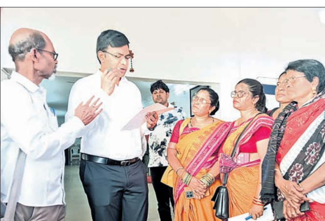
ସଂଘର କର୍ମକର୍ତ୍ତା ଜିଲାପାଳଙ୍କ ସହ ଆଲୋଚନା କରୁଛନ୍ତି ।