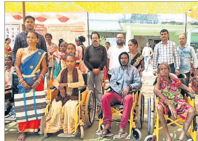
ସହାୟତା ପାଇଥିବା ହିତାଧିକାରୀ।