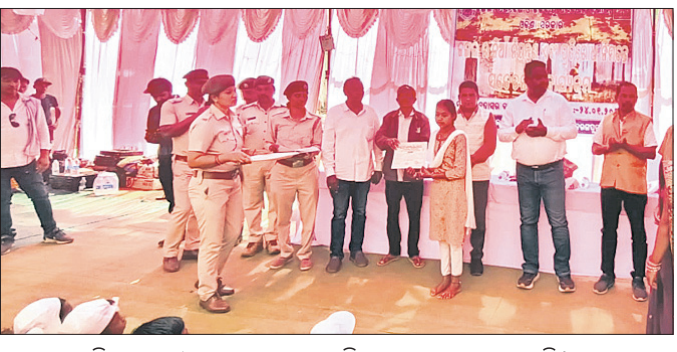
ଛତୁ ଚାଷ କରି ସ୍ୱାକ୍ଷର ହୋଇଥିବା ଜଣେ ମହିଳାଙ୍କୁ ପୁରସ୍କୃତ କରାଯାଇଛି।