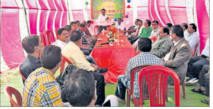
ବୈଠକରେ ଆଲୋଚନା ଚାଲିଛି।