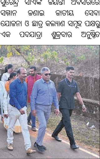
ଓଡ଼ିଶା କେନ୍ଦ୍ରୀୟ ବିଶ୍ୱବିଦ୍ୟାଳୟ ପକ୍ଷରୁ ପଦଯାତ୍ରା କରାଯାଇଛି।

କୋରାପୁଟ ଓଡ଼ିଶା କେନ୍ଦ୍ରୀୟ ବିଶ୍ୱବିଦ୍ୟାଳୟ ପରିସର ଏକାଡେମିକ୍ ବ୍ଲକ୍-୩ରେ ନେତାଜୀ ସୁଭାଷ ଚନ୍ଦ୍ର ବୋଷ ଓ ବୀର ସୁରେନ୍ଦ୍ର ସାଏଙ୍କ ଜୟନ୍ତୀ ଅବସରରେ ଯୋଜନା କରାଯାଇଥିବା ସେବା ଯୋଜନା ଓ ଛାତ୍ର କଳ୍ୟାଣ ସମୂହ ପକ୍ଷରୁ ଏକ ପଦଯାତ୍ରା ଶୁକ୍ରବାର ଅନୁଷ୍ଠିତ