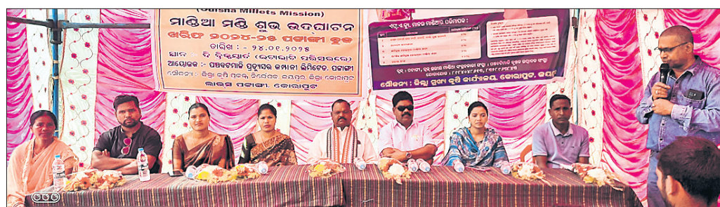
କାର୍ଯ୍ୟକ୍ରମରେ ଉପସ୍ଥିତ ଅତିଥି ।