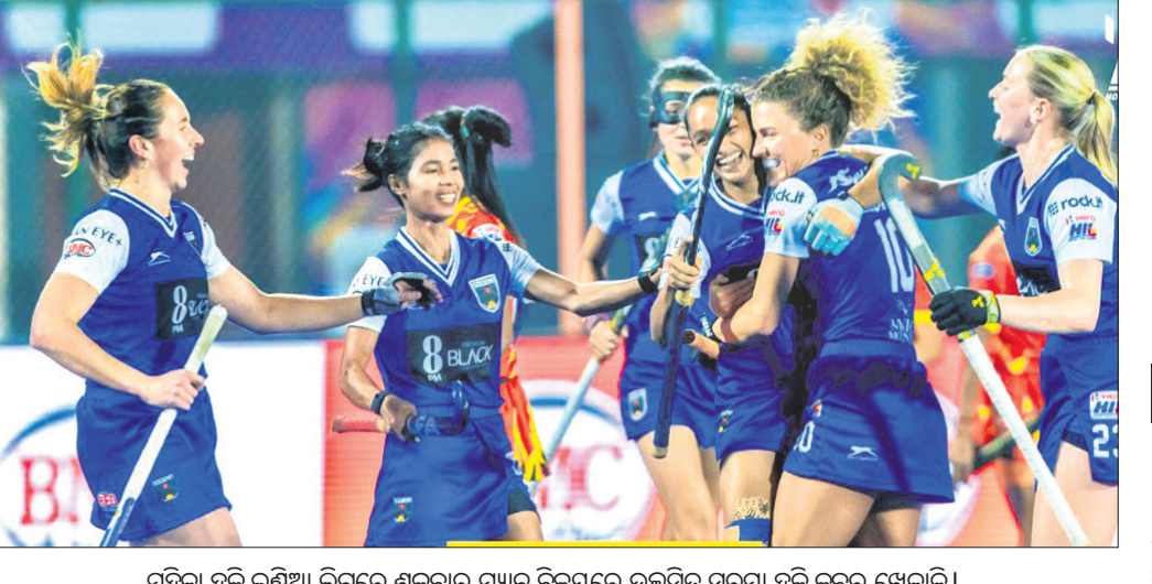
ମହିଳା ହକି ଇଣ୍ଡିଆ ଲିଗରେ ଶୁକ୍ରବାର ମ୍ୟାଚ ବିଜୟରେ ଉଲ୍‌ସିତ ସୁରମା ହକି କ୍ଳବର ଖେଳାଳି