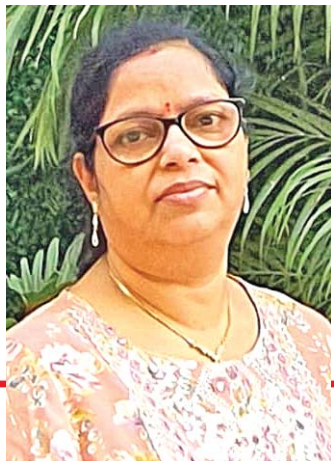
ଗାଳ୍ପିକା କଳ୍ପନା ପରିଡ଼ା ନିଜ ପ୍ରଥମ ରୋଜଗାର ସମ୍ପର୍କରେ ଯାହା କୁହନ୍ତି...

ଅଧକରେ ଓକେ ହୋଇଗଲା। ବୁଦ୍ଧ ସାର୍ କହିଲେ, 'ବହୁତ ଭଲ ଆବୃତ୍ତି କଲ। ଟିକେ ଅପେକ୍ଷା କର, ପେମେଣ୍ଟ ନେଇକି ଯିବ, ପୋଷ୍ଟରେ ପଠେଇଲେ ଡେରିହେବ।' ପେମେଣ୍ଟ ମାନେ ପଇସା ମିଳିବ ଭାବି ମନେ ମନେ ଭାରି ଖୁସି ହୋଇଯାଇଥିଲି। ହେଲେ ଯେତେବେଳେ ସାର୍ ୫୦ ଟଙ୍କାର ଚେକଟିଏ ଦେଇ କହିଲେ, 'ବାପାଙ୍କୁ ନେଇ ଏଇଟା ଦେଇଦେବ, ସେ ଆକାଉଣ୍ଟରେ ଡିପୋଜିଟ୍ କଲେ ପଇସା ଆସିଯିବ।' ମୋ ମନ ମଉଜିଗଲା। ଚେକକୁ ବ୍ୟାଙ୍କରେ ଡିପୋଜିଟ୍ କଲେ ସିନା ପଇସା ଆସିବ, ହେଲେ ବାପାଙ୍କର ତ ଆକାଉଣ୍ଟ ହିଁ ନ ଥିଲା। ଆଜିକାଲି ଭଳିଆ ସେତେବେଳେ ଦରମା ବ୍ୟାଙ୍କ ଆକାଉଣ୍ଟକୁ ଆସୁ ନ ଥିଲା। ନଗଦ ଟଙ୍କା ମିଳୁଥିଲା। ତା' ମାନେ ନୁହେଁ ଯେ ସେବେ କାହାର ବି ବ୍ୟାଙ୍କ ଆକାଉଣ୍ଟ ନ ଥିଲା। ପ୍ରାୟ ସମସ୍ତଙ୍କର ଥିଲା କହିଲେ ଚଳେ। ହେଲେ ମୋ ବାପାଙ୍କର କିନ୍ତୁ ସଞ୍ଚୟ କରିବାର ପ୍ରବୃତ୍ତି ଆସି ନ ଥିଲା। ମାତ୍ର ଆରମ୍ଭରୁ ଶେଷ ପର୍ଯ୍ୟନ୍ତ ବାପାଙ୍କ ଦରମା ତାଙ୍କ ପକେଟରେ ହିଁ ରହୁଥିଲା। ତେଣୁ ବାପାଙ୍କ ଶୀର୍ଷ ପକେଟ ହିଁ ଆମର ବ୍ୟାଙ୍କ ଥିଲା। ସେଇଥିରୁ ସବୁ କାରବାର। ଏବେ ମୋର ଭାଲେଣି ପଢ଼ିଲା, ଚେକକୁ କେମିତି ପଇସା ଆସିବ। ପଢ଼ିଶାଘରର ପଞ୍ଚନାୟକ ମଉସା ଦେଲେ ଭରସା। ସେ ଚେକଟା ନେଇ ତାଙ୍କ ଆକାଉଣ୍ଟରେ ଡିପୋଜିଟ୍ କରିଦେବେ କହି ମୋତେ ୫୦ ଟଙ୍କା ଦେଇଦେଲେ। ମୁଁ ବି ତାଙ୍କୁ ଚେକ ଦେଇଦେଲି। ସେତେବେଳେ ୫୦ ଟଙ୍କା ବି ବହୁତ ଥିଲା। ସେ ପଇସାରେ ମୁଁ ଓ ମୋର ସାନଭାଇ ମାଜଣ ଏବଂ ପଢ଼ିଶାଘରର ଷଭାଭଉଣୀ ମିଶି ଦୋଷା ଆଣି ଖାଇଥିଲୁ। ଖୁବ୍ ସୁନ୍ଦର ଥିଲା ସେ ଦିନସବୁ। ତା'ପରେ ବି ଆଉ କେତେଥର କବିତା ଆବୃତ୍ତି କରି ଟଙ୍କା ପାଇଥିଲି, କିନ୍ତୁ ସେଥିରେ ପ୍ରାୟ ଓଡ଼ିଆ ପତ୍ରପତ୍ରିକା କିଣୁଥିଲି। ପରେ ଯେତେବେଳେ ବ୍ରହ୍ମପୁରରେ ପଢ଼ିଲି ସେଠି ନୂଆକରି