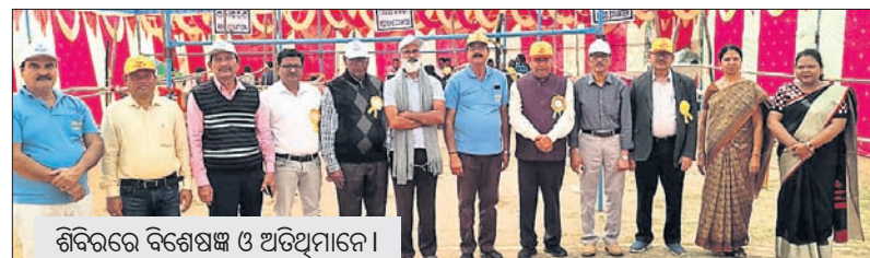
ଶିବିରରେ ବିଶେଷଜ୍ଞ ଓ ଅତିଥିମାନେ।