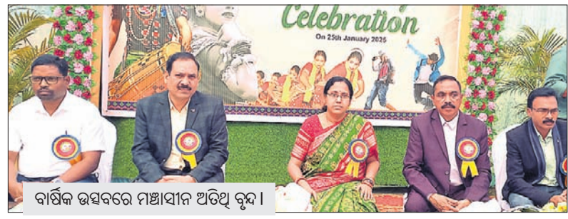
ବାର୍ଷିକ ଉତ୍ସବରେ ମଞ୍ଚାଧୀନ ଅତିଥି ବୃନ୍ଦ।