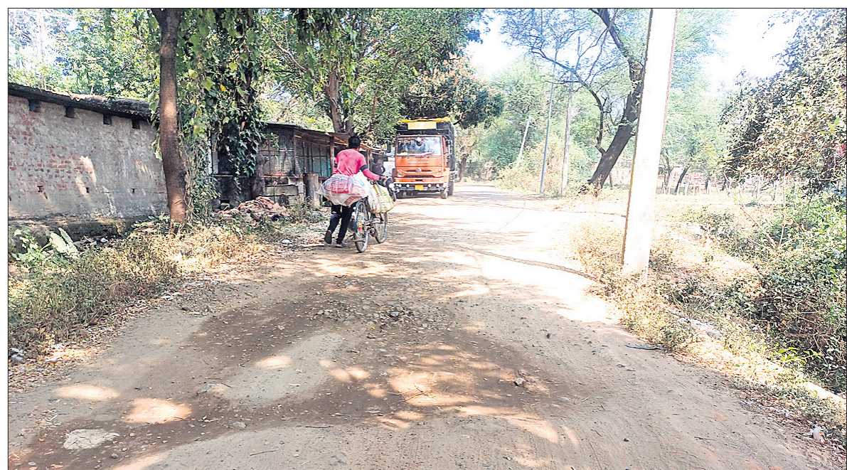
ପିଚୁ ଉପାୟାଧିକାରୀ ରାସ୍ତା ।