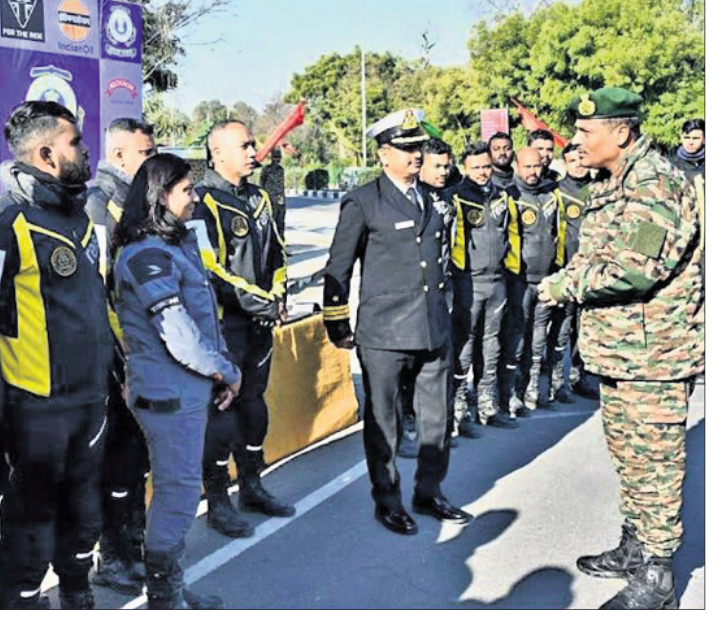
ଅଭିଯାନ ଜାରି ରହିଛି। 'ଏକ ପେଦ ମା କେ ନାମ୍', 'ବେଟି ବଗାଓ ବେଟି ପଡ଼ାଓ', 'ଶୁଭ ଭାରତ ଅଭିଯାନ' ଆଦିର ପ୍ରଚାର ସମ୍ପର୍କରେ ଅବଗତ କରାଇବା ପାଇଁ ଏହି ମତ ଦିନିମୟ କାର୍ଯ୍ୟକ୍ରମରେ ଉଭୟ ମହିଳା ଓ ପୁରୁଷଙ୍କୁ ସେନାବାହିନୀରେ ଯୋଗଦେବାକୁ ପ୍ରୋତ୍ସାହିତ କରାଯିବ ବୋଲି ସୂଚନା ଦିଆଯାଇଛି।