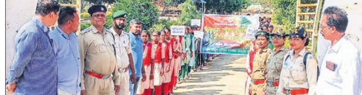
କାର୍ଯ୍ୟକ୍ରମରେ ବନ ବିଭାଗ କର୍ମଚାରୀ ଓ ଛାତ୍ରଛାତ୍ରୀ ।