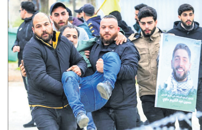
ଦକ୍ଷିଣ ଲେବାନନ୍ରୁ ଇସ୍ରାଏଲ ନିକଟ ସୈନ୍ୟ ପ୍ରତ୍ୟାହାର କରି ନ ଥିବାରୁ ଏହି ନିଷ୍ଠିତ ନିଆଯାଇଥିବା ଆମେରିକା ସହାୟତା ପକ୍ଷରୁ କାରି ବିକ୍ଷେପ ଅନୁଯାୟୀ, ୧୮ ପର୍ଯ୍ୟନ୍ତ ବଦାଇ ଦିଆଯାଇଛି।

ଦକ୍ଷିଣ ଲେବାନନ୍ରେ ସୋମବାର ବିସ୍ଫୋରଣରେ ଲେବାନନ୍ ନାଗରିକଙ୍କ ଉପରକୁ ଇସ୍ରାଏଲୀ ସେନା ଗୁଳି ବଳାକାବାରୁ ୨୨ ଜଣଙ୍କର ମୃତ୍ୟୁ ହୋଇଥିବାବେଳେ ୧୨୪ ଆହତ ହୋଇଛନ୍ତି। ଲେବାନନ୍ ଓ ଇସ୍ରାଏଲ ମଧ୍ୟରେ ହୋଇଥିବା ଅସ୍ତବିରତି ରୁକ୍ନିନାମା ଅନୁଯାୟୀ, ଦକ୍ଷିଣ ଲେବାନନ୍ରୁ ଇସ୍ରାଏଲ ସୈନ୍ୟ ପ୍ରତ୍ୟାହାର କରୁ ବୋଲି ଦାବି କରି ଏହି ପ୍ରତିବାଦ କରାଯାଇଥିଲା। ମୃତକଙ୍କ ମଧ୍ୟରେ ୨ ମହିଳା ଥିବାବେଳେ ଲେବାନନ୍ ସେନାର ଜଣେ ସର୍ବାଧିକ ସମୟ ରହିଛନ୍ତି ବୋଲି ଲେବାନନ୍ର ସ୍ୱାସ୍ଥ୍ୟ ମନ୍ତ୍ରାଳୟ ସୂଚନା ଦେଇଛି। ତେବେ ଉକ୍ତ ଘଟଣାକୁ ନେଇ ଇସ୍ରାଏଲୀ ସେନା କହିଛି। ସେପରେ ଇସ୍ରାଏଲ-ହେକ୍ସୋଗ୍ରାମ ମଧ୍ୟରେ ଅସ୍ତବିରତି ରୁକ୍ନିନାମାକୁ ଫେଡ଼ୁଆରୀ ୧୮ ପର୍ଯ୍ୟନ୍ତ ବଦାଇ ଦିଆଯାଇଛି।