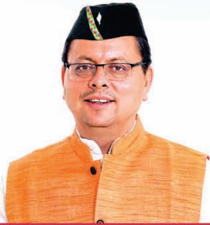
Pushkar Singh Dhami Chief Minister, Uttarakhand