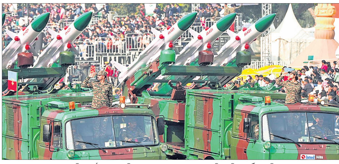
ନୂଆଦିଲ୍ଲୀର କର୍ତ୍ତବ୍ୟପଥରେ ଅନୁଷ୍ଠିତ ପରେଡ଼ରେ ସେନା ପକ୍ଷରୁ ଆକାଶ ଏୟାର ଡିଫେନ୍ସ ସିଷ୍ଟମ ପ୍ରଦର୍ଶିତ ହେଉଛି।

ପ୍ରଧାନମନ୍ତ୍ରୀ ନରେନ୍ଦ୍ର ମୋଦି ସୋମବାର ଆମେରିକା ରାଷ୍ଟ୍ରପତି ଡୋନାଲ୍ଡ ଟ୍ରମ୍ପଙ୍କ ସହ ଫୋନ୍ ଯୋଗେ କଥା ହୋଇଛନ୍ତି। ଟ୍ରମ୍ପ ଦ୍ୱିତୀୟ ଥର ରାଷ୍ଟ୍ରପତି ଭାବେ ଦାୟିତ୍ୱ ଗ୍ରହଣ କରିବା ପରେ ମୋଦି ତାଙ୍କ ସହ ପ୍ରଥମ ଥର କଥା ହୋଇଛନ୍ତି। ରାଷ୍ଟ୍ରପତି ନିର୍ବାଚନରେ ଟ୍ରମ୍ପଙ୍କ ଐତିହାସିକ ବିଜୟ ପାଇଁ ପ୍ରଧାନମନ୍ତ୍ରୀ ତାଙ୍କୁ ଅଭିନନ୍ଦନ ଜଣାଇଛନ୍ତି। ଉଭୟ ନେତା ବିଶ୍ୱସ୍ତ ଭାଗାବାର ପାଇଁ ପ୍ରତିଶ୍ରୁତିଦେଇଛନ୍ତି। ଆମ ଲୋକମାନଙ୍କ କଲ୍ୟାଣ ତଥା ବିଶ୍ୱ ଶାନ୍ତି, ସମୃଦ୍ଧି ଓ ସୁରକ୍ଷା ପାଇଁ ଆମେ ଏକାଠି କାର୍ଯ୍ୟ କରିବୁ ବୋଲି ପ୍ରଧାନମନ୍ତ୍ରୀ ଏହି ଲେଖିଛନ୍ତି।