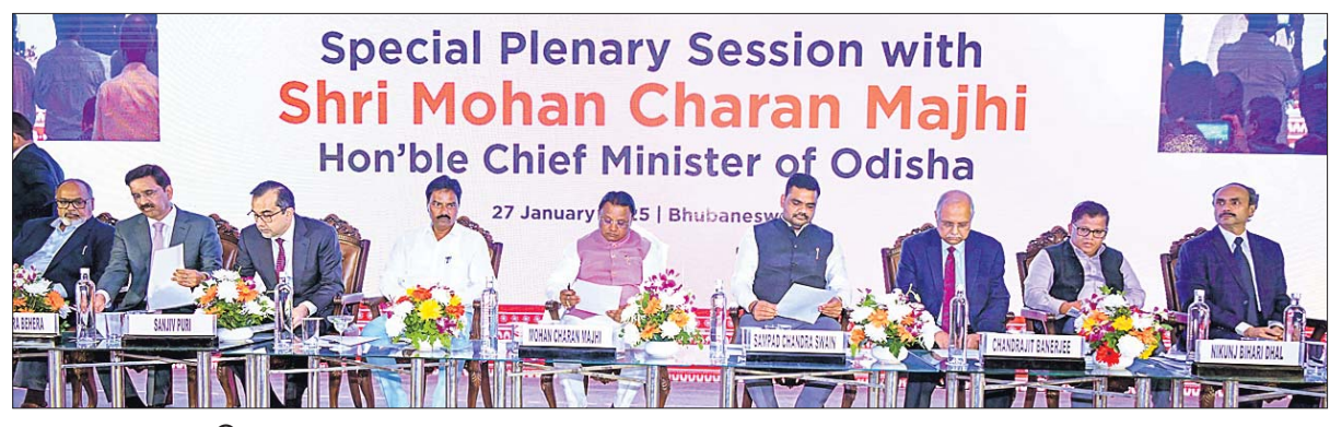
Special Plenary Session with Shri Mohan Charan Majhi Hon'ble Chief Minister of Odisha 27 January 2025 | Bhubaneswar

■ ଲୋକଙ୍କ ଆର୍ଥିକ ବିକାଶ ପାଇଁ ନିବେଶ କରିବାକୁ ଶିଳ୍ପପତିଙ୍କୁ ଆହ୍ୱାନ ■ ସିଆଇଆଇ ଜାତୀୟ ଅଂଶୀଦାର