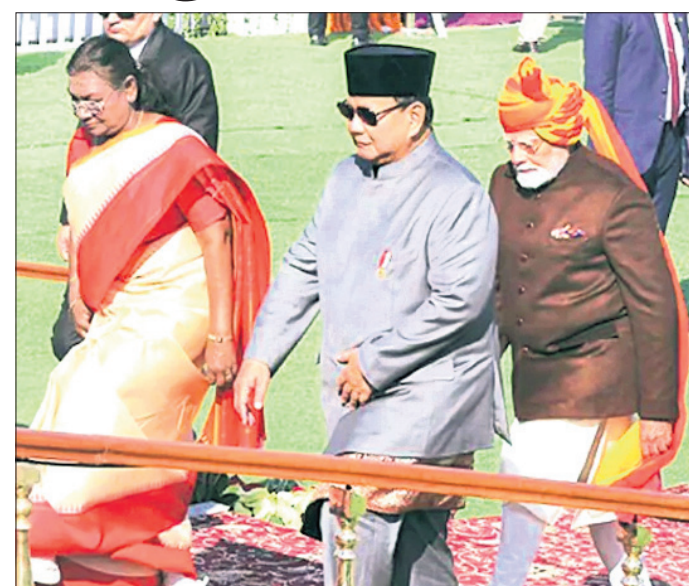
ରାଷ୍ଟ୍ରପତି ଦ୍ରୌପଦୀ ମୂର୍ତ୍ତିଙ୍କ ସହ ସାଧାରଣତନ୍ତ୍ର ଦିବସର ମୁଖ୍ୟ ଅତିଥି ଇଣ୍ଡୋନେସିଆ ରାଷ୍ଟ୍ରପତି ପ୍ରାବୋଡ଼ୋ ସୁବିଆନ୍ତୋ ଏବଂ ପ୍ରଧାନମନ୍ତ୍ରୀ ନରେନ୍ଦ୍ର ମୋଦି।

୨୭ତମ ସାଧାରଣତନ୍ତ୍ର ଦିବସ ଅବସରରେ ରବିବାର ନୂଆଦିଲ୍ଲୀର କର୍ତ୍ତବ୍ୟପଥରେ ଅନୁଷ୍ଠିତ ପରେଡ଼ରେ ଭାରତ ଏହାର ସାମରିକ ସାମର୍ଥ୍ୟ ଏବଂ ସାଂସ୍କୃତିକ ଐତିହ୍ୟ ପ୍ରଦର୍ଶନ କରିଛି। ୩ ବାହିନୀର ସୈନ୍ୟଙ୍କ ସମେତ ଅର୍ଦ୍ଧସାମରିକ ବାହିନୀର ଯବାନମାନେ ସୋମବାର କର୍ତ୍ତବ୍ୟପଥରେ ସାମରିକ ଦେଖାଇଥିଲେ। ସାଧାରଣତନ୍ତ୍ର ଦିବସ ଉତ୍ସବରେ ଇଣ୍ଡୋନେସିଆ ରାଷ୍ଟ୍ରପତି ପ୍ରାବୋଡ଼ୋ ସୁବିଆନ୍ତୋ ମୁଖ୍ୟ ଅତିଥି ହୋଇଥିଲେ।