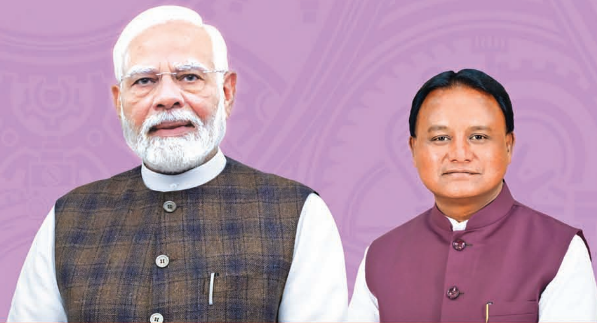
Shri Narendra Modi Prime Minister

The Utkarsh Odisha – Make in Odisha Conclave 2025 concludes today with a momentous ceremony led by the Hon'ble Chief Minister. As he felicitates 60 exceptional entrepreneurs under the age of 40, recognizing their potential as the next generation of Odia industry leaders, this event heralds the dawn of a new era in industrial development.