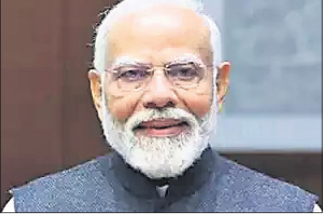
ଫେବୃଆରୀରେ ଆମେରିକା ଯାଇପାରନ୍ତି ମୋଦି