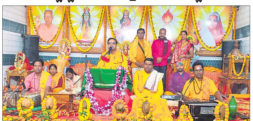
ଉଦ୍‌ପାପନା ସନ୍ଧ୍ୟାରେ ଆୟୋଜିତ ପ୍ରବଚନ କାର୍ଯ୍ୟକ୍ରମ।

ଝରଇ, ୨୮୧ (ଉତ୍କଳବନ୍ଧୁ ପଞ୍ଚା): ବାଲେଶ୍ୱର ଜିଲ୍ଲା ଝରଇ ବ୍ଲକ୍ ଅଧୀନ ବାଉଁଶଗଡ଼ିଆ ପଞ୍ଚାୟତରେ ବ୍ରାହ୍ମଣସମିତିର ଶାଖା କମିଟି ଗଠିତ ହୋଇଛି।