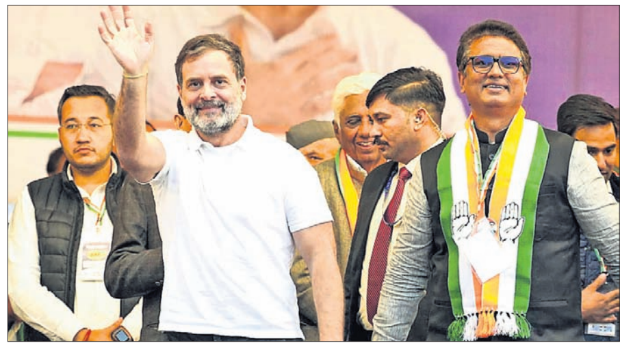
ଦିଲ୍ଲୀର ପଦ୍ମପଦ୍ମ ବିଧାନସଭା ଆସନରେ ଏକ ନିର୍ବାଚନୀ ରାଲିରେ କଂଗ୍ରେସ ପ୍ରାର୍ଥୀ ଅନିଲ ଚୌଧୁରୀଙ୍କ ସହ ଲୋକ ସଭାର ବିରୋଧୀ ଦଳ ନେତା ରାଜୁଲ ଗାନ୍ଧୀ।