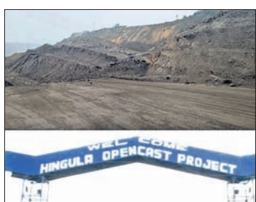
ହିଜୁଳା କୋଇଲା ଖଣିରେ ଅତଡ଼ା ଖସିଛି।

ତାଳଚେର, ୨୮।୧ (ମନୋଜ ନନ୍ଦ) ଅନୁଗୋଳ ଜିଲ୍ଲା ତାଳଚେରସ୍ଥିତ ଏମ୍.ସି.ଏଲ୍.ସି. ହିଜୁଳା କୋଇଲା ଖଣିରେ ମଙ୍ଗଳବାର ଭୋର୍ ସମୟରେ ମାଟି ଅତଡ଼ା ଖସିବାରୁ ତଳେ ଥିବା ବହୁ ମେଶିନ ପୋତି ହୋଇଯାଇଛି। ସୂଚନା ଅନୁଯାୟୀ, ହିଜୁଳା ଖଣିରେ ଏକ ଘରୋଇ କମ୍ପାନୀ କାର୍ଯ୍ୟ କରୁଥିବା ବେଳେ ଭୋର୍ ପ୍ରାୟ ୪ଟାରେ ହଠାତ୍ ବିରାଟ ମାଟି ଅତଡ଼ା ଖସିଥିଲା। ଏଥିରେ କୌଣସି କର୍ମଚାରୀ, ଶ୍ରମିକ ଆହତ ହୋଇ ନ ଥିବା ବେଳେ କେତୋଟି ମେଶିନ ମାଟି ଅତଡ଼ା ତଳେ