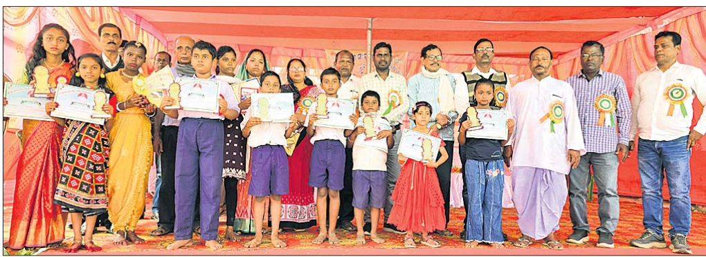
କୃତୀ ଛାତ୍ରାଛାତ୍ରୀମାନଙ୍କୁ ସମ୍ମାନିତ କରାଯାଇଛି।

ପଦ୍ମାବତୀ ବାଲିକା ଉଚ୍ଚ ବିଦ୍ୟାଳୟ ଓ ସରକାରୀ ଉଚ୍ଚ ପ୍ରାଥମିକ ବିଦ୍ୟାଳୟ ବଣାର ଗୀତନୀ ବାଣିଜ୍ୟ ଉତ୍ସବ ପ୍ରମୁଖ ପ୍ରତୀକ ‘ମାଟି ଘୋଡ଼ା’