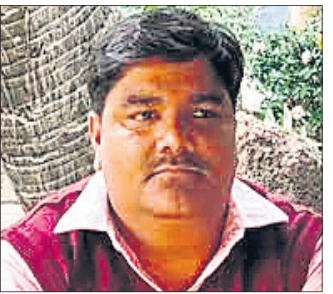
ତାହାର ସୁସେନଙ୍କୁ ୬ ଦିନିଆ ପାରୋଲ