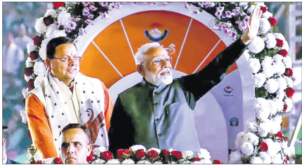
ଭଦ୍ୱାଚନା ଉତ୍ସବରେ ପ୍ରଧାନମନ୍ତ୍ରୀ ନରେନ୍ଦ୍ର ମୋଦି ଓ ଉତ୍ତରାଖଣ୍ଡ ମୁଖ୍ୟମନ୍ତ୍ରୀ ପୁଷ୍କର ସିଂ ଧାମା ।