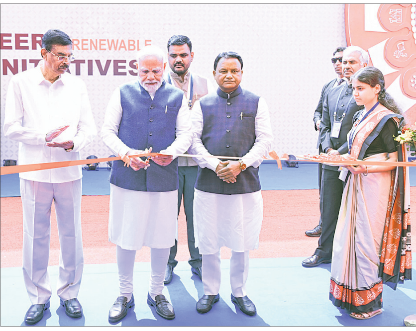
ପ୍ରଧାନମନ୍ତ୍ରୀ ନରେନ୍ଦ୍ର ମୋଦି ଉତ୍କର୍ଷ ଓଡ଼ିଶା କାର୍ଯ୍ୟକ୍ରମକୁ ଉଦ୍ଘାଟନ କରୁଛନ୍ତି। ନିକଟରେ ଅଛନ୍ତି ଓଡ଼ିଶା ରାଜ୍ୟପାଳ ହରିବୀରୁ କନ୍ୟାପତି, ପୁଖ୍ୟମନ୍ତ୍ରୀ ମୋହନ ଚରଣ ମାଝୀ ଓ ଅନ୍ୟମାନେ।