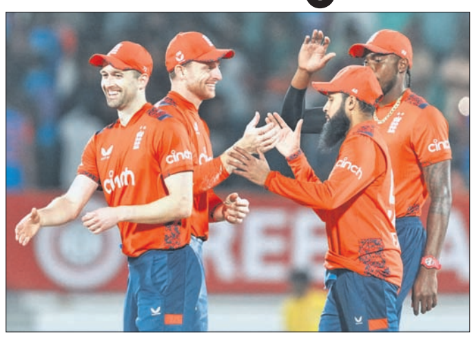
ବିଜୟ ପରେ ଉଇକେଟ ଇଂଲଣ୍ଡ ଖେଳାଳି।

ରାଜକୋଟ, ୨୮।୧ ରାଜକୋଟର ନିରଞ୍ଜନ ଶାହା ସ୍ୱାଭିମତରେ ମଙ୍ଗଳବାର ଅନୁଷ୍ଠିତ ଟି୨୦ କ୍ରିକେଟ ମ୍ୟାଚରେ ଇଂଲଣ୍ଡ ୨୬ ରନରେ ଭାରତକୁ ପରାସ୍ତ କରିଛି। ଇଂଲଣ୍ଡ ୨୦ ଓଭରରେ ୯ ଉଇକେଟ ହରାଇ ୧୭୧ ରନ କରିଥିଲା। ଜବାବରେ ଭାରତ ୨୦ ଓଭରରେ ୯ ଉଇକେଟ ହରାଇ ୧୪୪ ରନରେ ସୀମିତ ରହିଥିଲା। ହାର୍ଡିକ ପାଣ୍ଡା (୪୦ ରନ) ଓ ଅଭିଷେକ ଶର୍ମା (୨୪)ଙ୍କୁ ଛାଡ଼ିଦେଲେ ଅନ୍ୟ କୌଣସି ବ୍ୟାଟର ଇଂଲଣ୍ଡ ବୋଲରଙ୍କୁ ଠିକ୍‌ଭାବେ ଯୁକ୍ତାବଳୀ କରିପାରି ନ ଥିଲେ। ଇଂଲଣ୍ଡ ପକ୍ଷରୁ ଜେମି ଓଭର୍ଟନ ୩ଟି, କୋପ୍ରା ଆର୍ଟର ଓ ବ୍ରେଡନ କାର୍ଯ୍ୟକାରୀ ଲେଖାଏ ଏବଂ ମାର୍କ ଉର୍ ଓ ଆଦିଲ ରଶିଦ୍ ଗୋଟିଏ ଲେଖାଏ ଉଇକେଟ ନେଇଥିଲେ। ପ୍ରଥମ ୨ଟି ଟି୨୦ ଭାରତ ଜିତିଥିଲା। ବରୁଣଙ୍କୁ ୪ ଉଇକେଟ ଚପ୍ କିଟି ଭାରତ ଫିଲ୍ଡିଂ ନିଷ୍ପତ୍ତି ନେଇଥିଲା। ଇଂଲଣ୍ଡ ମାତ୍ର ୬ ରନରେ ଓପନର ଫିଲ୍ ସଲ୍ସ ଉଇକେଟ