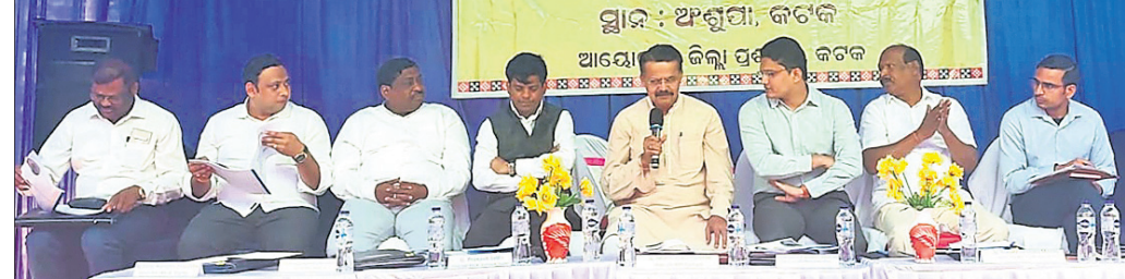
ବୈଠକରେ ଏମ୍ବିକେ, ବିଦ୍ୟାଳୟ ଓ ଜିଲ୍ଲାପାଳଙ୍କ ସମେତ ଅନ୍ୟମାନେ।