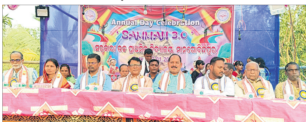
କାର୍ଯ୍ୟକ୍ରମରେ ବିଧାୟକ ପ୍ରଦୀପ କୁମାର ସାହୁ ଏବଂ ଅନ୍ୟ ଅତିଥି।