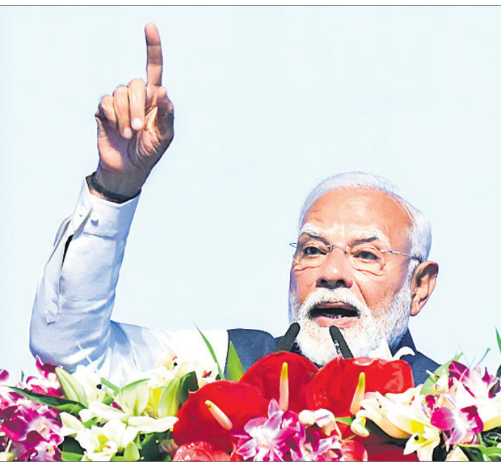
ପ୍ରଧାନମନ୍ତ୍ରୀ ଓ ପୁଖ୍ୟମନ୍ତ୍ରୀ ଉଦ୍ଘାଟନ ବେଳେ ଉତ୍କର୍ଷ ଓଡ଼ିଶା କାର୍ଯ୍ୟକ୍ରମରେ ସମାବେଶ କରୁଛନ୍ତି।