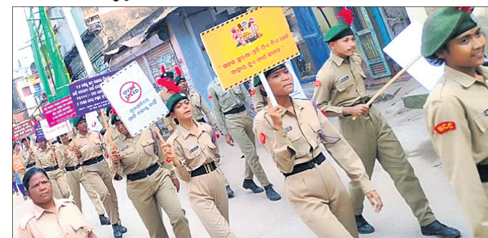
ବାଗପୁର, ୨୮୧ (ବିଳାପ ସ୍ୱାଇଁ)

ମହାବିଦ୍ୟାଳୟର କର୍ମଚାରୀମାନେ ସଡ଼କ ସୁରକ୍ଷା ସଚେତନତା ପଦଯାତ୍ରା କରିଥିଲେ। ମହାବିଦ୍ୟାଳୟ ପରିସରରୁ ପଦଯାତ୍ରାରେ ବାହାରି ମା' ଭଗବତୀଙ୍କ ମନ୍ଦିର ପରିବହନ ବିଭାଗ ଏବଂ ବାଗପୁର ପୋଲିସ ପକ୍ଷରୁ ମିଳିତ ଭାବେ ଆୟୋଜିତ ଏହି ପଦଯାତ୍ରାରେ ଗୋଦାବରୀ ଛାତ୍ରାଛାତ୍ରୀମାନେ ବିଭିନ୍ନ ନିୟମ ସମ୍ପର୍କରେ ସଚେତନ କରିବା ସହ ହେଲମେଟ ଏବଂ ସିଟ ବେଲ୍ଟ ପରିଧାନ ରେଖିଥିବା ସ୍ୱେଚ୍ଛାସେବୀଙ୍କ ସମେତ