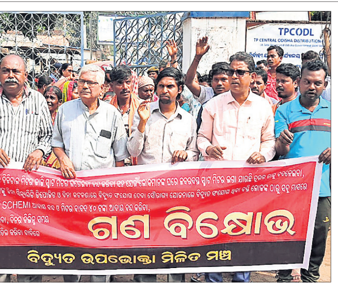
ବସ୍ତ୍ରରେ ସ୍ୱାର୍ ମିଶ୍ରର ଲାଗଣା ବନ୍ଦ ସହ ବିଭିନ୍ନ ଦାବି ନେଇ କଟକ ରାଣାହାଟସ୍ଥିତ ବିଦ୍ୟୁତ୍ ନିର୍ବାହୀମଣ୍ଡଳ କାର୍ଯ୍ୟାଳୟ ସମ୍ମୁଖରେ ବିଦ୍ୟୁତ୍ ଉପଭୋକ୍ତା ମିଳିତ ମଞ୍ଚ ପକ୍ଷରୁ ବିକ୍ଷୋଭ ପ୍ରଦର୍ଶନ।