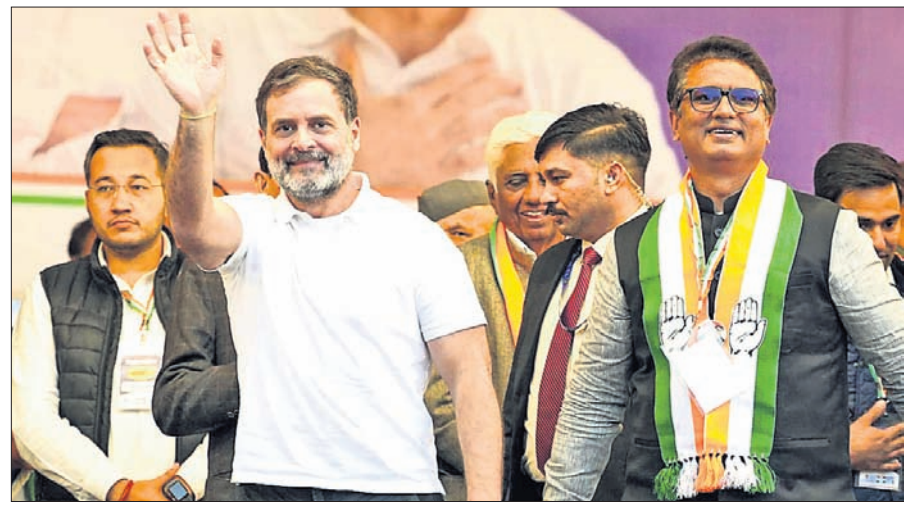
ଦିଲ୍ଲୀର ପଦ୍ମପଦ୍ମନାଥ ବିଧାନସଭା ଆସନରେ ଏକ ନିର୍ବାଚନୀ ରାଲିରେ କଂଗ୍ରେସ ପ୍ରାର୍ଥୀ ଅନିଲ ଚୌଧୁରୀଙ୍କ ସହ ଲୋକ ସଭାର ବିରୋଧୀ ଦଳ ନେତା ରାହୁଲ ଗାନ୍ଧୀ।