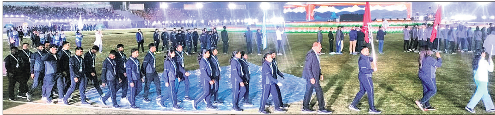
ଜାତୀୟ କ୍ରୀଡ଼ା ଭଦ୍ୱାଚନା ଅବସରରେ ଓଡ଼ିଶା ପ୍ରତିନିଧି ଦଳ ।