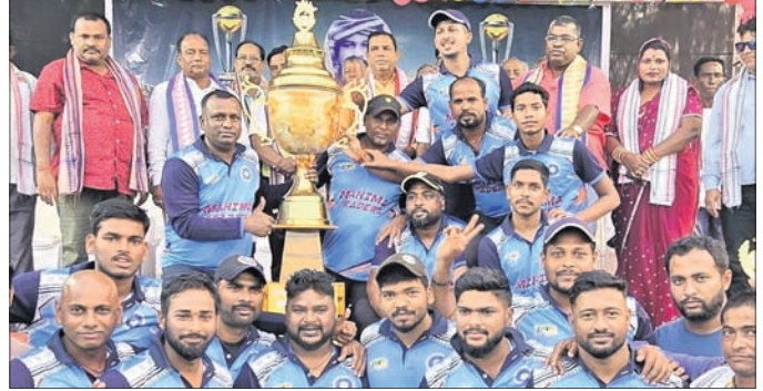
ଚାମ୍ପିୟନ କେଶୁରା ଦଳର ଖେଳାଳିମାନେ ଅତିଥିକ ରହଣରେ ।

କେଶୁରା ଚାମ୍ପିୟନ ଦଳର ଖେଳାଳିମାନେ ଅତିଥିକ ରହଣରେ ।