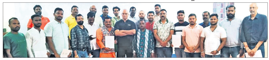
ଫାୟାର ଆର୍ମ୍ କ୍ୟାମ୍ପରେ କୃତ୍ତି ଅର୍ଜନ କରିଥିବା ଶୁଭଚିନ୍ତାମାନେ ଅତିଥି ଓ କର୍ମଚାରୀଙ୍କ ସହ ।

କ୍ରୀଡ଼ା ମହିଳା ଓ ପୁରୁଷ ଦଳ ବିଜୟ ସହ ଅଭିଯାନ ଆରମ୍ଭ କରିଛି । ଉତ୍ତରାଖଣ୍ଡ ହଲ୍ଦୱାଡିରେ ଖୋଲାଇ ଉଦ୍ଘାଟନା ମ୍ୟାଚରେ ଓଡ଼ିଶା ପୁରୁଷ ଦଳ ଛତିଶଗଡ଼କୁ ୪୩-୩୪ ବ୍ୟବଧାନରେ ପରାସ୍ତ କରିଛି । ସେହିପରି ମହିଳା ଦଳ ପ୍ରଥମ ମ୍ୟାଚରେ