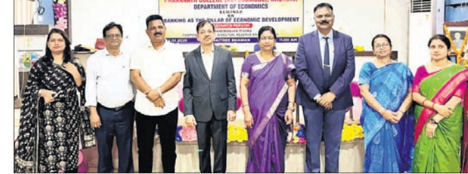
ଖୋର୍ଦ୍ଧା, ୨୮୧