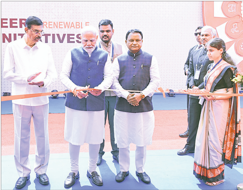
ପ୍ରଧାନମନ୍ତ୍ରୀ ନରେନ୍ଦ୍ର ମୋଦି ଉତ୍କର୍ଷ ଓଡ଼ିଶା କାର୍ଯ୍ୟକ୍ରମକୁ ଉଦ୍‌ଘାଟନ କରୁଛନ୍ତି। ନିକଟରେ ଅଛନ୍ତି ଓଡ଼ିଶା ରାଜ୍ୟପାଳ ହରିବାବୁ କରମ୍‌ପାଟି, ପୁଖ୍ୟମନ୍ତ୍ରୀ ମୋହନ ଚରଣ ନାଥୀ ଓ ଅନ୍ୟମାନେ।