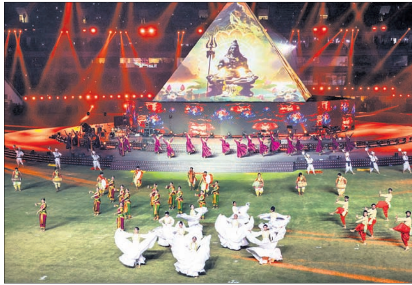
କଳାକାରଙ୍କ ଦ୍ୱାରା ରଙ୍ଗାରଙ୍ଗ କାର୍ଯ୍ୟକ୍ରମ ପରିବେଷଣ ।