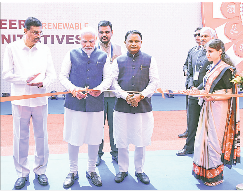
ପ୍ରଧାନମନ୍ତ୍ରୀ ନରେନ୍ଦ୍ର ମୋଦି ଉତ୍କର୍ଷ ଓଡ଼ିଶା କାର୍ଯ୍ୟକ୍ରମକୁ ଉଦ୍ଘାଟନ କରୁଛନ୍ତି। ନିକଟରେ ଅଛନ୍ତି ଓଡ଼ିଶା ରାଜ୍ୟପାଳ ହରିବଂଶୁ କମ୍ବମ୍ପାତି, ପୁଖ୍ୟମନ୍ତ୍ରୀ ମୋହନ ଚରଣ ମାଝୀ ଓ ଅନ୍ୟମାନେ।