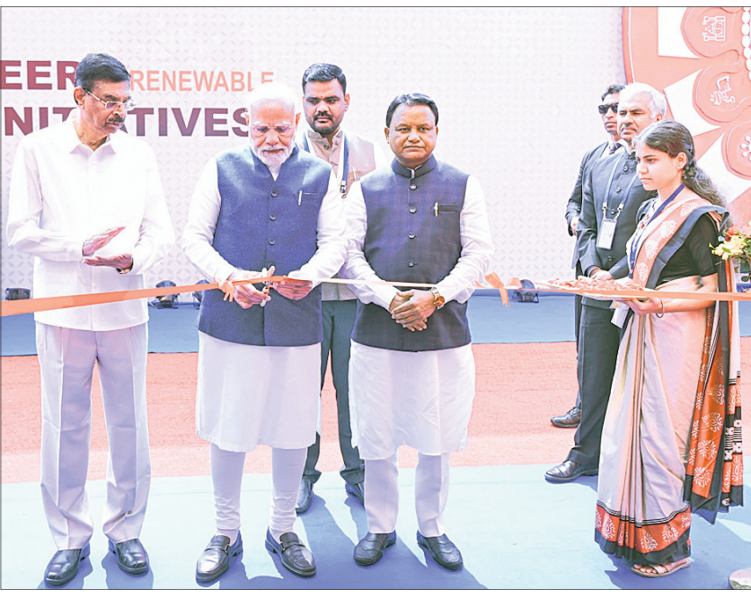
ପ୍ରଧାନମନ୍ତ୍ରୀ ନରେନ୍ଦ୍ର ମୋଦି ଉତ୍କର୍ଷ ଓଡ଼ିଶା କାର୍ଯ୍ୟକ୍ରମକୁ ଉଦ୍ଘାଟନ କରୁଛନ୍ତି। ନିକଟରେ ଅଛନ୍ତି ଓଡ଼ିଶା ରାଜ୍ୟପାଳ ହରିବଂଶୁ କରମ୍ପାପାଟି, ପୁଖ୍ୟମନ୍ତ୍ରୀ ମୋହନ ଚରଣ ମାଝୀ ଓ ଅନ୍ୟମାନେ।