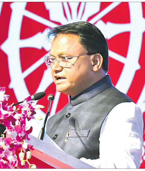
ପ୍ରଧାନମନ୍ତ୍ରୀ ଓ ପୁଖ୍ୟମନ୍ତ୍ରୀ ଉଦ୍ଘାଟନ ବେଳେ ଉତ୍କର୍ଷ ଓଡ଼ିଶା କାର୍ଯ୍ୟକ୍ରମରେ ସମାବେଶ କରୁଛନ୍ତି।