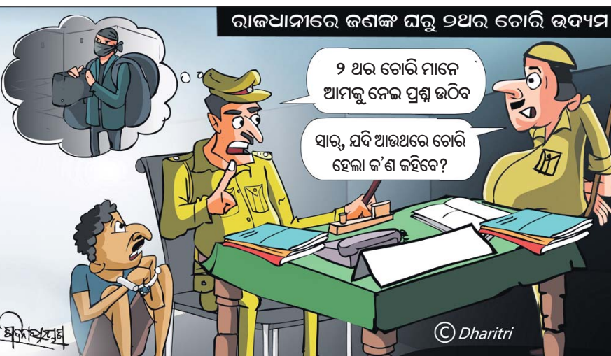
ରାଜଧାନୀରେ ଜଣଙ୍କ ଘରୁ ୨ଥର ଚୋରି ଉଦ୍‌ଘଟନ

୨ ଥର ଚୋରି ମାନେ ଆମକୁ ନେଇ ପ୍ରଶ୍ନ ଉଠିବ ସାର, ଯଦି ଆଉଥରେ ଚୋରି ହେଲା କ'ଣ କରିବେ?