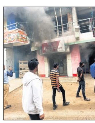
ନୂତନ ହୋଇ ନ ଥିବାବେଳେ ୨ଟି ଏସିଏମ୍ କେନ୍ଦ୍ରରେ ଅଗ୍ନିକାଣ୍ଡ ହେବାରୁ ଅନୁରୋଧ କରାଯାଇଛି। ତେବେ ଏଟିଏମ୍ କେନ୍ଦ୍ରରେ ପରିମାଣର ଚକାପୋଡ଼ି ରିପୋର୍ଟ ଲେଖାହେଲେ ବେଳକୁ ତାହାର କୌଣସି ଠିକ୍ ତଥ୍ୟ ମିଳିପାରି ନ ଥିଲା। ଖବରପାଇ ସମ୍ପୃକ୍ତ ଘଟଣାଗ୍ରାମୀଣଙ୍କୁ ସହାୟତା ପ୍ରଦାନ ପାଇଁ ପ୍ରଶାସନ ପଦକ୍ଷେପ ଗ୍ରହଣ କରିଥିଲା।

ନିଶ୍ଚିତକୋଇଲି ରୁକ୍ ଅସୁରକ୍ଷିତ ବଜାରରେ ଥିବା ଏକ ଘରୋଇ ବ୍ୟାଙ୍କ ଏଟିଏମ୍ କେନ୍ଦ୍ରରେ ମଙ୍ଗଳବାର ସକାଳେ ନିଆଁ ଲାଗିଲା। ଏଥିରେ ଲକ୍ଷାଧିକ ଅପରପକ୍ଷେ ଦିନ ତମାମ ଖରାରେ ବସିରହିବା ଫଳରେ ଜଣେ ମହିଳା ଆଖିକା କରାଯାଇଛି। ବର୍ଷା ଦିନ ରୁକ୍ ଚଳିବା ନିମନ୍ତେ ମାହାଙ୍ଗା ରୋଷ୍ଟା ସ୍ୱଚ୍ଛତା ଯୋଗ୍ୟ, ମାହାଙ୍ଗା ରୁକ୍ରେ ଏମ୍ବିକେ ଓ ସିଆରପି ନିଯୁକ୍ତିରେ ରୁକ୍ ନିଆଁ ଲାଗିଥିବା ଅଭିଯୋଗ ଆସିବା ପରେ ଘଟଣାର ଉଚ୍ଚ ପ୍ରମାଣ ତଦନ୍ତ ଜାରି ରହିଛି। ଏହି ତଦନ୍ତ ଚାଲୁଥିବା ବର୍ଷାକାଳ କାର୍ଯ୍ୟକ୍ରମ ଏମ୍ବିକେ ଓ ସିଆରପିମାନଙ୍କ ଦ୍ୱାରା ବନ୍ଦ ରଖି ଜିଲ୍ଲା ପ୍ରଶାସନ ଏନେଇ ଚାକ୍ର ପ୍ରତିକ୍ରିୟା ପ୍ରକାଶ ପାଇଛି।