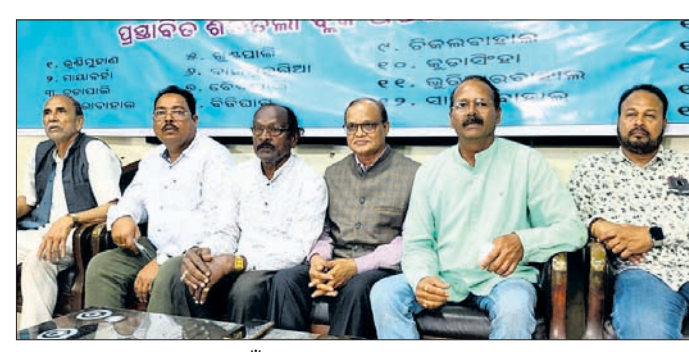
ଶିବତଳାକୁ ରୁକ୍ମ ମାନ୍ୟତା ପାଇଁ ଖବରଦାତା ସମ୍ମିଳନୀ କରାଯାଇଛି।

ବଲାଙ୍ଗୀର, ୨୯୧୧(ବାରେଇ କୁମାର ଝାଙ୍କର) ବଲାଙ୍ଗୀର ସଦର ରୁକ୍ମ ଅନ୍ତର୍ଗତ ଶିବତଳାକୁ ନୂଆ ରୁକ୍ମ ଭାବେ ମାନ୍ୟତା ଦେବାକୁ ବିଭିନ୍ନ ଗ୍ରାମପଞ୍ଚାୟତ ତରଫରୁ ଦାବି କରାଯାଇଛି।