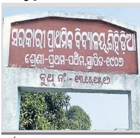
ବାରକୋଟ ପୋଲିସ ବିଦ୍ୟାଳୟର ଶିକ୍ଷକଙ୍କ ଜିମାରେ ପଳାମାନଙ୍କୁ ଛାତ୍ରାବାସରେ ରହୁଥିବା ବୋଲି ଜଣାପଡ଼ିଛି।

ବଣାଇ, ୨୯୧ (ପ୍ରଦୀପ ତ୍ରିପାଠୀ) ସୁନ୍ଦରଗଡ଼ ଜିଲ୍ଲା ବଣାଇ ଉପଖଣ୍ଡ ମହଲପଦା ଥାନା ଅନ୍ତର୍ଗତ ଶିବିଡିଆ ସରକାରୀ ପ୍ରାଥମିକ ବିଦ୍ୟାଳୟ ଛାତ୍ରାବାସକୁ ଗତ ମଙ୍ଗଳବାର ରାତିରେ ଫେରାର ୧୫ ଜଣ ଛାତ୍ରଙ୍କ ପତା ମିଳିଛି।