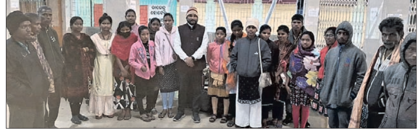
ତାମିଲନାଡୁରୁ ଫେରିଥିବା ଓଡ଼ିଆ

ଶିକ୍ଷୟିତ୍ରୀ ପୁଷ୍ପଲତା ସତ୍ତ୍ୱଜୀ ମହାବିଦ୍ୟାଳୟର ବାର୍ଷିକ କ୍ରୀଡ଼ାର ସଂକ୍ଷିପ୍ତ ବିବରଣୀ ପ୍ରଦାନ କରିଥିଲେ। ଗତ ୨୮ତାରିଖରେ ବାର୍ଷିକ କ୍ରୀଡ଼ା ଉଦ୍‌ଯାପନ ହେବା ପରେ ରାଜଗାଙ୍ଗପୁରସ୍ଥିତ ଯୁବକମ ପଢ଼ିଆରେ ବିଭିନ୍ନ କ୍ରୀଡ଼ା ପ୍ରତିଯୋଗିତା ଅନୁଷ୍ଠିତ ହୋଇଥିଲା।