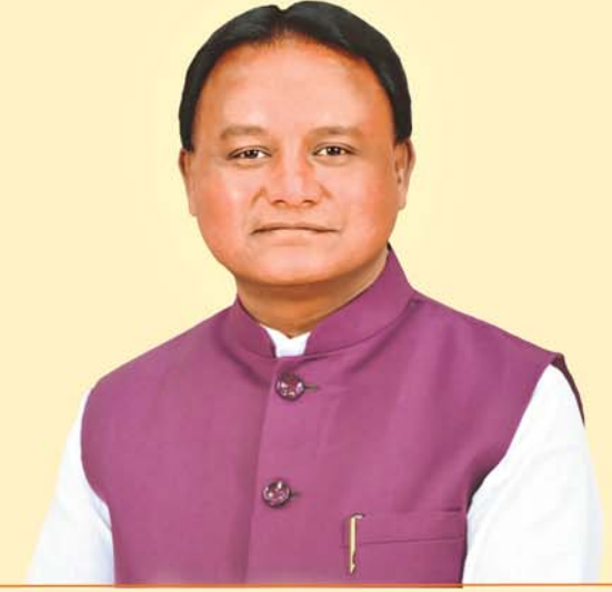
Shri Mohan Charan Majhi Chief Minister, Odisha

On the occasion of the “Utkarsh Odisha” Valedictory Ceremony, the Govt. of Odisha felicitated 60 numbers of young entrepreneurs, all under the age of 40, as role model of the MSME sector, recognizing their dedication and hard work in establishing successful enterprises.