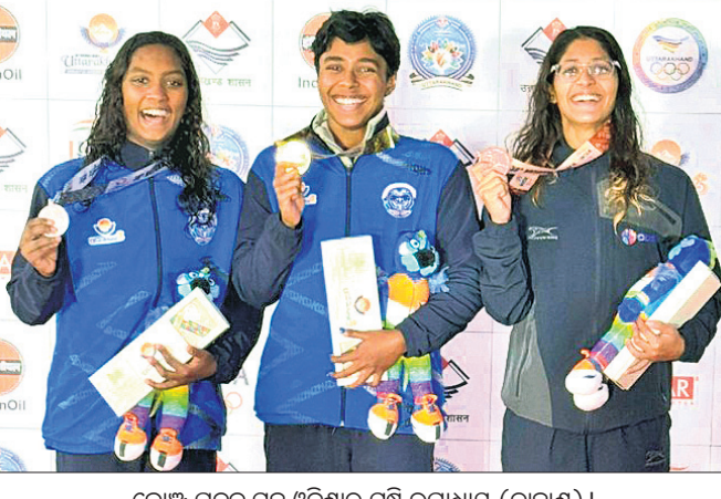
ଡ୍ରାଗନ୍ସ ପଦକ ସହ ଓଡ଼ିଶାର ସୃଷ୍ଟି ଉପାଧାର (ଡୋପାନ୍ସ)।