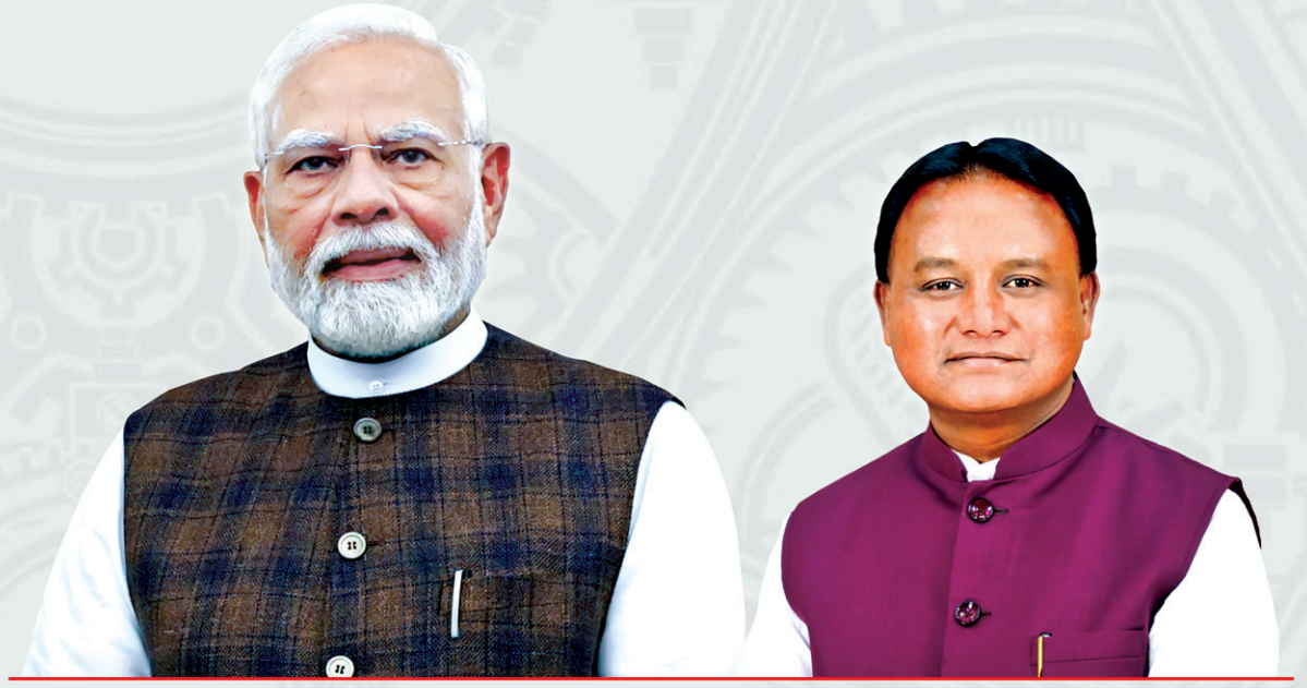
Shri Narendra Modi Prime Minister

Thank you for joining us and contributing to the grand success of the Utkarsh Odisha – Make in Odisha Conclave 2025. The event has reinforced Odisha's position as a premier destination for industrial growth, innovation, partnerships, and skilling.