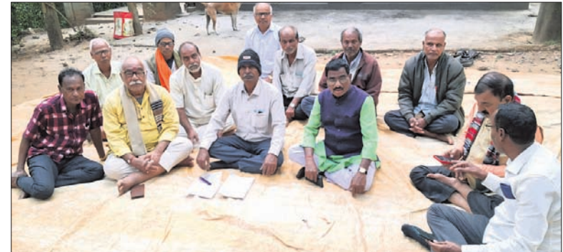
ବନ୍ଧୁମିଳନ ନାମରେ ପୁରୁଖା ନେତାଙ୍କ ରଘୁଲପୁର ଅଞ୍ଚଳରେ ବନ୍ଧୁମିଳନ ।

ଯାକପୁର ଜିଲ୍ଲା ରଘୁଲପୁର ବ୍ଲକ ଅନ୍ତର୍ଗତ ବାରବାଟୀ ପଞ୍ଚାୟତର ୧୬ନମ୍ବର ଜାତୀୟ ରାଜପଥ ପାର୍ଶ୍ୱସ୍ଥ ମା' ତାରିଣୀ ମନ୍ଦିର ପରିସରରେ ବନ୍ଧୁମିଳନ ଆଳରେ ଧର୍ମଶାଳା ନିର୍ବାଚନମଣ୍ଡଳୀ ବିଜେଡିର ପୁରୁଖା ନେତାମାନଙ୍କ ଏକ ମେଳି ନିକଟରେ ଦେଖିବାକୁ ମିଳିଥିଲା । ୨୩ ଫେବୃଆରୀରେ ଏକ ସମାବେଶ ଆୟୋଜନ କରାଯିବାକୁ ଏଥିରେ ନିଷ୍ପତ୍ତି ନିଆଯାଇଥିବା ଶୁଣିବାକୁ ମିଳିଛି । ଏପରିକି ଏହାକୁ ସର୍ବଦଳୀୟ ସଭାରେ ପରିଣତ ପାଇଁ ନେତୃମଣ୍ଡଳୀ ମନସ୍ଥ କରିଛନ୍ତି । ବରିଷ୍ଠ ନେତାମାନେ କଂଗ୍ରେସ, ବିଜେଡି, ଭାଜପା ଭଳି ପ୍ରମୁଖ ଦଳର ଅବହେଳିତ ପୁରୁଖାଙ୍କୁ ଏଥିରେ ସାମିଲ କରିବା ପାଇଁ ଯୋଗାଯୋଗ କରୁଛନ୍ତି । ଏଭଳି ପ୍ରସ୍ତାବକୁ ବିଜେଡି ମହଲରେ ସ୍ୱାଗତ କରାଯାଇଛି । ତେବେ ଆଗକୁ ସମାବେଶ କେଉଁ ରୂପ ଧାରଣ କରୁଛି ଓ ତାହା ଧର୍ମଶାଳାର ରାଜନୀତିକୁ କେତେ ପ୍ରଭାବିତ କରୁଛି ତାହା ସମୟକ୍ରମେ ସ୍ପଷ୍ଟ ହୋଇପାରିବ ବୋଲି ସ୍ଥାନୀୟ ଅଞ୍ଚଳରେ ଚର୍ଚ୍ଚା ହେଉଛି । ୨୦୨୪ ନିର୍ବାଚନରେ ଧର୍ମଶାଳାରେ ୩୦ବର୍ଷର ପରିବାରବାଦ ରାଜନୀତିରେ ରୋଲ୍ ଲାଗିଛି । ଏଠି ସ୍ୱାଧୀନ ପ୍ରାର୍ଥୀ ଜିତିବା ପରେ ଭାଜପାରେ ସାମିଲ ହୋଇ ଦଳୀୟ କାର୍ଯ୍ୟକ୍ରମ ଜାରି ରଖିଛନ୍ତି । ବିଜେଡି-ଶାସନ କାଳରେ ଅଲୋଡ଼ା ହୋଇଥିବା ପୁରୁଖା ନେତା ସ୍ୱାଧୀନ ପ୍ରାର୍ଥୀଙ୍କୁ ସମର୍ଥନ ଜଣାଇଥିଲେ । ଏଥିଯୋଗୁଁ ଧର୍ମଶାଳା ବିଜେଡିର ପରାଜୟ ହୋଇଥିବା ଲୋକେ