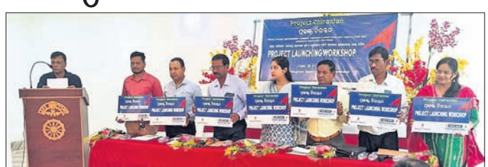
ପାଣିପାଗ ଯୋଗୁଁ ନାମମାତ୍ର ଗଣ୍ଡା, ଗୋଡ଼ା, ପାରମ୍ପରିକ ଜାତିକା ଉପରେ ନିକଟଶୀଳ ପରିବାର ଏବଂ ଅତି ଗରିବ ପରିବାରମାନେ ଅଧିକ ମାତ୍ରାରେ କ୍ଷତିଗ୍ରସ୍ତ ହେଉଛନ୍ତି, ତେଣୁ ଜଳବାୟୁ ପରିବର୍ତ୍ତନ ସହନଶୀଳ ଗଣ୍ଡା ପ୍ରକଳ୍ପ ଏକମାତ୍ର ବିକଳ୍ପ ବୋଲି ପ୍ରକଳ୍ପ ବିଭାଗର ଉପାଦେୟତା ସମୀକ୍ଷାରେ ସ୍ଥାନୀୟ ଗଣ୍ଡା, ଜିଲା ଓ ବ୍ଲକ୍ସ୍ତରୀୟ ସରକାରୀ ବିଭାଗର କାର୍ଯ୍ୟକର୍ମୀମାନେ ମତପ୍ରକାଶ କରିଥିଲେ । ଏହି ପ୍ରକଳ୍ପ ଅଧୀନରେ ଭୁବନ ଓ କଳକହାଡ଼ ବ୍ଲକ୍