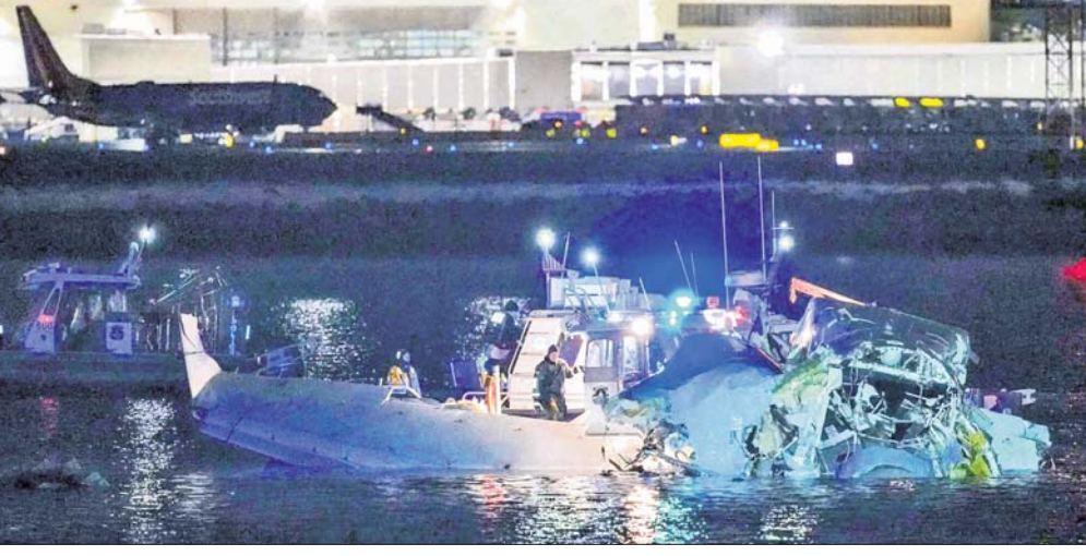
ଦୁର୍ଘଟଣାର କାରଣ ଜଣାପଡ଼ିନାହିଁ। ବିମାନରେ ରୁଷିଆର ୧୪ ଜଣ ସୈନ୍ୟ, ସୋମାଲୀ କୋର୍ ତଥା ପରିବାର ସଦସ୍ୟ ୬ ଜଣ ପଡ଼ିନାହିଁ।

ଆମେରିକା ଏୟାରଲାଇନ୍ସର ଏକ କେବ୍ ଟୁପାକର ଫ୍ଲାଇଟ ନିକଟ ରୋଲାଇନ୍ସରେ ଘଟଣା ଘଟିଲା। ଏହାପରେ ଉଡ଼ା ବନ୍ଦ ହେଲା। ବିମାନରେ ୬୦ ଯାତ୍ରୀ ଏବଂ ୪ କ୍ରୁ ଯୋଗୁ ଏବଂ ହେଲିକପ୍ଟରରେ ୩ ଜଣ ସୈନ୍ୟ ଥିଲେ। ଦୁର୍ଘଟଣା ପରେ ଉଭୟ ବିମାନ ଏବଂ ହେଲିକପ୍ଟର ନିକଟବର୍ତ୍ତୀ ପୋଡ଼ାମାଳି ନଦୀରେ ଖସିପଡ଼ିଥିବାବେଳେ ତଳାଧି ଓ ଉଦ୍ଧାର କାର୍ଯ୍ୟ ଜାରି ରହିଥିବାବେଳେ ଗୁରୁବାର ସନ୍ଧ୍ୟା ପୂର୍ବ ୨୮ ମୃତଦେହ ମିଳିଛି। ନିଖୋଜ ଥିବା ଯାତ୍ରୀ ଓ କ୍ରୁ ସବ୍ୟମାନଙ୍କର ମୃତ୍ୟୁ ଘଟିଥିବା ଆଶଙ୍କା କରାଯାଉଛି। ଆଜନ ପ୍ରବଚନକାରୀ ସଂସ୍ଥାଗୁଡ଼ିକର ହେଲିକପ୍ଟର ସହାୟତାରେ ମୃତଦେହ ଖୋଜା ଚାଲିଛି।