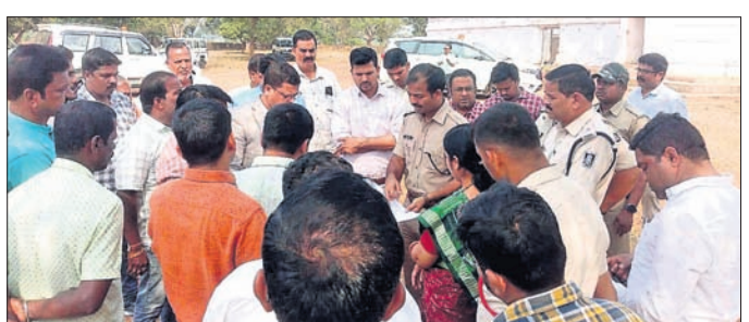
ଜିଲାପାଳ ଓ ଏସପି ମେଳା ପଡ଼ିଆ ପରିଦର୍ଶନ କରୁଛନ୍ତି ।

■ ସିଦ୍ଧିଚିତ୍ରି ନଜରରେ ରହିବ ମେଳା ପରିସର ■ ଜିଲାପାଳ ଓ ଏସପିଙ୍କ ଗାଦିମନ୍ଦିର ଓ ମେଳା ପଡ଼ିଆ ପରିଦର୍ଶନ