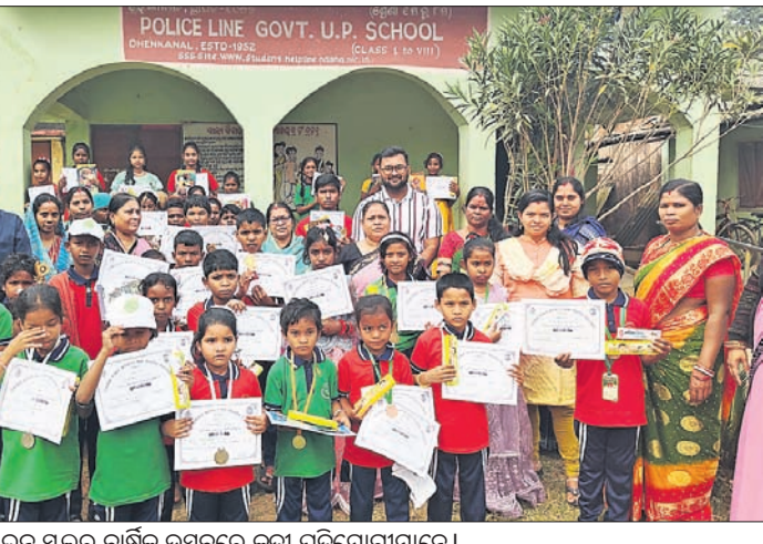
ପୋଲିସ ଲାଇନ ସ୍କୁଲର ବାର୍ଷିକ ଉତ୍ସବରେ କୃତା ପ୍ରତିଯୋଗୀମାନେ ।

ଦେଶାତ୍ମକ, ୩୦।୧ (ରବିନାୟକ) ଦେଶାତ୍ମକ ସ୍ୱୟଂଶାସିତ ମହାବିଦ୍ୟାଳୟ ପାଠକ୍ରମ ଆରମ୍ଭ କରିଥିଲା । ପାଠକ୍ରମ ଆରମ୍ଭ କରିଥିଲା । ପାଠକ୍ରମ ଆରମ୍ଭ କରିଥିଲା ।