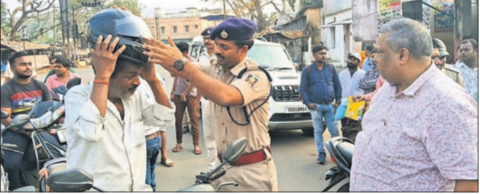
କର୍ମେତ୍ରୁତ୍ୱରେ ଗାନ୍ଧୀଙ୍କୁ ଏସପି ହେଲମେଟ୍ ପିନ୍ଧାଇବା ।

ଦେଶାନ୍ତରାଳ ସହରରେ ସଡ଼କ ସୁରକ୍ଷା ମାସ ପାଇଁ ଅତିମ ପର୍ଯ୍ୟାୟରେ ରୁକୁବାର ଅପରାହ୍ଣ ୪ଟାରେ ସହରସ୍ଥିତ ବାକିଗୋଳଠାରେ ଜିଲା ଆଞ୍ଚଳିକ ପରିବହନ ବିଭାଗ ଓ ପୋଲିସ ପ୍ରଶାସନ ପକ୍ଷରୁ ମିଳିତ ଭାବେ ଦୁଇ ଚକିଆ ଯାନ ଆରୋହୀମାନଙ୍କୁ ହେଲମେଟ୍ ଯାଞ୍ଚ ଛାତ୍ରାଛାତ୍ରୀ ଉନ୍ନତ ଜ୍ଞାନ ଆହରଣ ସହ ଦକ୍ଷତା ବୃଦ୍ଧି କରି ଆଗାମୀ ସମୟରେ ବିଭିନ୍ନ କ୍ଷେତ୍ରରେ ପ୍ରତିଷ୍ଠା ଲାଭ କରିପାରିବେ ସେ ନେଇ ଅତିଥିମାନେ ମତ ପ୍ରକାଶ କରିଥିଲେ । କାର୍ଯ୍ୟକ୍ରମରେ ବିଦ୍ୟାଳୟର ସମସ୍ତ ଛାତ୍ରାଛାତ୍ରୀ ଓ ଅଭିଭାବକ ଯୋଗ ଦେଇଥିବା ବେଳେ ଶିକ୍ଷକ, ଶିକ୍ଷକପ୍ରାମାଣେ ସଭାକାର୍ଯ୍ୟ ପରିଚାଳନା କରିଥିଲେ ।