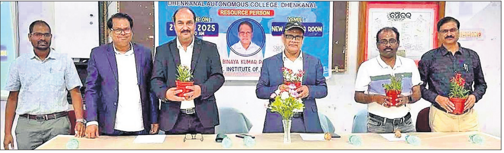
ନାଭିକାୟ ଶକ୍ତି ଉପରେ ପାଠକ୍ରମ କାର୍ଯ୍ୟକ୍ରମରେ ଅତିଥିମାନେ ।

ଦେଶାତ୍ମକ, ୩୦।୧ (ରବିନାୟକ) ଦେଶାତ୍ମକ ସ୍ୱୟଂଶାସିତ ମହାବିଦ୍ୟାଳୟ ସ୍ୱାତନ୍ତ୍ର୍ୟ ପର୍ବ ଦିନ ପାଠକ୍ରମ ଆରମ୍ଭ କରିଥିଲା । ପାଠକ୍ରମ ଆରମ୍ଭ କରିଥିଲା । ପାଠକ୍ରମ ଆରମ୍ଭ କରିଥିଲା । ପାଠକ୍ରମ ଆରମ୍ଭ କରିଥିଲା ।