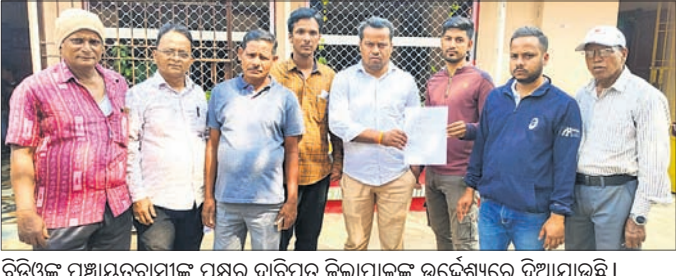
ବିଡ଼ଓଙ୍କୁ ପଞ୍ଚାୟତବାସୀଙ୍କ ପକ୍ଷରୁ ଦାବିପତ୍ର ଜିଲାପାଳଙ୍କ ଉଦ୍ଦେଶ୍ୟରେ ଦିଆଯାଇଛି।