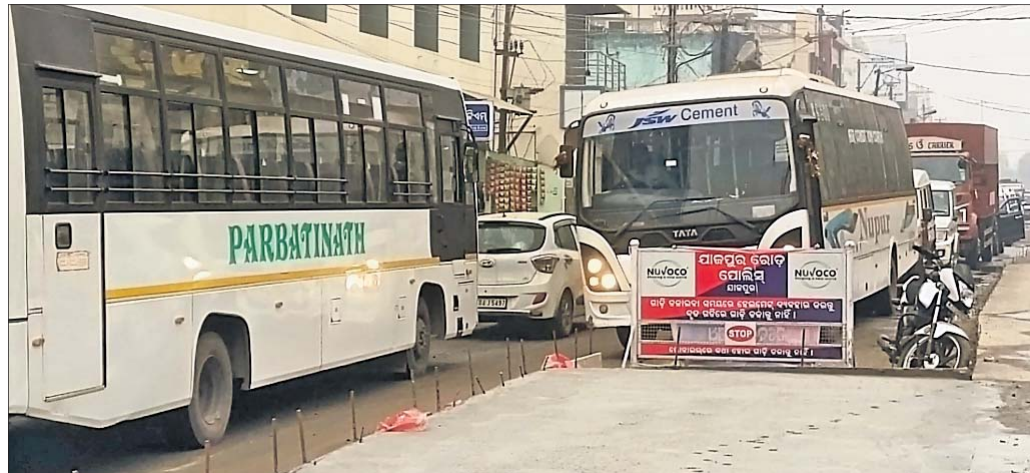
ବ୍ୟାସନଗର ସହରରେ ଗ୍ରାମିକ ଗାମ୍ ।