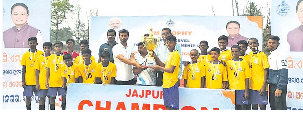
ଅତିଥି ଗାନ୍ଧିୟନ ଦଳକୁ ଟ୍ରଫି ପ୍ରଦାନ କରୁଛନ୍ତି ।