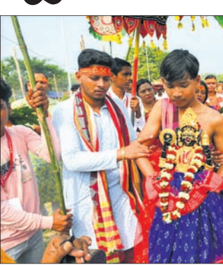
ବୈଷ୍ଣୋଦେବୀଙ୍କ ପ୍ରାଣ ପ୍ରତିଷ୍ଠା ଉତ୍ସବ ଅବସରରେ ଗୁରୁବାର ଆୟୋଜିତ କଳସ ଶୋଭାଯାତ୍ରା ।