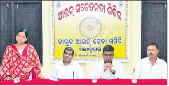
ଶିବିରରେ ମଞ୍ଚାସନ ଅତିଥି।

ପଞ୍ଚାମୁଖାଲ, ୩୦.୧ (କଟକରୁ ନାୟକ) ପ୍ରତିମା କୋର୍ଟର ରାୟକୁ ଲଘୁ କରିବା ଆଇନର ବିରୋଧୀ... ଆଇନ ସଚେତନତା ଶିବିର ପଞ୍ଚାମୁଖାଲ କୋର୍ଟ ପରିସରରେ ଅନୁଷ୍ଠିତ ହୋଇଯାଇଛି।