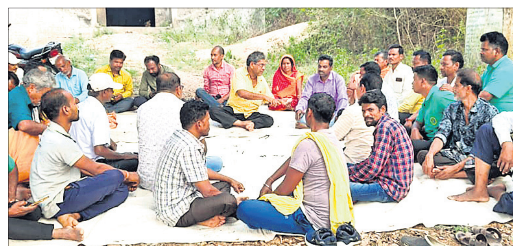
ଗ୍ରାମବାସୀଙ୍କ ପକ୍ଷରୁ ଆୟୋଜିତ ପ୍ରସ୍ତୁତି ବୈଠକ ।

ଗଣିଆ ବୁକର ଗଣିଆ-ବତପୁଲ ରାସ୍ତା ନିର୍ମାଣରେ ଅହେତୁକ ବିକଳ ଓ ନିମ୍ନମାନର କାର୍ଯ୍ୟ ପ୍ରତିବନ୍ଧକ ହେଉଛି । ବର୍ତ୍ତମାନ ଓ ରାସ୍ତା ପଞ୍ଚାୟତର ଲୋକମାନେ ଆସନ୍ତା ୩ ବାରିଖରେ ଗଣିଆ ବୁକ କାର୍ଯ୍ୟାଳୟ ସମ୍ମୁଖରେ ଗଣଧାରଣା ଦେବା ପାଇଁ ନିଷ୍ପତ୍ତି ନେଇଛନ୍ତି । ଏ ନେଇ ବିଭାଗୀୟ ଅଧିକାରୀ, ଜିଲା ପ୍ରଶାସନ ଓ ଗଣିଆ ଥାନା ଅଧିକାରୀଙ୍କୁ ଲିଖିତ ଭାବେ ଅବଗତ କରାଯାଇଛି । ଏନେଇ ଗୁରୁବାର ଅପରାହ୍ନରେ ଛାତ୍ରଛାତ୍ରୀ ଗୁପ୍ତସ୍ୱର ମହାଦେବ ମନ୍ଦିର ପାଦଦେଶରେ ଏକ ପ୍ରସ୍ତୁତି ବୈଠକ ଅନୁଷ୍ଠିତ ହୋଇଥିଲା । ବୈଠକରେ ସମସ୍ତ ଗ୍ରାମର ସଭାପତି, ସମ୍ପାଦକ, ଖର୍ଚ୍ଚ ସଭାସଭ୍ୟା ଯୋଗଦେଇଥିଲେ ।