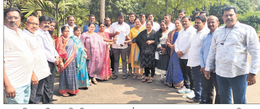
ଜିଲ୍ଲାପାଳ ବିଧ୍ୟାଳୟ ପରିଡ଼ାକୁ ମେୟର ଓ କର୍ପୋରେଟରମାନେ ଗୁରୁବାର ସ୍ମାରକପତ୍ର ପ୍ରଦାନ କରୁଛନ୍ତି ।

ଭାଗବତଙ୍କୁ କଳାପତାକା ଦେଖାଇଲା ଛାତ୍ର କଂଗ୍ରେସ