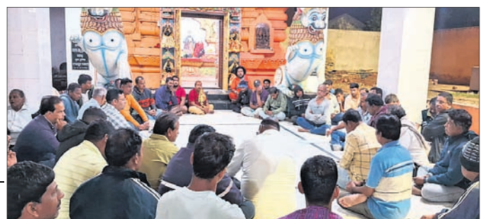
ମହାବୀର ମନ୍ଦିର ପ୍ରାଙ୍ଗଣରେ ଆୟୋଜିତ ପ୍ରସ୍ତୁତି ବୈଠକ ।

କରାଯିବା ସହ ଯଜ୍ଞ ଆରମ୍ଭ ହୋଇଛି । ଶ୍ରଦ୍ଧାଳୁମାନେ ଏହି ମନ୍ଦିରକୁ ଦେଖିବା ସହ ପ୍ରାକୃତିକ ସୌନ୍ଦର୍ଯ୍ୟର ଉପଭୋଗ କରୁଛନ୍ତି । ପାହାଡ଼କୁ କାଟି ନିର୍ମାଣ ହୋଇଛି ମନ୍ଦିର ଓ ରାସ୍ତା । ସେହିପରି ପାହାଡ଼ ଭିତରେ ନିର୍ମାଣ କରାଯାଇଛି ୧୮୦ ଫୁଟର ସୁଡ଼ଙ୍ଗ । ସୁଡ଼ଙ୍ଗ ଭିତରେ ମା' ବୈଷ୍ଣୋଦେବୀ ଆସ୍ଥାନ ରହିଛି । ୫୦ ଏକର ପାହାଡ଼ିଆ ଜମି ଉପରେ ଏହି ମନ୍ଦିର ରହିଛି ।