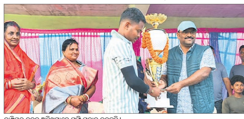
ଚାମ୍ପିୟନ ଦଳକୁ ଅତିଥିମାନେ ଟ୍ରଫି ପ୍ରଦାନ କରୁଛନ୍ତି।

ରାଜକନିକା କ୍ଲବ୍ ଗୁଆଁରେ ଚାଲିଥିବା ପ୍ରତି ଲୁଗା ପ୍ରୟୋଗିତ ଧର୍ମ ବାର୍ଷିକ ମଲ୍ଲ ବେହେରା ମେମୋରିଆଲ କ୍ରିକେଟ ଟୁର୍ଣ୍ଣାମେଣ୍ଟ... ଶେଷରେ ବାବା ରଘୁନାଥ ଜାଉ କ୍ରିକେଟ ଟିମ୍ କୋଇଲିପୁର, ବାଣୀପାଣି କ୍ରିକେଟ ଟିମ୍ ମହୁରାଗାଁକୁ ୪ ଉଇକେଟରେ ପରାସ୍ତ କରି ଚାମ୍ପିୟନ ହୋଇଛି।