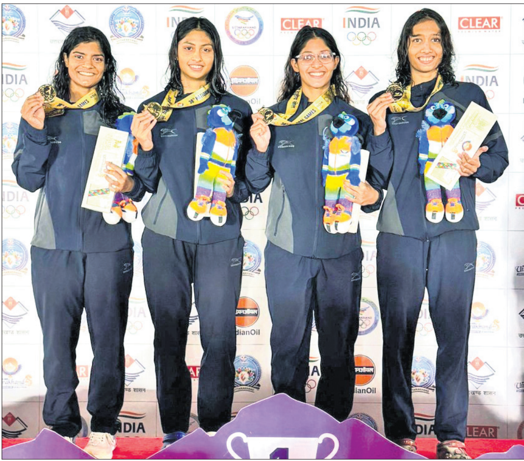
ଉତ୍ତରାଖଣ୍ଡରେ ଚାଲିଥିବା ଜାତୀୟ କ୍ରୀଡ଼ାର ୪୫୧୦୦ ମହିଳା ମିଡ଼ଲ ରିଲେରେ ସର୍ବପଦକ ବିଜୟୀ ଓଡ଼ିଶା ଦଳ।