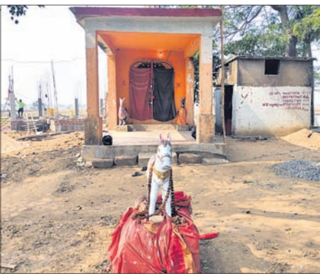
ଲୁଣାନ୍ଦା କୁଳ ତେରଗାଁ-ସାମନ୍ତସିଂହାରପୁର ମୌଜାରେ ବିରାଜିତ ବ୍ରହ୍ମ ଅମଣିଆ ମଠରେ ୩ ପଥରରେ ପୂଜା ପାଉଛନ୍ତି ଠାକୁର। ବାନ୍ଧିକୃତ ମୌଜାରେ ବିରାଜିତ ମା' ବ୍ରାହ୍ମଣୀ ଦେବୀଙ୍କ ମନ୍ଦିର।