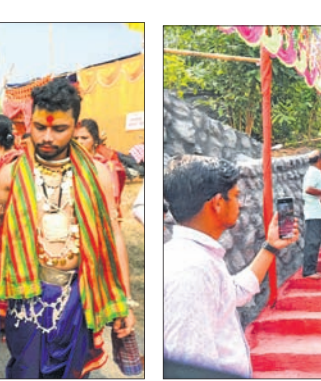
ବୈଷ୍ଣୋଦେବୀଙ୍କ ପ୍ରାଣ ପ୍ରତିଷ୍ଠା ଉତ୍ସବ ଅବସରରେ ଗୁରୁବାର ଆୟୋଜିତ କଳସ ଶୋଭାଯାତ୍ରା ।