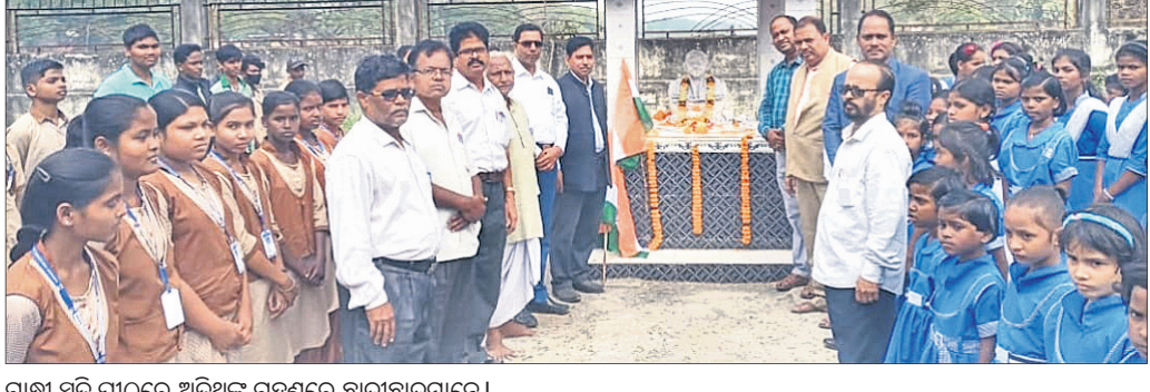
ଗାନ୍ଧୀ ସ୍ମୃତି ପାଠରେ ଅତିଥିଙ୍କ ଗହଣରେ ଛାତ୍ରାଛାତ୍ରୀମାନେ।