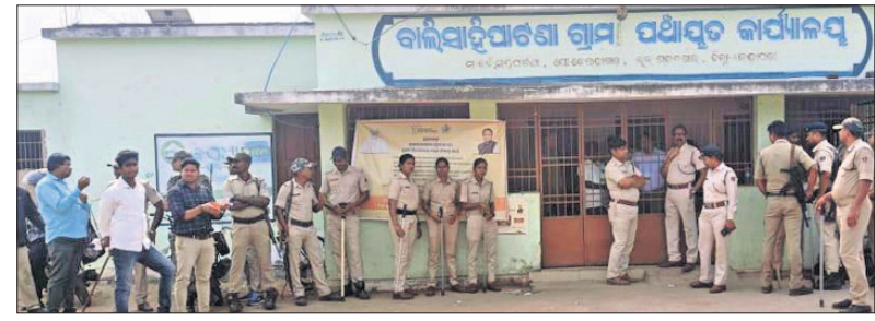
ବାଲିସାହିପାଟଣା ପଞ୍ଚାୟତରେ ପୋଲିସ୍ ବ୍ୟବସ୍ଥା ମଧ୍ୟରେ ଅନାୟା ଭୋଟ ନିଆଯାଇଛି ।

ବାଲିସାହିପାଟଣା ପଞ୍ଚାୟତ ଅନାୟା ଭୋଟ ■ ପୋଲିସ୍ ସୁରକ୍ଷାରେ ଭୋଟ ଦେବାକୁ ଆସିଲେ ଖାର୍ଚ୍ଚ ସଭ୍ୟସଭ୍ୟ ରାଜନଗର, ୩୦/୧ (ଭାସ୍କର ରାଉତରାୟ)