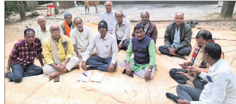
ବନ୍ଧୁମିଳନ ନାମରେ ପୁରୁଖା ନେତାଙ୍କ ରଘୁଲପୁର ଅଞ୍ଚଳରେ ବନ୍ଧୁମିଳନ ।

ଯାକପୁର ଜିଲ୍ଲା ରଘୁଲପୁର ବ୍ଲକ ଅନ୍ତର୍ଗତ ବାରବାଟୀ ପଞ୍ଚାୟତର ୧୬ନମ୍ବର କାଟାୟ ରାଜପଥ ପାର୍ଶ୍ୱସ୍ଥ ମା' ତାରିଣୀ ମନ୍ଦିର ପରିସରରେ ବନ୍ଧୁମିଳନ ଆଳରେ ଧର୍ମଶାଳା ନିର୍ବାଚନମଣ୍ଡଳ ବିଜେତାର ପୁରୁଖା ନେତାମାନଙ୍କ ଏକ ମେଳି ନିକଟରେ ଦେଖିବାକୁ ମିଳିଥିଲା । ୨୩ ଫେବୃଆରୀରେ ଏକ ସମାବେଶ ଆୟୋଜନ କରାଯିବାକୁ ଏଥିରେ ନିଷ୍ପତ୍ତି ନିଆଯାଇଥିବା ଶୁଣିବାକୁ ମିଳିଛି । ଏପରିକି ଏହାକୁ ସର୍ବକାୟା ସଭାରେ ପରିଣତ ପାଇଁ ନେତୃମଣ୍ଡଳୀ ମନସ୍ଥ କରିଛନ୍ତି । ବିଷୟ ନେତାମାନେ କଂଗ୍ରେସ, ବିଜେଡି, ଭାଜପା ଭଳି ପ୍ରମୁଖ ଦଳର ଅବହେଳିତ ପୁରୁଖାଙ୍କୁ ଏଥିରେ ସାମିଲ କରିବା ପାଇଁ ଯୋଗାଯୋଗ କରୁଛନ୍ତି । ଏଭଳି ପ୍ରସ୍ତାବକୁ ବିଭିନ୍ନ ମହଲରେ ସ୍ୱାଗତ କରାଯାଇଛି । ତେବେ ଆଗକୁ ସମାବେଶ କେଉଁ ରୂପ ଧାରଣ କରୁଛି ଓ ତାହା ଧର୍ମଶାଳାର ରାଜନୀତିକୁ କେତେ ପ୍ରଭାବିତ କରୁଛି ତାହା ସମୟକ୍ରମେ କ୍ଷଣିକ୍ଷଣ ହୋଇପାରିବ ବୋଲି ସ୍ଥାନୀୟ ଅଞ୍ଚଳରେ ଚର୍ଚ୍ଚା ହେଉଛି । ୨୦୨୪ ନିର୍ବାଚନରେ ଧର୍ମଶାଳାରେ ୩୦ବର୍ଷର ପରିବାରବାଦ ରାଜନୀତିରେ ରୋକ୍ ଲାଗିଛି । ଏଠି ସ୍ୱାଧୀନ ପ୍ରାର୍ଥୀ ଜିତିବା ପରେ ଭାଜପାରେ ସାମିଲ ହୋଇ ଦଳୀୟ କାର୍ଯ୍ୟକ୍ରମ ଜାରି ରଖିଛନ୍ତି । ବିଜେଡି ଶାସନ କାଳରେ ଅଲୋଡ଼ା ହୋଇଥିବା ପୁରୁଖା ନେତା ସ୍ୱାଧୀନ ପ୍ରାର୍ଥୀଙ୍କୁ ସମର୍ଥନ ଜଣାଇଥିଲେ । ଏଥିଯୋଗୁ ଧର୍ମଶାଳା ବିଜେତାର ପରାଜୟ ହୋଇଥିବା ଲୋକେ