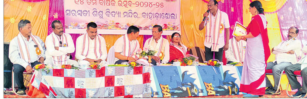
ବାର୍ଷିକ ଉତ୍ସବରେ ମଞ୍ଚସାଥୀ ଅତିଥି ।