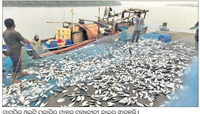
ସାମୁଦ୍ରିକ ଉଲଟି ପ୍ରକାରି ମାଛକୁ ମହାକାଳପଡ଼ା ଜାଲରୁ ଝାଡ଼ୁଛନ୍ତି।

କେନ୍ଦ୍ରାପଡ଼ା ଜିଲା ମହାକାଳପଡ଼ା ବ୍ଲକ୍ ଜନ୍ମ ଲକ୍ଷ୍ମୀ ମଧ୍ୟ ଅବତରଣ କେନ୍ଦ୍ର ବା ଜେଠରେ ୨ଟି ଡକ୍ଟା ୨ ଟନ୍ ୨୦ କେଜି ମାଛ ଧରା ପଡ଼ିଛନ୍ତି। ଏତେ ସଂଖ୍ୟାକ ମାଛ ଜାଲରେ ପଡ଼ିବାରୁ ଡକ୍ଟା ସମୁଦ୍ରରେ ଚଳମଳ ହୋଇଥିଲା। ମହାକାଳପଡ଼ାମାନେ ଏହି ଡକ୍ଟାକୁ କୌଶଳକ୍ରମେ କୁଳକୁ ଆଣିଥିଲେ। ଜେଠରେ ଜାଲରୁ ମାଛକୁ ଛଡ଼ାଇବାକୁ ମହାକାଳପଡ଼ାମାନଙ୍କୁ ଦୀର୍ଘ ସମୟ ଲାଗିଥିଲା। ଏମାନଙ୍କ ଭିତରୁ ଜଣେ ମହାକାଳପଡ଼ା କହିବା କଥା, ଅମାଳସ୍ୟା ପୂର୍ବଦିନ କୋହଲା ପାର ସାଙ୍ଗକୁ ଦକ୍ଷିଣା ପୂର୍ବ ଦିଗକୁ ଡକ୍ଟା ଫଳରେ ଏତେ ପରିମାଣର ମାଛ ପଡ଼ିଥିଲେ। ଏହି ମାଛକୁ ବେଶ୍ ମହାକାଳପଡ଼ାମାନେ ବେଶ୍ ଖୁସି ହୋଇଛନ୍ତି। ଏହି ଉଲଟି ପ୍ରକାରି ମାଛ ଜିଲୋ ପ୍ରତି ୨ ଶହେ ୩ ଶହ ଟଙ୍କା