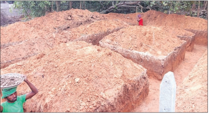
ତ୍ରିଶୁଳିଆ, ୩୦.୧ (ଭୃଷ୍ଣାଚକାଟ ବେହେରା)

ଗଲା ପରେ ପୁନର୍ବାର ଗୃହକର୍ତ୍ତା କାର୍ଯ୍ୟ ଆରମ୍ଭ କରିଦେଇଥିଲେ। ଏନେଇ ପୁନର୍ବାର ଅଭିଯୋଗ ହେବାରୁ ତହସିଲଦାର ନୋଟିସ୍ ହେବ କହିଥିଲେ।