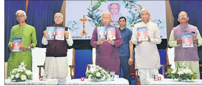
ଭୁବନେଶ୍ୱର, ୩୦.୧ (ସୌମ୍ୟରଞ୍ଜନ ରାଉତ)

ରାଷ୍ଟ୍ରୀୟ ସ୍ୱୟଂସେବକ ସଂଘ ଓଡ଼ିଶା ପୂର୍ବ ପକ୍ଷରୁ ସଂଘର ପୂର୍ବତନ ପ୍ରାନ୍ତ ସଂଘରାଜ୍ୟ ଶିବିରାମ ମହାପାତ୍ରଙ୍କ ଶ୍ରଦ୍ଧାଞ୍ଜଳି ସଭା ଉଦ୍ଘାଟନ କରାଯାଇଛି।