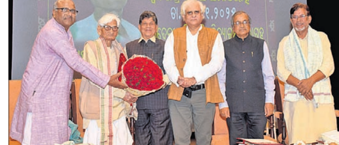
ଭୁବନେଶ୍ୱର, ୩୦.୧ (ସୂଚିକା ସାହୁ)

ଭାରତ ସ୍ୱାଧୀନ ହୋଇଛି, ମାତ୍ର ବାସ୍ତବରେ ଆମେ ସ୍ୱାଧୀନତା ପାଇନାହିଁ। ମଦ ବିରୋଧରେ ଲଢ଼େଇ କରନ୍ତୁ, ନଚେତ ୧୦୦ ବର୍ଷ ବେଳକୁ ଓଡ଼ିଶା କେବଳ ମଦ୍ୟପ ଓ ବିଧବାଙ୍କ ନାୟକଙ୍କ ସଭାପତିତ୍ୱରେ ଏକ କ୍ଷୁଦ୍ରରାଜ୍ୟ ସଭା କରାଯାଇଥିଲା।