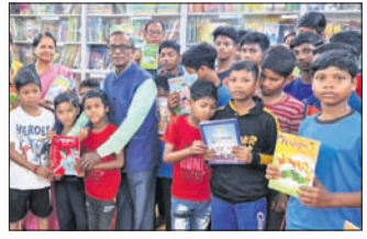
ଭୁବନେଶ୍ୱର, ୩୦.୧ (ସୂଚିକା ସାହୁ)

ଛାତ୍ରୀଛାତ୍ରୀଙ୍କୁ ପୁସ୍ତକ ବାଣ୍ଟିଲା ଝୁମୁକା ପାଠକୋଷ