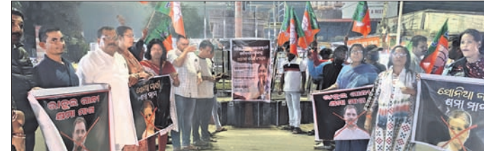
ଅନୁଗୋଳ ରାଜା ଛକଠାରେ ଭାଜପା ପକ୍ଷରୁ ବିକ୍ଷୋଭ ପ୍ରଦର୍ଶନ କରାଯାଇଛି ।