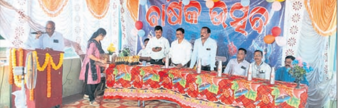
କାର୍ଯ୍ୟକ୍ରମରେ ମଞ୍ଚାଧୀନ ଅତିଥିମାନେ ।