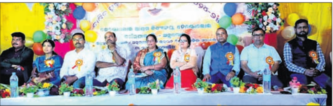
ବାର୍ଷିକ ଉତ୍ସବ ଅବସରରେ ମଞ୍ଚାଧୀନ ଅତିଥିଗଣ ।