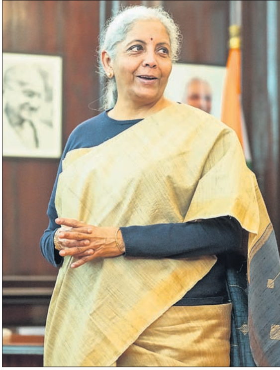
କେନ୍ଦ୍ରୀୟ ବଜେଟ ୨୦୨୫-୨୬ ଉପସ୍ଥାପନର ଦିନକ ପୂର୍ବରୁ ଏହାକୁ ଶେଷ ସ୍ପର୍ଶ ଦେବା ଅବସରରେ ଅର୍ଥମନ୍ତ୍ରୀ ନିର୍ମଳା ସୀତାରାମନ୍।