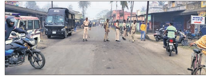
ଦୁର୍ଘଟଣାସ୍ଥଳରେ ପୋଲିସ୍ ପହଞ୍ଚିଛି ।