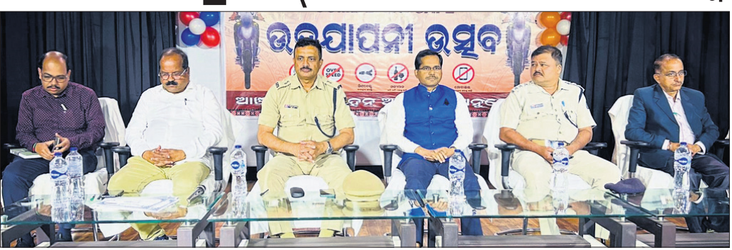
ସଡ଼କ ସୁରକ୍ଷା ମାସ ଉଦ୍‌ଘାଟନ ଉତ୍ସବରେ ମଞ୍ଚାଧୀନ ଅତିଥିମାନେ ।