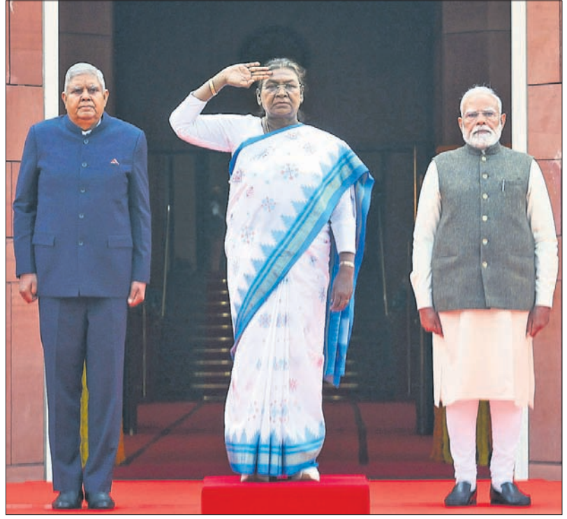
ବଜେଟ ଅଧିବେଶନର ପ୍ରଥମ ଦିନରେ ସଂସଦ ଭବନର ମିଳିତ ଅଧିବେଶନକୁ ସମୋଦଧନ କରିବା ପୂର୍ବରୁ ଲକ୍ଷ୍ନୋ ରାଷ୍ଟ୍ରପତି କୋଠାପା ମୁର୍ଦ୍ଦୁକା ଗାର୍ଡ ଅଫ ଅନର ଦିଆଯାଇଛି। ନିକଟରେ ଅଛନ୍ତି ଉପରାଷ୍ଟ୍ରପତି ଜଗଦୀପ ଧନକର ଓ ପ୍ରଧାନମନ୍ତ୍ରୀ ନରେନ୍ଦ୍ର ମୋଦି।

ଲୋକ ସଭା ନିର୍ବାଚନରେ ୧,୭୩୭ କୋଟି ବ୍ୟୟ କରିଛି ଭାଜପା