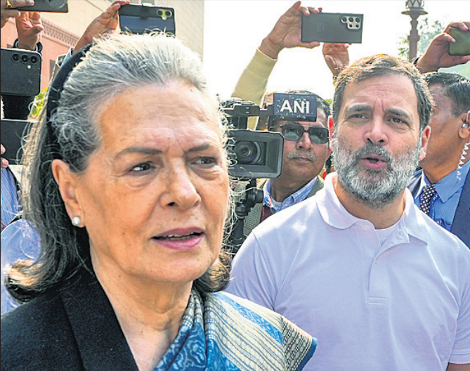
ପାର୍ଲିମେଣ୍ଟ ପରିସରରେ କଂଗ୍ରେସର ବରିଷ୍ଠ ନେତ୍ରୀ ସୋନିଆ ଗାନ୍ଧୀ ଓ ଲୋକ ସଭା ବିରୋଧୀ ଦଳ ନେତା ରାହୁଲ ଗାନ୍ଧୀ।