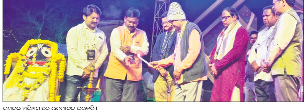
ଉତ୍ସବକୁ ଅତିଥିମାନେ ଉଦ୍‌ଘାଟନ କରୁଛନ୍ତି।