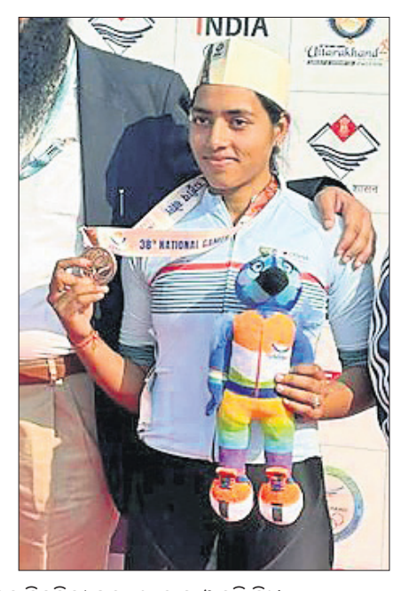
ଉଷ୍ମ ଫାଇନାଲରେ ପ୍ରବେଶ କରିଥିବା ମଣ୍ଡଳୀ ମଣ୍ଡଳୀ।