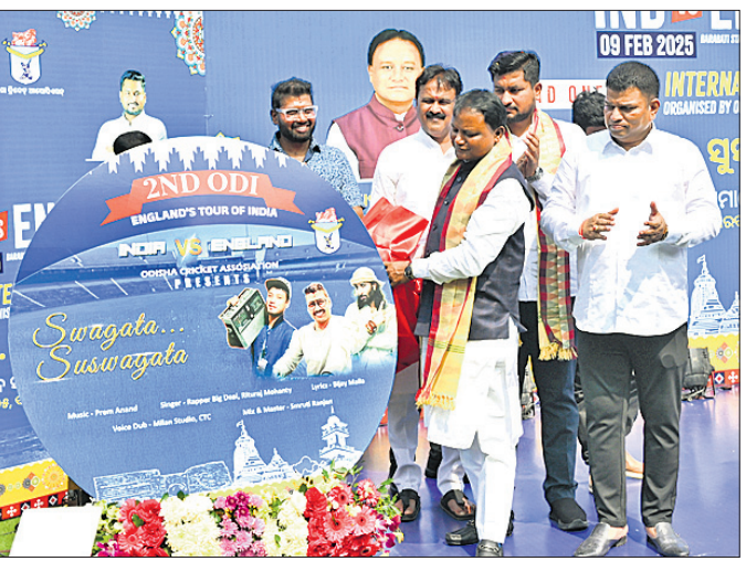
ଥମ ସଙ୍ଗୀତ 'ସାଗତ ସୁସାଗତ' ଭବୋତନ କରୁଛନ୍ତି ମୁଖ୍ୟମନ୍ତ୍ରୀ ମୋହନ ଚରଣ ମାଝୀ ।