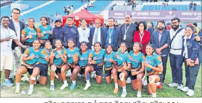
ମହିଳା ରଗ୍‌ବୀରେ ସ୍ୱର୍ଣ୍ଣ ପଦକ ବିଜୟୀ ଓଡ଼ିଶା ମହିଳା ଦଳ।

ସେ ଏହି ସଫଳତା ପାଇଛନ୍ତି। ମହିଳା ଖୋ ଖୋ ଦଳ କର୍ମଚରୀଙ୍କୁ ୩୬-୨୩ରେ ହରାଇ ଫାଇନାଲରେ ପ୍ରବେଶ କରିଛି। ସେହିପରି ରାଜ୍ୟର ଉଷ୍ମ ଖେଳାଳିମଣ୍ଡଳୀ ଫାଇନାଲରେ ପ୍ରବେଶ କରିଛନ୍ତି। ଶୁକ୍ରବାର ସେ ମହିଳା ସାଥୀର ୪୫ କେଜି ବର୍ଗରେ ଦିଲ୍ଲୀ ପ୍ରତିଯୋଗୀଙ୍କୁ ପରାସ୍ତ କରିଛନ୍ତି। ସେହିପରି ଓଡ଼ିଶା ମହିଳା ରଗ୍‌ବୀ ଦଳ ଫାଇନାଲରେ ବିହାରକୁ ୨୯-୫ରେ ୧୮୯ କେଜି ଭାରୋଳନ କରି ସ୍ୱର୍ଣ୍ଣ ପଦକ ଅର୍ଜନ କରିଛି।