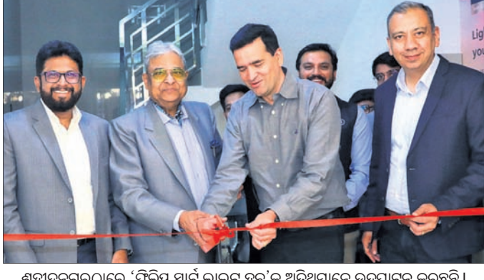
ଶହୀଦନଗରଠାରେ 'ଫିଲିପ୍ ସ୍ମାର୍ଟ ଲାଇଟ୍ ହବ୍'କୁ ଅଭିଯାନରେ ଉଦ୍ଘାଟନ କରୁଛନ୍ତି ।

ଭୁବନେଶ୍ୱର, ୩୧।୧ ସିଡିପିଏଏଏ ବହୁ ପ୍ରତୀକ୍ଷିତ ଚାଲି ସର୍ବସୁତ୍ତର ଅଭିଯାନରେ 'ଫିଲିପ୍ ସ୍ମାର୍ଟ ଲାଇଟ୍ ହବ୍' ଭୁବନେଶ୍ୱରର ସହୀଦନଗରଠାରେ ଉଦ୍ଘାଟିତ ହୋଇଯାଇଛି । ଏପରିକି ଏହି ଷ୍ଟୋର ୧୬୦୦ ବର୍ଗଫୁଟ ଅଞ୍ଚଳରେ ପରିବ୍ୟାପ୍ତ ହୋଇଥିଲା ବେଳେ ଉଚ୍ଚ ଷ୍ଟୋରରେ ୪୫୦ ଏକକରୁ ଅଧିକର ଏକ ବିସ୍ତୃତ ସିଲିକନ୍ ରହିଛି । ଏ ସମ୍ପର୍କରେ ସିଡିପିଏଏଏ ଗ୍ରୋପର ଇଣ୍ଡିଆର ସିଇଓ ଚାଲି ସର୍ବସୁତ୍ତର ଯୋଜନା କରାଯାଇଛି, ଓଡ଼ିଶାରେ ଆମେ ଆମର ସବୁଠାରୁ ବଡ଼ ଏକକରୁ ଏବଂ ବିଶ୍ୱର ପ୍ରମୁଖ ଅଂଶଦାରମାନଙ୍କୁ ଏକତ୍ର କରିବା ଉପରେ ଆଧାର ରଖି ଏବଂ ସମସ୍ତଙ୍କୁ ପ୍ରଦର୍ଶନ କରିଛି ।