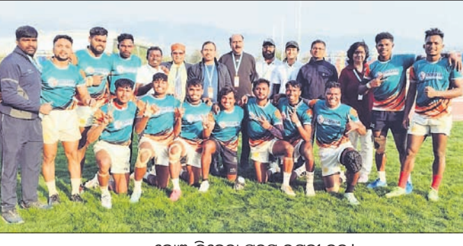
ଗ୍ରୋଜି ବିଜେତା ପୁରୁଷ ରଗ୍‌ବୀ ଦଳ।