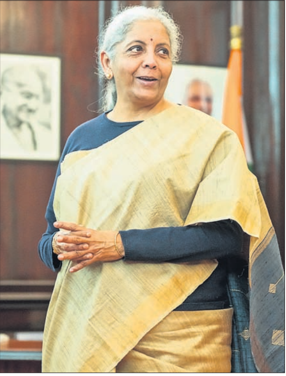
କେନ୍ଦ୍ରୀୟ ବଜେଟ ୨୦୨୫-୨୬ ଉପସ୍ଥାପନର ଦିନକ ପୂର୍ବରୁ ଏହାକୁ ଶେଷ ସ୍ପର୍ଶ ଦେବା ଅବସରରେ ଅର୍ଥମନ୍ତ୍ରୀ ନିର୍ମଳା ସୀତାରାମନ୍।