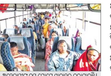
ଅନ୍ତେବାସୀଙ୍କୁ ସ୍ୱାଗତ କରି ଗୋଷ୍ଠୀ କରାଯାଇଛି।

ସମ୍ବଲପୁର, ୩୧୧୧ (ପ୍ରମୋଦ ବହିରା) ସମ୍ବଲପୁର ଜିଲ୍ଲା ଧନୁପାଳ ଥାନା ନେତାଜୀ କଲୋନିଆର ଅଧିକାରୀଙ୍କୁ ନିର୍ଯାତନା ମାମଲାରେ ଅଧିକାରୀ କେନ୍ଦ୍ରକୁ ଶୁକ୍ରବାର ସମ୍ପୂର୍ଣ୍ଣ ଭାବେ ସିଲ୍ କରାଯାଇଛି।