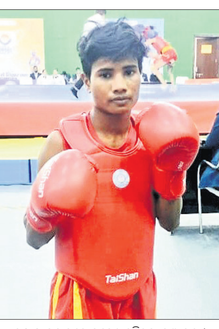
ଉଷ୍ମ ଫାଇନାଲରେ ପ୍ରବେଶ କରିଥିବା ମଣ୍ଡଳୀ ମଣ୍ଡଳୀ।

ଭରତୀୟରେ ଚାଲିଥିବା ଜାତୀୟ କ୍ରୀଡ଼ାରେ ଓଡ଼ିଶା ପ୍ରତିଯୋଗୀଙ୍କ ପ୍ରଭାବୀ ପ୍ରଦର୍ଶନ ଜାରି ରହିଛି। ଭାରୋଳନରେ ଓ ପ୍ରତିଯୋଗୀଙ୍କୁ ୧୮୯ କେଜି ଭାରୋଳନ କରି ୪୫ କେଜି ବର୍ଗରେ ୧୮୦ କେଜି ସହ ୫ମ ସ୍ଥାନରେ ସମ୍ମାନ ରହିଛି। ସେହିପରି ଓଡ଼ିଶା ମହିଳା ରଗ୍‌ବୀ ଦଳ ଫାଇନାଲରେ ବିହାରକୁ ୨୯-୫ରେ ୧୮୯ କେଜି ଭାରୋଳନ କରି ସ୍ୱର୍ଣ୍ଣ ପଦକ ଅର୍ଜନ କରିଛି।