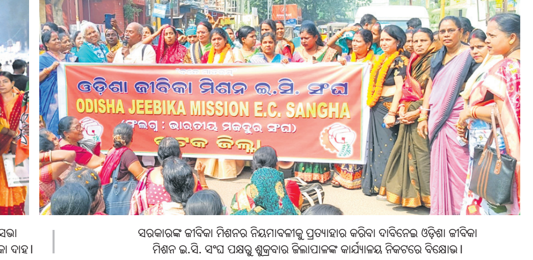
ସରକାରଙ୍କ ଜୀବିକା ମିଶନର ନିୟମାବଳୀକୁ ପ୍ରତ୍ୟାହାର କରିବା ଦାବିକରି ଓଡ଼ିଶା ଜୀବିକା ମିଶନ ଇ.ସି. ସଂଘ ପକ୍ଷରୁ ଶୁକ୍ରବାର ଜିଲ୍ଲାପାଳଙ୍କ କାର୍ଯ୍ୟାଳୟ ନିକଟରେ ବିରୋଧ।