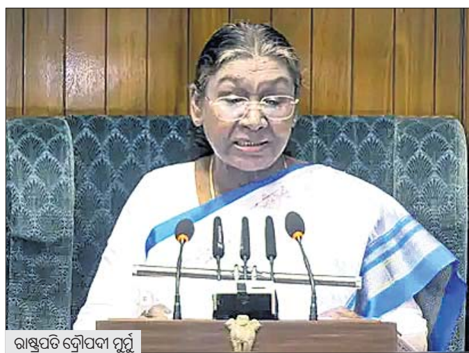
ରାଷ୍ଟ୍ରପତି ଦ୍ରୌପଦୀ ମୂର୍ଦ୍ଧା

ସଂସଦରେ ୨୦୨୫-୨୬ ଆର୍ଥିକବର୍ଷର ବଜେଟ ଉପସ୍ଥାପନ ହେବାର ଦିନକ ପୂର୍ବରୁ ଶୁକ୍ରବାର ରାଷ୍ଟ୍ରପତି ଦ୍ରୌପଦୀ ମୂର୍ଦ୍ଧା ଉଭୟ ସଦନର ଅଧିବେଶନକୁ ସମ୍ବୋଧିତ କରିଛନ୍ତି। ରାଷ୍ଟ୍ରପତିଙ୍କ ଅଭିଭାଷଣରେ ବିକଶିତ ଭାରତର ଚିତ୍ର ଦେଖିବାକୁ ମିଳିଛି। ବିଶେଷକରି ୩ କୋଟି ଗରିବ ପରିବାରକୁ ପ୍ରଧାନମନ୍ତ୍ରୀ ଆବାସ ଯୋଜନାରେ ଘର ବନ୍ଧନ ଏବଂ ଆୟୁଷ୍ମାନ ଭାରତ ସ୍ୱାସ୍ଥ୍ୟ ବାମାକୁ ୭୦ ବର୍ଷରୁ ଉର୍ଦ୍ଧ୍ୱ ବୟସ ୬ କୋଟି ବରିଷ୍ଠ ନାଗରିକଙ୍କ ପାଇଁ ପରିବର୍ଦ୍ଧିତ କରିବା ଭଳି କେନ୍ଦ୍ର ସରକାରଙ୍କ ପୋଲିସିଟିକ୍ ଏଫ୍ରେର ଘ୍ନାନ ପାଇଛି। ରାଷ୍ଟ୍ରପତି ପୂର୍ବାହ୍ନ ୧୧ଟାରେ ସଂସଦରେ ପହଞ୍ଚିବା ପରେ ତାଙ୍କୁ ଗାର୍ଡ ଅଫ୍ ଅନର ଦିଆଯାଇଥିଲା। ଏହା ପରେ ସେ