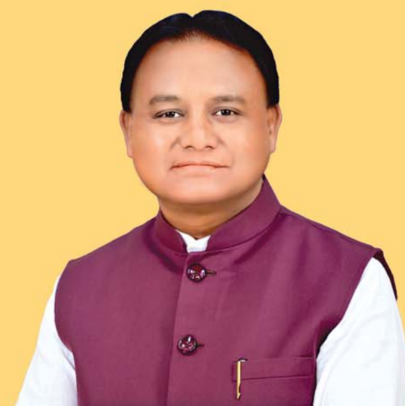
ଶ୍ରୀ ମୋହନ ଚରଣ ପ୍ରାସାଦୀ ମୁଖ୍ୟମନ୍ତ୍ରୀ, ଓଡ଼ିଶା