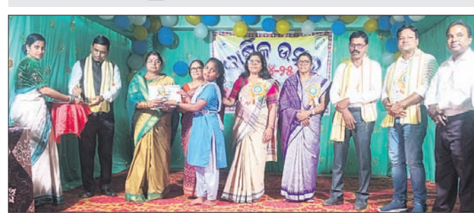
କଣେ କୁଟା ଛାତ୍ରାଳୟ ଅତିଥି ପୁରସ୍କୃତ କରୁଛନ୍ତି।