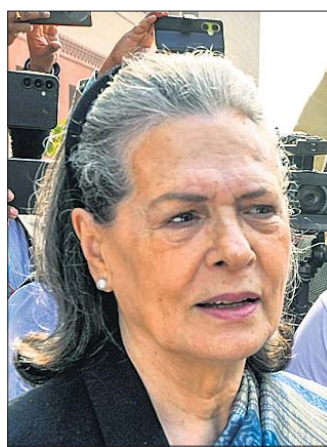
ପାଇଁ ମେଣ୍ଟ ପରିସରରେ କଂଗ୍ରେସ ନେତ୍ରୀ ସୋନିଆ ଗାନ୍ଧୀ

ରାଷ୍ଟ୍ରପତି ଦ୍ରୌପଦୀ ମୂର୍ଦ୍ଧା ଶୁକ୍ରବାର ପୂର୍ବାହ୍ନ ୧୧ଟାରେ ପାଇଁ ମେଣ୍ଟରେ ପହଞ୍ଚିଥିଲେ। ପାରମ୍ପରିକ ଭାବେ ଉଭୟ ସଦନର ମିଳିତ ଅଧିବେଶନକୁ ସେ ସମ୍ବୋଧିତ କରିଥିଲେ। ରାଷ୍ଟ୍ରପତିଙ୍କ ଅଭିଭାଷଣ ପରେ ଏମ୍ପିମାନେ ସଂସଦକୁ ବାହାରୁଥିବାବେଳେ ସେହି ପରିସରରେ କଂଗ୍ରେସ ସଂସଦୀୟ ନେତ୍ରୀ ସୋନିଆ ଗାନ୍ଧୀ, ଲୋକ ସଭାର ବିରୋଧୀ ଦଳ ନେତା ରାଜ୍ଞା ଗାନ୍ଧୀ ଏବଂ ଝେନାହ୍ ଏମ୍ପି ପ୍ରିୟଙ୍କା ଗାନ୍ଧୀ ଛଡ଼ାହୋଇ ପରସ୍ପର ମଧ୍ୟରେ ଆଲୋଚନା କରୁଥିଲେ। ଏହି ସମୟରେ ଗଣମାଧ୍ୟମ ପ୍ରତିନିଧି ସେମାନଙ୍କୁ ଘେରିବାକୁ ଚାହିଁଥିଲେ। ରାଜ୍ଞା ରାଷ୍ଟ୍ରପତିଙ୍କ ଅଭିଭାଷଣକୁ ବୋରି (ବିରକ୍ତିକର) ବୋଲି କହିଥିଲେ। ସୋନିଆ କହିଥିଲେ, 'ଦି ପୁଅର ଲେଡି, ଦି