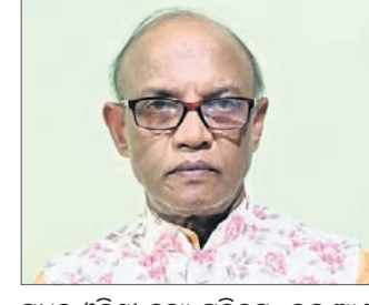
ମଧ୍ୟ ଓଡ଼ିଶା ନୃତ୍ୟ ପରିଚୟ, ଇନ୍ଦ୍ର ଆଣ୍ଡ ଆର୍ଟ୍ସ ଅଫ୍ ଓଡ଼ିଶା ତ୍ୟାଗୁ ଏବଂ ହିନ୍ଦି ଅଫ୍ ଓଡ଼ିଶା ତ୍ୟାଗୁ ଆମାଜନର ବେଷ୍ଟ ଭାଷାରେ ଓଡ଼ିଶାର ପୁସ୍ତକପ୍ରଭା ପରିଚୟ, ବେଙ୍ଗାଲୁରୁରୁ ନୂତନ ପବ୍ଲିକେଶନ ଏବଂ ଆମାଜନର କିଶଳ ଏଡିଟିନ ଦ୍ୱାରା ପ୍ରକାଶିତ ହୋଇଛି। ଏହି ପୁସ୍ତକଗୁଡ଼ିକ

ହେବା ଚୌରବର ବିଷୟ। ନୃତ୍ୟ କ୍ଷେତ୍ରରେ ଅନେକ ସୁଜନାମକ, ଶାସ୍ତ୍ରୀୟ ଏବଂ ପାରମ୍ପରିକ ଚଢ଼ ଚାଳ ପୁସ୍ତକର ଆଧାର ହୋଇଥିବାରୁ ଏହା ବିଶେଷ ଉପାଦେୟ ହୋଇପାରିଛି। ଏହାବ୍ୟତୀତ ଆମେରିକାର ଖାଲ ମାର୍ଟ, ଆରବ ଏମିରେଟ୍ସ ଟ୍ରେଡ୍ ଲିଙ୍କ ପୁସ୍ତକଗୁଡ଼ିକର ବ୍ୟବସାୟିକ ପରିଚାଳନା ପାଇଁ ଲେଖକଙ୍କ ସହ ସହଯୋଗ ହୋଇଛି। ନୃତ୍ୟ କ୍ଷେତ୍ରରେ ଗବେଷଣା ଓ ପେଷାଦାର ଶିଳ୍ପୀଙ୍କଠାରୁ ଆରମ୍ଭ କରି ନୂତନ ଶିଳ୍ପୀଙ୍କ ପର୍ଯ୍ୟନ୍ତ ସ୍ତରୀଭିତ୍ତ ହେବା ସହ ଭାରତ ଏବଂ ବିଶ୍ୱ ଆମାଜନର କିଶଳ ଏଡିଟିନ ଦ୍ୱାରା ପ୍ରକାଶିତ ହୋଇଛି। ଏହି ପୁସ୍ତକଗୁଡ଼ିକ