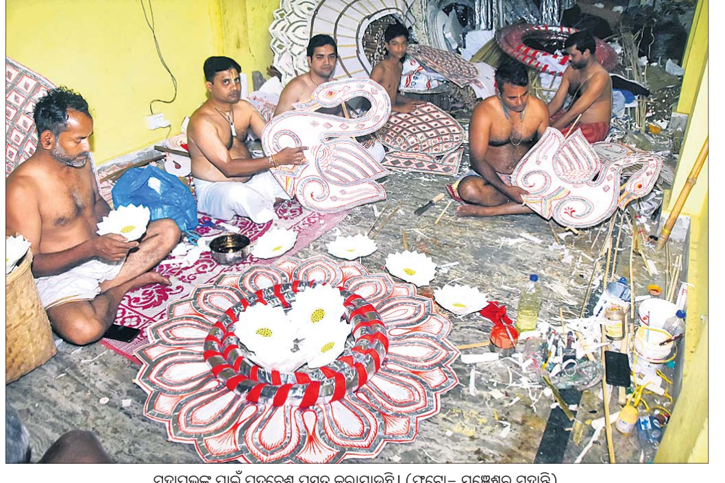
ମହାପ୍ରଭୁଙ୍କ ପାଇଁ ପଦ୍ମବେଶ ପ୍ରସ୍ତୁତ କରାଯାଇଛି।