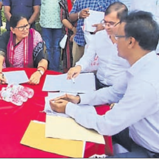
ଉପମୁଖ୍ୟମନ୍ତ୍ରୀ ପ୍ରଭାତୀ ପରିଡ଼ା ପ୍ରକଳ୍ପ ସମ୍ପର୍କରେ ସମୀକ୍ଷା କରୁଛନ୍ତି।

ଏହି ପ୍ରକଳ୍ପ ପାଇଁ ଆବଶ୍ୟକ ଅର୍ଥ ଯୋଗାଇଦେବାକୁ ପୂର୍ବରୁ ମୁଖ୍ୟମନ୍ତ୍ରୀ ପ୍ରତିଷ୍ଠିତ ଦେଇଥିବାବେଳେ କାର୍ଯ୍ୟ ଶୀଘ୍ର ଆରମ୍ଭ କରିବାକୁ ଉପମୁଖ୍ୟମନ୍ତ୍ରୀ ପରିଡ଼ା ଅଧିକାରୀମାନଙ୍କୁ କହିଥିଲେ। ବେଆଇନ