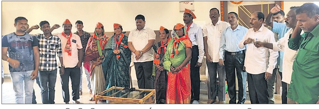
ବିଜେଡି ଛାଡ଼ି ନାଏବ ସରପଞ୍ଚ ଓ ଓଡ଼ିଆ ସଭା ସଭ୍ୟ ଭାଜପାରେ ଯୋଗ ଦେଇଛନ୍ତି।