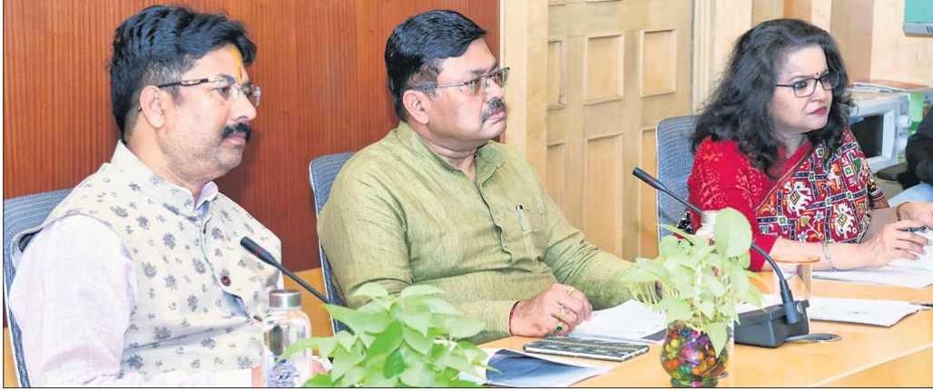
ଲୋକସେବା ଭବନରେ ଅନୁଷ୍ଠିତ ବୈଠକରେ ପୂର୍ଣ୍ଣମନ୍ତ୍ରୀ ପ୍ରଫୁଲ୍ଲ କୁମାର ହରିଚନ୍ଦନ, ନଗର ଉନ୍ନୟନ ମନ୍ତ୍ରୀ କୁମୁଦ୍ରା ମହାପାତ୍ର ଓ ଉନ୍ନୟନ କମିଶନର ଅନୁ ଗର୍ଗା।