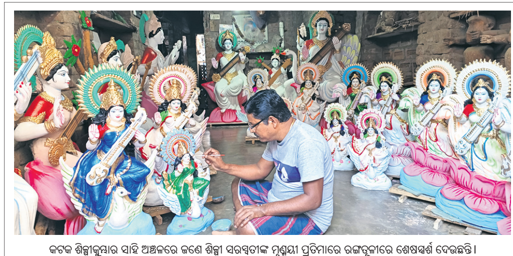
କଟକ ଶିଳ୍ପାକୁସାର ସାହି ଅଞ୍ଚଳରେ ଜଣେ ଶିଳ୍ପୀ ସରସ୍ୱତୀଙ୍କ ମୂର୍ତ୍ତୀ ପ୍ରତିମାରେ ରଙ୍ଗବୃକ୍ମାରେ ଶେଷଭର୍ଣ୍ଣ ଦେଉଛନ୍ତି।