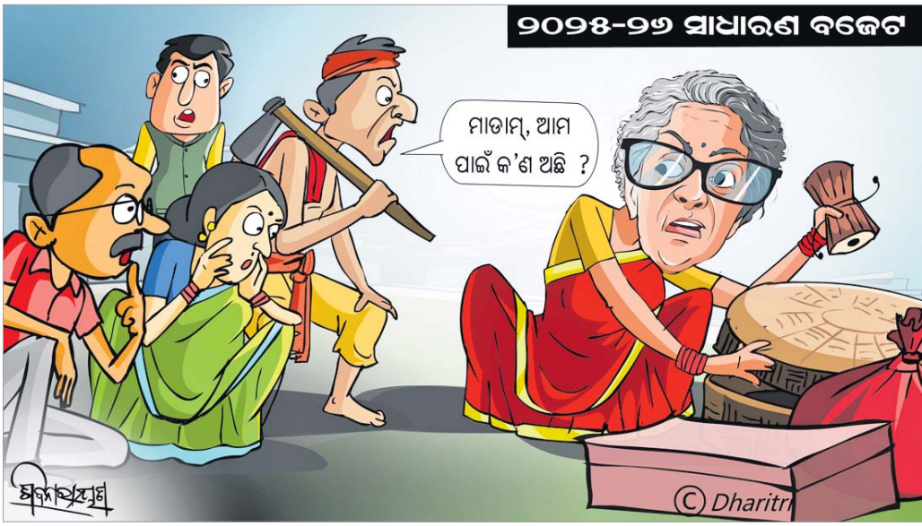
୨୦୨୫-୨୬ ସାଧାରଣ ବଜେଟ