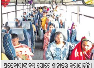
ଅନ୍ତେବାସୀଙ୍କୁ ବନ୍ଦୀ ଯୋଗେ ଘ୍ନାନପତ୍ର କରାଯାଇଛି।

ସଂସ୍ଥା ସମ୍ପାଦକଙ୍କ ବିରୋଧରେ କଲ୍ୟାଣ ଅଭିଯୋଗ କରିଥିବା ମହିଳା ଅନ୍ତେବାସୀଙ୍କୁ ସମ୍ପୂର୍ଣ୍ଣ ଅଧିକାର କେନ୍ଦ୍ରରେ ରଖାଯାଇଛି। ଜିଲ୍ଲା ସାମାଜିକ ସୁରକ୍ଷା ବିଭାଗ ପକ୍ଷରୁ ସମର୍ଥ ଅଧିକାର କେନ୍ଦ୍ରର ଦାୟିତ୍ୱ ଅପସାରଣ କରାଯାଇ ବର୍ତ୍ତମାନ ଅନ୍ତେବାସୀଙ୍କୁ ଯତ୍ନ ଓ ଉପଯୁକ୍ତ ରକ୍ଷଣାବେକ୍ଷଣ ଦାୟିତ୍ୱ ପିଠୁଳ ଫୋରମ୍ ଦିଆଯାଇଛି। ଶୁକ୍ରବାରଠାରୁ ପିଠୁଳ ଫୋରମ୍ ସେମାନଙ୍କ ଯତ୍ନେନା କାର୍ଯ୍ୟ ଆରମ୍ଭ କରିଛି।