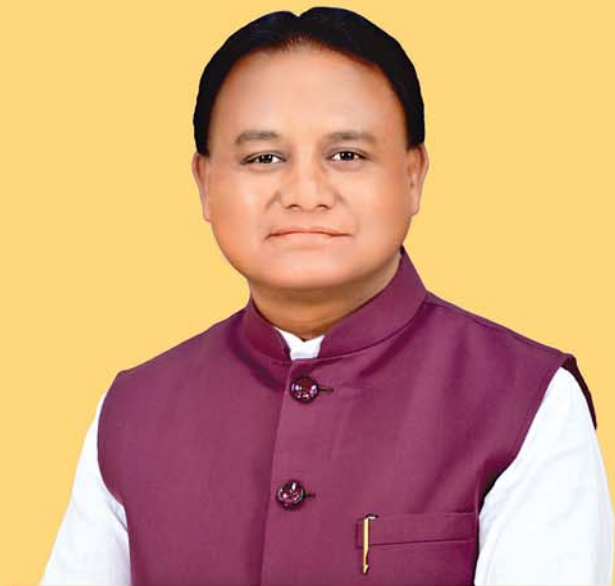
ଶ୍ରୀ ନରେନ୍ଦ୍ର ମୋଦୀ ପ୍ରଧାନମନ୍ତ୍ରୀ