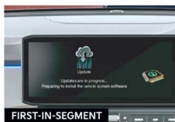
FIRST-IN-SEGMENT Kia Connect 2.0** with Over-the-Air (OTA) Software Updates and Other 80+ Connected Car Features