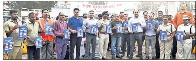
ଦେଢ଼ାନାଳ, ୧୨ (ରତନ ନାୟର)

ଗାଟାଷ୍ଟିଳ ମେରାଠକଣୀ(ଟିଏସ୍‌ଏମ୍) ପକ୍ଷରୁ ସଡ଼କ ସୁରକ୍ଷା ମାସ ପାଇଁ ଅବସରରେ ଶନିବାର ୫୫୫୯ ଜାତୀୟ ସଚେତନତା ସଭାରେ ଏକ ସଡ଼କ ସୁରକ୍ଷା ସଚେତନତା ଅଭିଯାନ ଆୟୋଜିତ ହୋଇଥିଲା ।