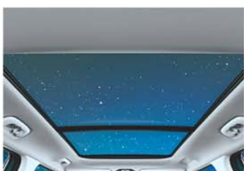
Dual Pane Panoramic Sunroof