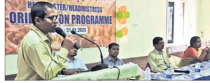
ଦେଢ଼ାନାଳ, ୧୨ (ରତନ ନାୟର)

ଦେଢ଼ାନାଳ ସହର ଉପକଣ୍ଠ ବୋରାପଦାସ୍ଥିତ ସରକାରୀ ଶିଳ୍ପ ତାଲିମ୍ ପ୍ରତିଷ୍ଠାନ ପରିସରରେ ଶିଳ୍ପାୟତ୍ତା ପ୍ରଶିକ୍ଷଣ କାର୍ଯ୍ୟକ୍ରମ ଶୁକ୍ରବାର ଅବସରରେ ଉଦ୍‌ଘାଟିତ ହୋଇଯାଇଛି । ଏହି କାର୍ଯ୍ୟକ୍ରମରେ ସର, ଓଡ଼ାପଡ଼ା, ହିନ୍ଦୋଳ ଏବଂ ଗର୍ଭିଆ ବୁକର ୧୧୪୪ଜଣ ପ୍ରଧାନ ଶିକ୍ଷୟିତ୍ରୀ, ପ୍ରଧାନ ଶିକ୍ଷକ ଯୋଗଦେଇଥିଲେ ।