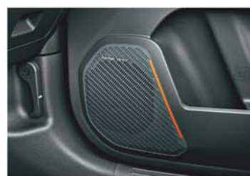
Harman Kardon Premium 8 Speakers Sound System