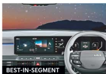
BEST-IN-SEGMENT 76.20 cm (30") Trinity Panoramic Display Panel