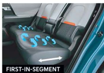
FIRST-IN-SEGMENT 2 nd Row Seat Reclining & Sliding with Seat Ventilation