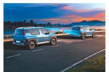
ADAS Level 2* with 16 Smart Autonomous & Robust 20 Standard Safety Features