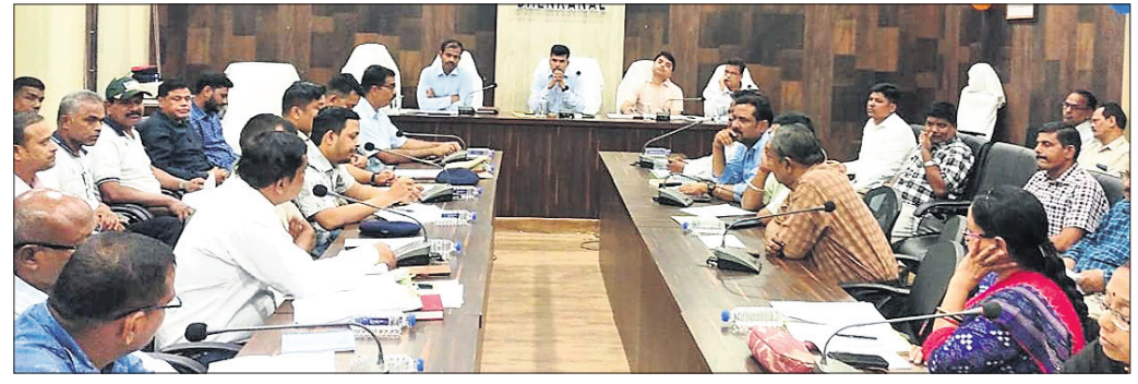
ଦେଢ଼ାନାଳ, ୧୨ (ରତନ ନାୟର)

ରାଜ୍ୟ ତଥା ଦେଢ଼ାନାଳ ଜିଲାର ପ୍ରସିଦ୍ଧ ଶୈବପୀଠ କପିଳାସରେ ମହାପ୍ରଭୁ ଶ୍ରୀଶ୍ରୀ ଚନ୍ଦ୍ରଶେଖର ଜାଗର ପ୍ରସିଦ୍ଧ ଜାଗର ଯାତ୍ରା ଆରମ୍ଭ ୨୨ ତାରିଖରେ ଅନୁଷ୍ଠିତ ହେଉଛି । ଏଥିପାଇଁ ଶନିବାର ପୂର୍ବାହ୍ନ ସାଢ଼େ ୧୧ଟାରେ ଜିଲା କାର୍ଯ୍ୟାଳୟ ସହକାରକ ମୁଖ୍ୟ ସଚିବଙ୍କୁ ପ୍ରସ୍ତୁତ କରାଯାଇଛି ।