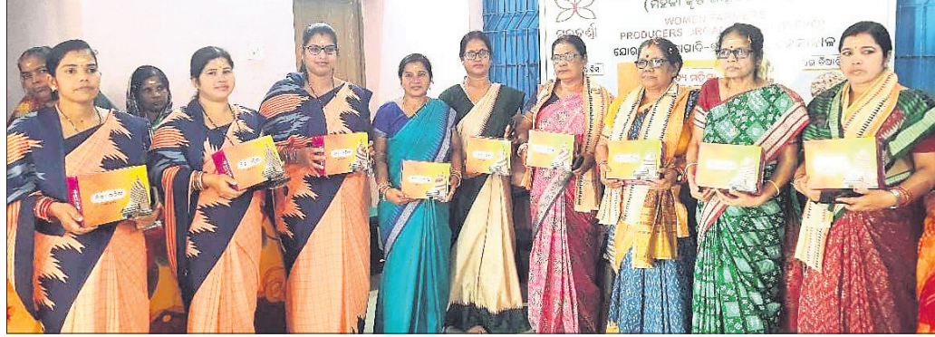
ଦେଢ଼ାନାଳ, ୧୨ (ରତନ ନାୟର)

ଯୋଗାଣ, ଅଗ୍ନି ନିର୍ବାପକ ବ୍ୟବସ୍ଥା, ଯାନବାହାନ ନିୟନ୍ତ୍ରଣ, ବୋକାଳ ବକାର ନିମନ୍ତେ ସ୍ଥାନ ନିରୂପଣ, ପାଠରେ ପରିଷ୍କାର ପରିଚ୍ଛନ୍ନତା, ସାଧୁ ପ୍ରତିକାର ବ୍ୟବସ୍ଥା, ଆଶୁ ଚିକିତ୍ସା ଓ ପାର୍କି ବ୍ୟବସ୍ଥା ସମ୍ପର୍କରେ ଆଲୋଚନା ହୋଇଥିଲା ।