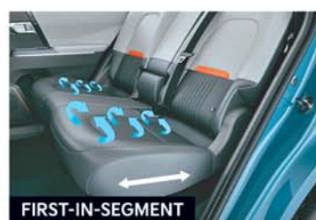
2 nd Row Seat Reclining & Sliding with Seat Ventilation