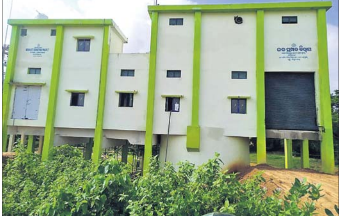
ପାର୍ବତୀ ଗିରି ମେଘା ଭଠା ଜଳସେଚନ ପ୍ରକଳ୍ପ ।

ପାର୍ବତୀ ଗିରି ମେଘା ଭଠା ଜଳସେଚନ ପ୍ରକଳ୍ପ ମଧ୍ୟରେ ଯାଜପୁର ଜିଲାର ୧୨,୮୦୦ ହେକ୍ଟର ଜମିରେ ଜଳସେଚନର ପରିଚାଳନା ହୋଇଥିଲା। ହେଲେ ଏହି ପରିଚାଳନାକୁ ପ୍ରାୟ ୧୫ ବର୍ଷ ଅତିକ୍ରମ କରିବାକୁ ପଡ଼ିଥିଲା। ଏହାର ସମ୍ପର୍କ ଏବଂ ଭବିଷ୍ୟତର ଅଭିବୃଦ୍ଧି ଆକାଶ ଗାଧୁନୀ ଭାବେ ମନେକରାଯାଇଛି। ଯାଜପୁର, ୧୨ (ହର୍ଷବର୍ଦ୍ଧନ ବେହେରା) :