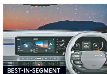
76.20 cm (30") Trinity Panoramic Display Panel