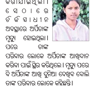
କଳିଙ୍ଗନଗର, ୧୨ (ଶୁଭାଶିଷ ରାଉତ) :

କଳିଙ୍ଗନଗର, ୧୨ (ଶୁଭାଶିଷ ରାଉତ) : ଦାନକର ବନ୍ଧା ନିକଟରେ ଶୁକ୍ରବାର ଝୁଣ୍ଟାଟ ଯାଜପୁରରେ ହୋଇଥିଲା। ଯାଜପୁର, ୧୨ (ଶୁଭାଶିଷ ରାଉତ) :