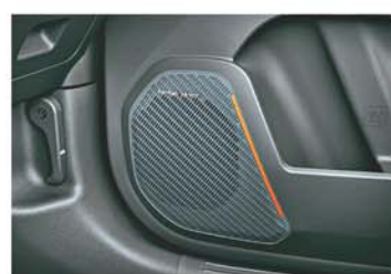
Harman Kardon Premium 8 Speakers Sound System