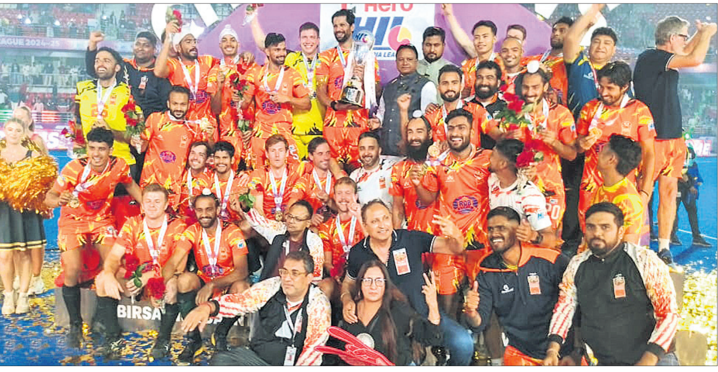
ହକି ଇଣ୍ଡିଆ ଲିଗ୍ ଚାମ୍ପିୟନ ରତ୍ନ ବେଙ୍ଗଲ ଚାଲଗର୍ସ ଦଳକୁ ପୁଖ୍ୟମନ୍ତ୍ରୀ ମୋହନ ଚରଣ ମାଝୀ ଓ ଅନ୍ୟ ଅତିଥିମାନେ ପୁରସ୍କାର ପ୍ରଦାନ କରୁଛନ୍ତି।