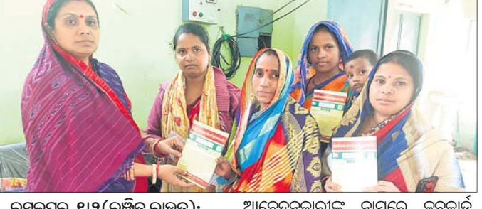
ରଞ୍ଜିତ ପୂର୍ଣ୍ଣାୟାମରେ ଜର୍ଦ୍ଧାନ ବଣ୍ଟନ ମେଳା ।

ରଞ୍ଜିତ ପୂର୍ଣ୍ଣାୟାମରେ ଜର୍ଦ୍ଧାନ ବଣ୍ଟନ ମେଳା ଯାଜପୁରରେ ଅନୁଷ୍ଠିତ ହୋଇଥିଲା। ଯାଜପୁର, ୧୨ (ରଞ୍ଜିତ ରାଉତ) :