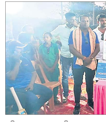
ଅତିଥି ଗଣରେ ଖେଳାଳିମାନେ ।

କୋରେଇ ରୁକ୍ମିଣୀ ଚାମ୍ପିୟନ ହୋଇଛନ୍ତି । ଯାଜପୁର, ୧୨ (ପରମେଶ୍ୱର ପତି) :