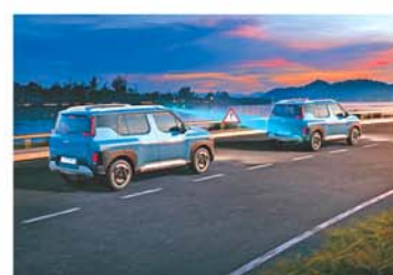
ADAS Level 2+ with 16 Smart Autonomous & Robust 20 Standard Safety Features