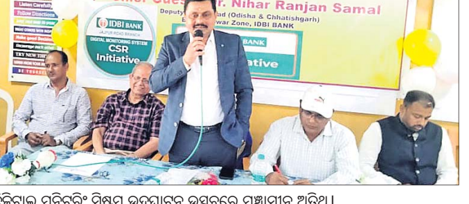
ତିନିଦିନ ମନିଚରି ସିଖିମ ଉତ୍ସବରେ ମହାସାନ ଅତିଥି ।

ଧର୍ମଶାଳା ବାଣୀପୀଠରେ ତିନିଦିନ ମନିଚରି ସିଖିମ ଉତ୍ସବରେ ମହାସାନ ଅତିଥି । ଯାଜପୁର, ୧୨ (ବିଶ୍ୱକାନ୍ତ ପତି) :