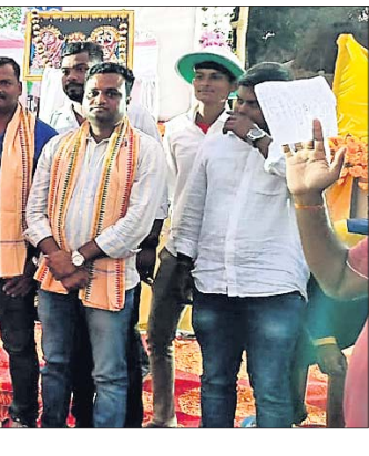
ଅତିଥି ଗଣରେ ଖେଳାଳିମାନେ ।

ଅତିଥି ଗଣରେ ଖେଳାଳିମାନେ । ଯାଜପୁର, ୧୨ (ପରମେଶ୍ୱର ପତି) :