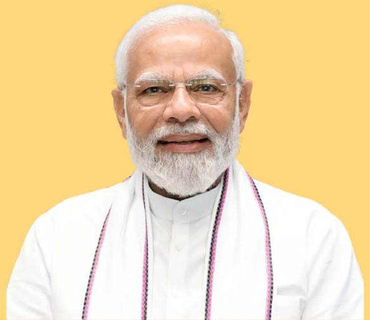
ଶ୍ରୀ ନରେନ୍ଦ୍ର ମୋଦୀ ପ୍ରଧାନମନ୍ତ୍ରୀ