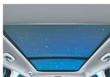
Dual Pane Panoramic Sunroof