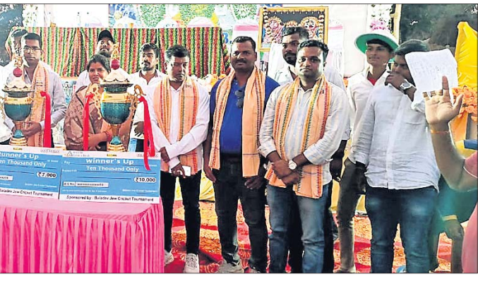
ଅତିଥି ଗଣରେ ଖେଳାଳିମାନେ ।

ଅତିଥି ଗଣରେ ଖେଳାଳିମାନେ । ଯାଜପୁର, ୧୨ (ପରମେଶ୍ୱର ପତି) :