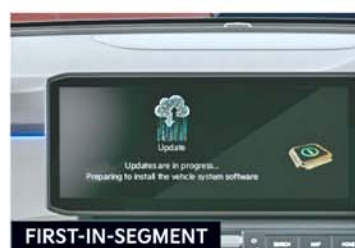
Kia Connect 2.0** with Over-the-Air (OTA) Software Updates and Other 80+ Connected Car Features