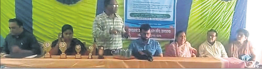
ନୟାଗଡ଼, ୧୮ (ଲୋକନାଥ ମିଶ୍ର)

ଦଶପଲ୍ଲୀ, ୧୮ (ପ୍ରକାଶ କୁମାର ପାଣି) ଶନିବାର ନୟାଗଡ଼ ଜିଲ୍ଲା ପକ୍ଷରୁ ବାତଜ୍ଞର ଏବଂ କୁସ୍ମ ରୋଗର କାରଣ ଓ ନିରାକରଣ ସମ୍ପର୍କରେ ଏକ ସଚେତନତା କାର୍ଯ୍ୟକ୍ରମ ଅନୁଷ୍ଠିତ ହୋଇଯାଇଛି।