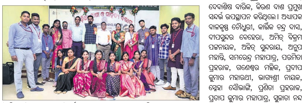
'ସାହିତ୍ୟ କ'ଣ ଓ ଏହାର ଲକ୍ଷ୍ୟ' ଶୀର୍ଷକ ପାଠକ୍ରମରେ ଯୋଗଦେଇଥିବା ଅତିଥି ଏବଂ ଅନ୍ୟମାନେ।

କଥା କହେ, ସାହିତ୍ୟ ଜୀବନ ଜିଇବାର ଅନନ୍ୟ ମାଧ୍ୟମ, ଯାହା ମଞ୍ଚରୁ ତଥା ହୃଦୟରେ ଅନୁଭୂତ ହୁଏ। ସମ୍ପାଦିତ ଅଧିଷ୍ଠିତ ଉପସ୍ଥାପନାରେ ଉପସ୍ଥାପନା କରାଯାଇଛି। ଉପସ୍ଥାପନାରେ ଉପସ୍ଥାପନା କରାଯାଇଛି।