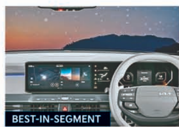
76.20 cm (30") Trinity Panoramic Display Panel