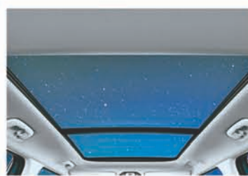
Dual Pane Panoramic Sunroof