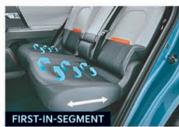
2 nd Row Seat Reclining & Sliding with Seat Ventilation