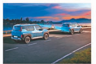
ADAS Level 2- with 16 Smart Autonomous & Robust 20 Standard Safety Features