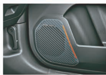
Harman Kardon Premium 8 Speakers Sound System