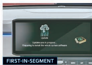
Kia Connect 2.0** with Over-the-Air (OTA) Software Updates and Other 80+ Connected Car Features