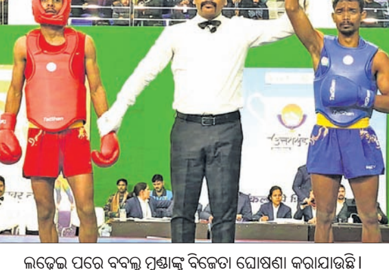
ଲଢ଼େଇ ପରେ ବଦଲୁ ମୁଣ୍ଡାକୁ ବିଜେତା ଘୋଷଣା କରାଯାଇଛି।