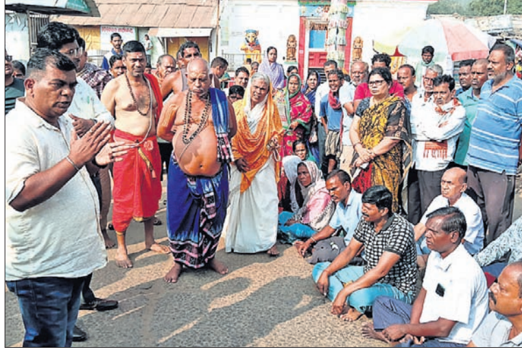
ପୂଜାନୀତିରେ ବିଭାଜନ କରି ଶ୍ରୀଜୀଉମାନେ ଧାରଣାରେ ବସିଛନ୍ତି।

ରବିବାର ପବିତ୍ର ଶ୍ରୀପଞ୍ଚମୀ ତିଥିରେ ବିପ୍ରାୟ ଶ୍ରୀକ୍ଷେତ୍ର ଭାବେ ପରିଚିତ ନୟାଗଡ଼ ଜିଲ୍ଲା ରଣପୁର ଜଗନ୍ନାଥଙ୍କ ମନ୍ଦିରରେ ପୂଜାନୀତିରେ ବିଭାଜନ ଦେଖାଦେଇଥିଲା। ମନ୍ଦିରକୁ ଭକ୍ତମାନେ ଶ୍ରୀଜୀଉଙ୍କୁ ଦର୍ଶନ କରିବାକୁ ଯାଇଥିଲେ।