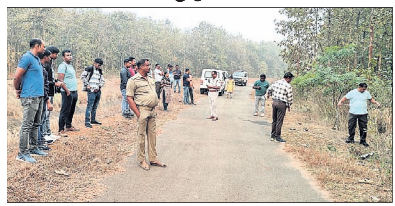
ମୃତଦେହ ପିଙ୍ଗିଯାଇଥିବା ସ୍ଥାନରେ ପୋଲିସ୍ ଚଢ଼ଢ଼ି କରୁଛି।

ମୃତଦେହ ପିଙ୍ଗିଯାଇଥିବା ସ୍ଥାନରେ ପୋଲିସ୍ ଚଢ଼ଢ଼ି କରୁଛି। ସୂଚନାଯୋଗ୍ୟ, ସାଲୁଖୁଠି ବାମନୋଦରପୁର ଅଞ୍ଚଳରେ ଜଣେ ବ୍ୟକ୍ତି ଜମି ବିବାଦରେ ମୃତ୍ୟୁବରଣ କରିଥିଲେ।