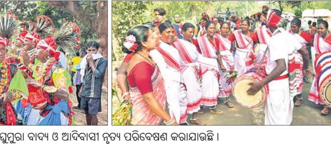
ଜଗନ୍ନାଥ ମହୋତ୍ସବ ଅବସରରେ କଳାହାଣ୍ଡିର ଘୁମୁରା ବାଦ୍ୟ ଓ ଆଦିବାସୀ ନୃତ୍ୟ ପରିବେଷଣ କରାଯାଇଛି ।