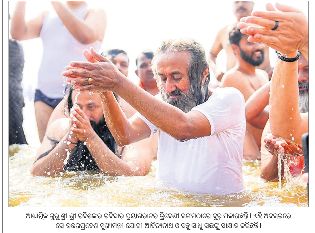
ଆଧ୍ୟାତ୍ମିକ ଗୁରୁ ଶ୍ରୀ ରବିଶଙ୍କର ରବିବାର ପ୍ରଧାନମନ୍ତ୍ରୀଙ୍କ ଡ୍ରିବେଣୀ ସଙ୍ଗମଠାରେ ବୁଡ଼ ପକାଇଛନ୍ତି। ଏହି ଅବସରରେ ସେ ଉତ୍ତରପ୍ରଦେଶ ମୁଖ୍ୟମନ୍ତ୍ରୀ ଯୋଗୀ ଆଦିତ୍ୟନାଥ ଓ ବହୁ ସାଧୁ ସନ୍ଥଙ୍କୁ ସାକ୍ଷାତ କରିଛନ୍ତି।

ଆମେରିକାର ବାଣିଜ୍ୟ ନିଅଣ୍ଟ ପାଇଁ ରାଷ୍ଟ୍ରପତି ଟ୍ରମ୍ପ୍ ଚାଇନା, ମେକ୍ସିକୋ ଏବଂ କାନାଡାକୁ ଦାୟୀ କରିଛନ୍ତି। ଆମେରିକା ବାଣିଜ୍ୟ ନିଅଣ୍ଟରେ ଚାଇନାର ସର୍ବାଧିକ ୩୦.୨% ଅବଦାନ ରହିଥିବାବେଳେ ମେକ୍ସିକୋର ୧୯% ଏବଂ କାନାଡାର ୧୪% ପ୍ରତିଶତ ରହିଥିବାରୁ ଟ୍ରମ୍ପ୍ ପ୍ରଥମ ପର୍ଯ୍ୟାୟ ଚାରିଫ୍ଟ ଏହି ଦେଶ ଉପରେ ଲଗାଇଛନ୍ତି। ଅନ୍ୟପକ୍ଷରେ ବାଣିଜ୍ୟ ନିଅଣ୍ଟରେ ଭାରତର ଭାଗ ମାତ୍ର ୩.୨ ଥିବାରୁ ଏହାର ଉକ୍ତ ଚାରିଫ୍ଟକୁ ବାଦ୍ ପଡ଼ିଛି। ଉପରୋକ୍ତ ୩ ଦେଶ ଆମେରିକାକୁ ବିପୁଳ ପରିମାଣର ଫେଣ୍ଡାରିଲ୍ ରପ୍ତାନି କରୁଛନ୍ତି, ଯେଉଁଥିରେ ବର୍ଷକୁ ୩୫୫ ବିଲିୟନ୍ ଡଲାର ମୂଲ୍ୟ ଉଠୁଛି। କାନାଡା ସହ ଆମେରିକାର ୨୦୦ ବିଲିୟନ୍ ଡଲାର ବାଣିଜ୍ୟ ନିଅଣ୍ଟ ଥିବାବେଳେ ମେକ୍ସିକୋ ସହ ୨୫୦ ବିଲିୟନ୍ ଡଲାର ନିଅଣ୍ଟ ରହିଥିବା ଟ୍ରମ୍ପ୍ ଏକ ପ୍ରେସ୍ ବିବୃତ୍ତିରେ କହିଛନ୍ତି।