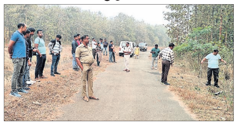
ପୂର୍ବଦେହ ପିଙ୍ଗିଯାଇଥିବା ସ୍ଥାନରେ ପୋଲିସ୍ ତଦନ୍ତ କରୁଛି ।