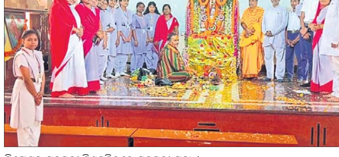
ଲିଙ୍ଗେଶ୍ୱର ସରସ୍ୱତୀ ଶିଶୁମିହିରରେ ସରସ୍ୱତୀ ପୂଜା ।

କମ୍ପ୍ୟୁଟର, ପାଣିକୋଇଲି, ମୂଳାପାଳ, ହୋଇଛି। ପୂଜା ଅବସରରେ ଅନୁଷ୍ଠିତ ଲିଙ୍ଗେଶ୍ୱର ଓ ଅନୁଷ୍ଠିତ ସରସ୍ୱତୀ ବିଭିନ୍ନ ସାଂସ୍କୃତିକ କାର୍ଯ୍ୟକ୍ରମ ଓ ସୁସଜ୍ଜିତ ଶିଶୁ ବିଦ୍ୟା ମନ୍ଦିରରେ ପୂଜା ପାଳିତ ତୋରଣ ଶ୍ରଦ୍ଧାକୁ ଆକର୍ଷିତ କରିଛି।