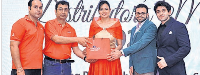
ଅର୍ଚ୍ଚିତା ଏକ୍ସରର ବ୍ରାଣ୍ଡ ଆୟାସାତର