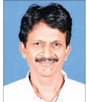
ବରଗଡ଼, ୩୧୨