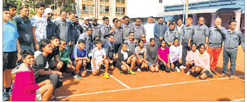
ଉଦ୍‌ଘାଟନା ସମାରୋହରେ ଖେଳାଳିଙ୍କ ସହ ଅତିଥିପୁର।

ଭୁବନେଶ୍ୱର, ୩।୨ (ସୁବାସ ଚନ୍ଦ୍ର ପାଠୀ): ଗୁଜୁରାଟରୁ ଆସିଥିବା ଓଡ଼ିଶା ଦଳର ଖେଳାଳିମାନଙ୍କୁ ସମ୍ମାନିତ କରାଯାଇଥିଲା।