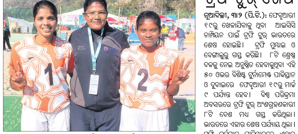
କୋର୍ଟ ସହ କିର୍ତ୍ତି ପୁର ଖେଳାଳି।

ଭୁବନେଶ୍ୱର, ୩।୨ (ତପନ ସାଲ୍): ଭାରତୀୟ ଓଡ଼ିଶା ଦଳର ବିଜୟ ହୋଇଛି।