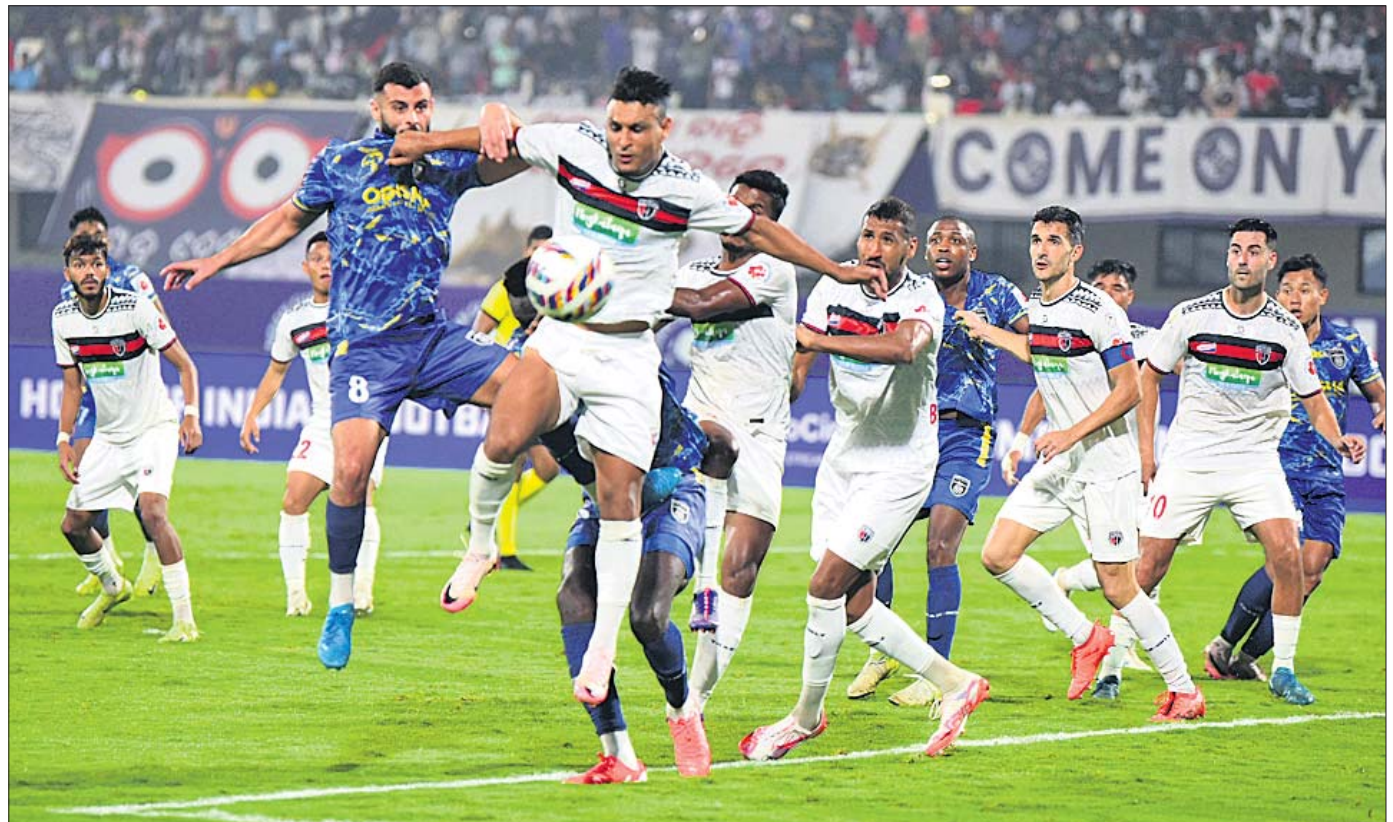
କଳିଙ୍ଗ ଷ୍ଟାଡ଼ିୟମରେ ଯୋଗଦାନ ଓଡ଼ିଶା ଏପ୍ସି ଓ ନର୍ସ ଲକ୍ଷ୍ମୀନାଥଙ୍କ ମଧ୍ୟରେ ଅନୁଷ୍ଠିତ ଆଇସକ୍ରିକେଟ ମ୍ୟାଚର ଏକ ସଂଘର୍ଷପୂର୍ଣ୍ଣ ମୁହୂର୍ତ୍ତ।

ଭୁବନେଶ୍ୱର, ୩।୨ (ତପନ ସାଲ୍): ଭାରତୀୟ ଓଡ଼ିଶା ଦଳର ବିଜୟ ହୋଇଛି।