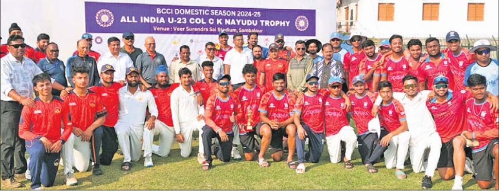
ସମ୍ବଲପୁର ଦଳଦ୍ୱାରା ଓଡ଼ିଶା ଦଳର ବିଜୟ ହୋଇଛି।

ସମ୍ବଲପୁର, ୩।୨ (ବି.ଶଙ୍କର): ସମ୍ବଲପୁର ଦଳ ଦ୍ୱାରା ଓଡ଼ିଶା ଦଳର ବିଜୟ ହୋଇଛି।