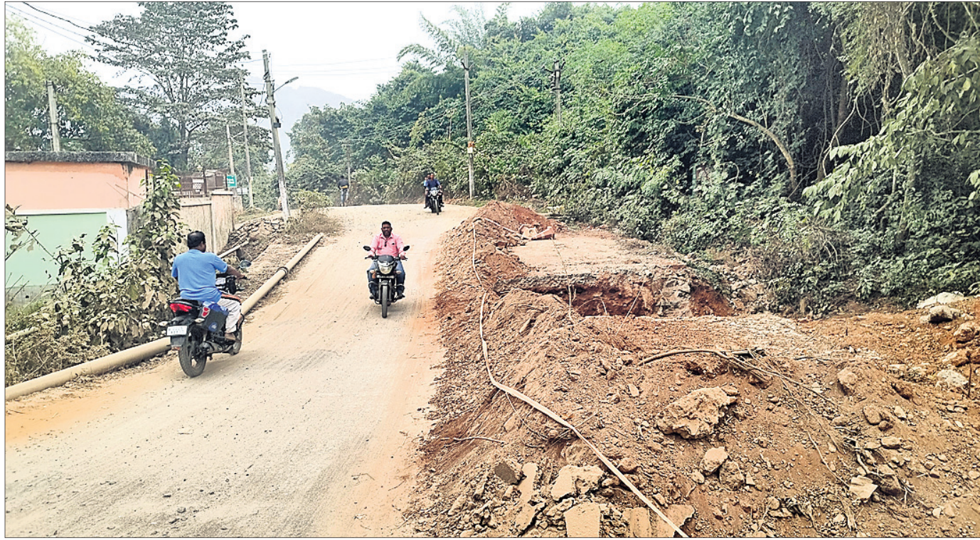
ପୁରୁଣାଗଡ଼ା ଶଙ୍ଖ ରାସ୍ତାରେ ପାଣି ଜମା ହୋଇ ରହିଥିବାରୁ ଯାତାୟତରେ ଅସୁବିଧା ହେଉଛି ।

ବଲାଙ୍ଗୀର-ଖୋର୍ଦ୍ଧା ୫୭୯ଂ ଜାତୀୟ ରାଜପଥ ନୟାଗଡ଼ ପୁରୁଣା ସହରର ଜଗନ୍ନାଥ ମନ୍ଦିରଠାରୁ ପୋଲିସ୍ ଟ୍ରେନିଂ ସ୍କୁଲ(ପିଟିଏସ୍) ଦେଇ ନୟାଗଡ଼ ନାଉଖାଲ ୨୧୯ଂ ରାଜ୍ୟ ରାଜପଥକୁ ସଂଯୋଗ କରୁଥିବା ଭିଆଇପି ରାସ୍ତାରେ ଦୁର୍ଘଟଣା ବଡ଼ ଚାଲିଛି । ଏହାକୁ ନେଇ ସାଧାରଣରେ ଭୟଭୀତ ପ୍ରକାଶ ପାଇଛି । ଜଗନ୍ନାଥ ମନ୍ଦିରଠାରୁ କଙ୍କପ ଗଡ଼ିରେ ଭିଆଇପି ରାସ୍ତା ନିର୍ମାଣ କାର୍ଯ୍ୟ ଚାଲୁଥିବାବେଳେ ନୂଆ କଲକତର ପାଇଁ ଲିକା ଏମ୍ପ୍ଲୟମେଣ୍ଟ ଅଫିସ ପାଖ ଓ ମହର୍ଷି ସ୍କୁଲ ନିକଟରେ ରାସ୍ତାର ଅଧା ଅଂଶରେ ବଡ଼ ବଡ଼ ଗର୍ଭ ଛେଦିବିନ୍ଦେ ଖୋଳି ବିପଦସଙ୍କୁଳ ଭାବେ ଛାଡ଼ି ଦିଆଯାଇଛି । ନୂଆ କଲକତରର ଗର୍ଭ ପାଖରେ ବିପଦସଙ୍କୁଳର ସୁତନା ଫଳକ ଲଗା ନ ଯାଇ କେବଳ କିଛି ମାଟି ଗଦାଇ ରଖାଯାଇଛି । ପୁଣି ପୁରୁଣା ଗଡ଼ାଖଣ୍ଡ ଉପରେ ଗ୍ରୀଷ୍ମ ଋତୁର ପ୍ରାରମ୍ଭରେ ପାଣି ଜମି ରହିଥିବାବେଳେ ନୂଆକଲକତର ପାଇଁ ଖୋଳା ଯାଇଥିବା ମାଟି ପତି ସଂପୃକ୍ତ ସ୍ଥାନ କର୍ମମାତ୍ର ହୋଇ ପଡ଼ିଛି ।