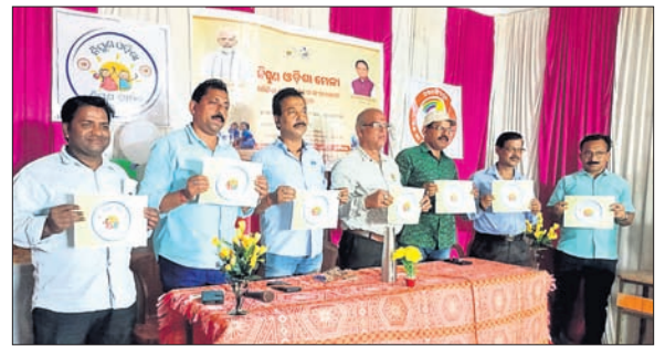
ଅତିଥିମାନେ ନିପୁଣ ଓଡ଼ିଶା ମେଳାର ଲୋଗୋ ଉନ୍ମୋଚନ କରୁଛନ୍ତି ।

ଓଡ଼ିଶା ଜାତିକା ମିଶନ ଇସି ସଂଘର ବିତିଓକୁ ଦାବିପତ୍ର । ଓଡ଼ିଶା ଜାତିକା ମିଶନ ଇସି ସଂଘର ବିତିଓକୁ ଦାବିପତ୍ର ।