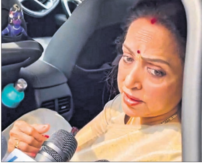
ଦଳାଚକଟା ବଡ଼ ଘଟଣା ଦୁହେଁ: ହେମା ମାଲିନୀ

ଲୋକଙ୍କ ମୃତ୍ୟୁ ଘଟିଥିବା ସେ କହିବାକୁ ପ୍ରସ୍ତୁତ ହେବାକୁ ହୋଇଥିଲା। ଏହି ସଂଖ୍ୟାର ପ୍ରମାଣ ଉପସ୍ଥାପନ କରିବାକୁ ଗୃହର ଉପାଧ୍ୟକ୍ଷ ହରିବଂଶ ତାଙ୍କୁ ନିର୍ଦ୍ଦେଶ ଦେଇଥିଲେ।