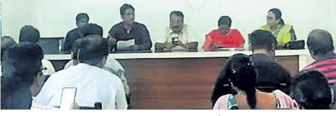
ବୈଠକରେ ଉପସ୍ଥିତ ସରପଞ୍ଚ, ସମିତି ସଭ୍ୟ ଏବଂ ବୁକ୍ କର୍ମଚାରୀ।