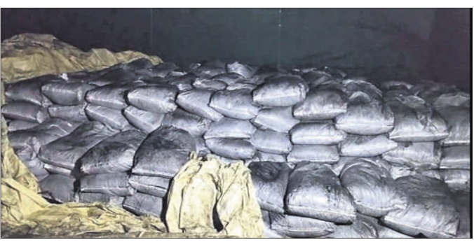
ପାରାଦୀପ, ୪୧୨ (ଶରତ ରାଉତ)