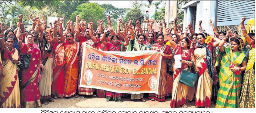
ବିତିଓକୁ ଶୋଭାଯାତ୍ରାରେ ଦାବିପତ୍ର ଦେବାକୁ ଯାଉଥିବା ସଂଘର ସଦସ୍ୟମାନେ ।

ଓଡ଼ିଶା ଜାତିକା ମିଶନ ଇସି ସଂଘର ବିତିଓକୁ ଦାବିପତ୍ର । ଓଡ଼ିଶା ଜାତିକା ମିଶନ ଇସି ସଂଘର ବିତିଓକୁ ଦାବିପତ୍ର ।