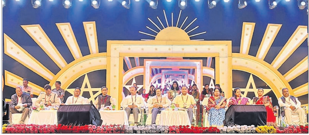
ପଞ୍ଚସପ୍ତକ ମହୋତ୍ସବର ତୃତୀୟ ସନ୍ଧ୍ୟାରେ ମହାସାଧନ ଅତିଥି ।