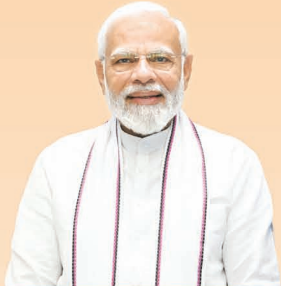
ଶ୍ରୀ ନରେନ୍ଦ୍ର ମୋହାପାତ୍ର ପ୍ରଧାନମନ୍ତ୍ରୀ