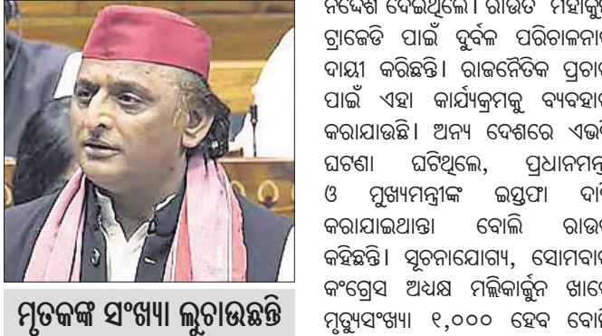
ମୃତକଙ୍କ ସଂଖ୍ୟା ଲୁଚାଉଛନ୍ତି ସରକାର: ଅଖିଳେଶ

ସେଠାରେ କେତେ ସଂଖ୍ୟାରେ ଚପଳ, ଶାଢ଼ି ଓ ପୋଷାକ ପଡ଼ିଥିଲା, ତାହା ଭଗବାନ ଜାଣନ୍ତି। ସେଗୁଡ଼ିକୁ ଚଳେଇ ଦେବା ପାଇଁ ପକାଇବାକୁ ଲୋକମାନେ ବହୁ ପ୍ରୟାସ କରିଥିଲେ... ସେଠାରେ ଅନେକ ଜଣଙ୍କର ମୃତ୍ୟୁ ଘଟିଛି।