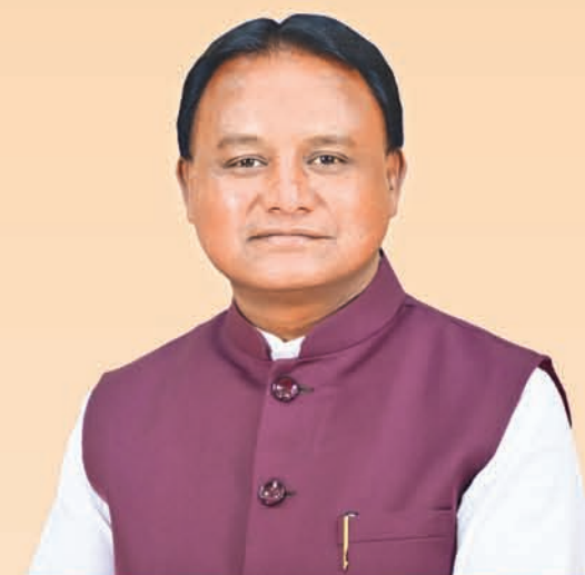
ଶ୍ରୀ ମୋହନ ଚରଣ ମାଝୀ ମୁଖ୍ୟମନ୍ତ୍ରୀ, ଓଡ଼ିଶା