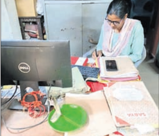
ରାଜନଗର ଭିଜିଲାନ୍ସ ଡିଏସ୍ପି କୁ ଅପିଏରେ ତନୟ କରୁଛନ୍ତି।

ରାଜନଗର ବୁକରେ ସରକାରୀ ଆଗାଧ ଯୋଜନାରେ ଖୋଲାମୋଲା ବୁକ୍ସରେ ହୋଇଛି। ସୋମବାର ଭିଜିଲାନ୍ସ ବିଭାଗ ଟିମ୍ ବୁକରେ ପହଞ୍ଚି ଖୋଳତାଡ଼ କରିଛି। ଇନ୍ଦିରା ଆଗାଧ ଓ ବିପୁ ପକ୍ଷାଘର ଯୋଜନାରେ ହୋଇଥିବା ବୁକ୍ସ ଚିହ୍ନଟ ନେଇ ଭିଜିଲାନ୍ସ ଟିମ୍ ୩ ଘଣ୍ଟା ଧରି ବୁକ୍ କାର୍ଯ୍ୟାଳୟରେ ପୁରୁଣା ଘଟଣା ହୋଇଥିଲେ ମଧ୍ୟ ଭିଜିଲାନ୍ସ ବିଭାଗର ଖୋଳତାଡ଼ ପରେ ବୁକ୍ସଚିତ୍ରଣ କର୍ମଚାରୀଙ୍କ ମହଲରେ ଛନକା ପଶିଛି। ରାଜନଗର ବୁକ୍ କେରେଡାଗଡ଼ ପଞ୍ଚାୟତର ଅନାମ ସେଠା, ଫୁଲରାଣୀ ବାରିକ ସାମା ଫକିର ବାରିକ ଓ ରାଜପୁର ପଞ୍ଚାୟତ ବାଲିଚହୁପୁର ପ୍ରଧାନମନ୍ତ୍ରୀ ଆଗାଧ ହାତେଇଥିଲେ। ସେତେବେଳେ ଏ ନେଇ ଗଣମାଧ୍ୟମରେ ତଥ୍ୟଭିତ୍ତିତ ଖବର ପ୍ରକାଶ ପାଇଥିଲା। ଦୀର୍ଘ ୮ ବର୍ଷ ପରେ ଭିଜିଲାନ୍ସ ବିଭାଗ