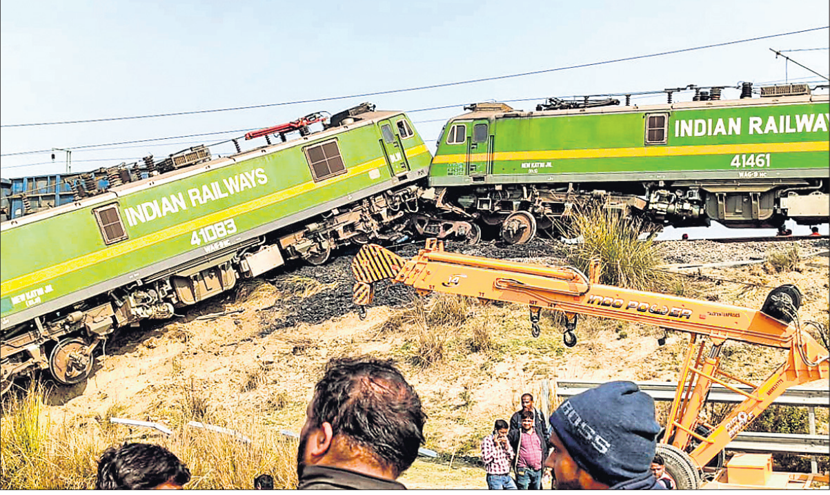
ଭଉଳପ୍ରଦେଶର ଫଟେହପୁର ଜିଲ୍ଲା ପନ୍ଥପୁର ନିକଟରେ ଦୁଇ ମାଲବାହୀ ଟ୍ରେନ ମଧ୍ୟରେ ମଙ୍ଗଳବାର ହୋଇଥିବା ଧକ୍କା।