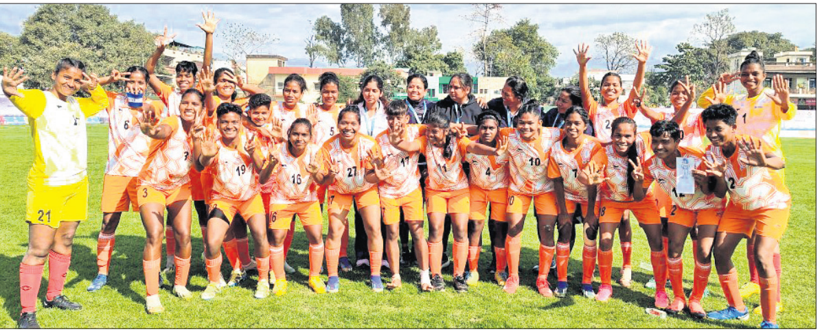
ଜାତୀୟ କ୍ରୀଡ଼ାର ଫାଇନାଲରେ ପ୍ରବେଶ ପରେ ଉତ୍ତମ ଓଡ଼ିଶା ମହିଳା ପୁଟବଲ ଦଳ ।

୩୫ର ୨୦୦୭, ୨୦୧୧ ଓ ୨୦୧୫ରେ ଚାମ୍ପିୟନ ହୋଇ ସ୍ୱର୍ଣ୍ଣ ପଦକ ଅର୍ଜନ କରିଥିଲା । ସେହିପରି ୨୦୧୫ ଓ ୨୦୧୬ରେ ରନରଅପ୍ ହୋଇ ରୌପ୍ୟ ପଦକ ପାଇଥିଲା । ଏହା ବ୍ୟତୀତ ୨୦୦୯ରେ ଥରେ ତୃତୀୟ ସ୍ଥାନରେ ରହି ତ୍ରୈତୀୟ ପଦକ ଜିତିଥିଲା । ଗତ ସଂସ୍କରଣର ଫାଇନାଲରେ ଓଡ଼ିଶା ଓ ମଣିପୁର ମ୍ୟାଚ ୧-୧ ଗୋଲରେ ଡ୍ର ରହିବାକୁ ଫଳାଫଳ ନିର୍ଣ୍ଣୟ ପାଇଁ ପେନାଲ୍ଟି ଶୁଭାକ୍ଷର ସହାୟତା ନିଆଯାଇଥିଲା । ଏଥିରେ ଓଡ଼ିଶା ୪-୨ରେ ଶକ୍ତିଶାଳୀ ମଣିପୁରକୁ ପରାସ୍ତ କରି ଚାମ୍ପିୟନ ହୋଇଥିଲା । ଏହା ପୂର୍ବରୁ ଚାନ୍ଦିଘାଟ ପୁଲିସ୍ ସ୍ତରରେ ଓଡ଼ିଶା ଓ ଓଡ଼ିଶା ପୋଲିସ୍ ସ୍ତରରେ ୫-୪ ଗୋଲରେ ପର୍ଯ୍ୟବସାନ୍ତ ପରାସ୍ତ କରି ଫାଇନାଲରେ ପହଞ୍ଚିଥିଲା । ନିର୍ଦ୍ଦିଷ୍ଟ ସମୟରେ ଖେଳ ଗୋଲ୍‌ହୁଆ ରହିଥିଲା । ଜାତୀୟ କ୍ରୀଡ଼ା ବ୍ୟତୀତ ଜାତୀୟ ମହିଳା ପୁଟବଲ ଚାମ୍ପିୟନସ୍ତରେ ଓଡ଼ିଶା ୨୦୧୦ରେ ଚାମ୍ପିୟନ ହୋଇଛି ଏବଂ ୨୦୧୧-୧୨, ୨୦୧୨-୧୩, ୨୦୧୩-୧୪, ୨୦୧୪-୧୫ ଓ ୨୦୧୫-୧୬ରେ ରନରଅପ୍ ହୋଇଛି ।