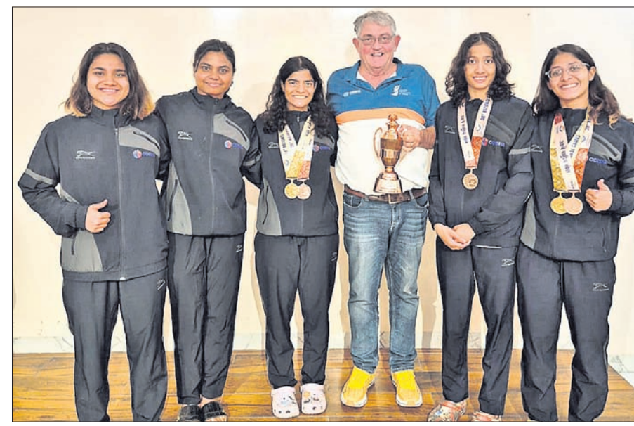
ଅଫିସିଆଲ୍ ଗହଣରେ ଓଡ଼ିଶା ମହିଳା ସ୍ତରରେ ବଡ଼ ସଫଳତା ।

୩୫ର ୨୦୦୭, ୨୦୧୧ ଓ ୨୦୧୫ରେ ଚାମ୍ପିୟନ ହୋଇ ସ୍ୱର୍ଣ୍ଣ ପଦକ ଅର୍ଜନ କରିଥିଲା । ସେହିପରି ୨୦୧୫ ଓ ୨୦୧୬ରେ ରନରଅପ୍ ହୋଇ ରୌପ୍ୟ ପଦକ ପାଇଥିଲା । ଏହା ବ୍ୟତୀତ ୨୦୦୯ରେ ଥରେ ତୃତୀୟ ସ୍ଥାନରେ ରହି ତ୍ରୈତୀୟ ପଦକ ଜିତିଥିଲା । ଗତ ସଂସ୍କରଣର ଫାଇନାଲରେ ଓଡ଼ିଶା ଓ ମଣିପୁର ମ୍ୟାଚ ୧-୧ ଗୋଲରେ ଡ୍ର ରହିବାକୁ ଫଳାଫଳ ନିର୍ଣ୍ଣୟ ପାଇଁ ପେନାଲ୍ଟି ଶୁଭାକ୍ଷର ସହାୟତା ନିଆଯାଇଥିଲା । ଏଥିରେ ଓଡ଼ିଶା ୪-୨ରେ ଶକ୍ତିଶାଳୀ ମଣିପୁରକୁ ପରାସ୍ତ କରି ଚାମ୍ପିୟନ ହୋଇଥିଲା । ଏହା ପୂର୍ବରୁ ଚାନ୍ଦିଘାଟ ପୁଲିସ୍ ସ୍ତରରେ ଓଡ଼ିଶା ଓ ଓଡ଼ିଶା ପୋଲିସ୍ ସ୍ତରରେ ୫-୪ ଗୋଲରେ ପର୍ଯ୍ୟବସାନ୍ତ ପରାସ୍ତ କରି ଫାଇନାଲରେ ପହଞ୍ଚିଥିଲା । ନିର୍ଦ୍ଦିଷ୍ଟ ସମୟରେ ଖେଳ ଗୋଲ୍‌ହୁଆ ରହିଥିଲା । ଜାତୀୟ କ୍ରୀଡ଼ା ବ୍ୟତୀତ ଜାତୀୟ ମହିଳା ପୁଟବଲ ଚାମ୍ପିୟନସ୍ତରେ ଓଡ଼ିଶା ୨୦୧୦ରେ ଚାମ୍ପିୟନ ହୋଇଛି ଏବଂ ୨୦୧୧-୧୨, ୨୦୧୨-୧୩, ୨୦୧୩-୧୪, ୨୦୧୪-୧୫ ଓ ୨୦୧୫-୧୬ରେ ରନରଅପ୍ ହୋଇଛି ।