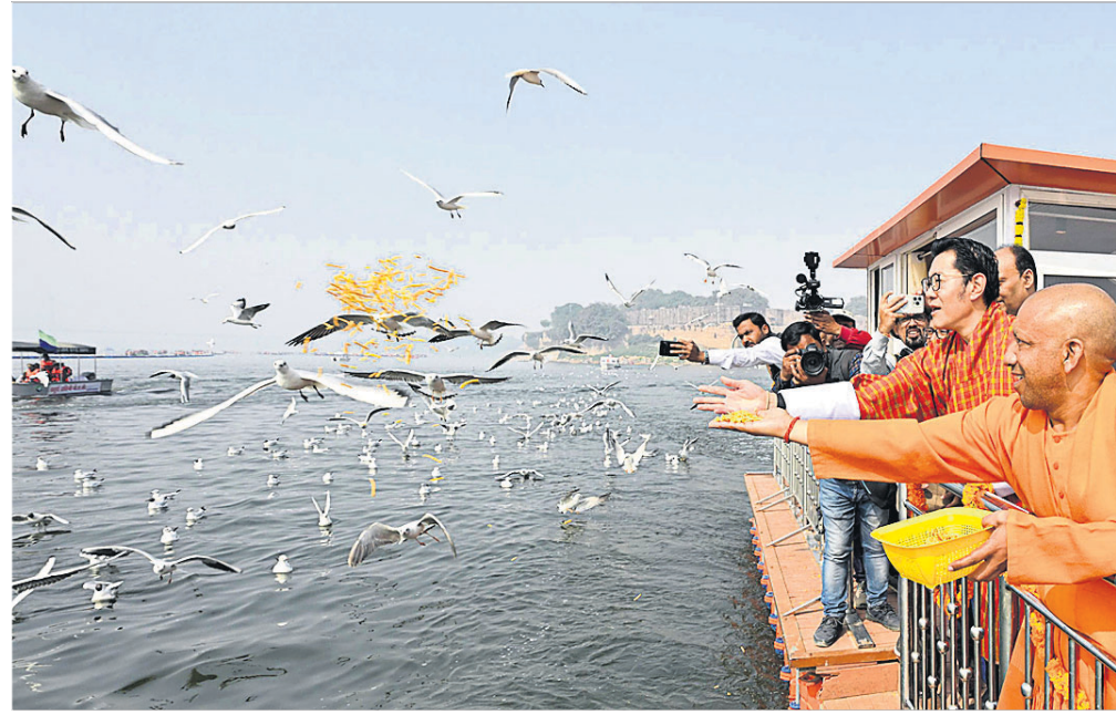
ପ୍ରୟାଗର ମହାକୁସ୍ତ ମେଳାରେ ଭୁବନେଶ୍ୱରରୁ ପହଞ୍ଚିଥିବା ଶ୍ରଦ୍ଧାଳୁଙ୍କ ସହ ଭରତ ପ୍ରଦେଶ ମୁଖ୍ୟମନ୍ତ୍ରୀ ଯୋଗୀ ଆଦିତ୍ୟନାଥ ସମ୍ମାନାମା ଦେଇଛନ୍ତି।

ସଂସ୍ମାରଣ ଦାୟିତ୍ୱ ସେନାକୁ ଦିଆଯାଉ ବୋଲି ଅଖିଳେଶ ଦାବି କରିଛନ୍ତି। ଗତ ମାସ ୨୯ ତାରିଖ ମୌନୀ ଅମାବାସ୍ୟା ଅବସରରେ ତ୍ରିବେଣୀ କେତେଜଣଙ୍କ ମୃତ୍ୟୁ ଘଟିଥିବା ଏବଂ ସେମାନଙ୍କ ମୃତଦେହ ଶିବଗୀରୀରେ ହସ୍ତିଚାଳରେ ପଡ଼ିଯାଇଥିବା ଜଣାପଡ଼ିଥିଲା।