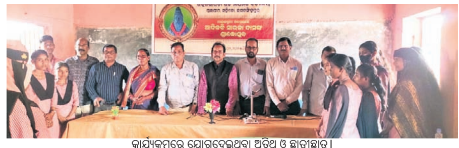
କାର୍ଯ୍ୟକ୍ରମରେ ଯୋଗଦେଇଥିବା ଅତିଥି ଓ ଛାତ୍ରଛାତ୍ରୀମାନେ ।

ଆଦିକବି, ମଧୁବାବୁଙ୍କ ଶ୍ରୀକ୍ଷ ଉତ୍ସବ ପ୍ରସଙ୍ଗରେ ଯୋଗଦେଇଥିବା ଅତିଥି ଓ ଛାତ୍ରଛାତ୍ରୀମାନେ । ଆଦିକବି ସାହିତ୍ୟ ଓଡ଼ିଆ ଜାତିକୁ ନିଜର ଐତିହ୍ୟ ଜାଣିବାର ସୁଯୋଗ ଦେଇଥିଲା । ତାଙ୍କ ସାହିତ୍ୟରେ ସାମାଜିକ କ୍ଷମା ଓ ଜାତୀୟ ସ୍ୱାଭିମାନକୁ ପଲ୍ଲବିତ କରି ଏ ଜାତିକୁ ଧନ୍ୟ କରିବାର ଆପ୍ରାଣ ପ୍ରୟାସ ପରିଲକ୍ଷିତ ହୋଇଥିଲା ।