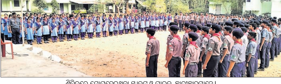
ଶିବିରରେ ଯୋଗଦେଇଥିବା ଶାଳଭୃତ୍ ଓ ଗାଈତ୍ର ଛାତ୍ରଛାତ୍ରୀମାନେ ।

ଦକ୍ଷତା ମାପ ପାଇଁ ପ୍ରାକ୍ତିକାଳ, ପ୍ରଶିକ୍ଷଣ ଶିବିର । ଶିବିରରେ ଯୋଗଦେଇଥିବା ଶାଳଭୃତ୍ ଓ ଗାଈତ୍ର ଛାତ୍ରଛାତ୍ରୀମାନେ ।