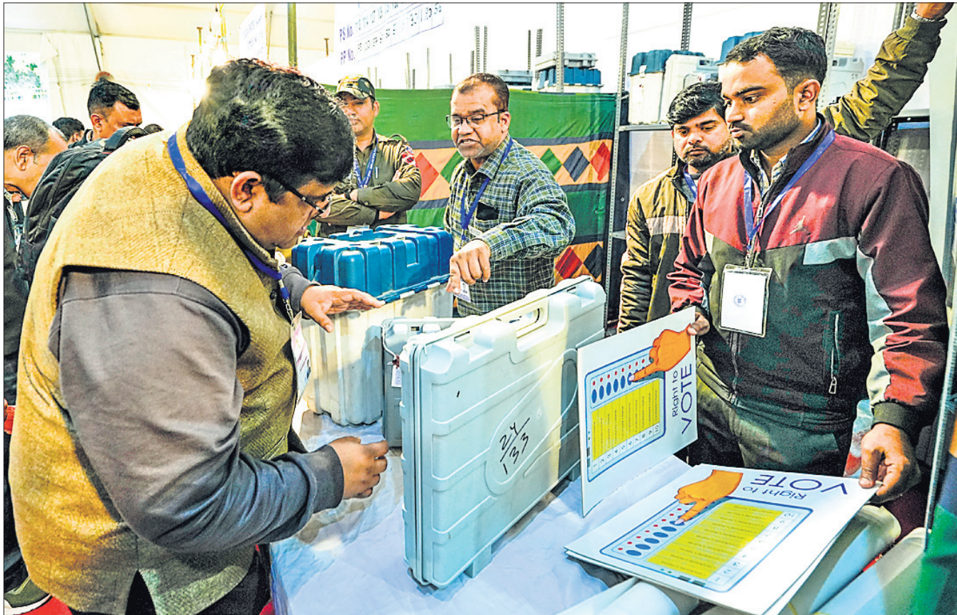
ଦିଲ୍ଲୀ ବିଧାନସଭା ନିର୍ବାଚନ ଅଧିକାରୀଙ୍କ ଦ୍ୱାରା ପ୍ରଦତ୍ତ ପୂର୍ବରୁ ମଙ୍ଗଳବାର ଗୋଳ ମାଜେକ୍ସିଭିଟ ଏକ କେନ୍ଦ୍ରୀୟ ପୋଲିଂ ଅଧିକାରୀ ଓ କର୍ମଚାରୀମାନେ ଇଲେକ୍ଟ୍ରୋନିକ୍ ଭୋଟିଂ ମେଶିନ (ଇଭିଏମ୍) ଓ ଅନ୍ୟାନ୍ୟ ନିର୍ବାଚନ ସମ୍ପର୍କୀୟ କାର୍ଯ୍ୟକ୍ରମ।