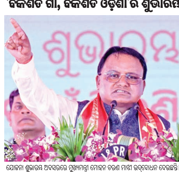
ଯୋଜନା ଶୁଭାରମ୍ଭ ଅବସରରେ ମୁଖ୍ୟମନ୍ତ୍ରୀ ମୋହନ ଚରଣ ମାଝୀ ଉଦ୍‌ବୋଧନ ଦେଉଛନ୍ତି।