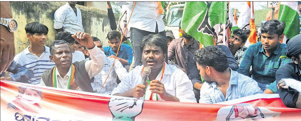
ପଢ଼ାମୁଣ୍ଡାଇ, ୫୧୨ (କଳ୍ପତରୁ ନାୟକ)

କହିଛନ୍ତି। ସେହିଭଳି ଝାରସୁଗୁଡ଼ା, ବରଗୁଡ଼ା, କିରୀଚୁରୁ, ରାଉରକେଲା ଓ ନୂଆଗୋଲୁ ନେଇ ରାଉରକେଲାଠାରେ ଏକ ନୂଆ ରେଳ ଡିଭିଜନ କରାଯାଇ ତାହାକୁ ପୂର୍ବତନ ରେଳ କୋର୍ସରେ ଅନ୍ତର୍ଭୁକ୍ତ କରିବାକୁ ଦାବି କରିଛନ୍ତି।