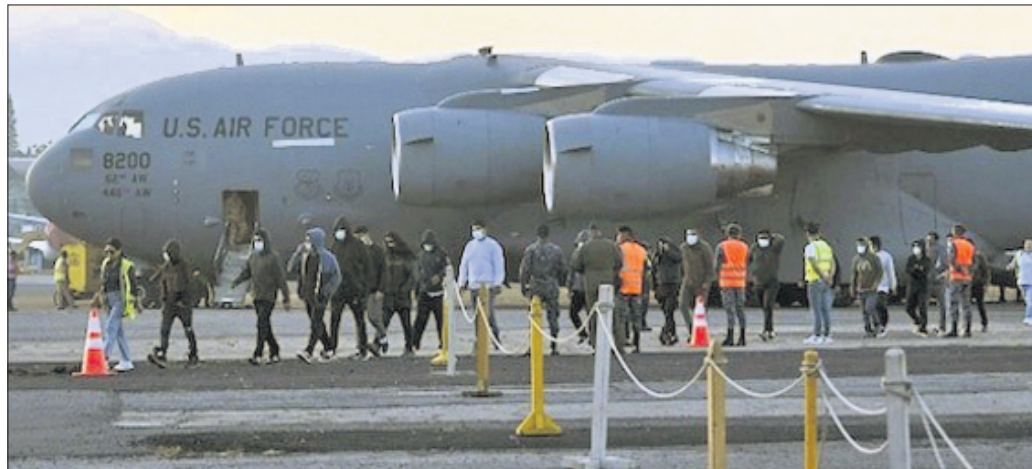
ବନ୍ଦରରେ ପଞ୍ଜାବ ପୋଲିସ୍, ଅନୁତସର ଯାତ୍ରା ପରେ ସେମାନଙ୍କୁ ଘରକୁ ଯିବାକୁ ଜିଲା ପ୍ରଶାସନର ଟିମ୍ ଏବଂ ଆମେରିକୀୟ ବୃତ୍ତବାସର କର୍ମଚାରୀ ଉପସ୍ଥିତ ଥିଲେ। ସୁରୁ ଅନୁଯାୟୀ, ଆବଶ୍ୟକ

ଆମେରିକାରୁ ପ୍ରଥମ ପର୍ଯ୍ୟାୟରେ ବିତାଡ଼ିତ ହୋଇଥିବା ୧୦୪ ବେଆଇନ୍ ପ୍ରବାସୀ ଭାରତୀୟ ବୁଧବାର ଏକ ଆମେରିକୀୟ ମିଲିଟାରୀ ଏୟାରକ୍ରାଫ୍ଟରେ ପଞ୍ଜାବର ଅନୁତସରସ୍ଥିତ ଗୁରୁ ରାମଦାସ ଜୀ ଅନ୍ତର୍ଜାତୀୟ ବିମାନବନ୍ଦରରେ ପହଞ୍ଚିଛନ୍ତି। ଉକ୍ତ ବିମାନରେ ୭୯ ଜଣ ପୁରୁଷ ଓ ୨୫ ଜଣ ମହିଳା ଥିଲେ। ସେହିପରି ୧୩ ଜଣ ପିଲା ମଧ୍ୟ ଏହି ବିମାନ ଯୋଗେ ଭାରତ ଫେରିଛନ୍ତି। ଆମେରିକାରୁ ବିତାଡ଼ିତ ହୋଇ ଆସିଥିବା ପ୍ରବାସୀଙ୍କ ମଧ୍ୟରେ ଗୁଜରାଟ ଓ ହରିୟାଣାର ୩୩ ଲେଖାଏଁ, ପଞ୍ଜାବର ୩୦, ମହାରାଷ୍ଟ୍ରର ୩, ଉତ୍ତରପ୍ରଦେଶ ଓ ଚଣ୍ଡିଗଡ଼ରୁ ୨ ଜଣ ଲେଖାଏଁ ରହିଛନ୍ତି। ଏହି ଅବସରରେ ଅନୁତସର ବିମାନ