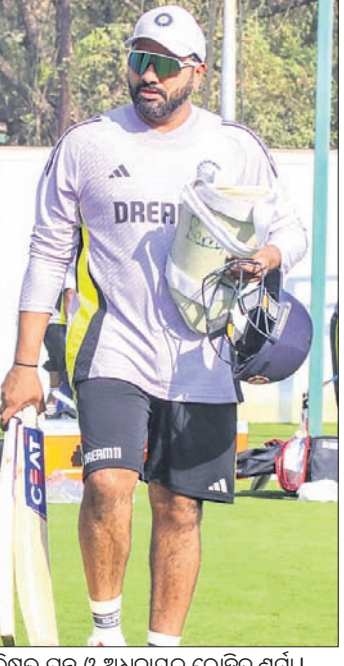
ଅଭ୍ୟାସ ଅବସରରେ ବିରାଟ କୋହଲି, ରିଷଭ ପଟ୍ଟ ଓ ଅଧିନାୟକ ରୋହିତ ଶର୍ମା।

ଆଜିଠୁ ଦିନିକିଆ ସିରିଜ ଚିତ୍ତାଚଳକ ରହିଛି। ଅନ୍ୟପକ୍ଷରେ ବାମହାତୀ ରିଷଭ ଦେବଦାସ ସବୁଜନରେ ବିବିଧତା ଆଣିପାରିବେ। କାରଣ ଭାରତର ଟପ୍ ଅର୍ଡରରେ ତାହାହାହାତୀ ବ୍ୟାଟରମାନେ ରହିଛନ୍ତି। ସେହିପରି ପାଞ୍ଚାଶ ହିଟ୍ ଶର୍ମା ମାରିବାର ଦକ୍ଷତା ତାଙ୍କୁ ରାହୁଲଙ୍କ ଅପେକ୍ଷା ଆଗରେ ରଖିପାରେ। ଏହି ସିରିଜ ଭେଟେରାନ ପେସର ମହମ୍ମଦ ଶାମି ଓ ରିଷଭ ଶନିର କୁଲିଦୀପ ଯାଦବଙ୍କ ପାଇଁ ମଧ୍ୟ ପରୀକ୍ଷା ସଦୃଶ ହେବ। ଉଭୟ ଖେଳାଳି ଆହତ ସମସ୍ୟାରୁ ଫେରିଛନ୍ତି ଏବଂ ଚାମ୍ପିୟନ୍ସ ଟ୍ରଫିରେ ଭାରତର ସଫଳତାରେ ଗୁରୁତ୍ୱପୂର୍ଣ୍ଣ ଭୂମିକା ନିର୍ବାହ କରିପାରନ୍ତି। ଗତ ଟି୨୦ ସିରିଜରେ ଶାମି ୨ଟି ମ୍ୟାଚ ଖେଳିଥିବାବେଳେ କୁଲିଦୀପ ଗତ ଅକ୍ଟୋବର ପରଠାରୁ ଭାରତୀୟ ଜର୍ସିରେ ବେଶାଯାଇନାହାନ୍ତି। ପିଠିରେ ସମସ୍ୟା ଯୋଗୁଁ ଯଶପ୍ରୀତ ଚୁରାଣୀ ଏହି ସିରିଜ ଖେଳିବେ ନାହିଁ। ଫର୍ମରେ ଥିବା ଶନିର ବରୁଣ ଚକ୍ରବର୍ତ୍ତୀ ଏହି ସିରିଜରେ ଡେବ୍ୟୁ କରି ଚାମ୍ପିୟନ୍ସ ଟ୍ରଫି ପାଇଁ ବାବିଦାର ହୋଇପାରନ୍ତି। ସେ ଗତ ଇଂଲଣ୍ଡ ବିପକ୍ଷ ଟି୨୦ ସିରିଜରେ ପ୍ରଭାବୀ ପ୍ରଦର୍ଶନ କରିଥିଲେ। ରବାନ୍ନା ଜାତେଜା, ଅକ୍ଷୟ ପଟେଲ ଓ ଖୁର୍ସିଦାନ ମୁହମ୍ମଦ ମଧ୍ୟରୁ ବୋଲି ଅଲ୍ରାଉଣ୍ଡର ବାଛିବା ମଧ୍ୟ ଟିମ୍