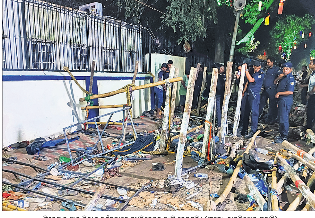
କ୍ରିକେଟ ନ ପାଇଁ ନିରାଶ ଦର୍ଶକମାନେ ବ୍ୟାରିକେଡ୍‌କୁ ଭାଙ୍ଗି ଦେଇଛନ୍ତି।