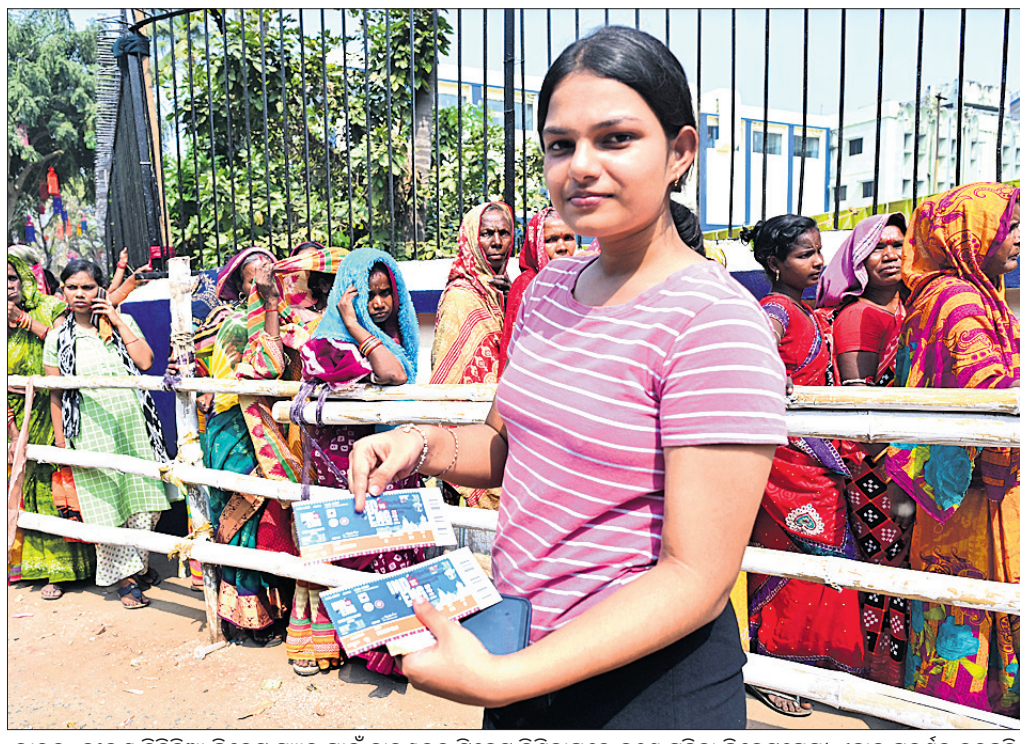
ଭାରତ-ଇଂଲଣ୍ଡ ଦିନିକିଆ କ୍ରିକେଟ ମ୍ୟାଚ ପାଇଁ କାରଖାନା ତିନିଦିନ ବନ୍ଦ କରିବାପରେ ଜଣେ ମହିଳା କ୍ରିକେଟପ୍ରେମୀ ଏହାକୁ ପ୍ରଦର୍ଶନ କରୁଛନ୍ତି।

ଭୁବନେଶ୍ୱର, ୫୧୨ (ତପନ ସାଲ୍) ଗୋଆର ଜବାହରଲାଲ ନେହେରୁ ଷ୍ଟାଡ଼ିୟମରେ ଗୁରୁବାର ଓଡ଼ିଶା ଏଫସି ଓ ଏଫସି ଗୋଆ ମଧ୍ୟରେ ଆଇସ୍‌ସ୍‌ସ୍‌ସ୍ (ଇଣ୍ଡିଆନ୍ ସୁପରଲିଗ୍) ମ୍ୟାଚ ଅନୁଷ୍ଠିତ ହେବ। ଆଇସ୍‌ସ୍‌ସ୍‌ସ୍ ଓଡ଼ିଶା ଏଫସି ପ୍ରତିସ୍ପନ୍ଧ ଗୋଆ ବିପକ୍ଷରେ କେବେହେଲେ ବିଜୟ ହାସଲ କରି ନାହାନ୍ତି। ତେଣୁ ଆଗାମୀ ମ୍ୟାଚକୁ ସ୍ମରଣୀୟ କରିବାକୁ ଓଡ଼ିଶା ଏଫସି ପ୍ରସ୍ତୁତ। ତେବେ ପୁଣ୍ୟ କୋର୍ ସର୍ବିଓ ଲୋକେବାହି ଏହି ମ୍ୟାଚ ପାଇଁ ଉପକଳ୍ପ ହେବେନାହିଁ। କଳିଙ୍ଗ ଷ୍ଟାଡ଼ିୟମରେ ଏହା ପୂର୍ବରୁ ଅନୁଷ୍ଠିତ ନର୍ଥଇଷ୍ଟ ଷ୍ଟାଡ଼ିୟମରେ ବିପକ୍ଷ ମ୍ୟାଚରେ ରେକର୍ଡ଼ ନିର୍ମୂଳ୍ୟ ହେବ ବାହାରେ ରହିବେ। ସହକାରୀ କୋର୍ ଆଲୋଚନା ଫର୍ମାଟ୍‌ରେ ଓଡ଼ିଶା ଦଳ ଦାୟିତ୍ୱରେ ରହିବେ। ପ୍ରସଂଖ ଟେକ୍ନୋଲୋଜି ଓଡ଼ିଶା ଏଫସି ଏବେ ୨୫ ପ୍ରସଂଖ ସହ ୭ମ ସ୍ଥାନରେ ରହିଛି। ଅନ୍ୟପକ୍ଷରେ ଜାମସେଦପୁର ଏଫସିଠାରୁ ୧-୩ ଗୋଲରେ ପରାଜୟ ପରେ ଗୋଆ ଏହି ମ୍ୟାଚ ଖେଳିବାକୁ ଯାଉଛି। ୩୩ ପ୍ରସଂଖ ସହିତ ଏହି ଦଳ ୩୫ ସ୍ଥାନରେ ଥିବାରୁ ଟ୍ରେନିଂ-ଅପ୍ରେସନ ନିକଟରେ ହୋଇଛି।