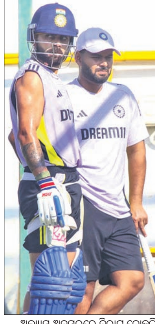
ଅଭ୍ୟାସ ଅବସରରେ ବିରାଟ କୋହଲି, ରିଷଭ ପଟ୍ଟ ଓ ଅଧିନାୟକ ରୋହିତ ଶର୍ମା।

ନାଗପୁର, ୫୧୨ (ପି.ଟି.) ଭାରତ ଓ ଇଂଲଣ୍ଡ ମଧ୍ୟରେ ଦିନିକିଆ କ୍ରିକେଟ ସିରିଜ ଗୁରୁବାରଠାରୁ ଆରମ୍ଭ ହେବାକୁ ଯାଉଛି। ୩ ମ୍ୟାଚ ବିଶିଷ୍ଟ ସିରିଜର ପ୍ରଥମ ମ୍ୟାଚ ଏଠାରେ ଅନୁଷ୍ଠିତ ହେବ। ଚାମ୍ପିୟନ୍ସ ଟ୍ରଫି ପୂର୍ବରୁ ଏହା ଶେଷ ସିରିଜ ହୋଇଥିବାରୁ ଦଳୀୟ ସବୁଜନ ଉପରେ ପ୍ରାଥମିକତା ପ୍ରଦାନ କରାଯାଉଛି। କାରଣ ଆଗାମୀ ଚୁନାବଳୀ ପୂର୍ବରୁ ଭାରତ ଏହି ସିରିଜରେ ହିଁ ପ୍ରମୁଖ ଟୁରାମେଣ୍ଟ ରୂପେ ଦେଖାଯାଉଛି। ନିକଟ ଅତୀତରେ ଅଧିନାୟକ ରୋହିତ ଶର୍ମା ଓ ବିରାଟ କୋହଲିଙ୍କ ପରି ନାମୀ ଖେଳାଳି ଖରାପ ଫର୍ମରେ ଥିବାରୁ ଏହି ସିରିଜରେ ସେମାନଙ୍କ ଉପରେ ନଜର ରହିବ। ଗତ ମାସରେ ରଣଜୀ ଟ୍ରଫି ଖେଳିବାକୁ ଏହି ଦୁଇ ଖେଳାଳି ପଡ଼ିଆକୁ ଓହ୍ଲାଇଥିଲେ ମଧ୍ୟ ସଫଳ ହୋଇନାହାନ୍ତି। ୨୦୨୩ ବିଶ୍ୱକପରେ କିନ୍ତୁ ଏହି ଦୁଇ ଖେଳାଳି ଭାରତର ଟପ୍ ପେୟାରରେ ଥିଲେ। କୋହଲି ୬୫୬ ଓ ରୋହିତ ୫୯୦ ରନ ସ୍କୋର କରିଥିଲେ। ମାତ୍ର ଏହା ପରଠାରୁ ଉଭୟଙ୍କ ପ୍ରଦର୍ଶନ ଖରାପ ରହିଆସିଛି। ଭାରତର ଟି୨୦ ବିଶ୍ୱକପ ବିଜୟ ପରେ ଉଭୟ ଏହି ଫର୍ମାଟକୁ ଅଳ୍ପବିଦ୍ୟା କରାଯାଇଛି। ଚଳିତ ମାସ ୧୯ରୁ ପାକିସ୍ତାନ ଓ ଦୁବାଇରେ ଆରମ୍ଭ ହେବାକୁ ଯାଉଥିବା ଚାମ୍ପିୟନ୍ସ ଟ୍ରଫି ପୂର୍ବରୁ ଇଂଲଣ୍ଡ ବିପକ୍ଷ ସିରିଜରେ ହିଁ ଭାରତ ନିଜର ଲାଭନିଆଁକୁ