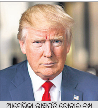
ଆମେରିକା ରାଷ୍ଟ୍ରପତି ଡୋନାଲ୍ଡ ଟ୍ରମ୍ପ

କାନ୍ତିସଂଘ ବଦଳାଇଦେବ ଏବଂ ଗାଜାକୁ ହମାସ୍ ଆତଙ୍କକୁ ସବୁଦିନ ପାଇଁ ଦୂର କରିଦେବ ବୋଲି କହିଛନ୍ତି। ଅନ୍ୟପକ୍ଷେ ହମାସ୍ ଏବଂ ପାଲେଷ୍ଟିନୀୟ କର୍ତ୍ତୃପକ୍ଷ ଏବେ ପ୍ରତ୍ୟାବଳ୍ ନିରା କରିଛନ୍ତି। ଏହାଦ୍ୱାରା ବୁଜରାଷ୍ଟ୍ର ବିକାଶ ସବୁଦିନ ପାଇଁ ଶେଷ ହୋଇଯିବ। ଆଶଙ୍କାରେ ସେମାନେ ପୁନୁକ୍ ହୁଅନ୍ତୁ। ସେ କହିଥିଲେ, ଇସ୍ରାଏଲ୍ 'ଯୁଦ୍ଧର ସମସ୍ତ ମର୍ତ୍ତି ଲକ୍ଷ୍ୟ'କୁ ହାସଲ କରିଛି। ଟ୍ରମ୍ପଙ୍କ ଏହି ଯୋଜନାକୁ ନେତାମାନଙ୍କୁ ପ୍ରଶଂସା କରିବା ସହ ଏହା