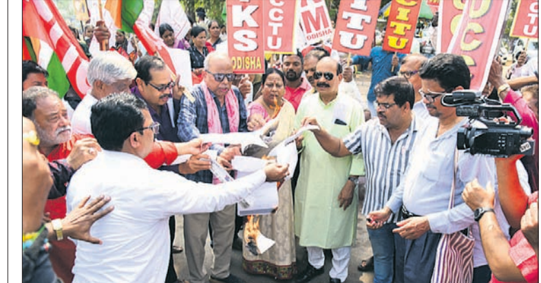
କେନ୍ଦ୍ର ବଜେଟ୍ କମିଟିରୋଧୀ, କର୍ପୋରେଟ୍ ସମସ୍ତଙ୍କୁ ଭାବେ ବର୍ଣ୍ଣାଳୀ ବିଜିତ ବାମ ଦଳ ଓ ସଂଗଠନ ପକ୍ଷରୁ ଗୁରୁବାର ଭୁବନେଶ୍ୱର ମାଧୁରୀକାଶ୍ୟାଠାରେ ବିଶୋଭା ପ୍ରଦର୍ଶନ କରାଯାଇଛି। କେନ୍ଦ୍ରୀୟ ଟ୍ରେଡ୍ ୟୁନିୟନ ମିଳିତ ମଞ୍ଚ ଏବଂ ସଂଯୁକ୍ତ କିଷାନ ମୋର୍ଚ୍ଚା ଏହାର ନେତୃତ୍ୱ ନେଇଥିବାବେଳେ ଏହି ଅବସରରେ ପ୍ରତିବାଦ ସ୍ୱରୂପ ବଜେଟ୍ କାର୍ଯ୍ୟକ୍ରମ ଚଳାଯାଇଛି।

ଶୋଭାଯାତ୍ରାରେ ନଗର ଯୁବ କୁଳରେ ବିକଶିତ ଗାଁ ବିକଶିତ ଓଡ଼ିଶା ସରକାରୀ କାର୍ଯ୍ୟକ୍ରମ ଚାଲିଥିବା ଓ ବହୁ ମହିଳା ଓ ପୁରୁଷ କାର୍ଯ୍ୟକ୍ରମରେ ଯୋଗ ଦେଇଥିବାରୁ ଗଣଗୋଳ ଆଶଙ୍କାରେ ପୋଲିସ୍ ଶୋଭାଯାତ୍ରାକୁ ଅଟକାଇବାକୁ ଯୁବକମାନେ ପଢ଼ାମୁଣ୍ଡାଇ ବୁକ୍ରେ ଯୋଗ ଦେଇଥିଲେ। ଏହି ଆନାକୁ ନେଇଯାଇଥିଲେ।