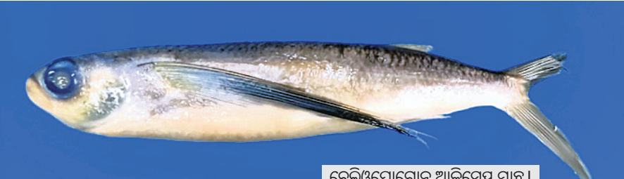
ଚେଲିଓପୋଗୋନ୍ ଅକ୍ସିସେସ୍ ମାଛ।