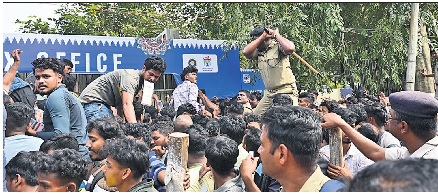
କଟକ ବାରବାଟୀ ଷ୍ଟାଡ଼ିୟମରେ ବୁଧବାର ଅର୍ଥ ଲାଭନ ଟିକେଟ୍ ବିକ୍ରି ବେଳେ ସ୍ଥିତି ନିୟନ୍ତ୍ରଣ ଲାଗି ପୋଲିସ୍ ଲାଠିଚାର୍ଜ କରୁଛି।

ଦିଲ୍ଲୀରେ ୫୭.୭% ମତଦାନ ଦିଲ୍ଲୀ ବିଧାନସଭାରେ ୭୦ ଆସନ ପାଇଁ ବୁଧବାର ଅନୁଷ୍ଠିତ ନିର୍ବାଚନରେ ଅପରାଧ ୫୮୧ ପୁଞ୍ଜା ୫୭.୭% ମତଦାନ ହୋଇଥିବା ନିର୍ବାଚନ କମିଶନ (ଇସି)ଙ୍କ ପୂର୍ବରୁ ପ୍ରକାଶ। ୧୩,୭୬୭ ପୋଲ୍ ବୁଥରେ ସକାଳ ୭ଟାରୁ ସନ୍ଧ୍ୟା ୬ଟା ପର୍ଯ୍ୟନ୍ତ ଭୋଟ ଗ୍ରହଣ କରାଯାଇଛି। ସୂଚକ ୨୯୯ ପ୍ରାର୍ଥୀଙ୍କ ଭାଗ୍ୟ ଇଲେକ୍ଟୋନିକ୍ ଭୋଟିଂ ମେଶିନ୍(ଇଇଏମ୍)ରେ ସିଲ୍ ହୋଇଯାଇଛି। ଭୋଟ ଗ୍ରହଣ ଶେଷ ହେବା ପରେ ବୁଥ ଫେରକା ମତଦାତାଙ୍କଠାରୁ ସଂଗୃହୀତ ତଥ୍ୟାନୁସାରେ ସର୍ବୋଚ୍ଚ ସଂଖ୍ୟାରେ ଏକଜିଟ ପୋଲ୍ ପ୍ରକାଶ ପାଇଛି। ଏପୂର୍ବରୁ ଏକଜିଟ ପୋଲ୍ ଉଦ୍ଦିଷ୍ଟବାଣୀ (ପୃଷ୍ଠା-୩)