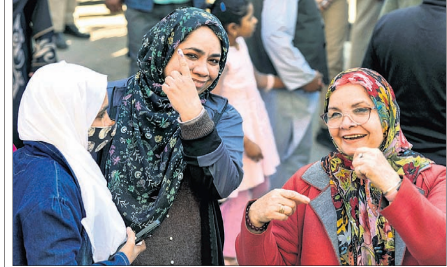
ଦିଲ୍ଲୀର ଓଖଲା ନିର୍ବାଚନ ମଣ୍ଡଳୀରେ ମତଦାନ କରିସାରି ମହିଳାମାନେ ଶ୍ୟାହି ଲାଭିଥିବା ଅଲୁକି ଦେଖାଉଛନ୍ତି।

ମଧ୍ୟ ସୁଲତେନ୍‌ର ଓରେଟ୍ରେସ୍ଥିତ କ୍ୟାମ୍ପର ଉପରେ ବର୍ଷାକାଳ ସେକେଣ୍ଡାରି ସୁଲରେ ମଙ୍ଗଳବାର ଚୁଲିକା ଘଟି ୧୦ ଜଣଙ୍କର ମୃତ୍ୟୁ ଘଟିଛି। ମୃତକଙ୍କ ମଧ୍ୟରେ ସନ୍ଦିଗ୍ଧ ଆତତତାୟୀ ମଧ୍ୟ ରହିଛନ୍ତି। ପୋଲିସ୍ ପୁରା ସୁଲକୁ ଛାଉଣି କରି ଘଟଣାର ତଦନ୍ତ ଚଳାଇଛି। ତେବେ ସନ୍ଦିଗ୍ଧ ଆତତତାୟୀ କୌଣସି ଆପରାଧକୁ ଗ୍ୟାଙ୍ଗରେ ସାମିଲ ନ ଥିବା ନେଇ ପୋଲିସ୍ ପୁନଃ ଦେଖିଛନ୍ତି।