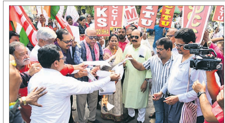
କେନ୍ଦ୍ର ବଜେଟ୍ କମିଟିରୋଧୀ, କର୍ପୋରେଟ୍ ସମସ୍ତଙ୍କୁ ଭାବେ ବର୍ଣ୍ଣାଳୀ ବିଜିଏସ୍ ଦଳ ଏବଂ ଗଠନ ପକ୍ଷରୁ ଗୁରୁବାର ଭୁବନେଶ୍ୱର ମାଧୁରୀକାମିନୀଠାରେ ବିଶୋଭା ପ୍ରଦର୍ଶନ କରାଯାଇଛି। କେନ୍ଦ୍ରୀୟ ଟ୍ରେଡ୍ ୟୁନିୟନ ମିଳିତ ମଞ୍ଚ ଏବଂ ସଂଯୁକ୍ତ କିଷାନ ମୋର୍ଚ୍ଚା ଏହାର ନେତୃତ୍ୱ ନେଇଥିବାବେଳେ ଏହି ଅବସରରେ ପ୍ରତିବାଦ ସ୍ୱରୂପ ବଜେଟ୍ କାର୍ଯ୍ୟକ୍ରମ ଚଳାଯାଇଛି।

ଶୋଭାଯାତ୍ରାରେ ନଗର ଯୁବ କ୍ଲବର ବିକଶିତ ଗାଁ ବିକଶିତ ଓଡ଼ିଶା ସରକାରୀ କାର୍ଯ୍ୟକ୍ରମ ଚାଲିଥିବା ଓ ବହୁ ମହିଳା ଓ ପୁରୁଷ କାର୍ଯ୍ୟକ୍ରମରେ ଯୋଗ ଦେଇଥିବାରୁ ଗଣଗୋଳ ଆଶଙ୍କାରେ ପୋଲିସ୍ ଶୋଭାଯାତ୍ରାକୁ ଅଟକାଇବାକୁ ଯୁବକମାନେ ଯୋଗାଯୋଗ କରିବା ଓ କର୍ମୀମାନେ ରାସ୍ତାରେ ବସି ପ୍ରତିବାଦ କରିବା ସହ ବିଭିନ୍ନ ଘୋରାନ ଦେଇଥିଲେ। ଏହି ଆନାକୁ ନେଇଯାଇଥିଲେ।