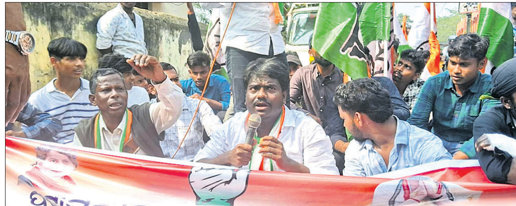
ପଢ଼ାମୁଣ୍ଡାଇ, ୫୧୨ (କଳ୍ପତରୁ ନାୟକ)

କହିଛନ୍ତି। ସେହିଭଳି ଝାରସୁଗୁଡ଼ା, ବରଗୁଡ଼ା, କିରଗୁଡ଼ା, ରାଉରକେଲା ଓ ନୂଆଗୋଲୁ ନେଇ ରାଉରକେଲାଠାରେ ଏକ ନୂଆ ରେଳ ଡିଭିଜନ କରାଯାଇ ତାହାକୁ ପୂର୍ବତନ ରେଳ କୋର୍ସରେ ଅନ୍ତର୍ଭୁକ୍ତ କରିବାକୁ ଦାବି କରିଛନ୍ତି।