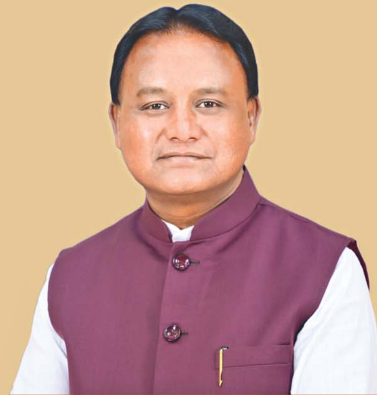
ଶ୍ରୀ ମୋହନ ଚରଣ ନାୟକ ମୁଖ୍ୟମନ୍ତ୍ରୀ, ଓଡ଼ିଶା