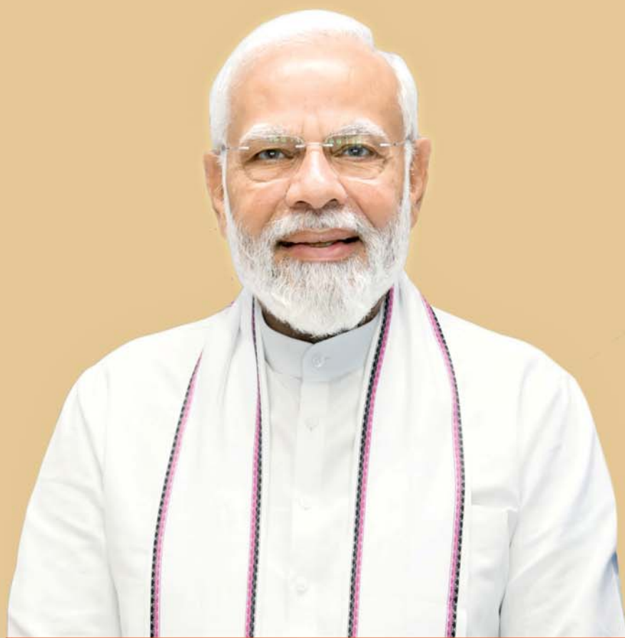
ଶ୍ରୀ ନରେନ୍ଦ୍ର ମୋଦୀ ପ୍ରଧାନମନ୍ତ୍ରୀ