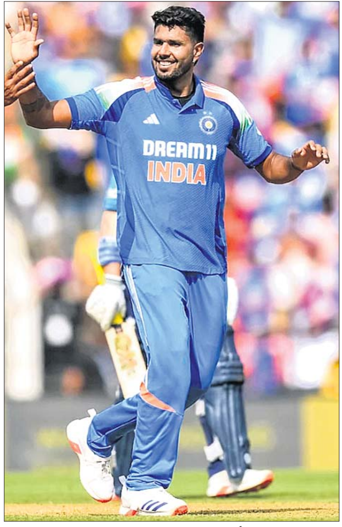
ଡେବୁଟରେ ୩ ଉଇକେଟ ହାସଲ କରିଥିବା ହର୍ଷିତ ରାଣା। କରି ନେଇଥିଲା। ଆଶ୍ଚର୍ଯ୍ୟ ଆଘାତ ଜନିତ ସମସ୍ୟା ଯୋଗୁ ଚାରକା ବ୍ୟାଟର ବିରାଟ କୋହଲି ଏହି ମ୍ୟାଚ ଖେଳି ନ ଥିଲେ। ଇଂଲଣ୍ଡ ପକ୍ଷରୁ ସାଜିବ ମହମ୍ମଦ ଓ ଆଡିଲ ରଶିଦ୍ ୨ଟି ଲେଖାଏ ଏବଂ କୋପ୍ରା ଆର୍ଟର ଓ ଜ୍ୟାକବ ବେଥେଲ ଗୋଟିଏ ଲେଖାଏ ଉଇକେଟ ନେଇଥିଲେ। ଇଂଲଣ୍ଡ ପକ୍ଷରୁ ସାଜିବ ମହମ୍ମଦ ଓ ଆଡିଲ ରଶିଦ୍ ୨ଟି ଲେଖାଏ ଏବଂ କୋପ୍ରା ଆର୍ଟର ଓ ଜ୍ୟାକବ ବେଥେଲ ଗୋଟିଏ ଲେଖାଏ ଉଇକେଟ ନେଇଥିଲେ। ଇଂଲଣ୍ଡ ପକ୍ଷରୁ ସାଜିବ ମହମ୍ମଦ ଓ ଆଡିଲ ରଶିଦ୍ ୨ଟି ଲେଖାଏ ଏବଂ କୋପ୍ରା ଆର୍ଟର ଓ ଜ୍ୟାକବ ବେଥେଲ ଗୋଟିଏ ଲେଖାଏ ଉଇକେଟ ନେଇଥିଲେ।

ନଗପୁର, ୬/୧୨ ସ୍ଥାନୀୟ ବିଦର୍ଭ କ୍ରିକେଟ ଆସୋସିଏସନ ଷ୍ଟାଡିୟମରେ ଗୁରୁବାର ଅନୁଷ୍ଠିତ ପ୍ରଥମ ଦିନିକିଆ କ୍ରିକେଟ ମ୍ୟାଚରେ ଭାରତ ୪ ଉଇକେଟରେ ଇଂଲଣ୍ଡକୁ ପରାସ୍ତ କରିଛି। ଫଳରେ ୩ ମ୍ୟାଚ ବିଶିଷ୍ଟ ସିରିଜରେ ଭାରତ ୧-୦ରେ ଅଗ୍ରଣୀଭାବେ ଉଠିଛି। ଇଂଲଣ୍ଡ ୪୭.୪ ଓଭରରେ ୨୪୮ ରନକରି ଅଲଆଉଟ ହୋଇଥିଲା। ୨୪୯ ରନ ବିଜୟ ଲକ୍ଷ୍ୟରେ ଭାରତ ୩୮.୪ ଓଭରରେ ୬ ଉଇକେଟ ହରାଇ ୨୫୧ ରନ ସଂଗ୍ରହ କରି ନେଇଥିଲା। ସିରିଜର ଦ୍ୱିତୀୟ ମ୍ୟାଚ ଆସନ୍ତା ୯ ତାରିଖରେ କଟକର ବାରବାଟୀ ଷ୍ଟାଡିୟମରେ ଅନୁଷ୍ଠିତ ହେବ। ଯଶସୀ ଜୟସାଲ ୧୫ ଓ ଖରାପ ଫର୍ମ ଦେଇ ଗତି କରୁଥିବା ଅଧିନାୟକ ରୋହିତ ଶର୍ମା ୨ ରନକରି ଆଉଟ ହେବାରୁ ୧୯ ରନ ମଧ୍ୟରେ ୨ଟି ଉଇକେଟ ହରାଇ ଭାରତ ପ୍ରାରମ୍ଭିକ ବ୍ୟାଟିଂ ବିପର୍ଯ୍ୟୟର ସମ୍ମୁଖୀନ ହୋଇଥିଲା। ମାତ୍ର ଶୁଭମନ ଗିଲ୍ ଓ ଶ୍ରେୟସ ଆୟର ତୃତୀୟ ଉଇକେଟରେ ୬୪ ବଲ୍ରେ ୯୪ ରନ ସଂଗ୍ରହ କରି ଇନିଂସ ସମ୍ପାଦି ନେଇଥିଲେ। କେବଳ ସେତିକି ନୁହେଁ ଗିଲ୍ ତତ୍ପୂର୍ଣ୍ଣ ଉଇକେଟରେ ଅକ୍ଷର ପଚେଲକ ସହ ଶତକାନ୍ଦ (୧୦୮ ରନ) ଭାଗ୍ୟବାରି ଗଢ଼ି ଭାରତକୁ ବିଜୟ ପଥରେ ଅଗ୍ରସର କରାଇଥିଲେ। ଗିଲ୍ ସର୍ବାଧିକ ୮୬, ଆୟର ୫୯ ଓ ଅକ୍ଷର ୫୨ ରନ ସ୍କୋର କରିଥିଲେ। ଶେଷ ଭାଗରେ ମିଚି ବ୍ୟାଟିଂ ବିପର୍ଯ୍ୟୟ ଘଟିଥିଲେ ହେଁ ଭାରତର ବିଜୟକୁ ଏହା ପ୍ରଭାବିତ କରିପାରି ନ ଥିଲା। ଭାରତ ଆହୁରି ୬୮ ବଲ୍ ବକାଆଇ ୩୮.୪ ଓଭରରେ ୬ ଉଇକେଟ ହରାଇ ବିଜୟ ଲକ୍ଷ୍ୟ ହାସଲ