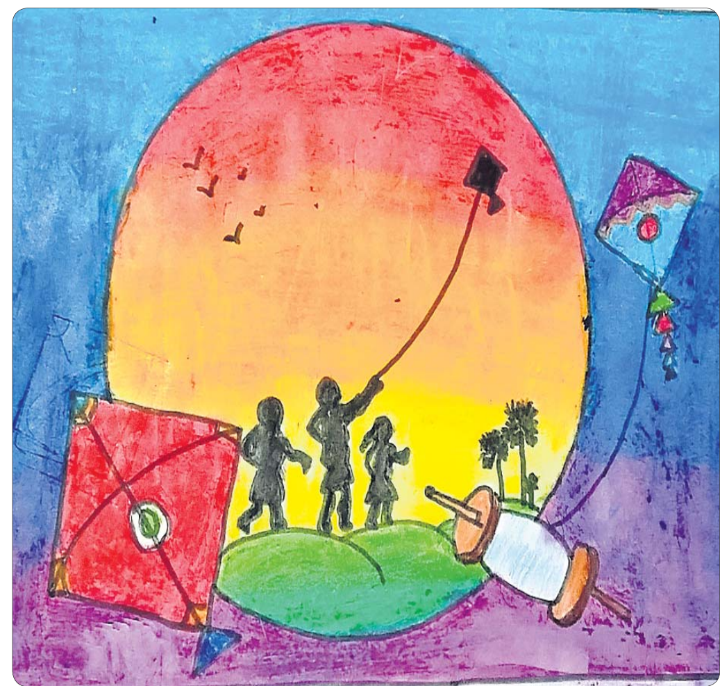
ପୁରୀକା ମିଶ୍ର କ୍ଲାସ୍-୧, ମିଶର୍ ସ୍କୁଲ, ଜଟଣୀ, ଖୋର୍ଦ୍ଧା