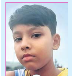
ସ୍ତୋତ୍ରୀ ସତ୍ତ୍ୱଳା କ୍ଲାସ୍-୭, ସ୍ୱାଇଲ୍ ଫିଲ୍ମ ଗ୍ଲୋବାଲ ସ୍କୁଲ, ବେଙ୍ଗାଲୁରୁ