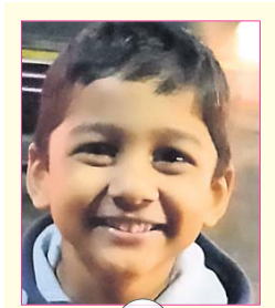
ଆରତ ଆଶୀର୍ବାଦ କ୍ଲାସ୍-୩, କେନ୍ଦ୍ରୀୟ ବିଦ୍ୟାଳୟ, ଜଟଣୀ, ଖୋର୍ଦ୍ଧା