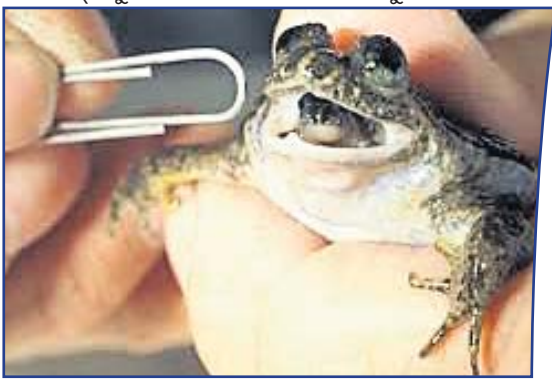
ପର୍ଯ୍ୟନ୍ତ ତାହା ପେଟରେ ରହିଥାଏ । ପୁଣି ଯେତେବେଳେ ଛୁଆ ଜନ୍ମ ନିଅନ୍ତି, ମା'ର ପାଟି ବାଟ ଦେଇ ବାହାରକୁ ଆସିଥାନ୍ତି । ଏଭଳି ବୈଚିତ୍ର୍ୟ ପାଇଁ ଗ୍ୟାଷ୍ଟ୍ରିକ୍ ବୁଡିଙ୍ଗ୍ ଫ୍ରଗ୍ ବେଶ୍ ପରିଚିତ ।

ସମଗ୍ର ପୃଥିବୀରେ ବିଭିନ୍ନ ପ୍ରକାର ତଥା ବିଚିତ୍ର ପ୍ରାଣୀ ଦେଖିବାକୁ ମିଳିଥାଆନ୍ତି । ମଣିଷ ପରି ପ୍ରାଣୀମାନେ ମଧ୍ୟ ସେମାନଙ୍କର ବଂଶ ବିସ୍ତାର କରନ୍ତି । ବିଭିନ୍ନ ଜୀବର ଶାରୀରିକ ସଂରଚନା ଭିନ୍ନଭିନ୍ନ । କେତେକ ପ୍ରାଣୀ ସ୍ଥଳଭାଗ, କେତେକ ଜଳଭାଗ, ପୁଣି କେତେକ ଉଭୟଚର ଭାବରେ ପରିଚିତ । ପୃଥିବୀପୃଷ୍ଠରେ ଅନେକ ପ୍ରଜାତିର ବେଙ୍ଗ ଅଛନ୍ତି । ସେମାନଙ୍କ ମଧ୍ୟରୁ 'ଗ୍ୟାଷ୍ଟ୍ରିକ୍ ବୁଡିଙ୍ଗ୍ ଫ୍ରଗ୍' ପ୍ରଜାତି ସମ୍ପୂର୍ଣ୍ଣ ଭିନ୍ନ । କାରଣ ଏମାନଙ୍କ ଜନ୍ମ କରିବାର ପ୍ରକ୍ରିୟା ସ୍ୱତନ୍ତ୍ର । ଏମାନେ ଅଣ୍ଡା ଦେବା ପରେ ଏହାକୁ ଗିଳି ଦିଅନ୍ତି । ଅଣ୍ଡା ଉପରେ ଲାଗିଥିବା ସ୍ୱତନ୍ତ୍ର କେମିକାଲ ପେଟ ଭିତରକୁ ଯାଇ ବେଙ୍ଗକୁ ଗ୍ୟାସ୍ଟ୍ରିକ୍ ଏସିଡ଼ଠାରୁ ରକ୍ଷା କରିଥାଏ । ଅଣ୍ଡା ମଧ୍ୟରୁ ପିଲା ବାହାରିବା