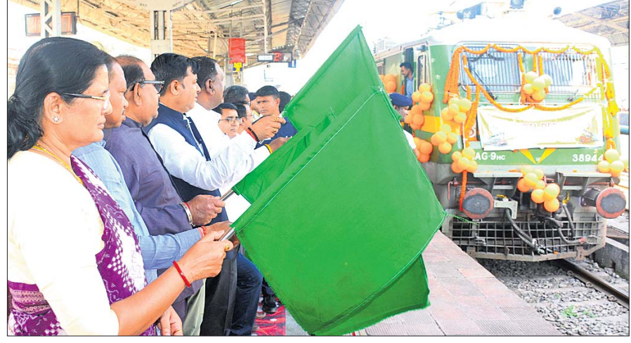
ସମ୍ବଲପୁର ରେଳ ଷ୍ଟେଶନରେ ଅତିଥିକ ଗହଣରେ ପତାକା ଦେଖାଇ ବରିଷ୍ଠ ନାଗରିକ ଚାର୍ଯ୍ୟଯାତ୍ରୀ ଟ୍ରେନ୍ ଯାତ୍ରାର ଶୁଭାରମ୍ଭ କରୁଛନ୍ତି ଉପପୁଞ୍ଜୀମନ୍ତ୍ରୀ ପ୍ରଭାତୀ ପରିଡ଼ା ।

ପଶ୍ଚିମ ଓଡ଼ିଶାରେ ପର୍ଯ୍ୟଟନ ବିକାଶ ପାଇଁ ସରକାର ସଂକଳ୍ପବଦ୍ଧ