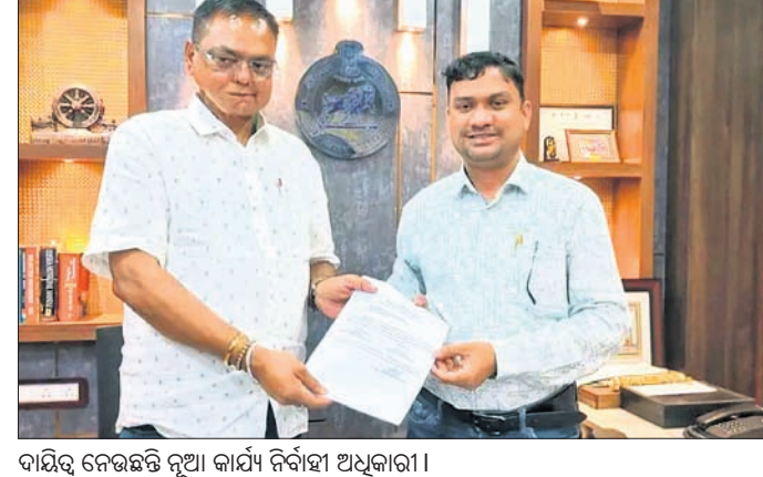
ଦାୟିତ୍ୱ ନେଉଛନ୍ତି ନୂଆ କାର୍ଯ୍ୟ ନିବାହୀ ଅଧିକାରୀ।

ଅନୁଗୋଳ, ୭୨ (ମାନସ ବିଶ୍ୱାଳ) ଗଣମାଧ୍ୟମ ପ୍ରତିନିଧି, ମହିଳା ଗୋଷ୍ଠୀ, କର୍ମଚାରୀ, ସାହିତ୍ୟପୁସ୍ତକାଳୟ ପୁସ୍ତକାଳୟ ଦେଇ ସ୍ୱାଗତ କରିଥିଲେ। ସରକାରଙ୍କ ବିଭିନ୍ନ ଲୋକାଭିଯୁକ୍ତା ଯୋଜନାକୁ ସଫଳତାର ସହ କାର୍ଯ୍ୟକାରୀ କରିବା ଦିଗରେ ଧ୍ୟାନ ଦେବା ସହିତ ଅନୁଗୋଳ ସହରର ସାମାଜିକ କୃଷି କର୍ମିକା, ରାସ୍ତା କଢ଼ିବା ବେଆଇନ ହୋର୍ଟି ଉଲ୍ଲେଖ ନୂଆ ଅଧିକାରୀଙ୍କୁ ପୌର ଠିକାଦାର ସଂଘ, ବଣିକ ସଂଘ, କାଉନସିଲର, ଅଧିକାରୀ ତ୍ରୁପାଠୀ ପ୍ରକାଶ କରିଥିଲେ।