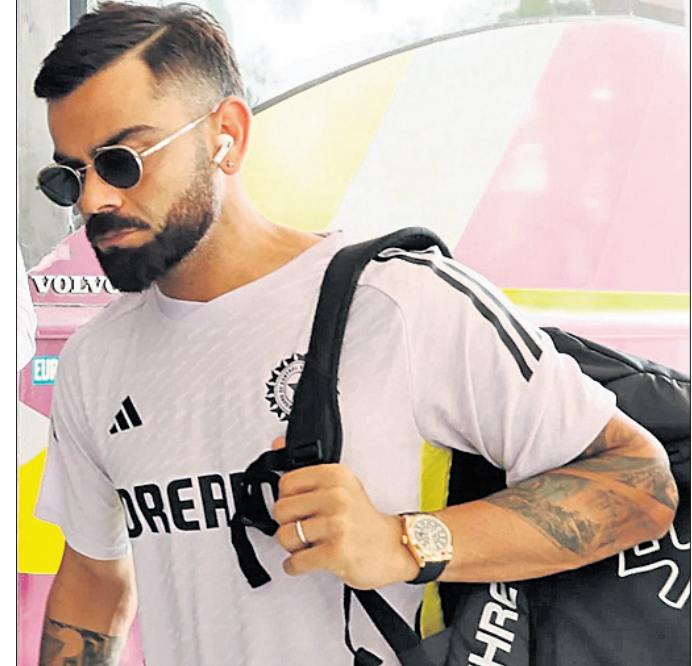
ଭୁବନେଶ୍ୱର, ୭/୨ (ତପନ ସାହୁ)

ଦଳର ଖେଳାଳି ନେ ଫେୟାରରୁ ବାହାରି ଜାତୀୟ ରାଜପଥ ୧୬ ରସୁଲଗଡ଼ ଦେଇ କଟକ ବାରବାଟୀ ଯିବାକୁ ରୁଟ୍ ଲାଭନ ପ୍ରସ୍ତୁତ ହୋଇଛି । ଦୁଫାତ ହୋଇଥିବା କାର୍ଯ୍ୟପୁରୀ ଅନୁସାରେ ଇଂଲଣ୍ଡ ଦଳ ଅପରାହ୍ନ ୧୮ଟା ୪୫ ପର୍ଯ୍ୟନ୍ତ ଅଭ୍ୟାସ କରିବ । ଏହାପରେ ଅପରାହ୍ନ ୫ଟାରୁ ରାତି ୮ଟା ପର୍ଯ୍ୟନ୍ତ ଖଳ ବୁହାଇବ ଟିମ୍ ଇଣ୍ଡିଆ । ଏହି ସମୟରେ ଉଭୟ ଦଳ ପଢ଼ିଆ ଓ ପିଂ ନିରୀକ୍ଷଣ କରିବେ । ପ୍ରଥମ ମ୍ୟାଚରେ ଭାରତ ବିଜୟୀ ହୋଇଥିବାରୁ ଏଠାରେ ସେହି ପ୍ରଦର୍ଶନ ଦୋହରାଇ ସିରିଜ ବିଜୟୀ ହେବାକୁ ଚେଷ୍ଟା କରିବ । ଅନ୍ୟପକ୍ଷରେ ନାଗପୁର ପରାଜୟର କାରଣ ଖୋଜି ତ୍ରୁଟି ସୁଧାରିବାକୁ ଚେଷ୍ଟା କରିବ ଇଂଲଣ୍ଡ । ଏଥିପାଇଁ ସେମାନେ ଏହି ନେଟ୍‌ରେ ହିଁ ନିଜର ପ୍ରସ୍ତୁତିକୁ ଦୁଫାତ ରୂପଦେବେ ।