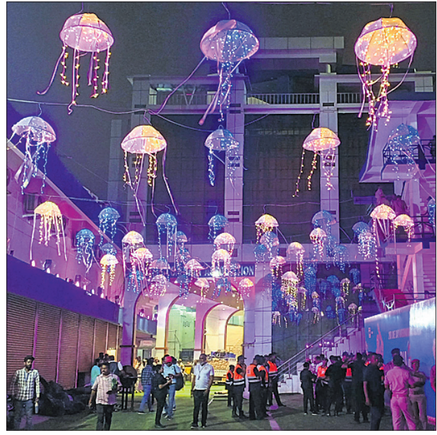
ଅନ୍ତର୍ଜାତୀୟ ଟିକେଟ ବୁକ୍ କରିଥିବା କ୍ରିକେଟ ପ୍ରେମୀମାନେ ଶୁକ୍ରବାର କ୍ୟାମ୍ପିଙ୍ଗ୍ ସ୍ଥଳରେ ଥିବା କାରଖାନାରେ ଟିକେଟ ରିଡିମ୍ପ୍‌ଶନ କରୁଛନ୍ତି । ଷ୍ଟାଡ଼ିୟମରେ ସ୍ଥାପନ କରାଯାଇଥିବା ଆଲୋକରେ ଖଲିଦୁଇ ଓସିଏ ଅପିଏ ।