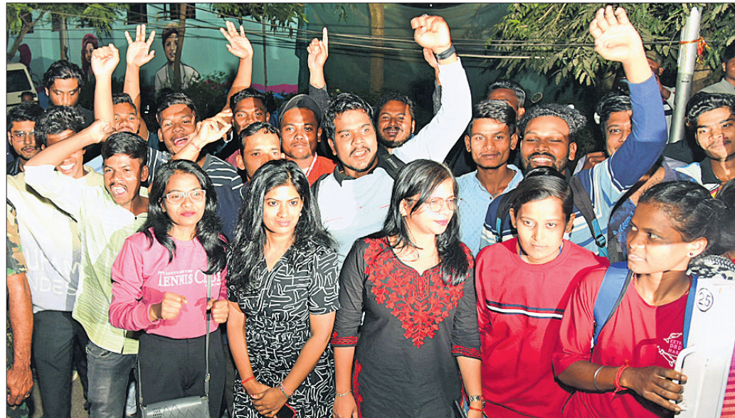
ନେ ଫେୟାର ହୋଟେଲ ବାହାରେ ଉପସ୍ଥିତ କ୍ରିକେଟପ୍ରେମୀ ।

କଟକର ବାରବାଟୀ ଷ୍ଟାଡ଼ିୟମରେ ଆସନ୍ତା ୯ ତାରିଖରେ ହେବ ଭାରତ-ଇଂଲଣ୍ଡ ଦିବାରାତ୍ର ଦିନିକିଆ ଅନ୍ତର୍ଜାତୀୟ କ୍ରିକେଟ ମ୍ୟାଚ । ତଳିତ ୩ ମ୍ୟାଚ ବିଶିଷ୍ଟ ସିରିଜର ଏହା ହେବ ଦ୍ୱିତୀୟ ଗ୍ରେମ୍ । ଗୁରୁବାର ନାଗପୁରରେ ପ୍ରଥମ ଦିନିକିଆ ଖେଳିବା ପରେ ଉଭୟ ଟିମ୍ ଇଣ୍ଡିଆ ଓ ଇଂଲଣ୍ଡ ଦଳ ଶୁକ୍ରବାର ଭୁବନେଶ୍ୱରରେ ପହଞ୍ଚିଛି । ପାରମ୍ପରିକ ବାଦ୍ୟ ଓ ନୃତ୍ୟ ମଧ୍ୟରେ ଉଭୟ ଦଳକୁ ସ୍ୱାଗତ କରାଯାଇଛି । ସନ୍ଧ୍ୟା ୭ଟା ୪୦ ମିନିଟରେ ଭାରତ ଓ ଇଂଲଣ୍ଡ ଦଳ ବିଜୁ ପଟ୍ଟନାୟକ ଅନ୍ତର୍ଜାତୀୟ ବିମାନ ବନ୍ଦରରେ ପହଞ୍ଚିବା ପରେ ଖେଳାଳି ଓ ସପୋର୍ଟର ଷ୍ଟାଫ୍ଟକୁ ୨ଟି ସ୍ୱତନ୍ତ୍ର ବସ୍ ଯୋଗେ କଡ଼ା ପୁରୁଣା ବନ୍ଦଳ ମଧ୍ୟରେ ନେ ଫେୟାର ହୋଟେଲକୁ ଅଣାଯାଇଛି । ଉଭୟ ଦଳର ଖେଳାଳି ବିମାନବନ୍ଦର ଭିତରୁ ବସ୍‌ଯୋଗେ ବାହାରକୁ ଆସିଥିଲେ । ତେବେ କ୍ରିକେଟ ପାଇଁ ପାଗଳ ପ୍ରାୟ ପ୍ରଶଂସକମାନେ ସମ୍ପର୍କରେ ସହ ଆୟୋଜନ ପାଇଁ ପାଇବା ପାଇଁ ବିମାନ ବନ୍ଦରଠାରୁ ଆରମ୍ଭ କରି ବିଭିନ୍ନ ଜକରେ ରାସ୍ତାର ଦୁଇପାର୍ଶ୍ୱ