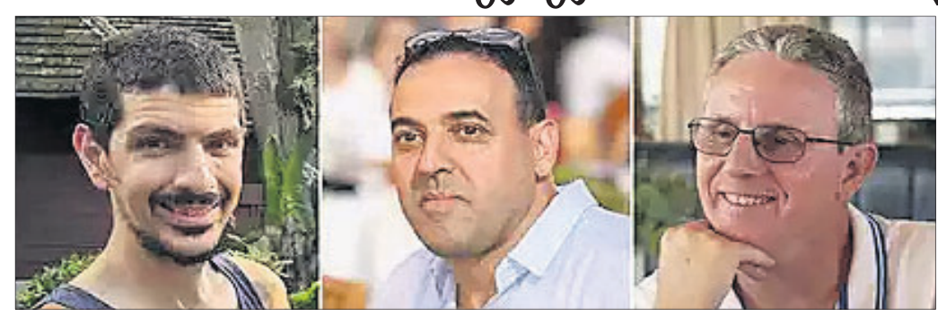
ହମାସ୍ ଆତଙ୍କବାଦୀଙ୍କ କବରକୁ ମୁକ୍ତ ହୋଇଥିବା ୩ ଉତ୍ସାଧକ ପଶବନ୍ୟା ।

ବନ୍ଦୀମାନଙ୍କୁ ମୁକ୍ତ କରିବ । ମୁକ୍ତ ହୋଇଥିବା ଉତ୍ସାଧକ ପଶବନ୍ୟାଙ୍କୁ ତାତ୍କାଳିକ ଭାବରେ ଶ୍ରଦ୍ଧା ଦେବା ନିମନ୍ତେ ସୁରକ୍ଷା ନିୟମାବଳୀର ଅନୁମତି ଦେବା ପାଇଁ ପୂର୍ଣ୍ଣ ପ୍ରସ୍ତାବ ଦେଇଛନ୍ତି ।