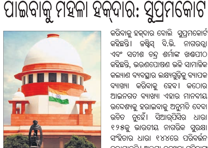
ନୂଆଦିଲ୍ଲୀ, ୮୨ (ସି.ଟି.)

ଜଣେ ମହିଳାଙ୍କ ପୂର୍ବ ବିବାହ ଆଇନତଃ କାର୍ଯ୍ୟ ରହିଥିଲେ ମଧ୍ୟ ସିଆର୍ପିସିବି ଧାରା ୧୨୫ ଅନୁଯାୟୀ ସେ ତାଙ୍କ ଦ୍ୱିତୀୟ ସ୍ୱାମୀଙ୍କଠାରୁ ଭରଣପୋଷଣ ଦାବି କରିବାକୁ ହକ୍‌ଦାର ବୋଲି ସୁପ୍ରିମକୋର୍ଟ କହିଛନ୍ତି ।