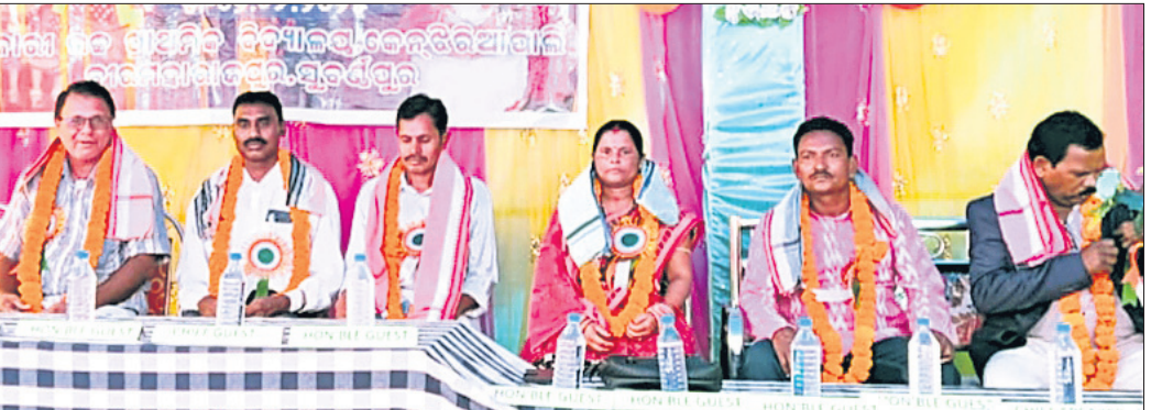
କେନଟ୍ରିଆପାଲି ସୁପି ସ୍କୁଲର ବାର୍ଷିକ ଉତ୍ସବରେ ମଞ୍ଚାଧୀନ ଅତିଥିମାନେ ।

ଦେଖିଥିଲେ । ବିଭାଗୀୟ ଶାଳକ୍ରମକୁ ପ୍ରସ୍ତୁତ କରିବା ପାଇଁ ଶିକ୍ଷକମାନଙ୍କ ପ୍ରାୟତଃ ଉତ୍ସାହ ଓ ସହଯୋଗ ଲାଭିଥିଲା । ଏହି ଉତ୍ସବରେ ଶିକ୍ଷକମାନଙ୍କର ଅବଦାନ ଉପରେ ଉଚ୍ଚ ମୂଲ୍ୟାଙ୍କନ କରାଯାଇଥିଲା ।