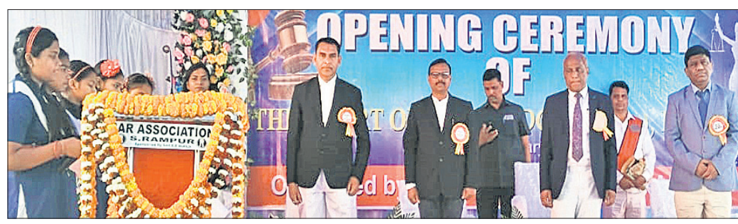
ରାମପୁରରେ ସିଦ୍ଧିଲ ସିନିୟର ଡିଭିଜନ କୋର୍ଟ ଉଦ୍ଘାଟନ ସମ୍ବନ୍ଧରେ ମଞ୍ଚାଧୀନ ଅତିଥି ।

କାର୍ତ୍ତବୀୟ ଫାଇନାଲ ମ୍ୟାଚ୍ ଡିଜେ କାଳିଆ ଓ ଏମ୍ଏମ୍ଏସି ସମ୍ବଳପୁର ମଧ୍ୟରେ ହୋଇଥିଲା । ଏମ୍ଏମ୍ଏସି ସମ୍ବଳପୁର ଟିମ୍ ବିଜୟୀ ହୋଇ ସେନିଫାଇନାଲରେ ଉପସ୍ଥିତ ଥିଲେ ।