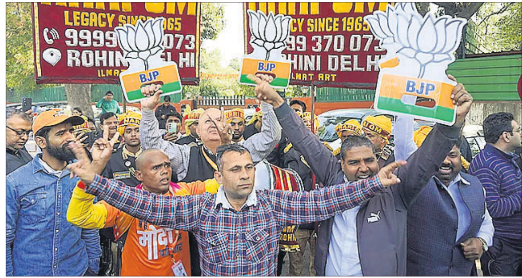
ଦିଲ୍ଲୀ ନିର୍ବାଚନରେ ଭାଜପା ବିଜୟ ପରେ ଦଳୀୟ କର୍ମୀମାନେ ଉତ୍ସବ ମନାଉଛନ୍ତି ।