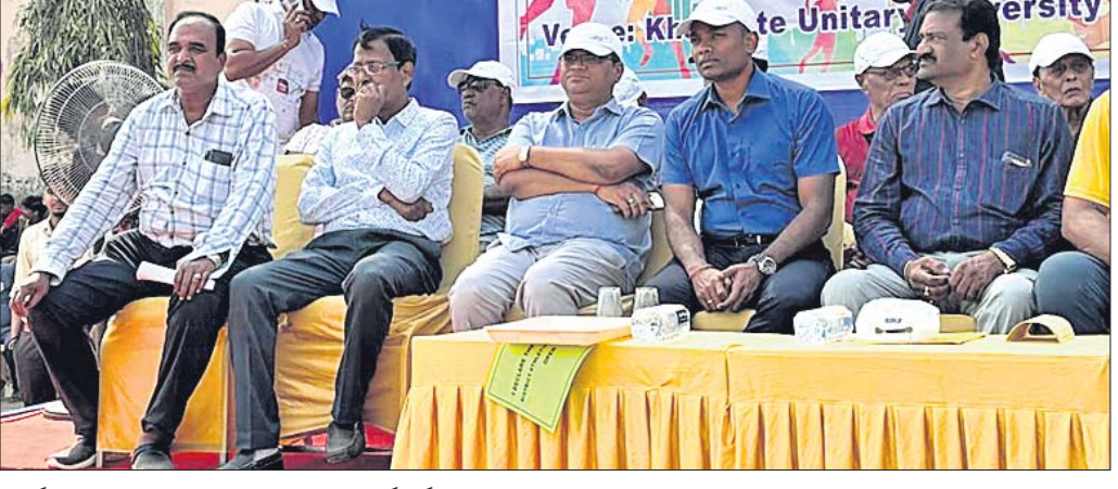
କାର୍ଯ୍ୟକ୍ରମରେ ଉପସ୍ଥିତ ଅତିଥି ଓ ସଂସଦର କର୍ମଚାରୀ ।