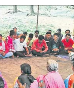
ବୈଠକରେ ଉପସ୍ଥିତ ଗ୍ରାମବାସୀ ।

ଦାରିଙ୍ଗବାଡ଼ି, ୮୨ (ଅରୁଣ ସାହୁ) ଦାରିଙ୍ଗବାଡ଼ି ବ୍ଲକ ଛାତ୍ରାପୁସ୍ତାଳୀ ଗ୍ରାମ ପଞ୍ଚାୟତର ବିଜାଳୀ ଗ୍ରାମରେ ଖଣି ସର୍ବତ୍ତ୍ୱ ନେଇ ଅନେକ ଆଶଙ୍କା ସୃଷ୍ଟି ହୋଇଛି । ଗ୍ରାମବାସୀଙ୍କୁ କୌଣସି ସୂଚନା ନ ଦେଇ ଗ୍ରାମରେ କିଛି ଅଜଣା ବ୍ୟକ୍ତି ପହଞ୍ଚି ନିକଟସ୍ଥ ଗାଁର କିଛି ଦିନ ମନୁରିଆଙ୍କୁ ଧରି ସର୍ବତ୍ତ୍ୱ ଚଳାଇବାକୁ ଲୋକମାନଙ୍କ ମଧ୍ୟରେ ଭୟ ଓ ଆତଙ୍କ ଖେଳିଯାଇଛି ।