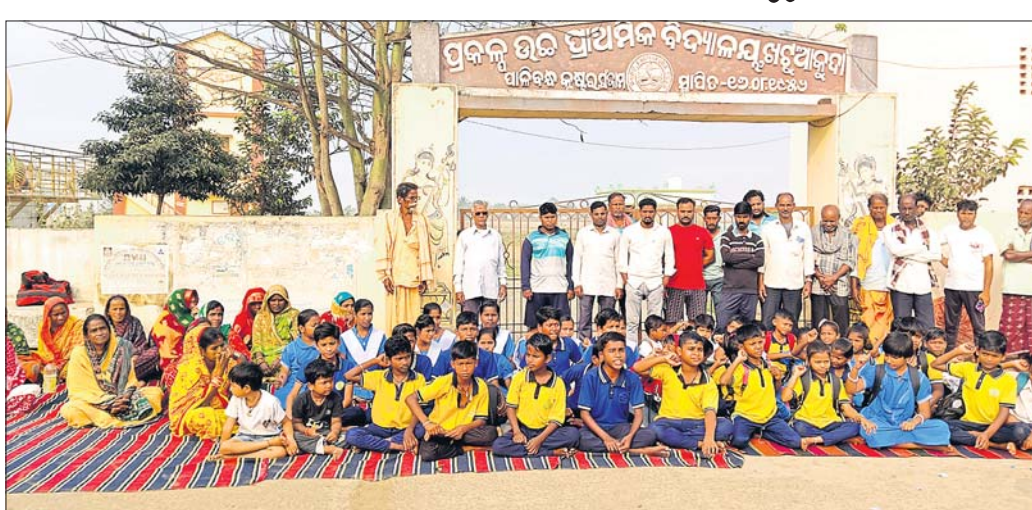
ଧାରଣରେ ଛାତ୍ରାଛାତ୍ରୀ ଓ ଅଭିଭାବକ ।