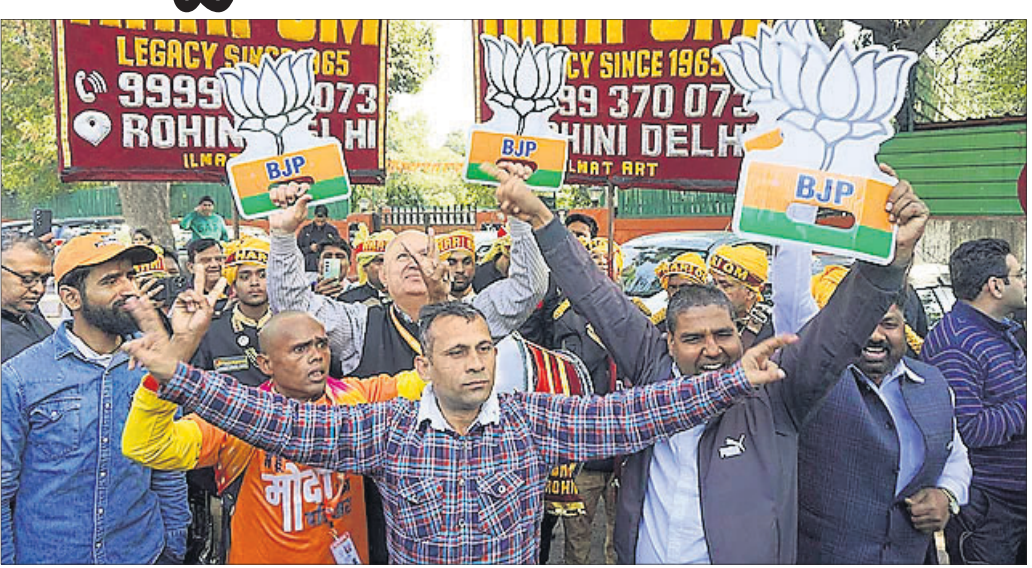
ଦିଲ୍ଲୀ ନିର୍ବାଚନରେ ଭାଜପାର ବିଜୟ ପରେ ଦଳୀୟ କର୍ମୀମାନେ ଭଣ୍ଡବ ମନାଉଛନ୍ତି।