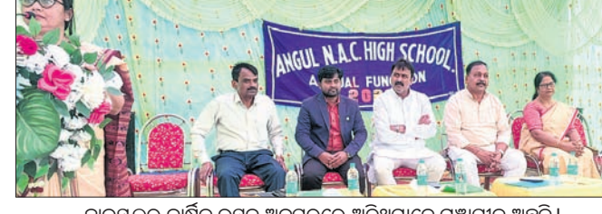
ହାଇସ୍କୁଲର ବାର୍ଷିକ ଉତ୍ସବ ଅବସରରେ ଅତିଥିମାନେ ମଞ୍ଚାସୀନ ଅଛନ୍ତି।