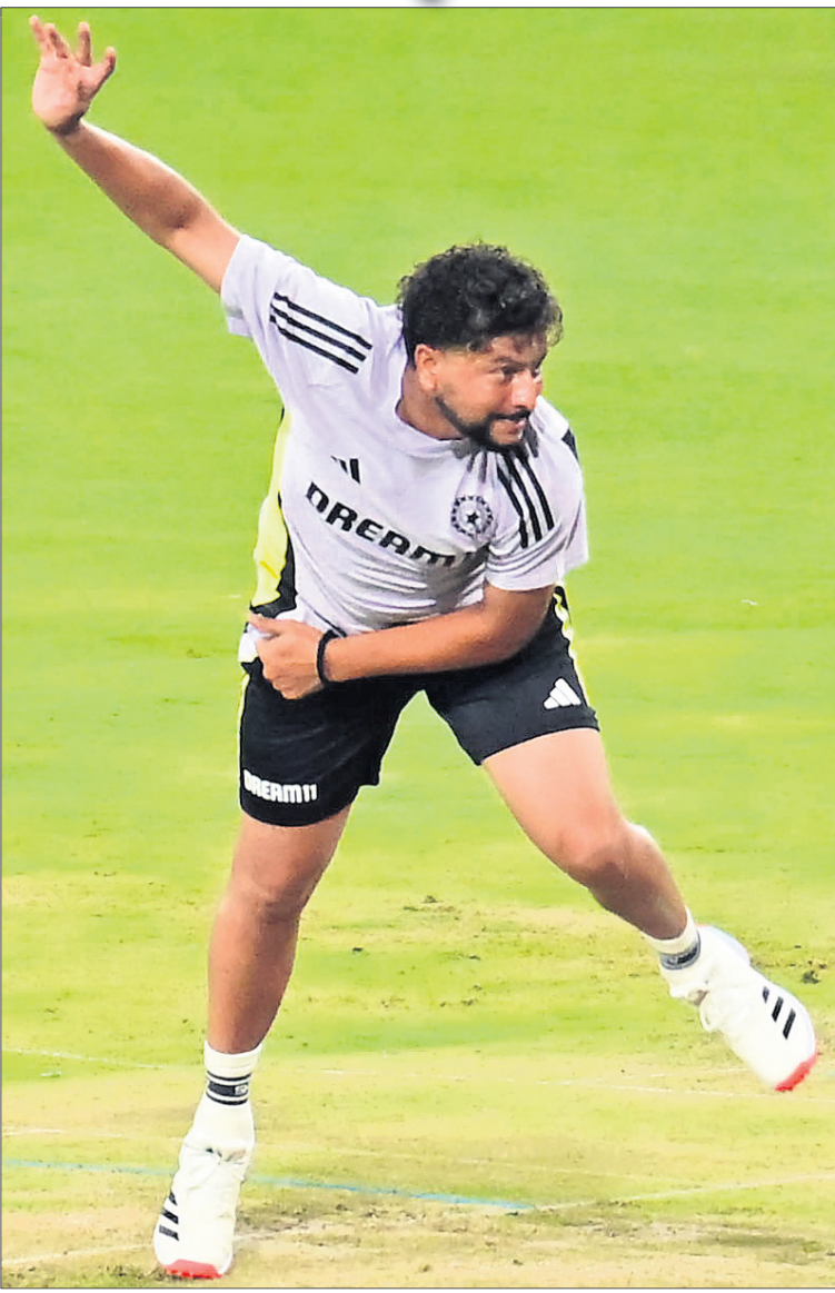
ଶନିବାର ବାରବାଟୀ ଷ୍ଟାଡ଼ିୟମରେ ଭାରତୀୟ ଦଳର ନେତୃ ସେସନରେ ରବୀନ୍ଦ୍ର ଜାଡେଜା ଓ କୁଲଦୀପ ଯାଦବ।