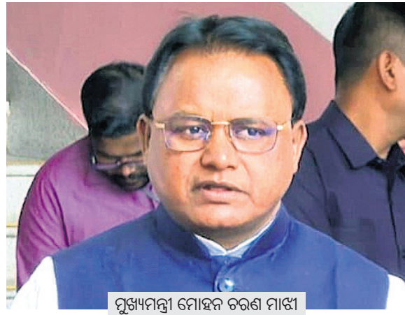
ମୁଖ୍ୟମନ୍ତ୍ରୀ ମୋହନ ଚରଣ ମାଝୀ

ସମସ୍ତଙ୍କ ପାଇଁ ପଙ୍କାଘର ନିର୍ମିତ କରିବା ରାଜ୍ୟ ସରକାରଙ୍କ ପ୍ରାଥମିକତା। ଏଥିପାଇଁ ପ୍ରଚଳିତ ଗୃହନିର୍ମାଣ ଯୋଜନାରେ ଉପକୃତ ହୋଇ ନ ଥିବା ହିତାଧିକାରୀଙ୍କୁ ଅନ୍ତେୟାଦୟ ଗୃହ ଯୋଜନାରେ ପଙ୍କାଘର ଯୋଗାଇ ଦିଆଯିବ। ଗୃହ ନିର୍ମାଣ ପାଇଁ ହିତାଧିକାରୀଙ୍କୁ ୧,୨୦,୦୦୦ ଟଙ୍କା ଲେଖାଏ ଆର୍ଥିକ ସହାୟତା ପ୍ରଦାନ କରାଯିବ। ଆଗାମୀ ୩ ବର୍ଷରେ ଏଭଳି ୨.୨୫ ଲକ୍ଷ ଘର ନିର୍ମାଣ କରାଯିବ। ଏଥିପାଇଁ ମୋଟ ୭,୫୫୦ କୋଟି ଟଙ୍କାର ବ୍ୟୟବୋଧକୁ କ୍ୟାବିନେଟ୍ ମଞ୍ଜୁରୀ ଦେଇଥିବା ନେଇ ଶନିବାର ମୁଖ୍ୟମନ୍ତ୍ରୀ ମୋହନ ଚରଣ ମାଝୀ ପୂର୍ବନା ଦେଇଛନ୍ତି। ଶୁକ୍ରବାର ଲୋକସଭାରେ ଭବନରେ ଅନୁଷ୍ଠିତ କ୍ୟାବିନେଟ୍ ବୈଠକରେ ୧୧ ପ୍ରସ୍ତାବକୁ ଅନୁମୋଦନ କରାଯାଇଛି। ତନ୍ମଧ୍ୟରେ ରହିଛି ରାଜ୍ୟର ସମସ୍ତ ୩୧୪ ବ୍ଲକ୍ରେ ଗୋଟିଏ ଲେଖାଏ ଷ୍ଟାଡ଼ିୟମ ନିର୍ମାଣ ଏବଂ ସରକାରୀ ଚାକିରିଆଙ୍କ ପାଇଁ ଯୁନିଫର୍ମ୍ସ୍ ପେନ୍ସନ ସ୍କିମ୍ ଭଳି ଗୁରୁତ୍ୱପୂର୍ଣ୍ଣ ଯୋଜନା। ଶିକ୍ଷା, ସ୍ୱାସ୍ଥ୍ୟ, କ୍ରୀଡ଼ା ଭିତ୍ତିକୃତ, ଗମନାଗମନ ଓ ସାମାଜିକ ସୁରକ୍ଷାକୁ ରାଜ୍ୟ ସରକାର ଗୁରୁତ୍ୱ ଦେଇ ଏସବୁ ନିଷ୍ପତ୍ତି ନେଇଥିବା ମୁଖ୍ୟମନ୍ତ୍ରୀ ପ୍ରକାଶ କରିଛନ୍ତି।