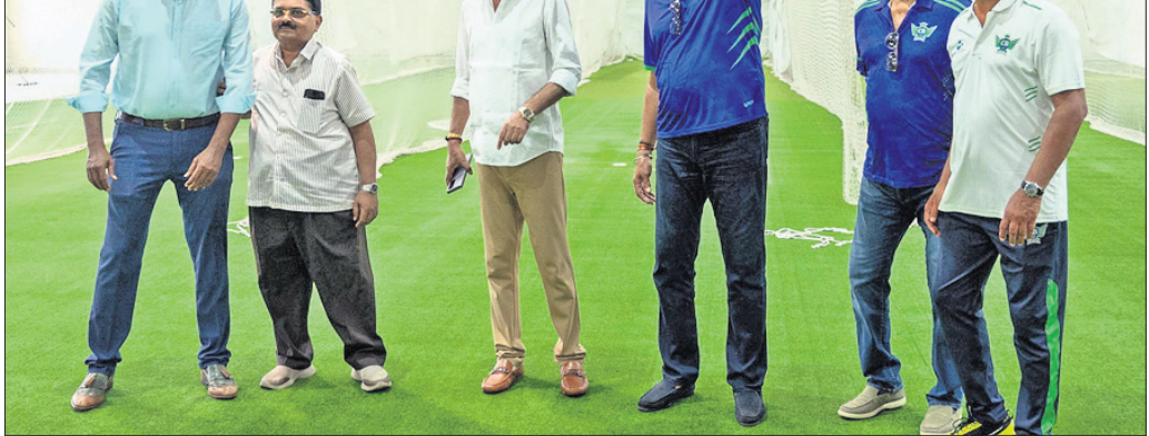
ଏମ୍‌ଜିଏମ୍ ଟି୨୦ ଉଦ୍‌ଘାଟନ ଅବସରରେ ଅତିଥି ଓ କର୍ମକର୍ତ୍ତା

୧୦୦ ମିଟରରେ ଅନିମେଶଙ୍କୁ ସ୍ୱର୍ଣ୍ଣ ଭୁବନେଶ୍ୱର, ୮୨ (ପି.ଟି.): ଓଡ଼ିଶାର ଉଦ୍ୟୋଗୀମାନଙ୍କୁ ଶୁଭେଚ୍ଛା ଅନିମେଶ ଉଦ୍‌ଘାଟନ କରିବା ପାଇଁ ଏକ ଉତ୍ସବ ଆୟୋଜନ କରାଯାଇଛି। ଏହି ଉତ୍ସବରେ ଅନିମେଶ ଉଦ୍‌ଘାଟନ କରିବା ପାଇଁ ଏକ ଉତ୍ସବ ଆୟୋଜନ କରାଯାଇଛି। ଏହି ଉତ୍ସବରେ ଅନିମେଶ ଉଦ୍‌ଘାଟନ କରିବା ପାଇଁ ଏକ ଉତ୍ସବ ଆୟୋଜନ କରାଯାଇଛି।