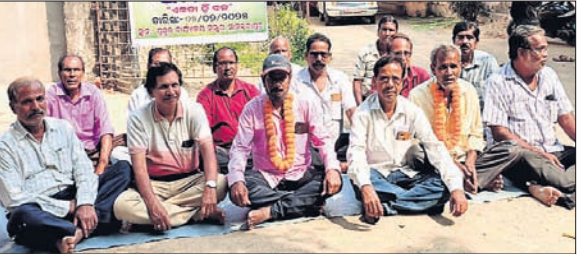
ଧାରଣାରେ ବସିଥିବା ଅବସରପ୍ରାପ୍ତ କର୍ମଚାରୀମାନେ ।