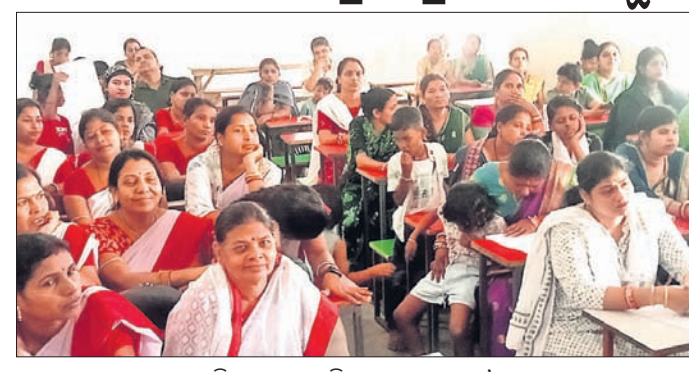
ମାତୃ ସମିଳନୀରେ ଉପସ୍ଥିତ ଛାତ୍ରାଛାତ୍ରୀଙ୍କ ମା’ମାନେ ।