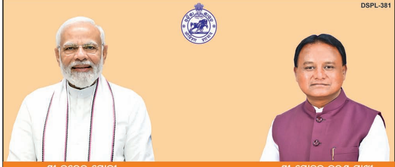
ଶ୍ରୀ ନରେନ୍ଦ୍ର ମୋଦୀ ପ୍ରଧାନମନ୍ତ୍ରୀ ଶ୍ରୀ ମୋହନ ଚରଣ ମାଝୀ ମୁଖ୍ୟମନ୍ତ୍ରୀ, ଓଡ଼ିଶା

ଇସ୍ତଫାପତ୍ର ପ୍ରଦାନ କରିଥିବା ଜଣାପଡ଼ିଛି। ତାଙ୍କ ସରକାର ବିରୋଧରେ କଂଗ୍ରେସ୍ ଅନାଗ୍ରା ପ୍ରସ୍ତାବ ଆଣିବା ସମ୍ଭାବନା ଥିବାବେଳେ ଦଳ ଭିତରେ ମଧ୍ୟ ତାଙ୍କ ନେତୃତ୍ୱକୁ ନେଇ ମତଭେଦ ବୃଦ୍ଧି ପାଇଥିଲା। ଏହାକୁ ପ୍ରଶ୍ନିତ କରିବା ପାଇଁ ବାରେନ୍ ଇସ୍ତଫା ଦେଇଥିବା କୁହାଯାଉଛି। ମଣିପୁରରେ କୁଳି ଏବଂ ମୈତେଇ ସମ୍ପ୍ରଦାୟ ମଧ୍ୟରେ ୨୦୨୩ ମେ'ରୁ ଜାତିଆଣ ହିନ୍ଦୀ ଉତ୍ତରୁପ ନେଇଥିଲା। ସରକାରୀ ତଥ୍ୟ ଅନୁଯାୟୀ, ଏହି ହିନ୍ଦୀରେ ୨୨୧ ଜଣଙ୍କ ମୃତ୍ୟୁ ଘଟିବା ସହ ୬୦,୦୦୦ରୁ ଊର୍ଦ୍ଧ୍ୱ ଲୋକ ଘରଘାର ହରାଇ ଅନାଥ ପଳାଇଥିଲେ। ୧ ହଜାରରୁ ଅଧିକ ଲୋକ ଆହତ ହୋଇଥିବାବେଳେ ୩୨ ଜଣ ଟ୍ରେପ୍‌ସ୍‌-୪ ମଣିପୁର ମୁଖ୍ୟମନ୍ତ୍ରୀ ବାରେନ୍ ସିଂ ରାଜ୍ୟପାଳ ଅଜୟ କୁମାର ଭାଲାଙ୍କୁ ଇସ୍ତଫାପତ୍ର ପ୍ରଦାନ କରୁଛନ୍ତି। ଇମ୍ପାଲ, ୯/୨ ସିଂ ନିଜ ପଦରୁ ଇସ୍ତଫା ଦେଇଛନ୍ତି। ରବିବାର ସନ୍ଧ୍ୟାରେ ସେ ଇମ୍ପାଲସ୍ଥିତ ରାଜଭବନରେ ପ୍ରାୟ ୨ ବର୍ଷ ପରେ ମୁଖ୍ୟମନ୍ତ୍ରୀ ଏନ୍. ବାରେନ୍