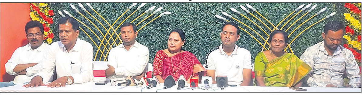
ଝରଦବାତା ସମ୍ମିଳନୀରେ ଯୋଗ ଦେଇଥିବା ବିଜେଡି ନେତାମାନେ।