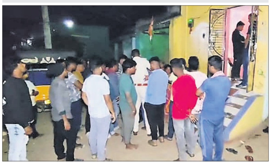
ଉଦ୍‌ବିଗ୍ନ ଲୋକଙ୍କୁ ବୁଝାଶୁଝା କରୁଛି ପୋଲିସ।