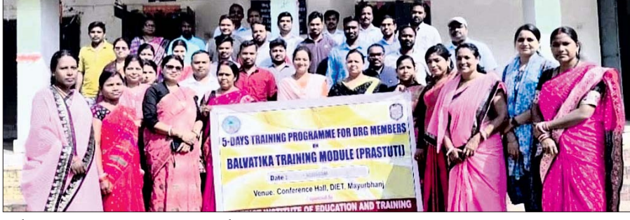
କର୍ମଶାଳାରେ ଯୋଗ ଦେଇଥିବା ସାଧନକର୍ମୀମାନେ।