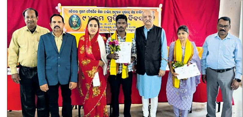
ପ୍ରତିଷ୍ଠା ଉତ୍ସବରେ ଉପସ୍ଥିତ ଅତିଥି।