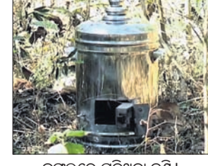
ଜଙ୍ଗଲରେ ପଡ଼ିଥିବା ହୁଣ୍ଡି