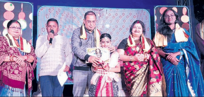
ମୁଖ୍ୟଅତିଥି ଜଣେ କୃତୀ ପ୍ରତିଯୋଗୀଙ୍କୁ ପୁରସ୍କୃତ କରୁଛନ୍ତି।