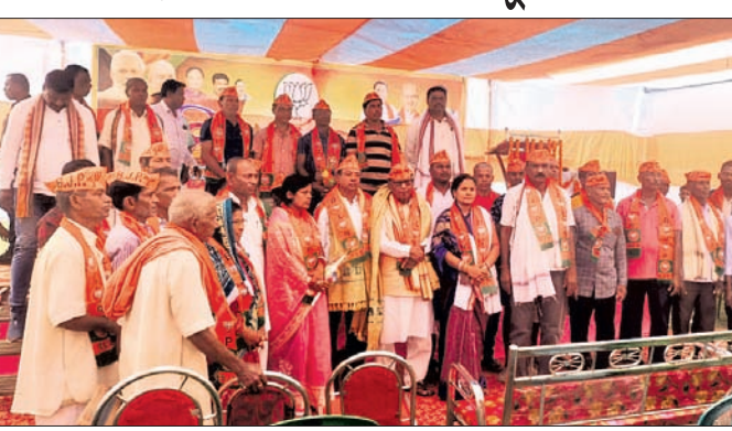
ଭାଜପାରେ ଯୋଗ ଦେଇଥିବା ବିଜେଡି ନେତା ଓ କର୍ମୀ।