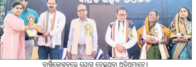
ବାର୍ଷିକୋତ୍ସବରେ ଯୋଗ ଦେଇଥିବା ଅତିଥିମାନେ।