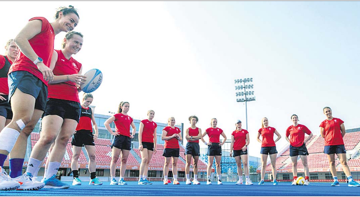
ଏଫଆଇଏଚ୍ ପ୍ରୋ ଲିଗ୍ ପାଇଁ ଯୋଗଦାନ କରିବା ପାଇଁ ଖୁବ୍ ଉତ୍ସାହୀ ଭାବରେ ଉପସ୍ଥାପିତ ହୋଇଛନ୍ତି ଖିଲି ଖେଳାଳିମାନେ।