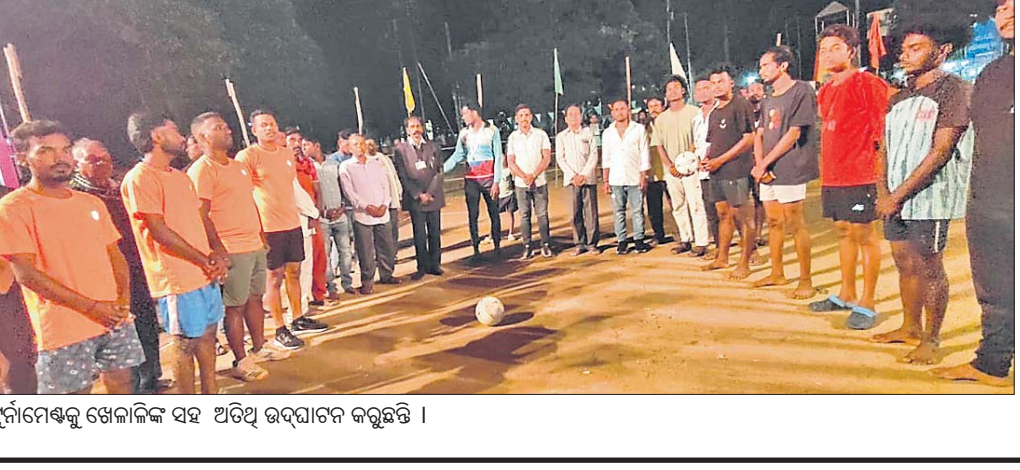
ଚୁନାମେଣ୍ଟକୁ ଖେଳାଳିଙ୍କ ସହ ଅତିଥି ଉଦ୍‌ଘାଟନ କରୁଛନ୍ତି।