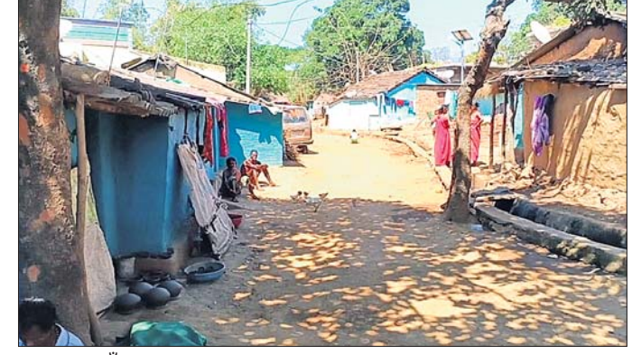
କୁମ୍ଭାରଗୁଡ଼ା ଗାଁର ଦୃଶ୍ୟ।

କୋରାପୁଟ ଜିଲ୍ଲା ସାମନାୟକସ୍ଥିତ ନବରକ୍ ନାଲକୋ ପ୍ରକଳ୍ପଠାରୁ ମାତ୍ର ୫କି.ମି. ଦୂର ଓ ସେମିଲିଗୁଡ଼ା ବ୍ଲକ୍ ଗୋରାକୁଳ ପଞ୍ଚାୟତ ଅଧୀନ କୁମ୍ଭାରଗୁଡ଼ା ଗ୍ରାମର ଅଧିକାଂଶ ପରିବାର କୁମ୍ଭାର ସମ୍ପ୍ରଦାୟର। ୪୫ରୁ ୬୫ ପରିବାରଙ୍କ ମଧ୍ୟରୁ ଏହି ସମ୍ପ୍ରଦାୟ ନିଜ କୌଳିକ ବୃତ୍ତି ଉପରେ ନିର୍ଭରକରି ରୋଜଗାର କରୁଥିବା ବେଳେ ଗ୍ରାମ ଅବହେଳିତ ରହିଥିବା ଗ୍ରାମବାସୀ କହିଛନ୍ତି। ଗ୍ରାମକୁ ପାନୀୟ ଜଳ ବ୍ୟବସ୍ଥା ନ ଥିବାରୁ ଏକମାତ୍ର ନଳକୂପ ଉପରେ ନିର୍ଭରଶୀଳ ଥିବା ଓ ଗାଁ ଲୋକେ ନଦୀର ପାଣି ପିଇୁଥିବା କହିଛନ୍ତି। ଭଲ ରାସ୍ତା ନ ଥିବାରୁ ଯାତାୟତରେ ସମସ୍ୟା ଦେଖାଦେଉଛି। ଭଙ୍ଗା ବଦରା ଘରେ ପୁଣ୍ୟ ରୁଣୁଥିବା ବେଳେ ଆବାସ ଯୋଜନାରୁ ବଞ୍ଚିତ ରହିଛନ୍ତି। ହାଣ୍ଡି ମାଠିଆ ତିଆରି କରିବା ସହ ନିଜ କୌଳିକ ବୃତ୍ତି ଉପରେ ନିର୍ଭର କରି ପରିବାର ପୋଷଣା କରୁଛନ୍ତି। ସରକାରଙ୍କ ପକ୍ଷରୁ