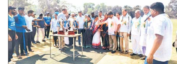
ଯୋଗଦାନ ଖେଳାଳିଙ୍କ ସହ ଭଦ୍ରକରେ ଅତିଥି ଓ କର୍ମକର୍ମୀ।