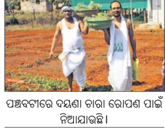
ପଞ୍ଚବଟାରେ ଦୟଣା ଚାରା ରୋପଣ ପାଇଁ ନିଆଯାଇଛି।

କୋରାପୁଟ, ୧୦୧୨ (ଅମିତାଜ ବେହେରା) ଶାବର ଶ୍ରୀକ୍ଷେତ୍ର ଓ ଶ୍ରୀକ୍ଷେତ୍ର ପୁରୀ ଜଗନ୍ନାଥଙ୍କ ପାଇଁ ଆବଶ୍ୟକ ଦୟଣା କୋରାପୁଟରୁ ଆଦାୟ କରାଯିବା ନେଇ ପ୍ରଥମଥର ପାଇଁ ଦୟଣା ଚାରା ସୋମବାର ଲଗାଯାଇଛି। ପୁରୀରୁ ଆସିଥିବା ଚୁକ୍ତସା ବାବା ଜଗନ୍ନାଥ ଶାସନଳ ମୁଖ୍ୟ ପୁରୋଧା ଭାବେ ପୂଜାର୍ଚ୍ଚନା କରି ଛୁମ୍ପି ପୂଜନ ପରେ ପୂର୍ବରୁ ଦୟଣା ଚଳିଥିଲା। ଏହି ଗଛ ୧୩୫ ୪୫ ଦିନରେ ହେବା ପରେ ତାହାକୁ କରାଯାଇ ଜଗନ୍ନାଥଙ୍କୁ ଲାଗି କରିବାକୁ ପୁରୀ ପଠାଯିବ। ଦୟଣା ଚାଷ ପାଇଁ ଏହି ଜମି ଉତ୍କଳ ଥିବାରୁ ପୂର୍ବରୁ ମାଟି ପରାଶା ପରେ ତଳି ପଡ଼ିଥିଲା। ପ୍ରଥମ ପର୍ଯ୍ୟାୟରେ ୨ ଏକର ଜମିରେ ଚାଷ କରାଯିବା ମଧ୍ୟ ପରିଚାଳନା କମିଟିର ପୂର୍ବଦିନ ସମ୍ପାଦକ ଡ. ଜଗନ୍ନାଥ ସାମଲ