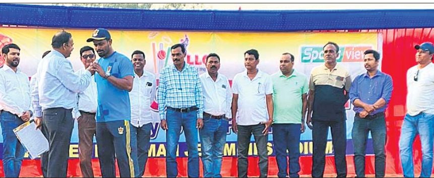
ସେମିରେ ଅତିଥି ଓ କର୍ମକର୍ମୀଙ୍କ ସହ ଧାମନଗରରେ ଅତିଥିମାନେ।