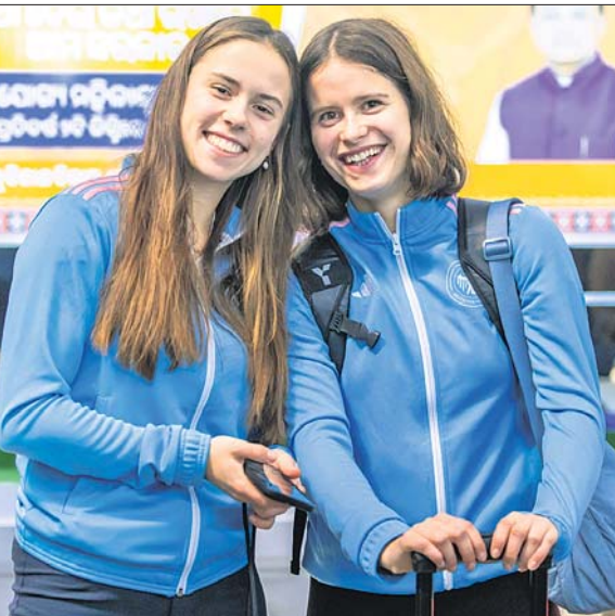
ଭୁବନେଶ୍ୱରରେ ପହଞ୍ଚିବାପରେ ଜର୍ମାନୀ ମହିଳା ଓ ସ୍ୱେଡିଶ ଦଳର ଖେଳାଳି।

ଦଳର ଅଭ୍ୟାସ କରିବ। ଏହି ଦଳ ଖେଳିବ। ପ୍ରତ୍ୟେକ ଦଳ ପରସ୍ପରକୁ ଯୁଦ୍ଧ କରିବେ। ୧୫ ତାରିଖରେ ଭାରତୀୟ ମହିଳା ଦଳ ଇଂଲଣ୍ଡ